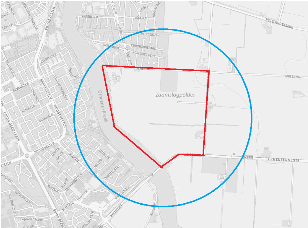
Figuur 1. Plangebied (blauw) en studiegebied (rood).

Het plangebied is weergegeven in figuur 1. Het plangebied is het gebied waar de werkzaamheden zullen plaatsvinden (blauw aangegeven). Het studiegebied is wat ruimer genomen (rood) omdat sommige soorten een groter leefgebied hebben.