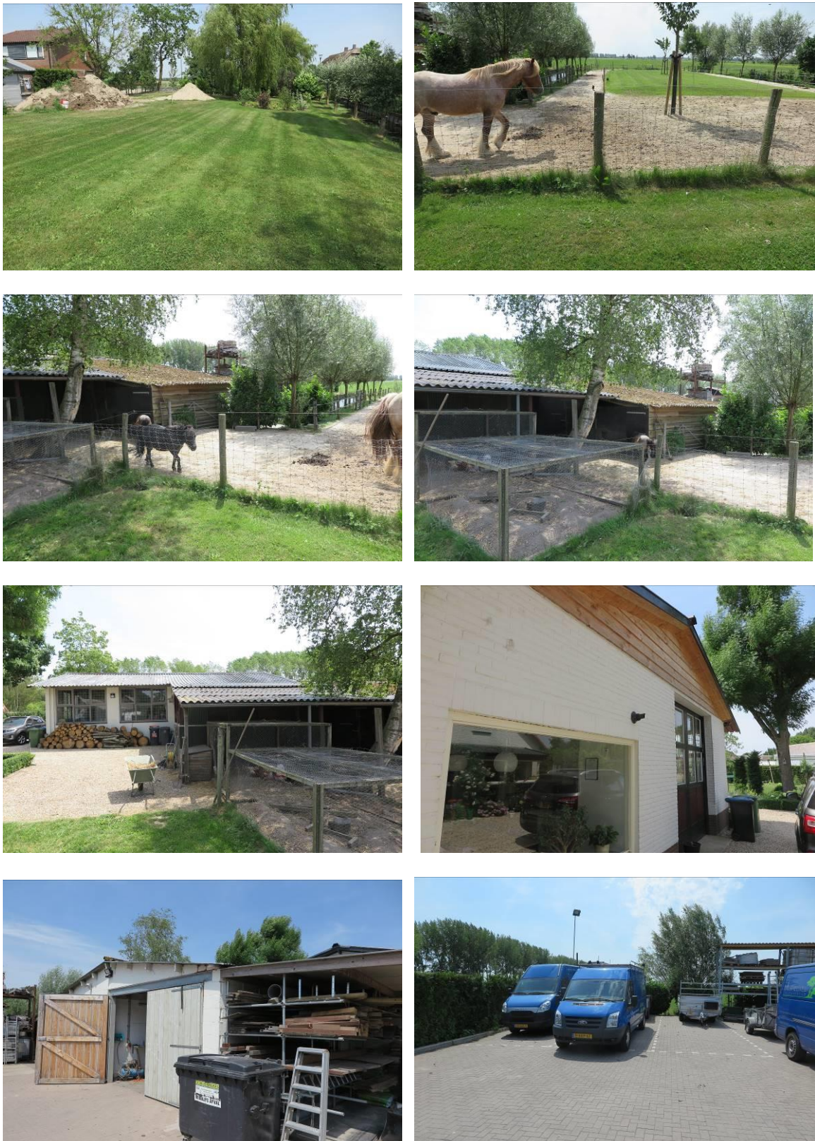
Figuur 2. Foto-impressie van het plangebied Hei- en Boeicopseweg 113 te Zederik (woning; bovenste drie foto's) en tijdelijke woonunit (onder).