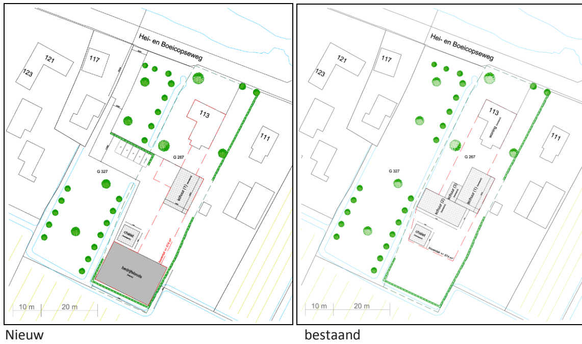
Figuur 3. Impressie van het plan Hei- en Boeicopseweg 113 te Zederik.