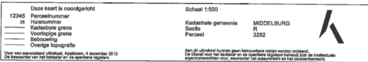
Kadastrale kaart met intekening van nog door Kadaster in te meten perceel