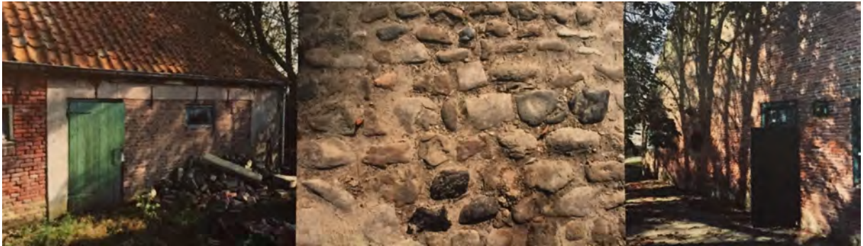
Foto's bestaande situatie