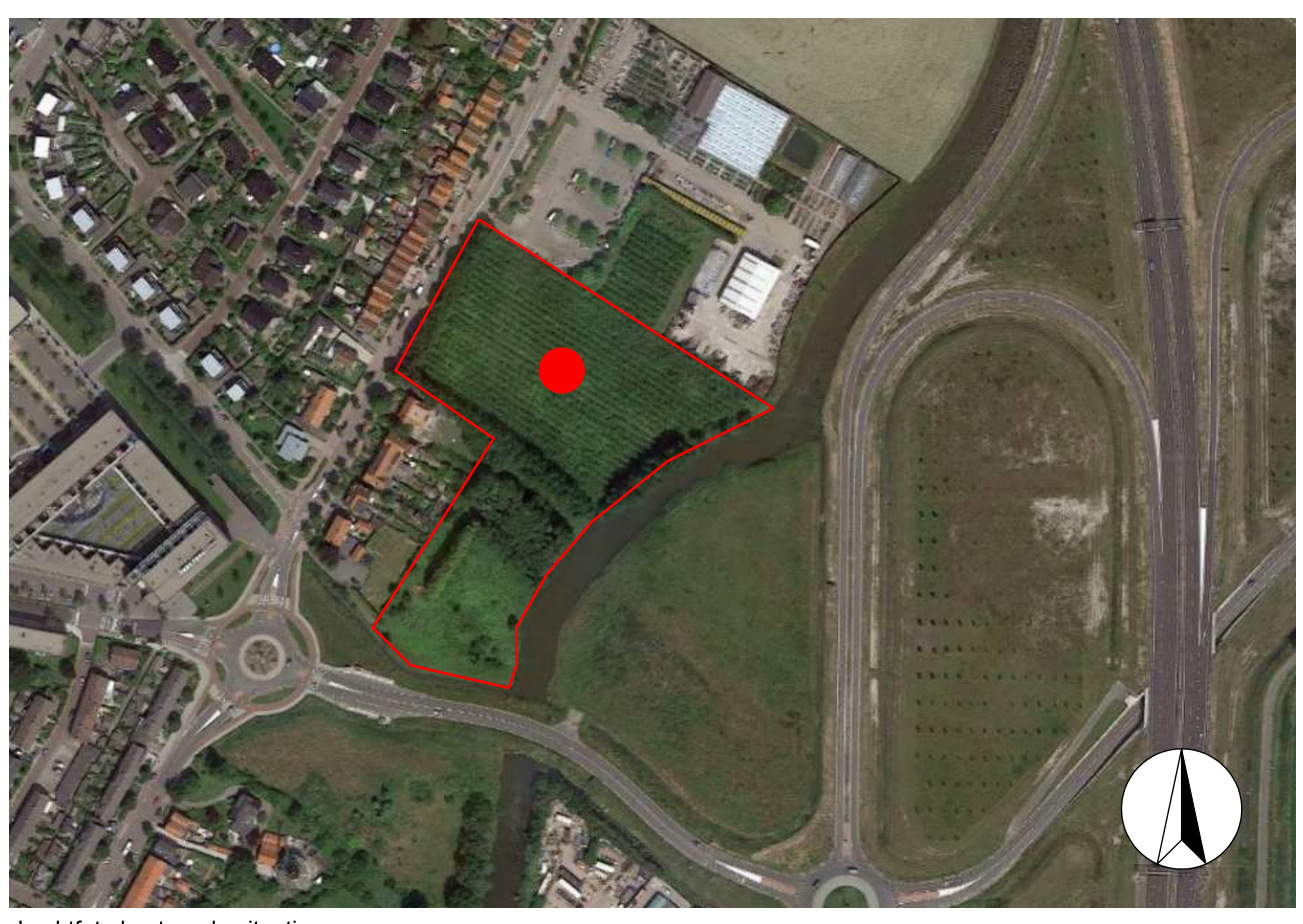
Luchtfoto bestaande situatie