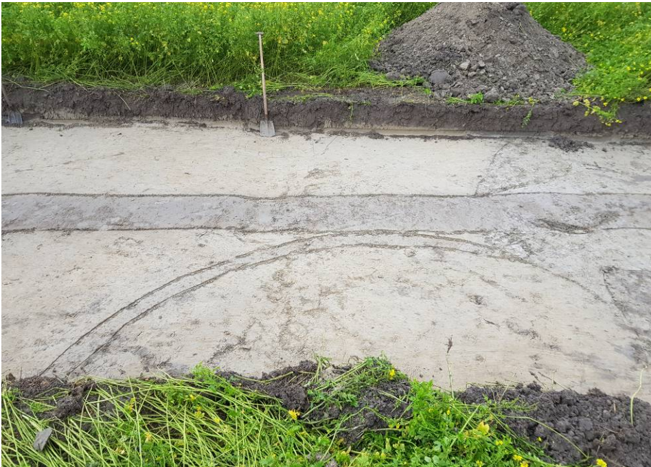
Sporen van een mogelijke middeleeuwse hooimijt in werkput 1

WP 2 & 3: Afwijkend op het PvE is werkput 2 in twee delen gesplitst. Reden hiervoor is het nagenoeg ontbreken van archeologische sporen waardoor verder aanleggen weinig zin had. Er is gekozen om werkput 2 in te korten, een zone van ca 20m over te slaan en een derde werkput aan te leggen. Het patroon van parallelle ploegsporen en drains oostwest door de putten blijft ook hier gehandhaafd. Op enkele vage paalspoortjes na zijn geen waardevolle sporen vastgesteld. De bodemopbouw is ook zeer eenduidig met recente bouwvoor op kreekgrond.