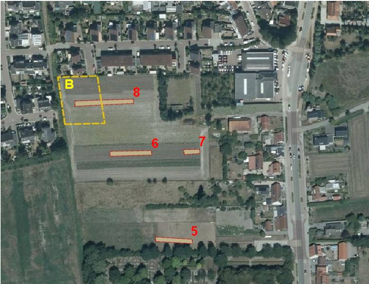
Vindplaats B aan de Noordweg / Van Serooskerkelaan met rood aangegeven de werkputten