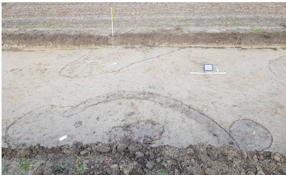
Middeleeuwse sporen in werkput 8

WP 8: het hele oostelijke deel, meer naar het centrum van de kreekrug, is leeg. In de laatste, meest westelijke, twintig meter werden wel oudere sporen aangetroffen. Het aardewerk lijkt een beetje vroeg roodbakkend en proto steengoed. Het gaat om enkele grote onregelmatige kuilen en enkele kleinere kuilen. Het meest kenmerkende inspoort is een halfronde greppel die sterk doet denken aan middeleeuwse hooimijten. Aan de westzijde duikt de kreek sterk. Hier is ook een kleiiger opvulpakket aangetroffen en een recentere sloot. De cluster antropogene sporen concentreert zich in een strook van om en bij de 15/20 meter op de westflank van de brede kreekrug.