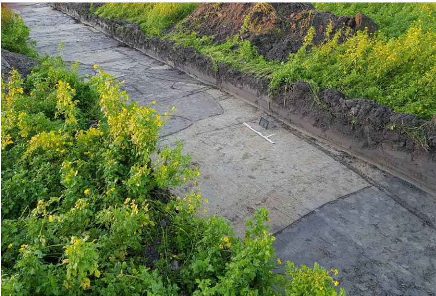
Middeleeuwse sporen in werkput 4

WP 4: In werkput 4 werden enkele sporen gericht gecoupeerd. In de coupe van sloot S53 werd naast dierlijk botmateriaal ook aardewerk, waaronder ook paffrath, maaslands en vroeg roodbakend gevonden, ruim een kilo in totaal. Het materiaal lijkt te wijzen op een datering rond de 13e eeuw. Het profiel vertoonde eenzelfde beeld als wat we kennen van sloten bij de opgraving Hazenburg Arnhem en De Kempnaerstraat Paauwenburg: een brede komvormige slootvulling tot ca. een meter diep en daaronder een strakke insteek van een rechte ingraving. Samen met de sporen aangetroffen in het zuidelijk deel van werkput 1 is het duidelijk dat er zich in deze zone een bewoningscluster uit de 13 e /14 e eeuw bevindt.