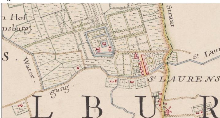
Figuur 3 kaart gebroeders Hattinga uit ca. 1750

Voor gebieden gelegen binnen een straal van 50 meter rondom bekende vindplaatsen (zie blauw gearceerde cirkel op afbeelding uit 2008) gelden aparte vrijstellingsmaten. Ten tijde van dit nieuwe bestemmingsplan zijn geen vindplaatsen binnen de grenzen van het plangebied Sint Laurens bekend. Wel zijn tegen de westzijde van de kom Sint Laurens twee vindplaats bekend en met een blauw gearceerde cirkel aangeduid. Van de cirkels reikt een klein deel tot binnen de komgrens.