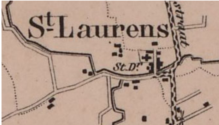
Figuur 1 Walcheren in 1852

Wel zijn de resten te verwachten van een gebouw uit het eind van de 18 e of eerste helft van de 19 e eeuw. Deze periode vormt geen onderdeel van de vier hoofdthema's die in het archeologiebeleid zijn geformuleerd.