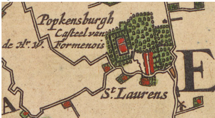
Figuur 2 historische kaart van Visscher en Roman uit ca. 1650