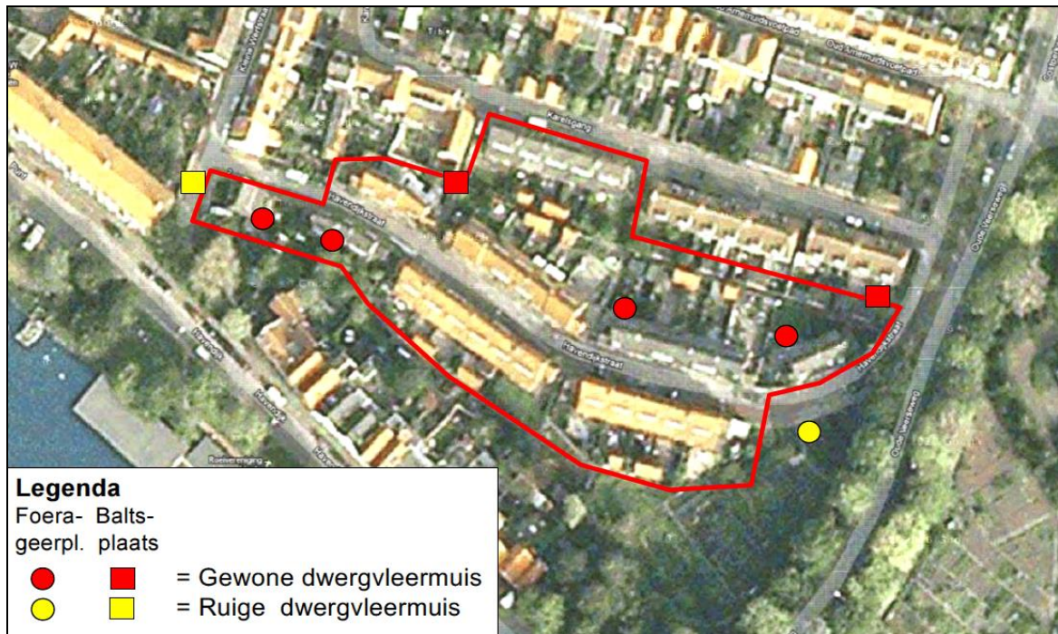
Figuur 4. Waarnemingen van vleermuizen in de voorherfst ter plaatse van en direct rond de Havendijkstraat te Middelburg (kader).