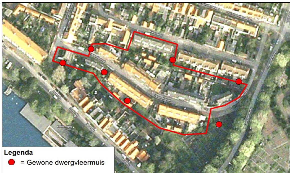
Figuur 3. Foerageerplaatsen van vleermuizen in het voorjaar ter plaatse van en direct rond het de Havendijkstraat te Middelburg (kader).

Er is één soort vleermuis vastgesteld in de voorzomer. Het betreft de gewone dwergvleermuis. De soort werd in relatief lage dichtheid foeragerend aangetroffen. Er zijn geen aanwijzingen gevonden van het voorkomen van kolonies of vliegroutes. In figuur 3 worden de foerageerplaatsen weergegeven.