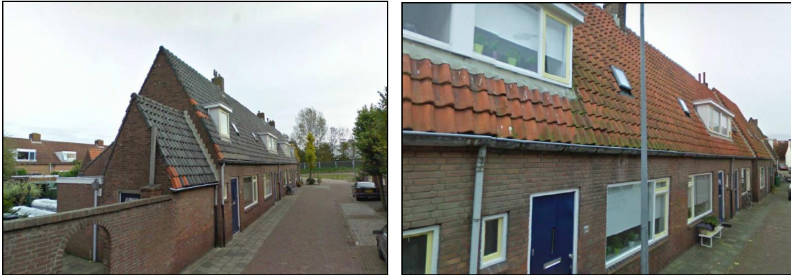
Figuur 2. Foto-impressie van de te slopen woningen aan de Havendijkstraat te Middelburg.