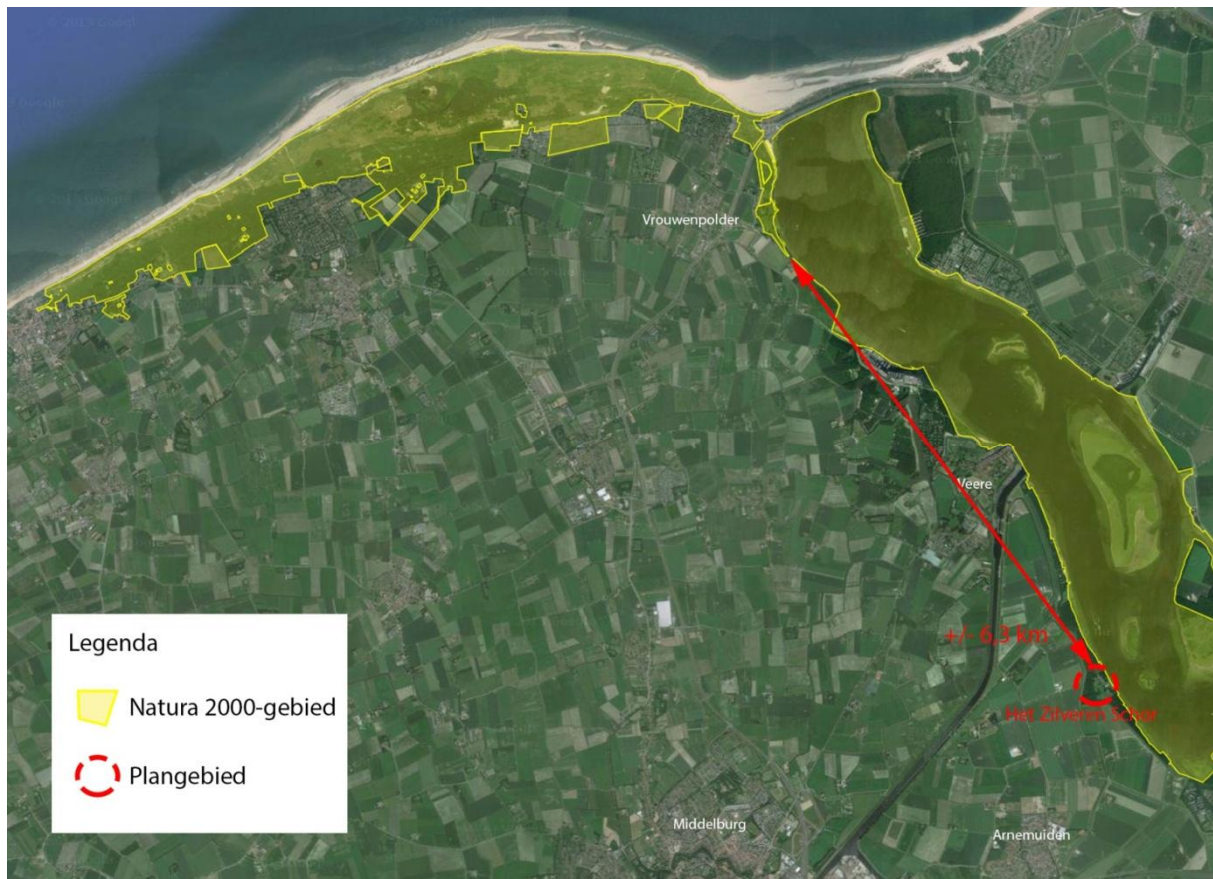
Afbeelding 2: Natura2000-gebieden nabij het plangebied