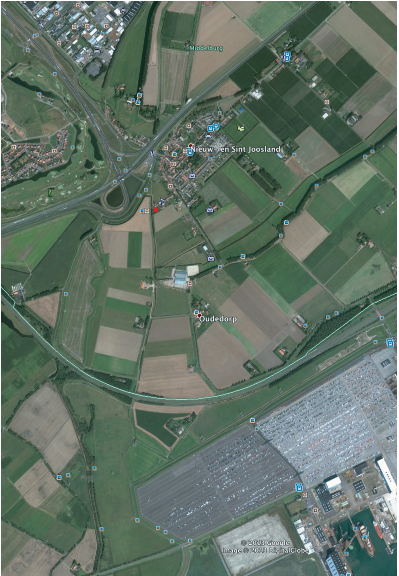
● Theater De Wegwijzer