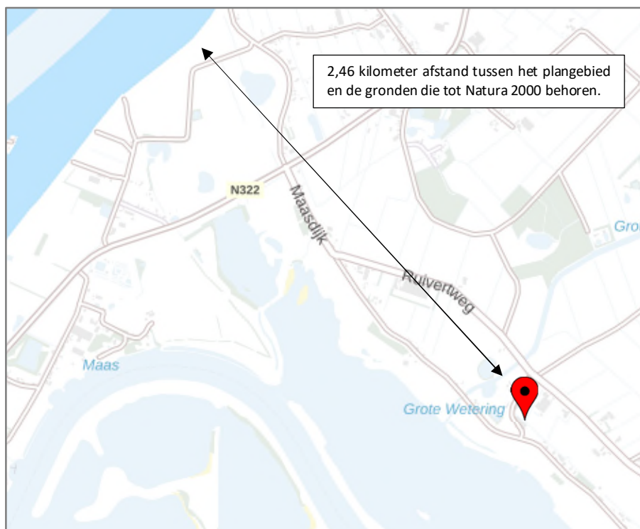
Figuur 4.2: Ligging plangebied t.o.v. Natura 2000-gebied.