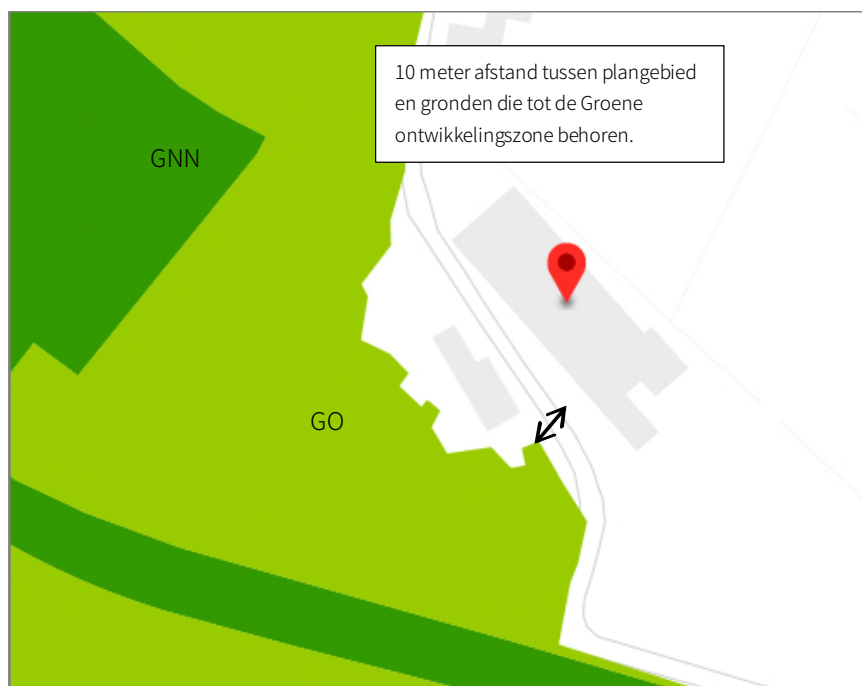
Figuur 4.1: Ligging plangebied t.o.v. Gelders Natuurnetwerk (GNN) en Groene ontwikkelingszone (GO).