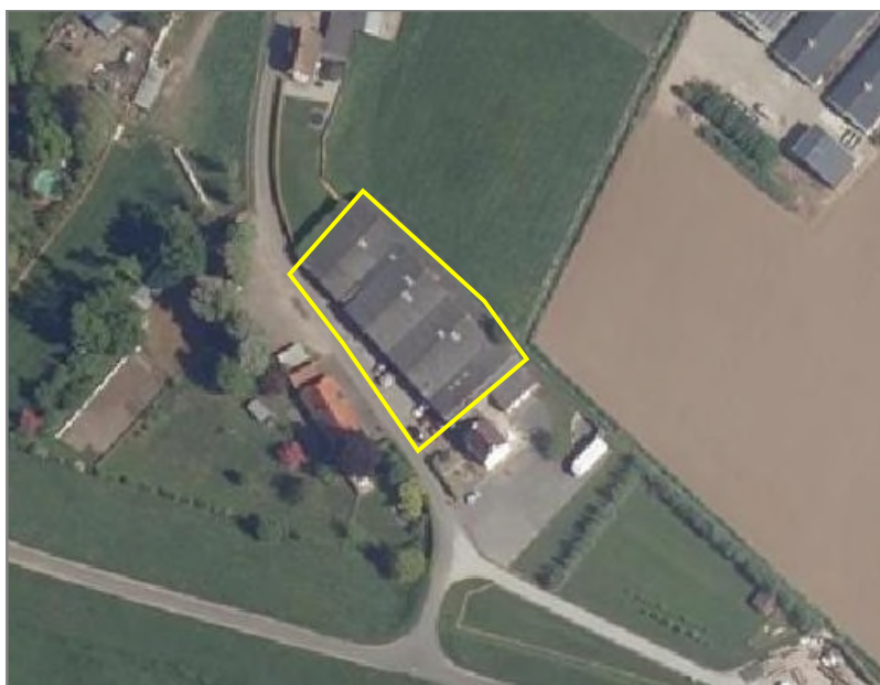
Figuur 2.2: Begrenzing van het plangebied.