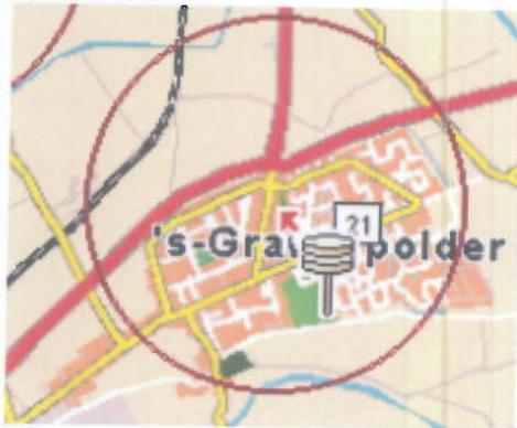
Figuur 2: sirenedekking 's-Gravenpolder

Het sirenestelsel blijkt niet geheel dekkend te zijn voor 's-Gravenpolder. Dit kan tot gevolg hebben dat bij een calamiteit de waarschuwing van personen in het gebied middels een sirene niet volledig is.