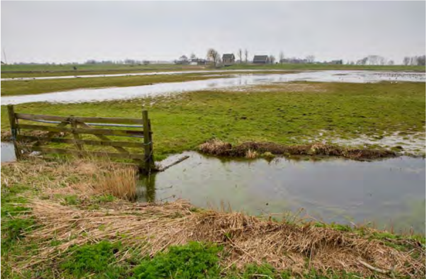
Referentiebeeld Landje van Geijssel