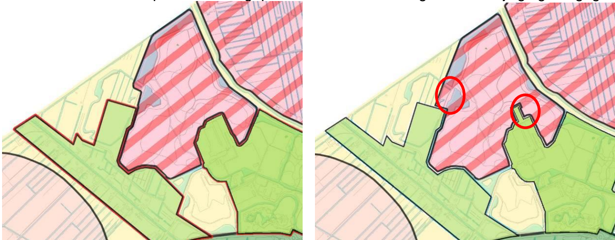
Oude (links) en nieuwe (rechts) begrenzing natuurkern Buytenpark in de Groenkaart

De herbegrenzing van het natuurkerngebied, zoals hiervoor is beschreven onder compensatieplan, hangt samen met de Groenkaart. In de huidige versie van de Groenkaart is over het Buytenpark de volgende passage opgenomen: "Conform het raadsbesluit van 14 december 2009 is uitbreiding van SnowWorld in het Buytenpark mogelijk, onder voorbehoud van (onder andere) natuurcompensatie. De natuurkern Buytenpark wordt hiervoor te zijner tijd herbegrensd." In het compensatieplan is deze herbegrenzing opgenomen. De kaart van de Groenkaart moet hierop worden aangepast. In onderstaande figuur is de wijziging aangegeven.