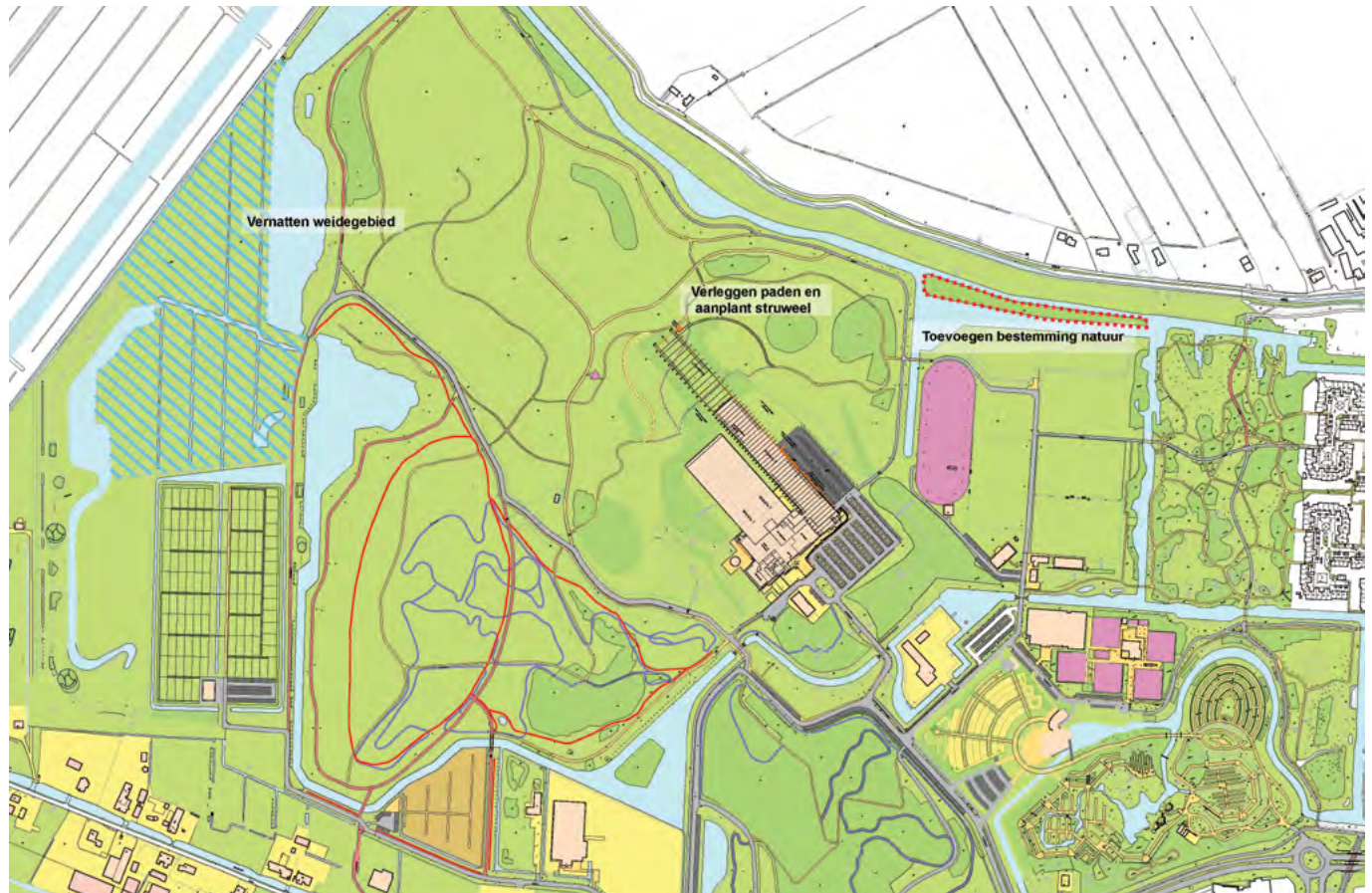
Compensatieplan SnowWorld Buytenpark