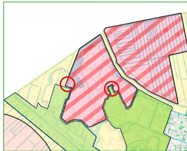
Nieuwe begrenzing natuurkern Buytenpark in de Groenkaart