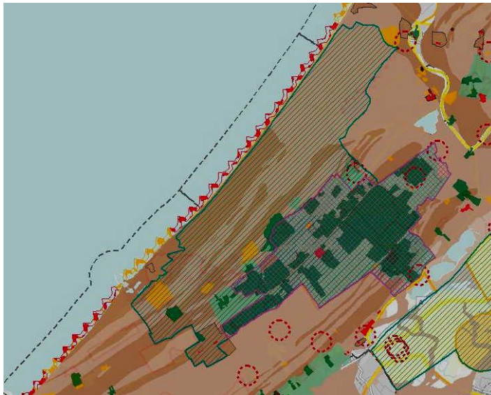
Afbeelding : fragment uit Cultuurhistorische atlas provincie Zuid-Holland

Binnen de provincie ligt hierbij het accent op die gebieden en structuren waar cultuurhistorische waarden in hoge mate voorkomen. Dit betreft de zogeheten topgebieden en kroonjuwelen cultureel erfgoed. Kroonjuwelen cultureel erfgoed zijn op de kwaliteitskaart opgenomen als 'identiteits-dragers'. Deels binnen, maar gedeeltelijk ook buiten de topgebieden bevinden zich waarden of structuren die specifieke bescherming behoeven. Dit betreft archeologische waarden, landgoederen, molenbiotopen en de waterlinies.