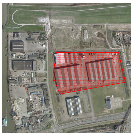
Figuur 1: ligging plangebied "Het Land"

Door middel van deze natuurtoets wordt bepaald welke beschermde flora- en faunasoorten in het plangebied aanwezig zijn en of de herinrichting van het plangebied betekent dat verbodsbepalingen overtreden worden en derhalve een ontheffing of vergunning aangevraagd moet worden of dat er een compensatieplan moet worden opgesteld.