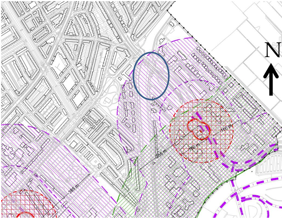
Figuur 1. Signaleringskaart van 2013 ingezoomd op de Hoornbrug

tankstation stopt (paarse stippellijn). Het ingetekende invloedsgebied (paars gearceerd) van de route is 325 meter vanaf de as van de weg. Op de signaleringskaart ligt de Hoornbrug binnen het invloedsgebied van de route gevaarlijke stoffen.