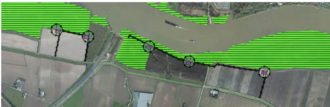
Afbeelding 1 - Ligging plangebied bestemmingsplan Windpark Oude Maas ten opzichte van NNN (groene arcering)