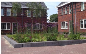
Plantvakken ingericht met vaste planten