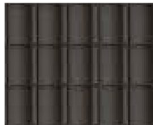
Materiaal en kleurgebruik passend bij omgeving