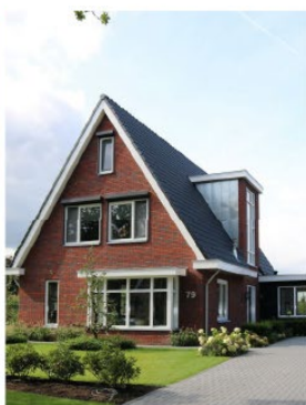
Heldere eenvoudige bouwmassa's