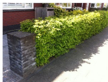
Lage haag aan de voorzijde