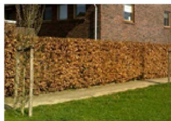
Hoge haag als zijdelingse perceelsgrens