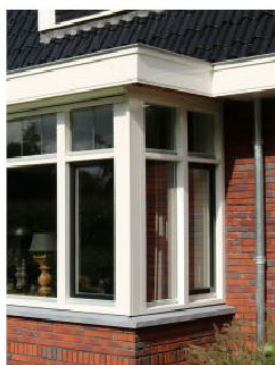
Detaillering passend bij hoofdgebouw