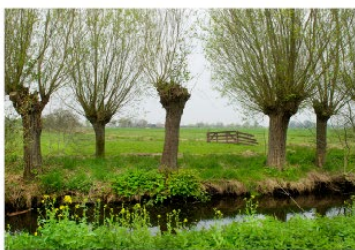
Knotwilgen langs waterrand