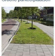
Groenvakken en bomen