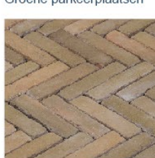
Gebakken klinkers als bestrating