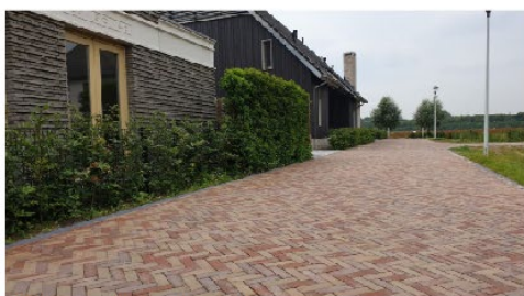
Rustige en neutrale inrichting