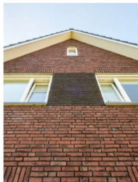
Materialen degelijk en terughoudend