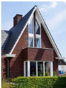
Eén bouwlaag met kap met veel doorzicht