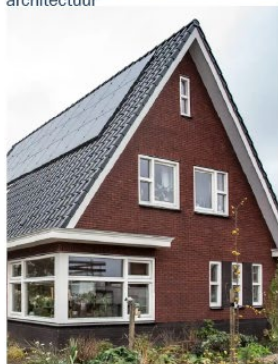
Gevelindeling is rustig en eenvoudig