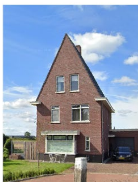
Moderne en eigentijdse (bakstenen) architectuur