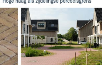
Rustige en neutrale inrichting