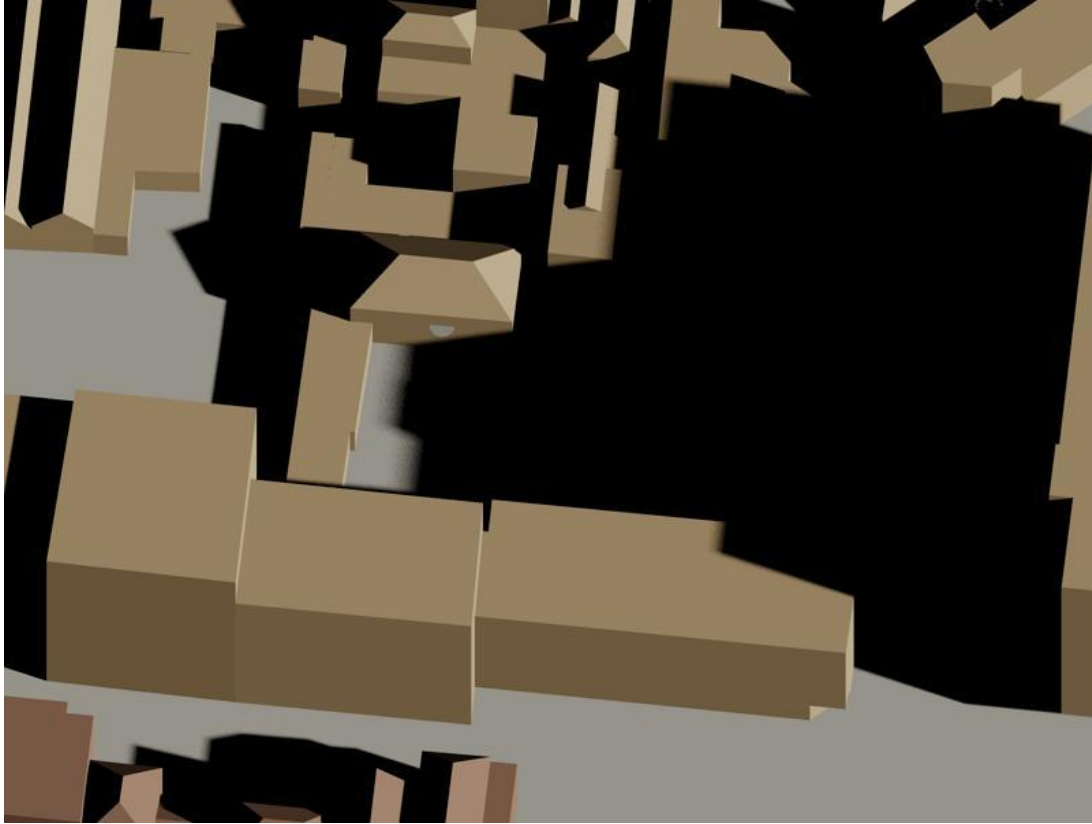
19 februari 11.30 uur bestaand