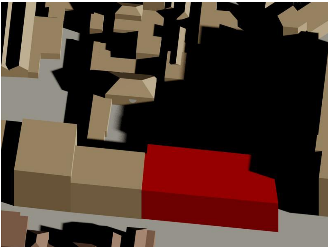
19 februari 11.30 uur gepland