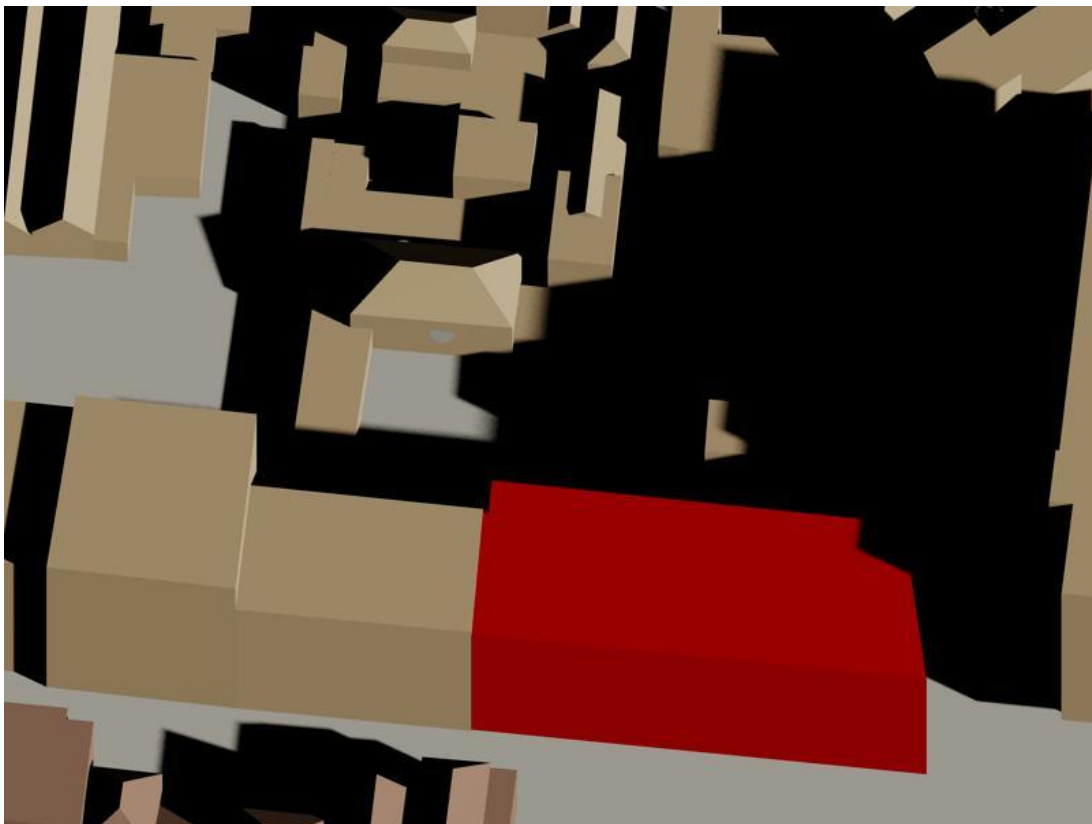
19 februari 12.00 uur gepland