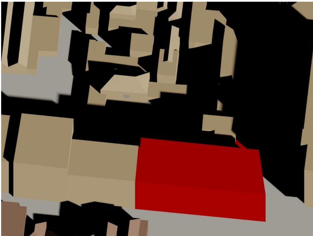
19 februari 13.00 uur gepland