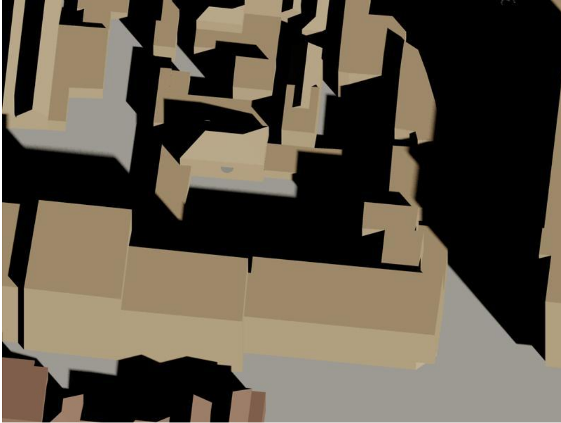
19 februari 13.30 uur bestaand