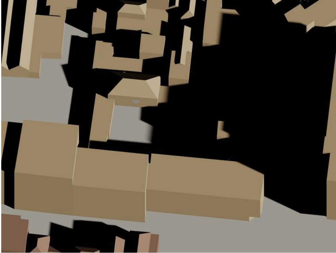
19 februari 12.00 uur bestand