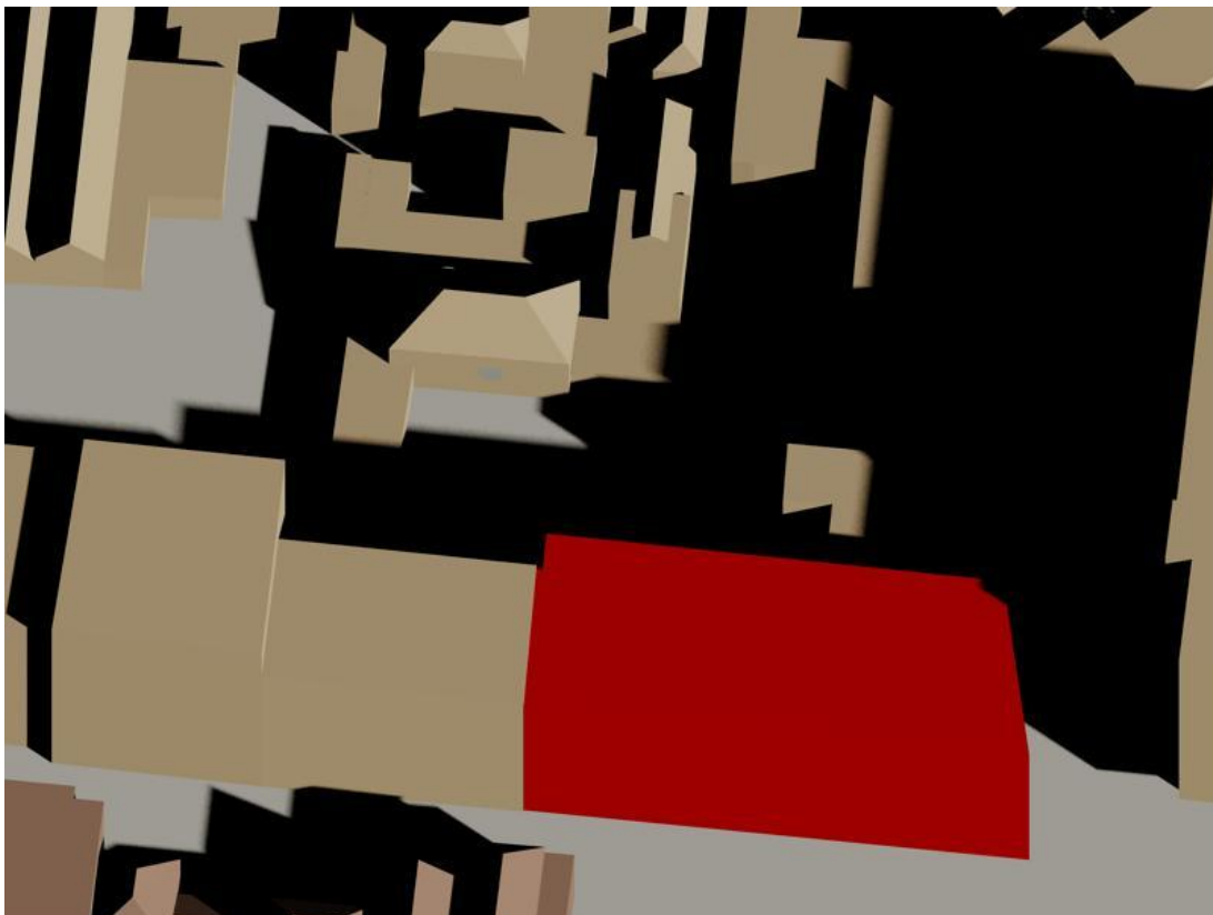
19 februari 12.30 uur gepland