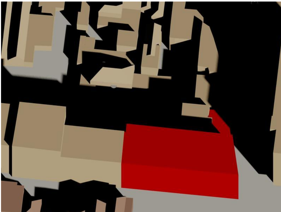
19 februari 13.30 uur gepland