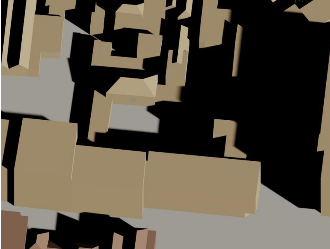
19 februari 12.30 uur bestand