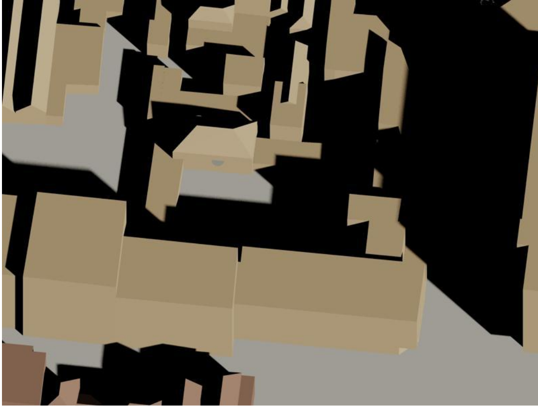
19 februari 13.00 uur bestaand