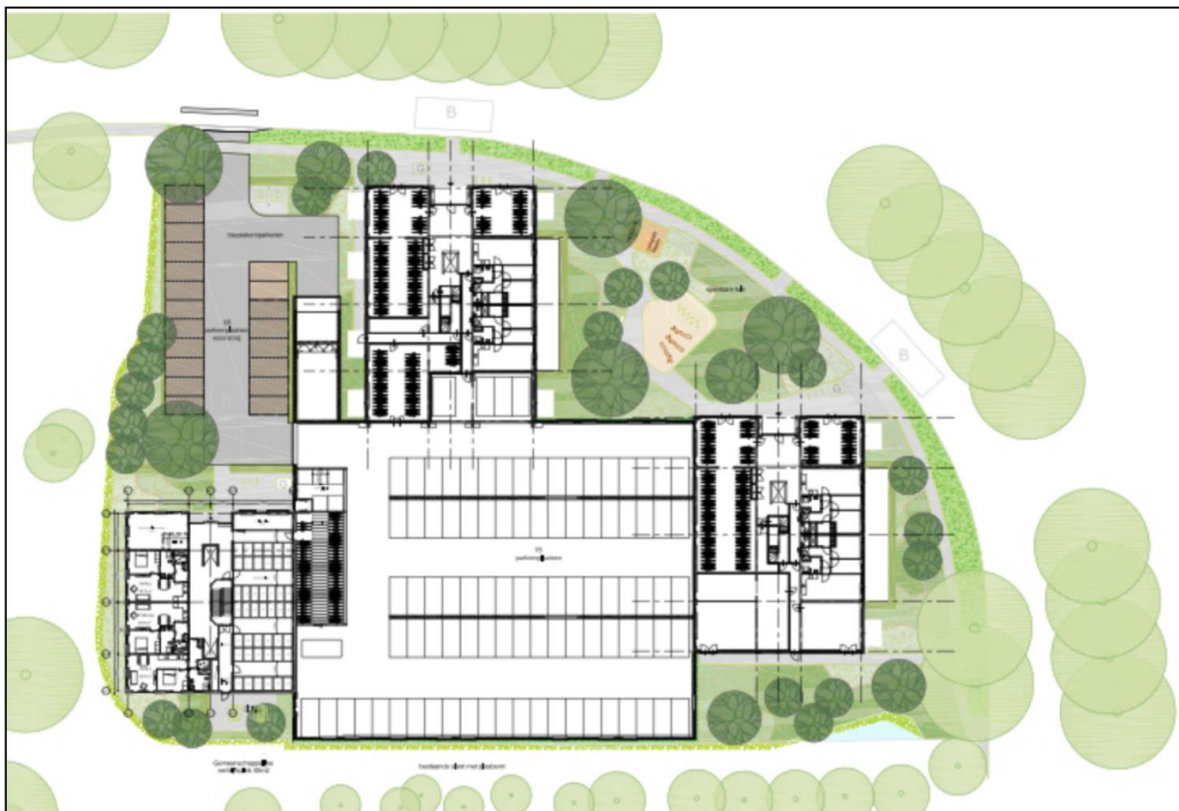
Afbeelding 3.1 Gewenste situatie

In afbeelding 3.1 is de gewenste situatie ter plaatse indicatief weergegeven. De bouwhoogtes betreffen circa 19 meter (westelijke toren), 34 meter (oostelijke toren) en 37 meter (noordelijke toren).