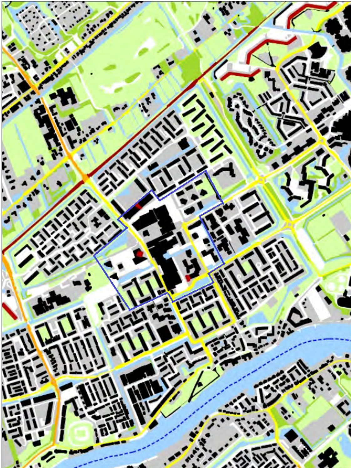
Afbeelding B2.2 centrumgebied 'niet-woonfuncties'