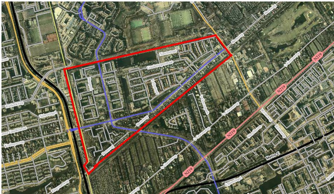
Afbeelding 1 plangebied Schenkel-Zuid

Ter voorbereiding op het nieuwe bestemmingsplan Schenkel-Zuid is in opdracht van de gemeente Capelle aan den IJssel een gebiedsinventarisatie uitgevoerd door de DCMR Milieudienst Rijnmond (DCMR). In onderstaande afbeelding is het plangebied globaal weergegeven.