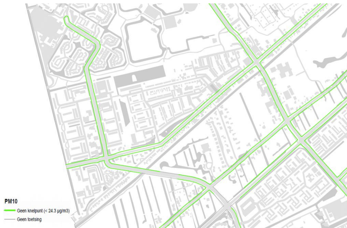
Afbeelding 3 Resultaten PM10

In onderstaande afbeeldingen zijn de rekenresultaten weergegeven.