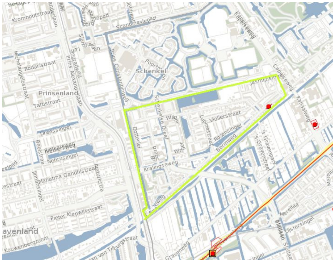
Afbeelding 2 uitsnede risicokaart

Ten behoeve van de gebiedsinventarisatie voor het nieuwe bestemmingsplan Schenkel-Zuid is een overzicht gemaakt van het aspect externe veiligheid. Hierbij is gebruik gemaakt van de geactualiseerde risico-inventarisatie die is gemaakt ten behoeve van het groepsrisicobeleid van de gemeente Capelle aan den IJssel. Het plangebied is in onderstaande uitsnede van de risicokaart globaal weergegeven. Er zijn geen nieuwe ontwikkelingen meegenomen, behoudens die ontwikkelingen die ook al zijn meegenomen in deze inventarisatie.