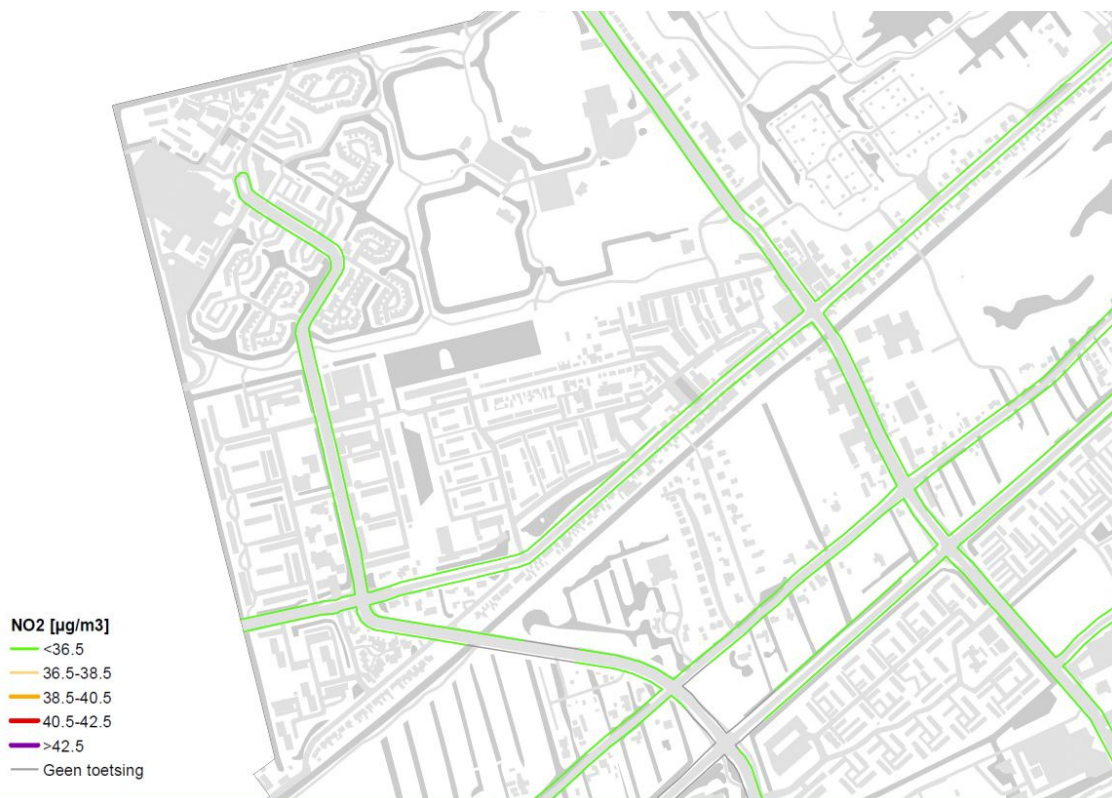
Afbeelding 4 Resultaten NO2

Uit de rekenresultaten blijkt dat langs geen van de beschouwde wegen overschrijdingen optreden van de grenswaarden voor \text{PM}_{10} en \text{NO}_2 .