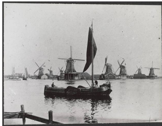
21.07248 Beeld van de Hemmes rond 1900