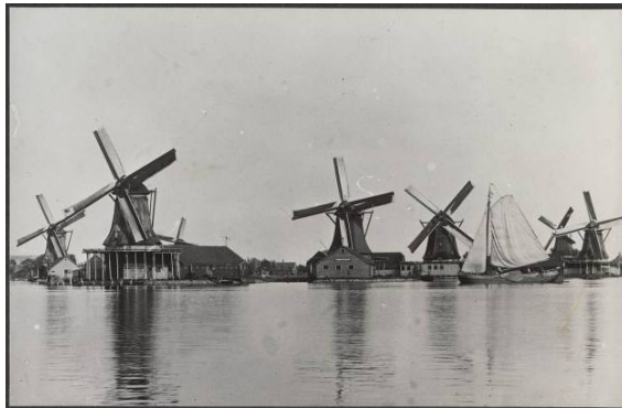
21.07278 Beeld van de Hemmes rond 1900

In de eerste helft van de 20 e eeuw maakten de molens plaats voor industrie. Na de oorlog bleef het terrein zijn industriële functie behouden maar de industrie zelf verdween geleidelijk. Op de westpunt is nu nog de scheepswerf en het scheepsmotoren bedrijf van Kramer aanwezig, het enige grote bedrijf. Tegen het Kalf aan staan wat kleinere loodsen en bedrijven. De rest van het terrein is leeg en bedekt met zand. Hierdoor zijn de oude sloten vrijwel allemaal verdwenen. Alleen de kleine, noord-zuid lopende dwarsloot naar de plek waar vroeger molen de Zaadzaaier stond, is nog aanwezig. De ontsluitingsweg 't Kalf in de lengte van de Hemmes ligt ongeveer op de plaats waar de grote oost-west lopende sloot lag. De zuidoostoever is door aanplemping en het slaan van zware beschoeiingen recht getrokken. De rest van het eiland heeft zijn onregelmatige oevers grotendeels behouden.