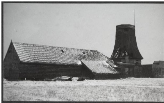
21.06179 De Zaadzaaier of Lastdrager 1917