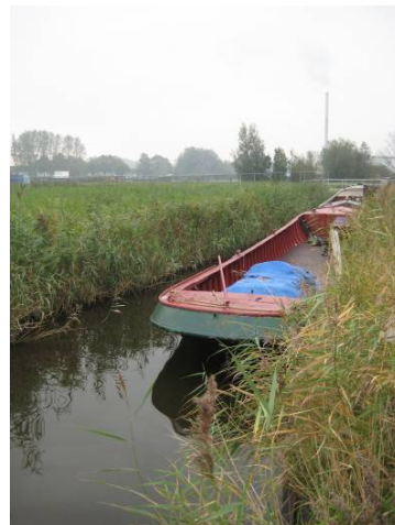
Dwarssloot bij molen de Zaadzaaijer