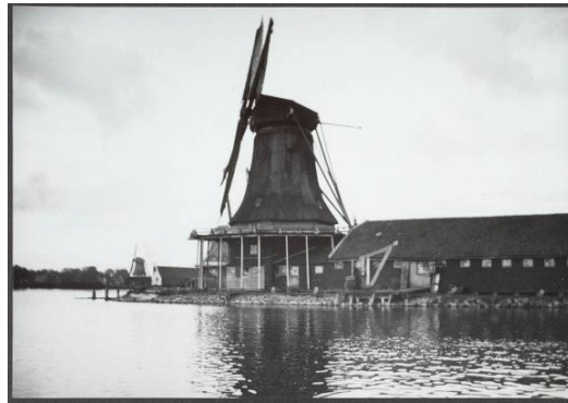
21.05694 De Kogmeeuw of Schijtjager 1900