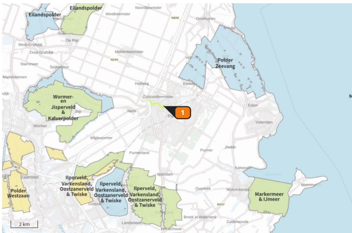
Figuur 2. Ligging projectgebied (oranje label 1) ten opzichte van de Natura 2000-gebieden (blauw, groen en geel).

In Nederland zijn 162 Natura 2000-gebieden aangewezen. Dit zijn gebieden met een Europese beschermingsstatus. Veel van die gebieden zijn gevoelig voor stikstofdepositie. Het meest nabijgelegen Natura 2000-gebied betreft 'Polder Zeevang' dat op een afstand van circa 2,5 kilometer ten noordoosten van het projectgebied ligt. Andere Natura 2000-gebieden op minder dan 10 km afstand zijn het 'Wormer- en Jisperveld & Kalverpolder' (ca. 3,8 km), 'Ilperveld, Varkensland, Oostzanerveld & Twiske' (ca. 4,6 km), 'Markermeer & IJmeer' (ca. 7,8 km) en de 'Eilandspolder' (ca. 8,3 km). Op de navolgende kaart is de ligging van het projectgebied ten opzichte van de Natura 2000-gebieden weergegeven.