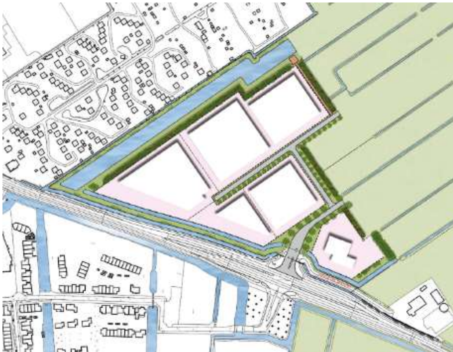
Figuur 2.1: De Veken 4 – mogelijke verkaveling fase 1