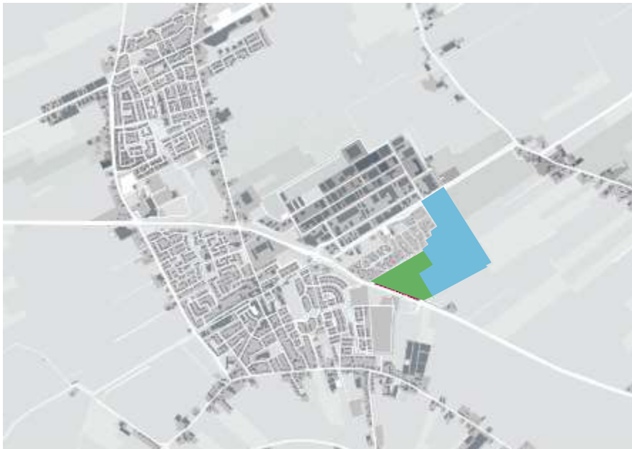
Figuur 1.1: Ligging en globale begrenzing plangebied (in rood de eerste fase)

Bedrijventerrein De Veken 4 vormt de derde uitbreiding van het bedrijventerrein De Veken, dat geheel gelegen is ten noorden van de A.C. de Graafweg. De voorgenomen ontwikkeling vindt plaats net ten noorden van de nieuwe woonuitbreiding Heerenweide. In figuur 1.1 is de ligging van het plangebied in de omgeving weergegeven. Het te ontwikkelen plangebied ligt ten noordoosten van de kern Spanbroek in de gemeente Opmeer. De noordoostelijke begrenzing van het plangebied wordt gevormd door het buitengebied van Opmeer en Medemblik. Enkele agrarische percelen vormen aldaar de grens. De zuidelijke grens wordt bepaald door de A.C. de Graafweg (N241) en agrarische percelen. Het recreatiepark West-Friesland vormt tenslotte de noordwestelijke begrenzing.