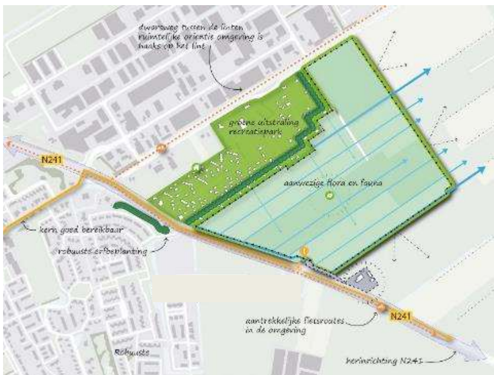
Figuur 3.1 Analyse ruimtelijke structuur