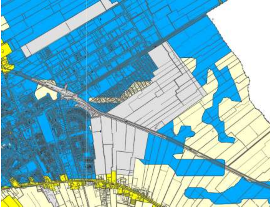
Figuur 4.1: Uitsnede uit de Archeologische beleidskaart van de gemeente Opmeer

historische kaarten en archeologische onderzoeken. Tevens zijn de recent vrijgegeven terreinen afgeschreven. Het grondgebied van onderhavig bestemmingsplan betreft een vrijgegeven gebied.