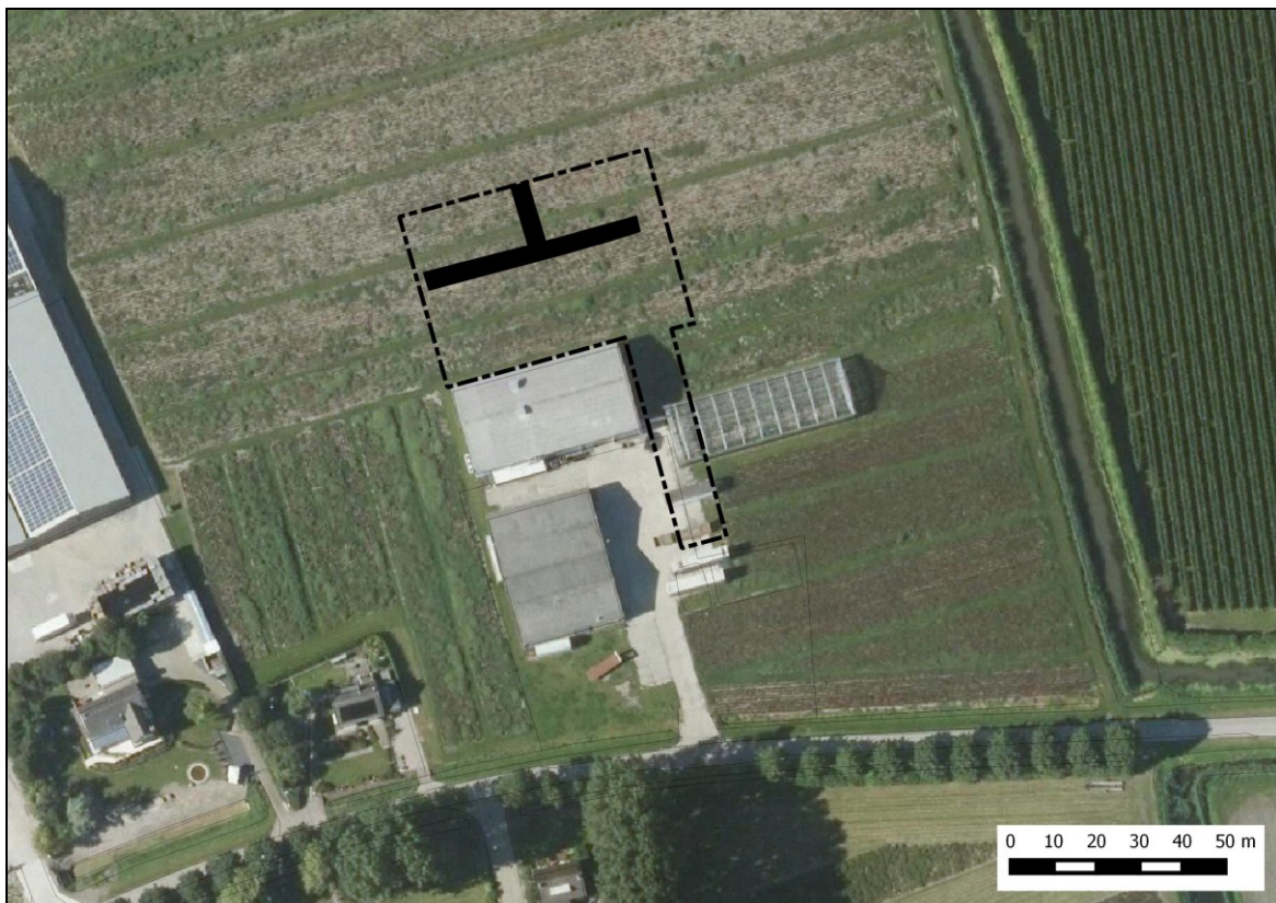
Afbeelding 2. Ligging van de aangelegde proefsleuven (in zwart).