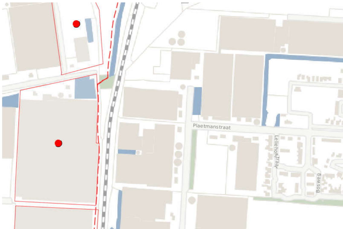
Figuur 5.2: Uitsnede Risicokaart

De Risicokaart geeft aan dat er in de nabijheid van het gebied een aantal bedrijven aanwezig zijn die als risicovolle inrichting zijn aangeduid. Daarnaast geeft de Risicokaart aan dat er ten westen van de spoorweg een buisleiding van de Gasunie loopt.