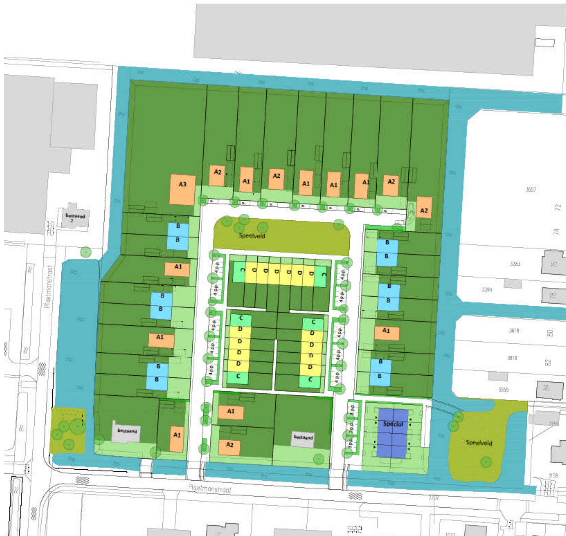
Figuur 3.1: Voorlopig ontwerp (Geo Architecten)

De vormgeving van de openbare ruimte dient de dorpse sfeer uit te dragen. Kleinschaligheid, eenvoud, gemengd gebruik en dorpse traditie dienen hiervoor als uitgangspunt te worden gehanteerd. Ondanks de inkadering van de omliggende kassen en daarmee de afsluiting van het landelijke gebied, blijft Reinderseiland een dorpse ervaring met karakteristieke doorkijkjes, open bebouwing, waterbeleving en inrichting van openbare ruimte.