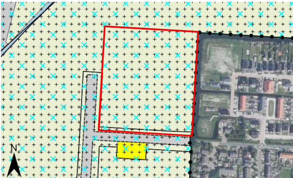
Figuur 1.2: Uitsnede verbeelding bestemmingsplan Buitengebied 2014

Tevens kent het plangebied de dubbelbestemming 'Waarde – Archeologie 4' ter bescherming van mogelijk aanwezige archeologische waarden.