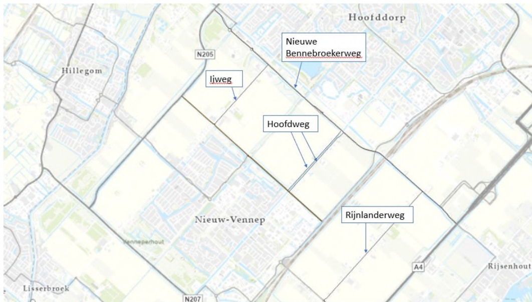
Afbeelding 3.1 Overzicht beschouwde wegen