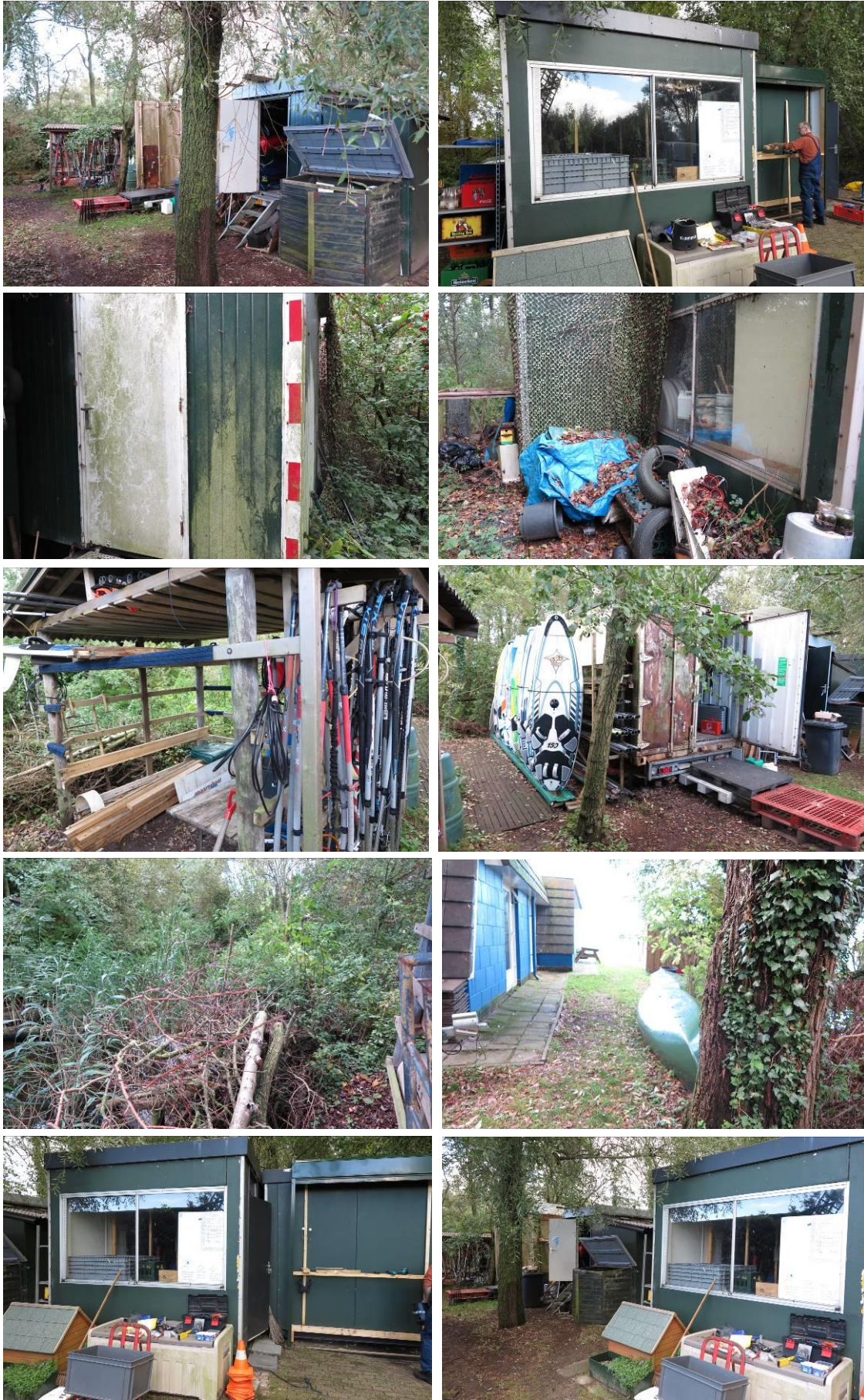
Figuur 2. Aanzicht van het plangebied van de uitbreiding van De Laars 14 te Halfweg.