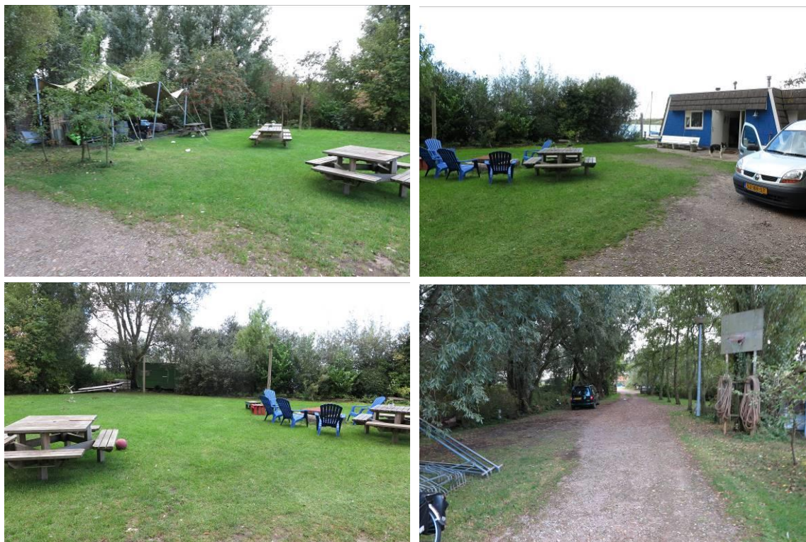
Vervolg figuur 2. Aanzicht van het plangebied De Laars 14 te Halfweg (het te behouden terrein).