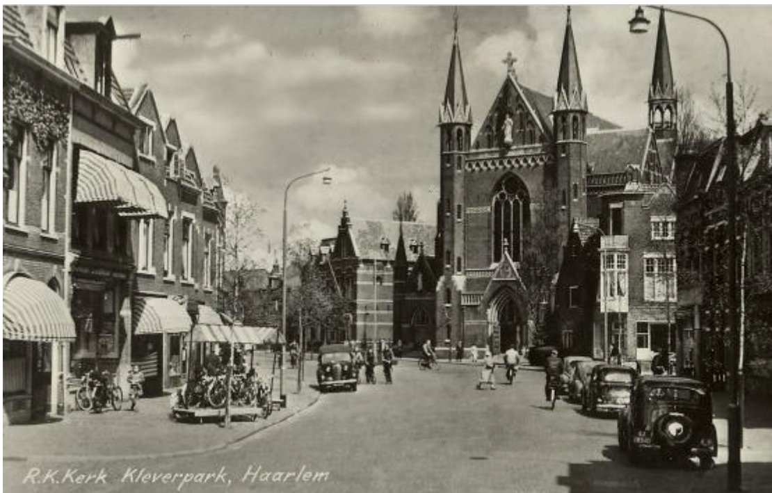
Kleverparkweg gezien richting de Heilig Hartkerk in 1955.

De verschillende grotere woningcomplexen zijn door de eenheid in het architectonisch ontwerp als samenhangende ensembles herkenbaar. Verschillende complexen onderscheiden zich door de toepassing van platte daken.