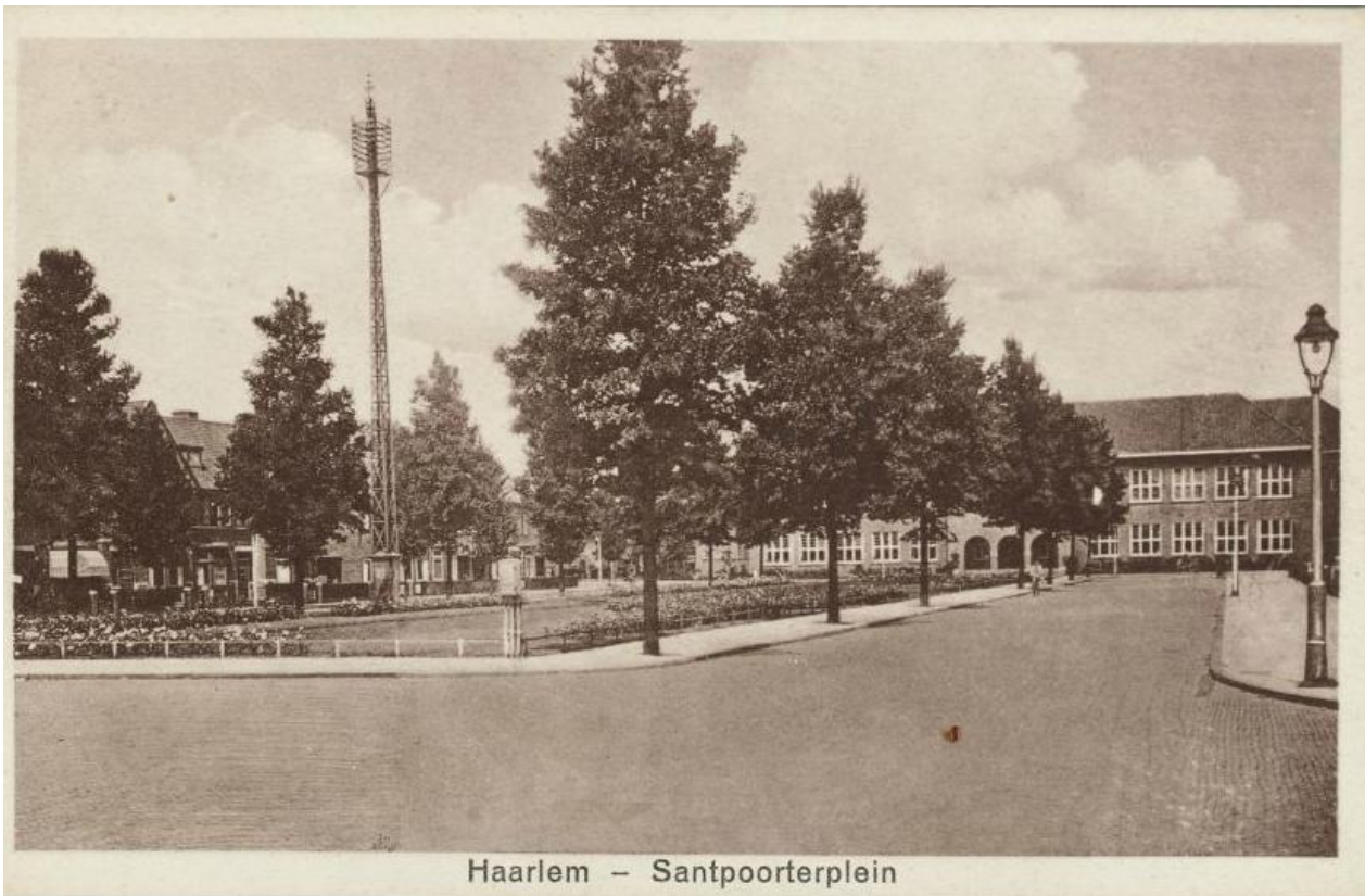
Haarlem – Santpoorterplein

Het Santpoorterplein op een ansichtkaart uit de jaren '30, gezien richting de HBS.