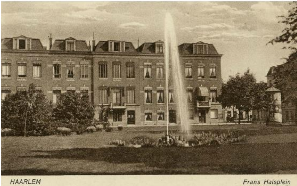
Het Frans Halsplein op een Ansichtkaart uit circa 1925.

stedenbouwkundig plan aan ten grondslag lag, is het stratenplan niet echt overzichtelijk en qua verkaveling en verkeersafwikkeling weinig rationeel. De ligging van de straten was voor een groot deel bepaald door de oudere situatie van bestaande wegen, paden en percelen. De straten zijn in het algemeen recht, maar sluiten vaak niet recht aan op de andere straten, waardoor er geen lange zichtassen zijn. De huizen staan, met uitzondering van het westelijke deel van de Schotersingel, direct aan de straat in rechte rooilijnen en de huizenrijen sluiten zijn merendeels aaneen tot vrijwel gesloten bouwblokken.