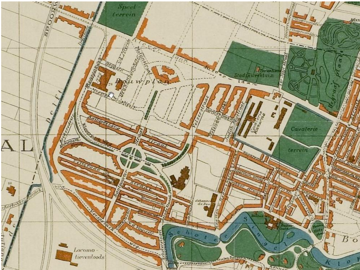
Uitsnede uit de “Kaart van Haarlem en omgeving” uit 1921, door Emrik & Binger (collectie kaarten Kennemerland,). Het woningbouwcomplex aan de Kleverlaan (1920) is gereed, evenals een buurtje noordelijk van de begraafplaatsen.