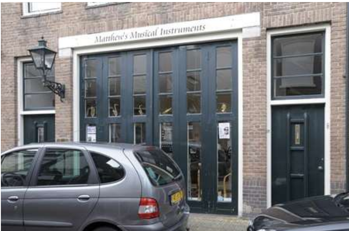
Detail van de onderzijde van het voormalige garagebedrijf, thans muziekwinkel.