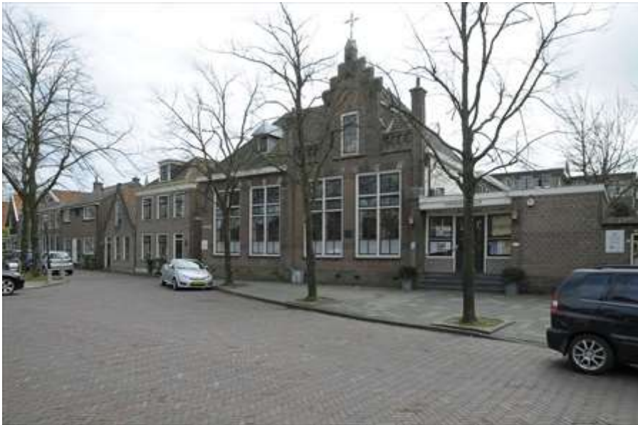
Overzicht van de ligging van het gebouw aan de Achterhaven.