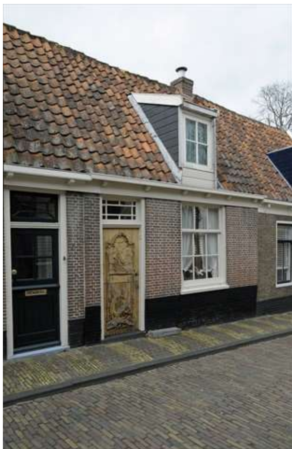
Voorgevel van Gravenstraat 9.