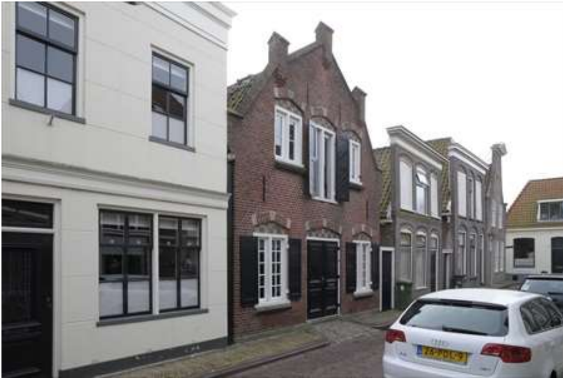
Overzicht van de situering van het voormalige kaaspakhuis aan de Lingerzijde.