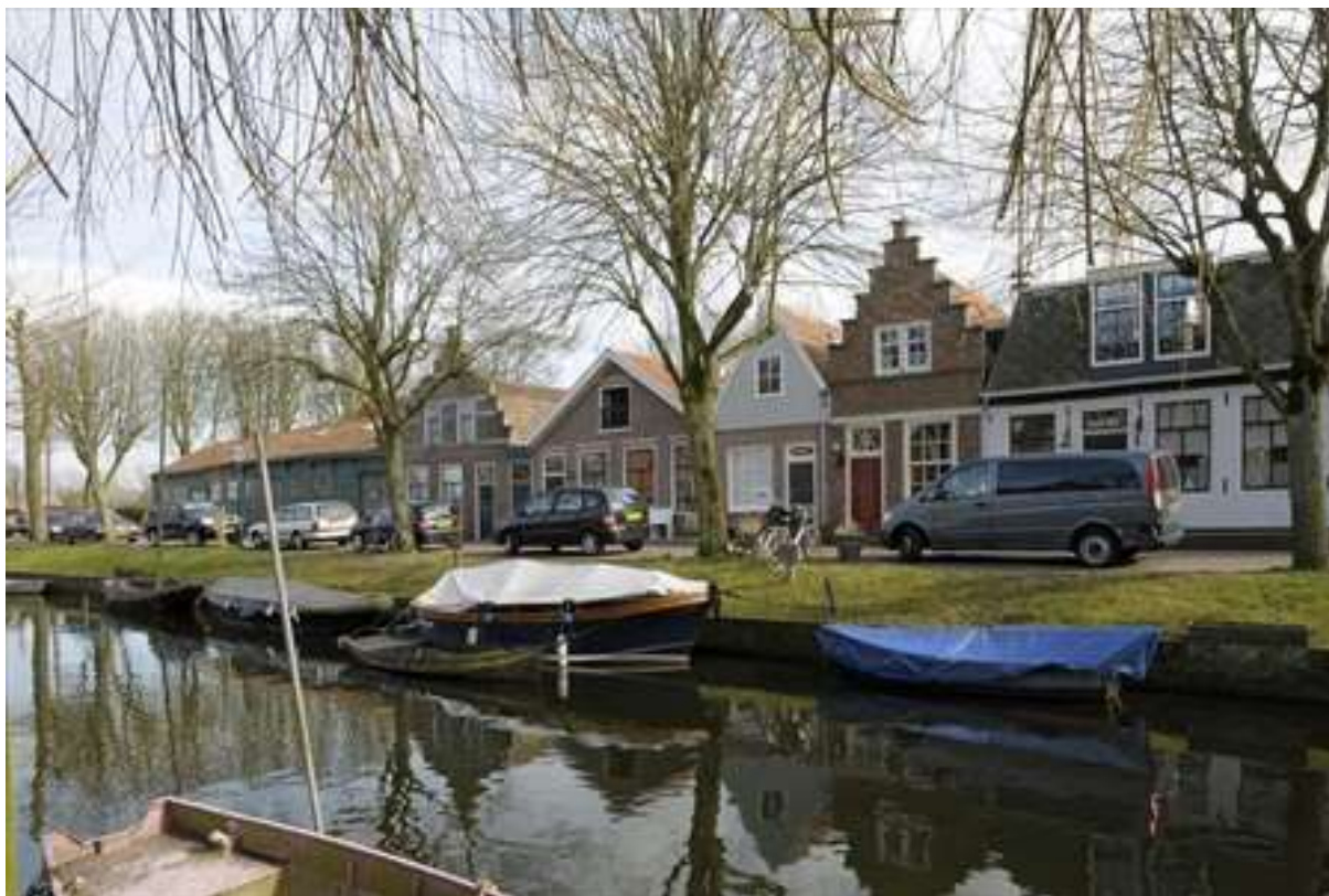
Situering van het pand in de zuidelijke gevelwand van de Voorhaven.