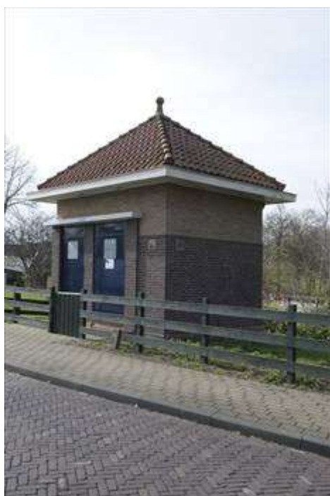
Voorgevel en oostgevel van het trafohuisje.