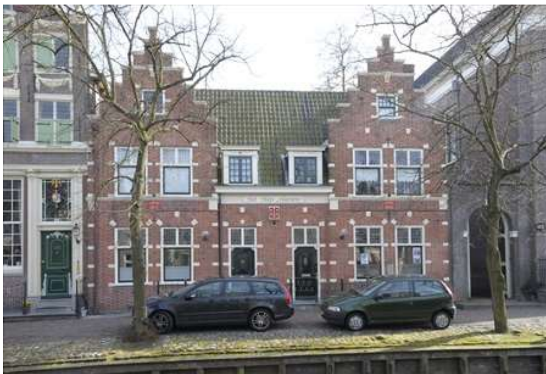
Vorgevel van Voorhaven 139 en 141