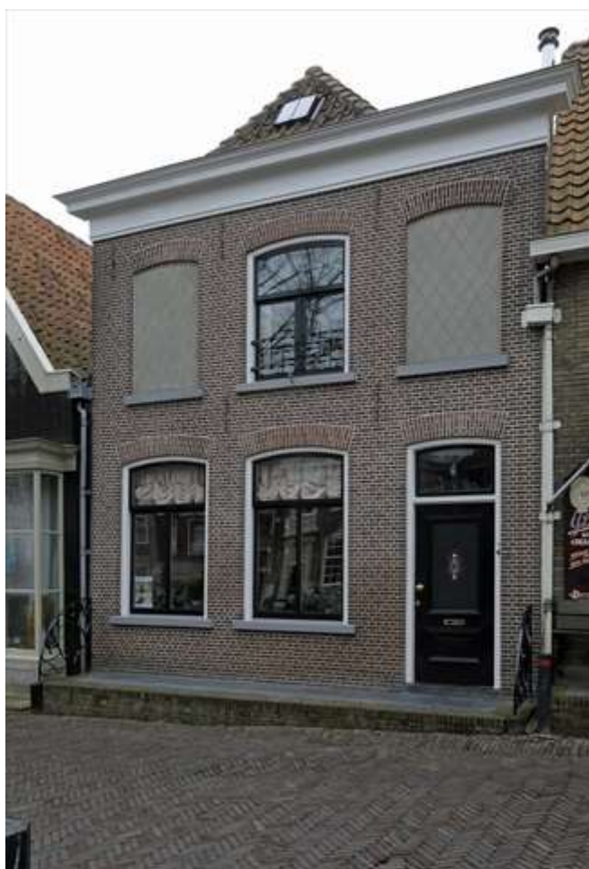
Vorgevel van Keizersgracht 5.