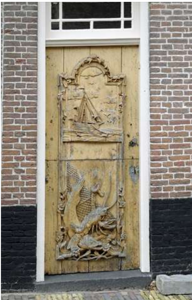
Rijk gedecoreerde voordeur van Gravenstraat 9.