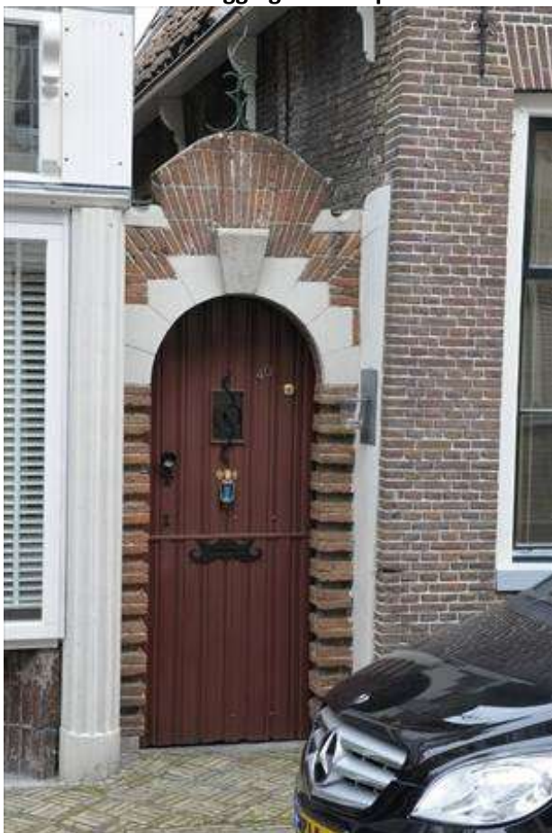
Detail van het poortje rechts naast het pand, dat toegang geeft tot het achtererf.