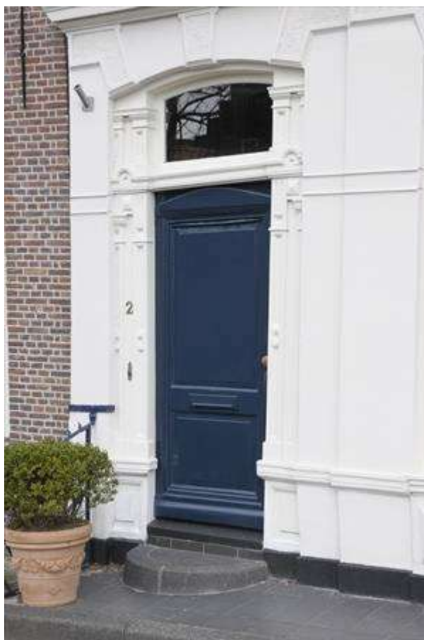
Voordeur met rijke omlijsting.