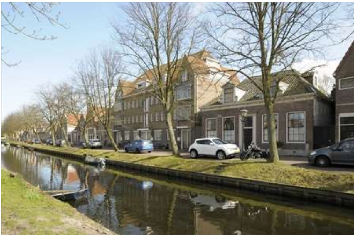
Situering van het object in de zuidelijke gevelwand van de Voorhaven.