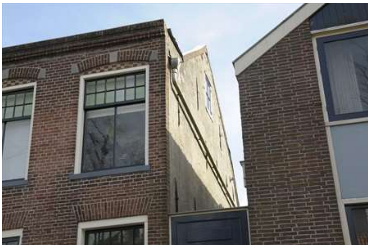
Zicht op de westelijke zijgevel van het pand.