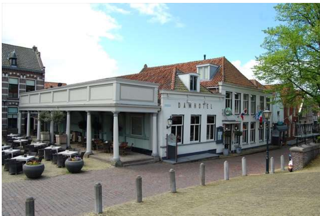
Voor- en zijgevel van Keizersgracht 1.