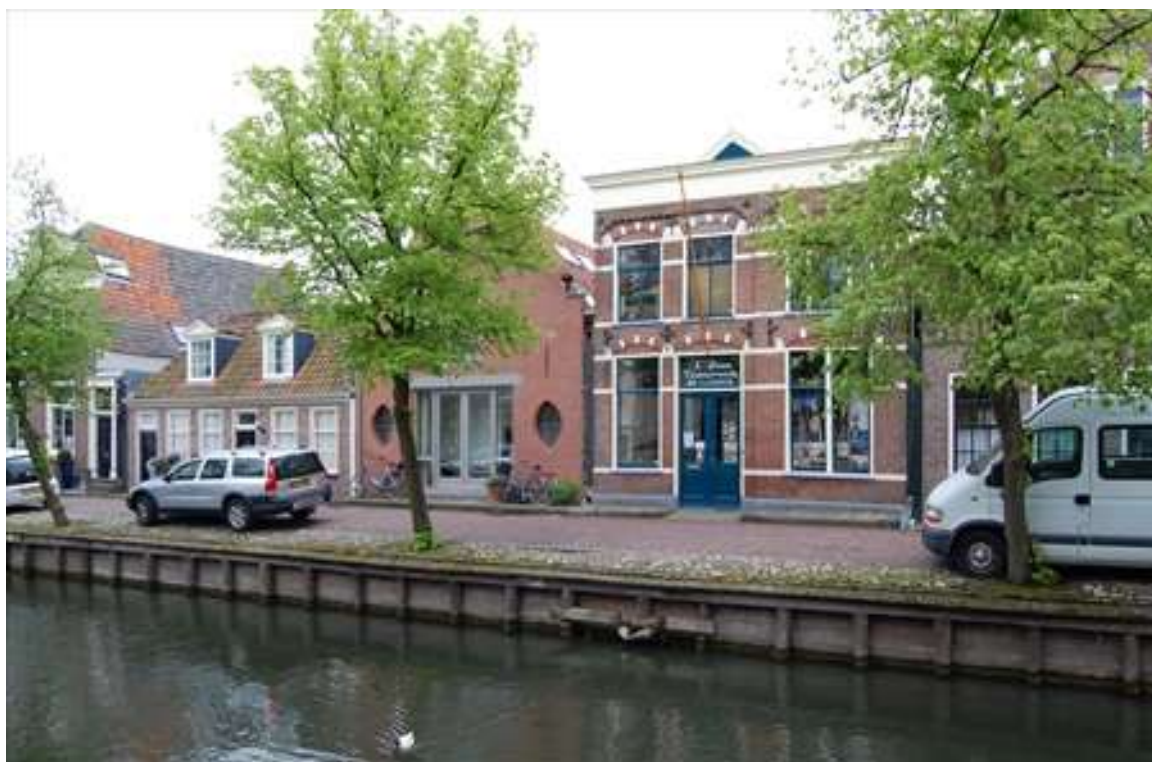
Situering van het pand in de zuidelijke gevelwand van de Voorhaven