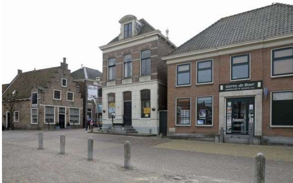
Overzicht van de zuidelijke gevelwand van het Jan Nieuwenhuizenplein.