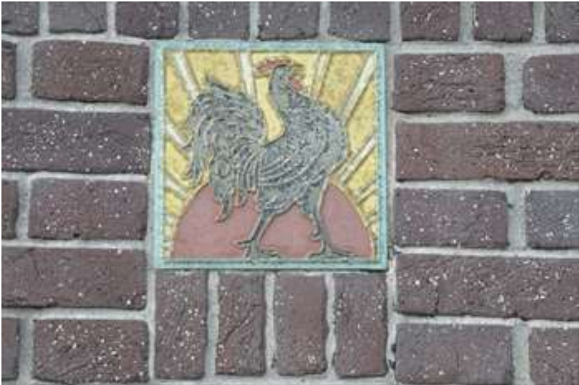
Detail van het tegeltableau in de voorgevel met daarop een haan en de opkomende zon afgebeeld.