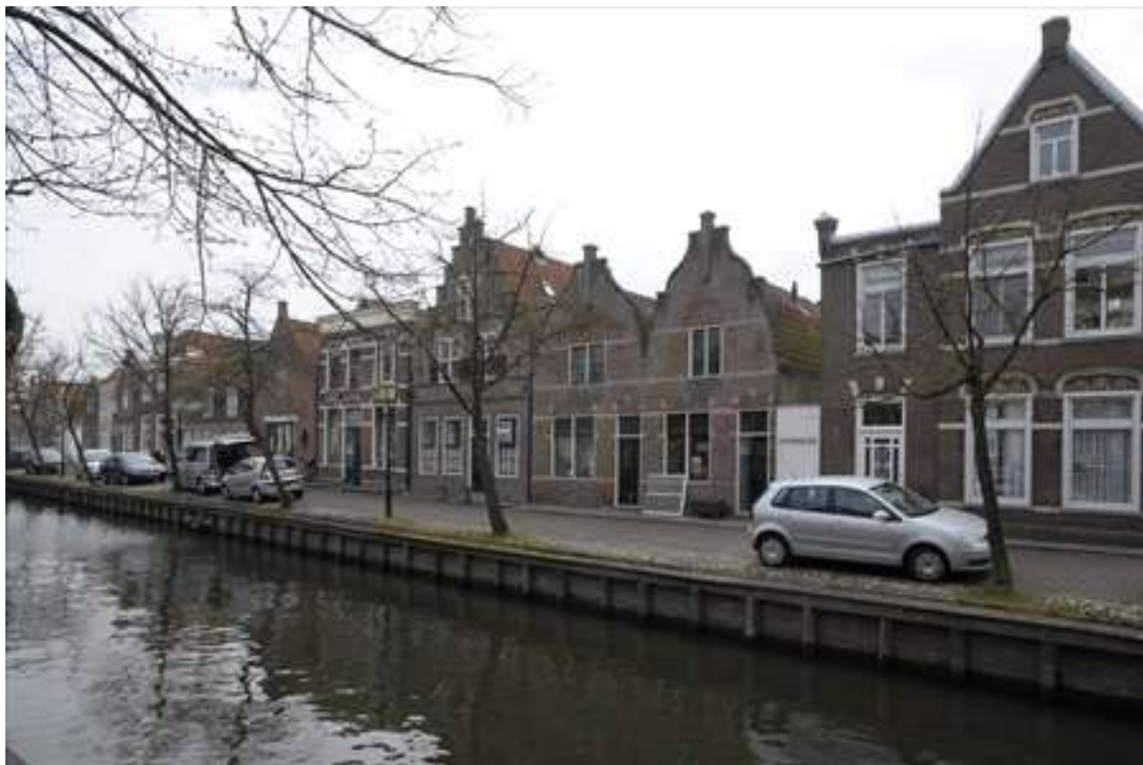
Situering van Voorhaven 119-121.