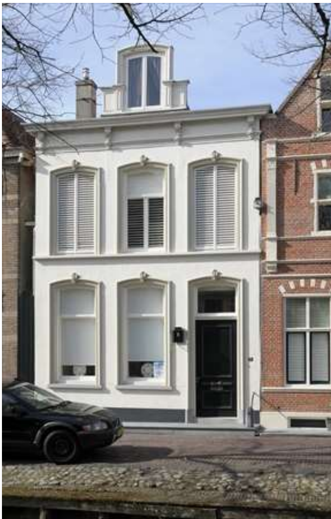
Voorgevel van Voorhaven 164.