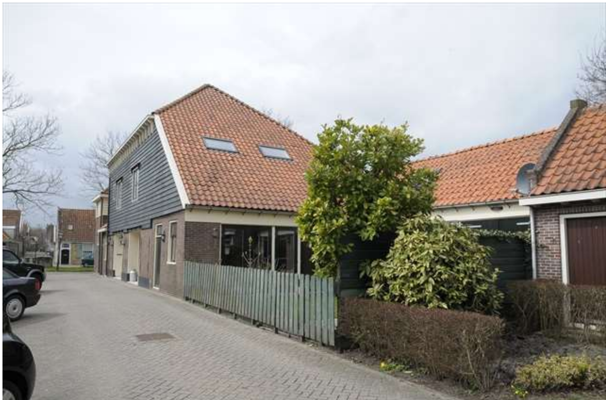
Achterzijde van Groenland 19.