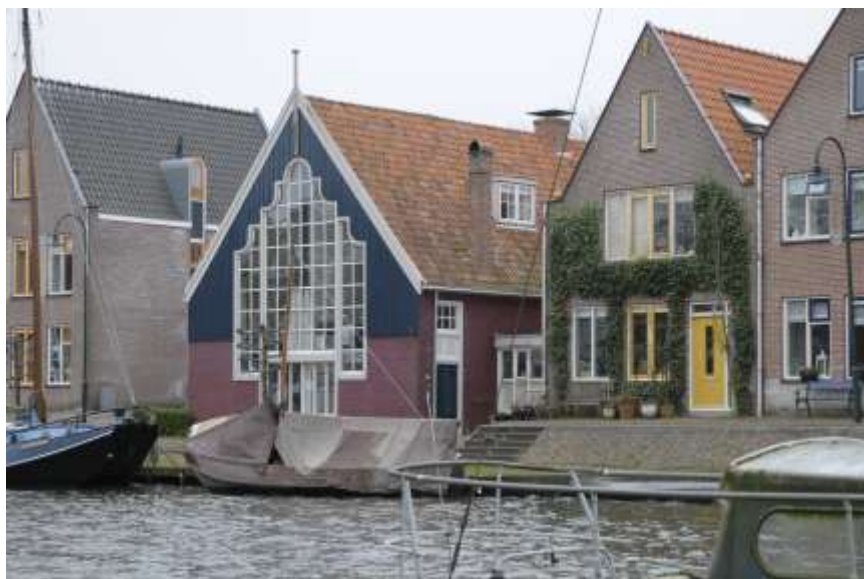
De voorgevel en de ligging van het atelier aan de Baandervesting.