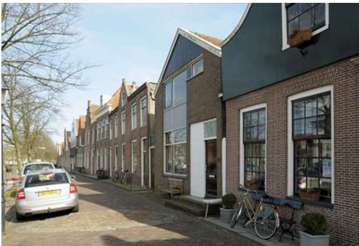
Situering van het pand in de zuidelijke gevelwand van de Voorhaven.