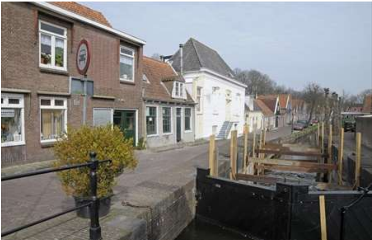
Situering van het pand aan de Wijngaardsgracht.