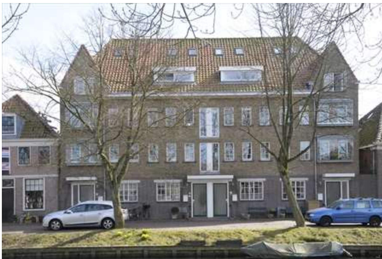
Vorgevel van Voorhaven 41.