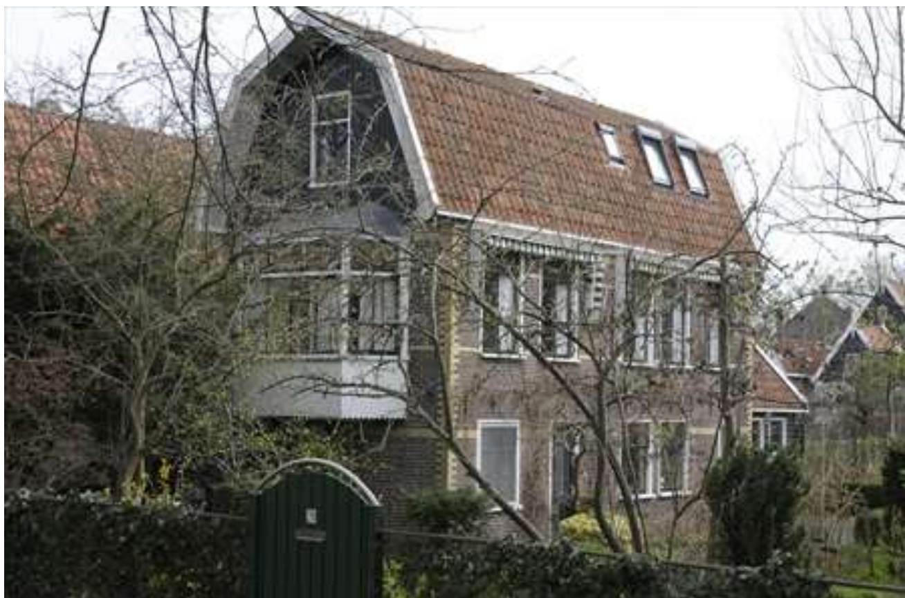
Voorgevel en rechter zijgevel van Westervesting 20.