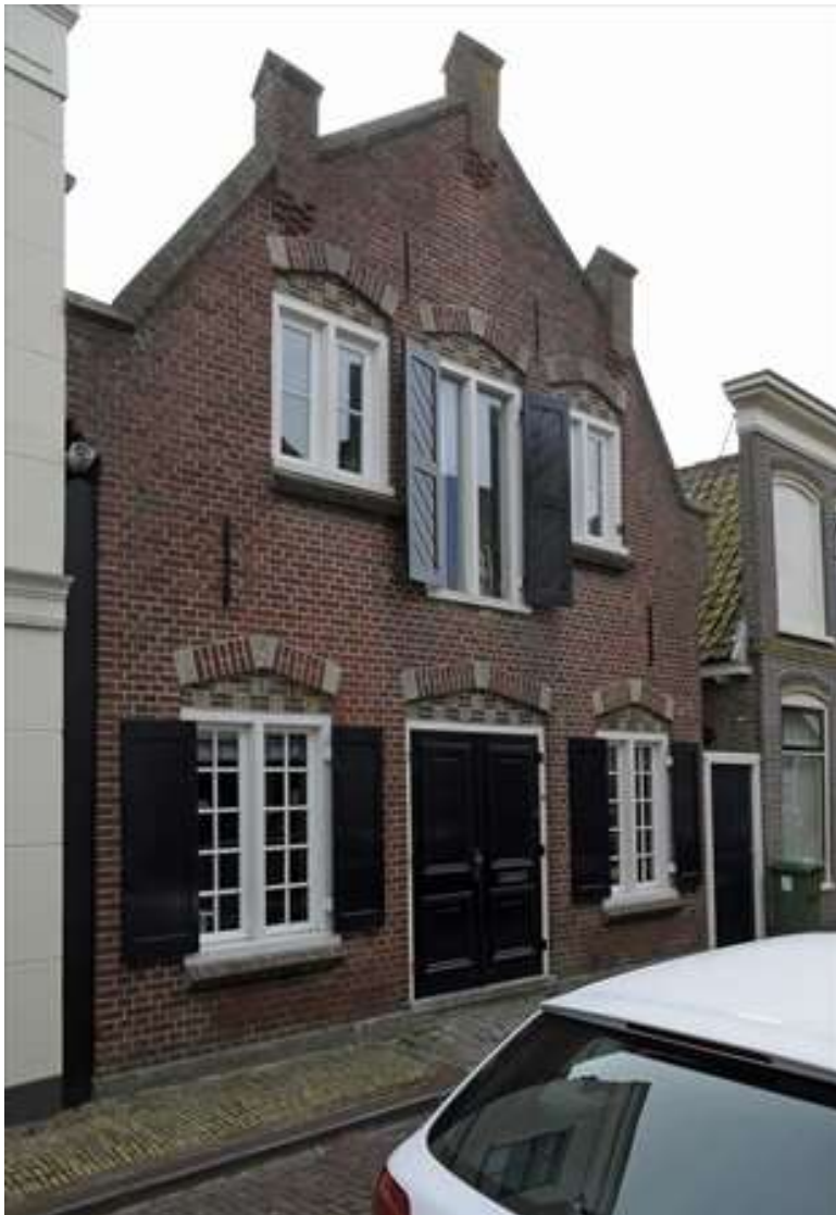
Voorgevel van het voormalige kaaspakhuis.