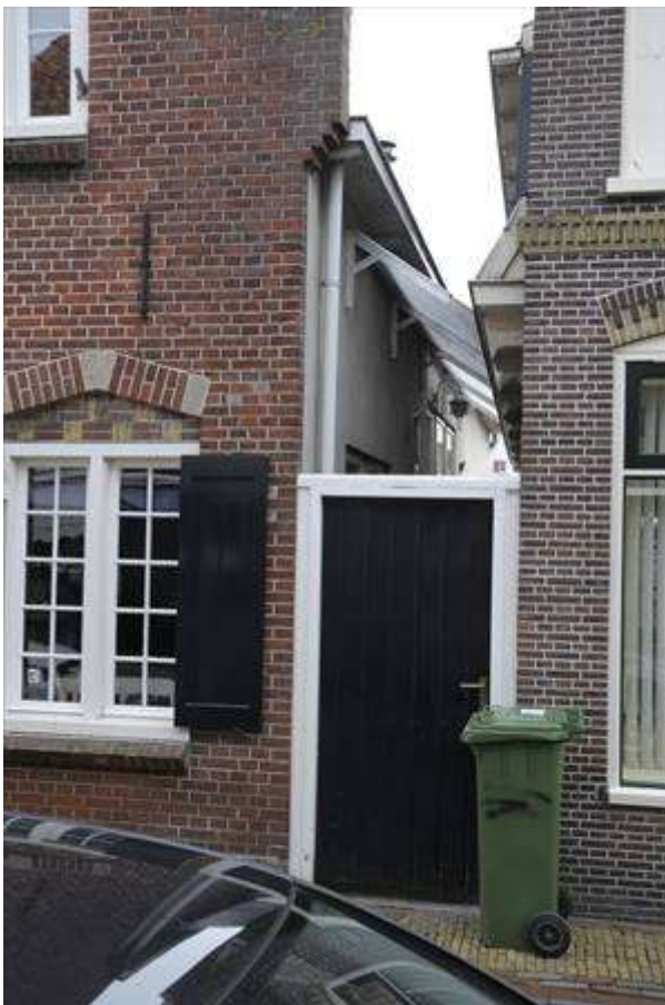
Zicht op zuidelijke zijgevel en de ontsluiting via de steeg aan de voorzijde.