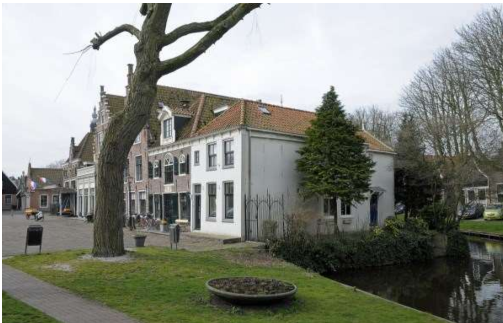
Overzicht van de westzijde van het Jan Nieuwenhuizenplein met de situering van het pand op de hoek aan de gracht.