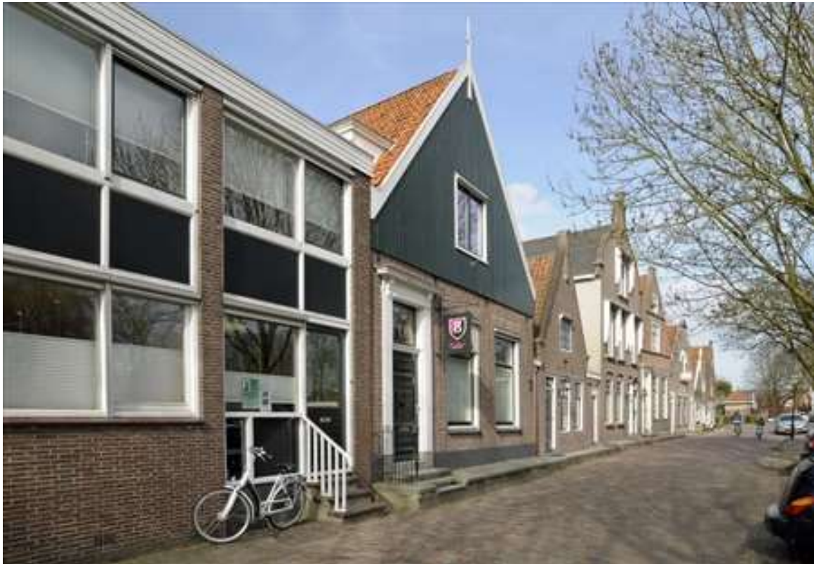
Situering van het pand in de noordelijke gevelwand van de Voorhaven.