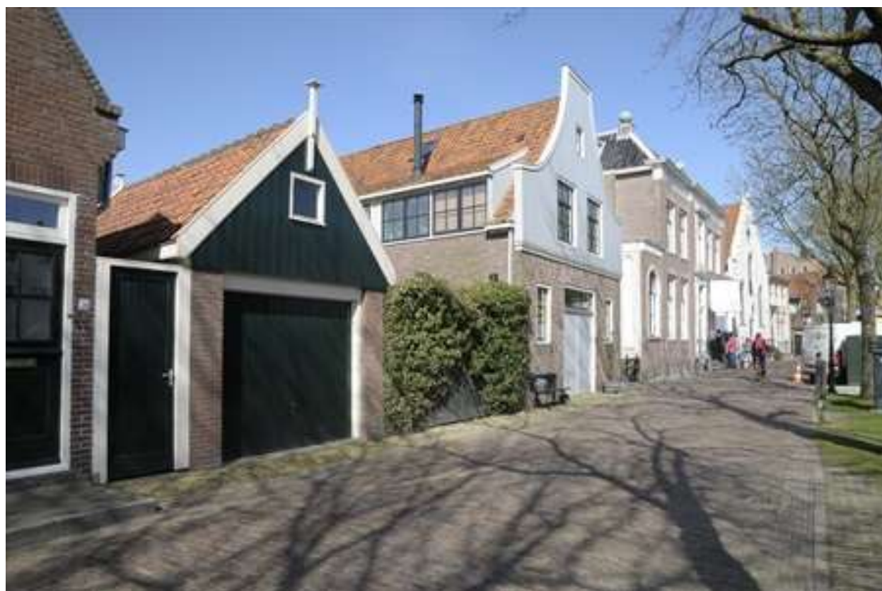
Overzicht van de ligging van het pand aan de Nieuwehaven.