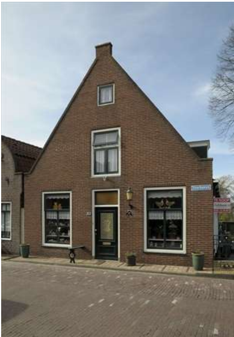
Vorgevel van Voorhaven 10.