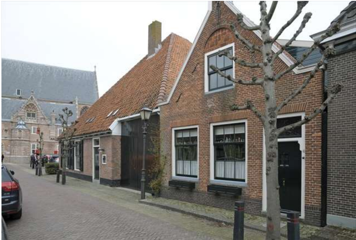
Zicht op de zijgevel aan de Grote Kerkstraat.