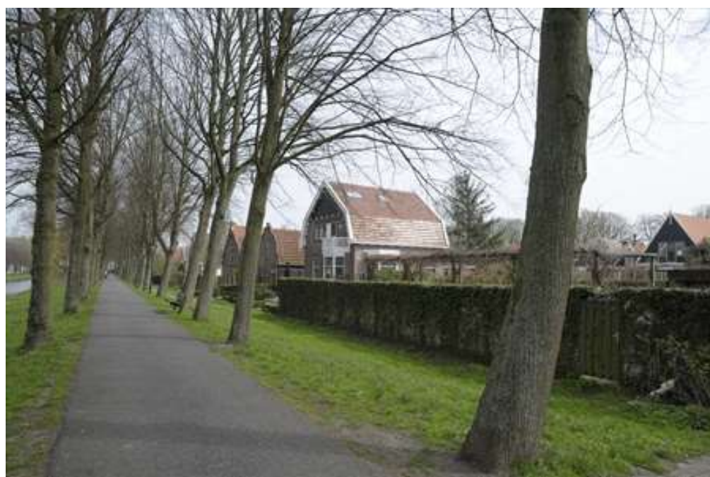
Situering van het pand aan de Westervesting.