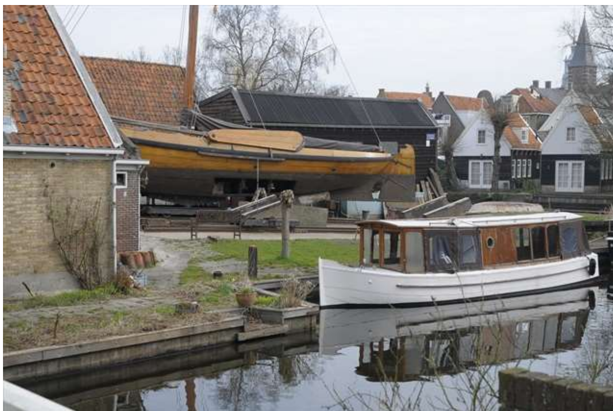
Scheepswerf gezien vanaf de Schepenmakersdijk.