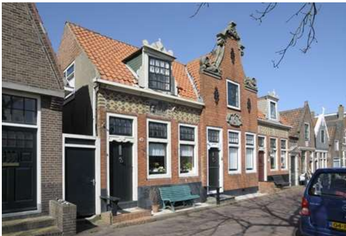
Voorgevel en overzicht van de situering van Nieuwehaven 40, 41 en 42.