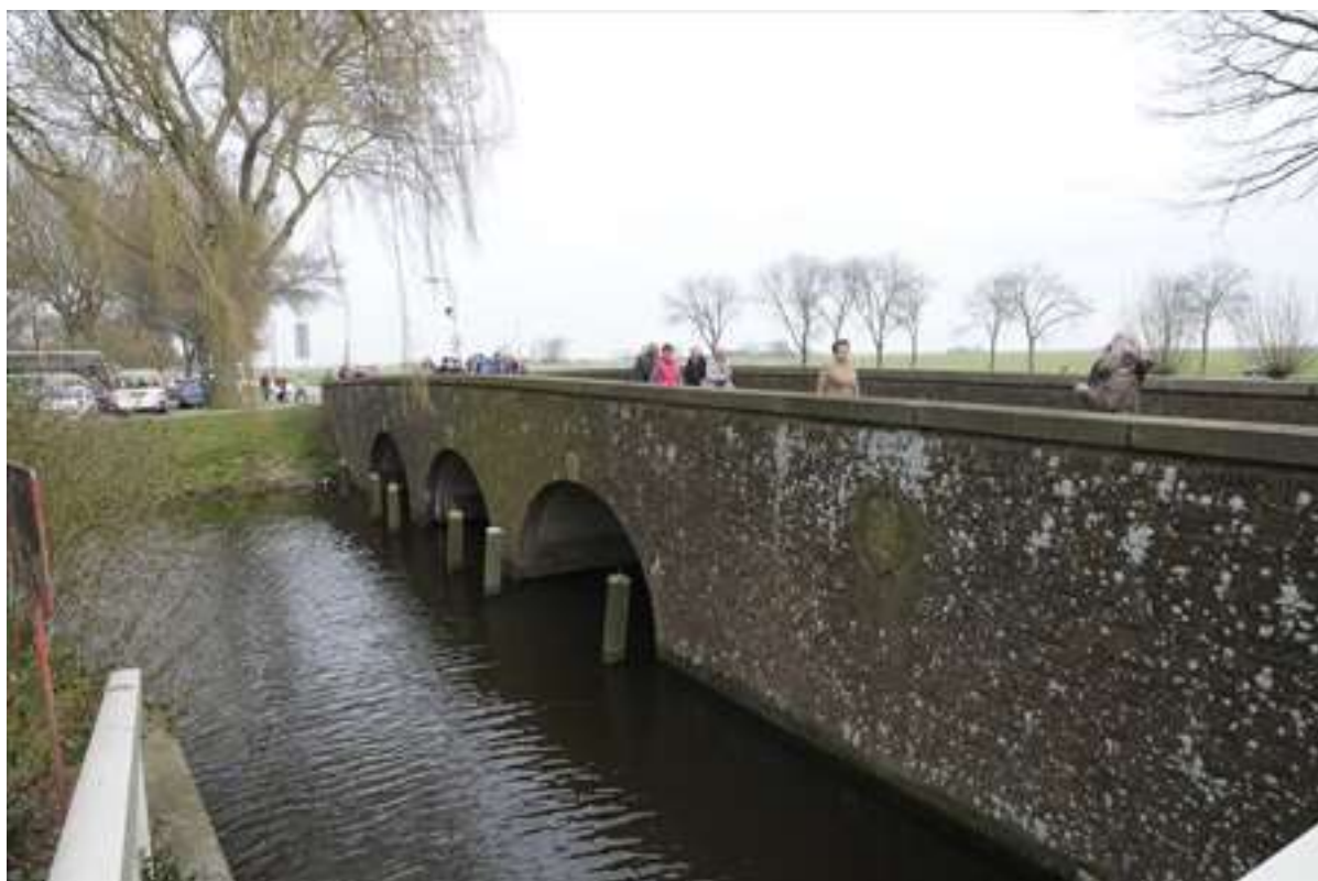
Noorderbrug gezien vanaf de Matthijs Tinxgracht.