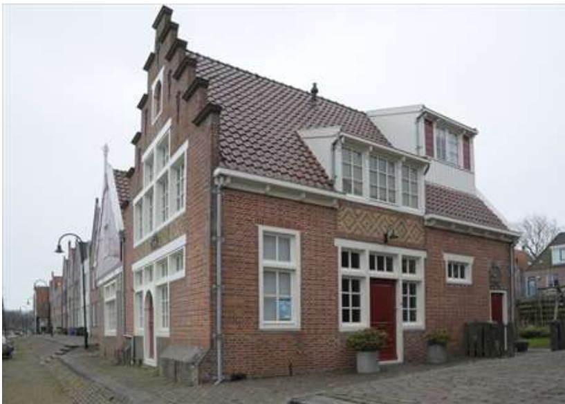
Zijgevel van het rechterwoonhuis.