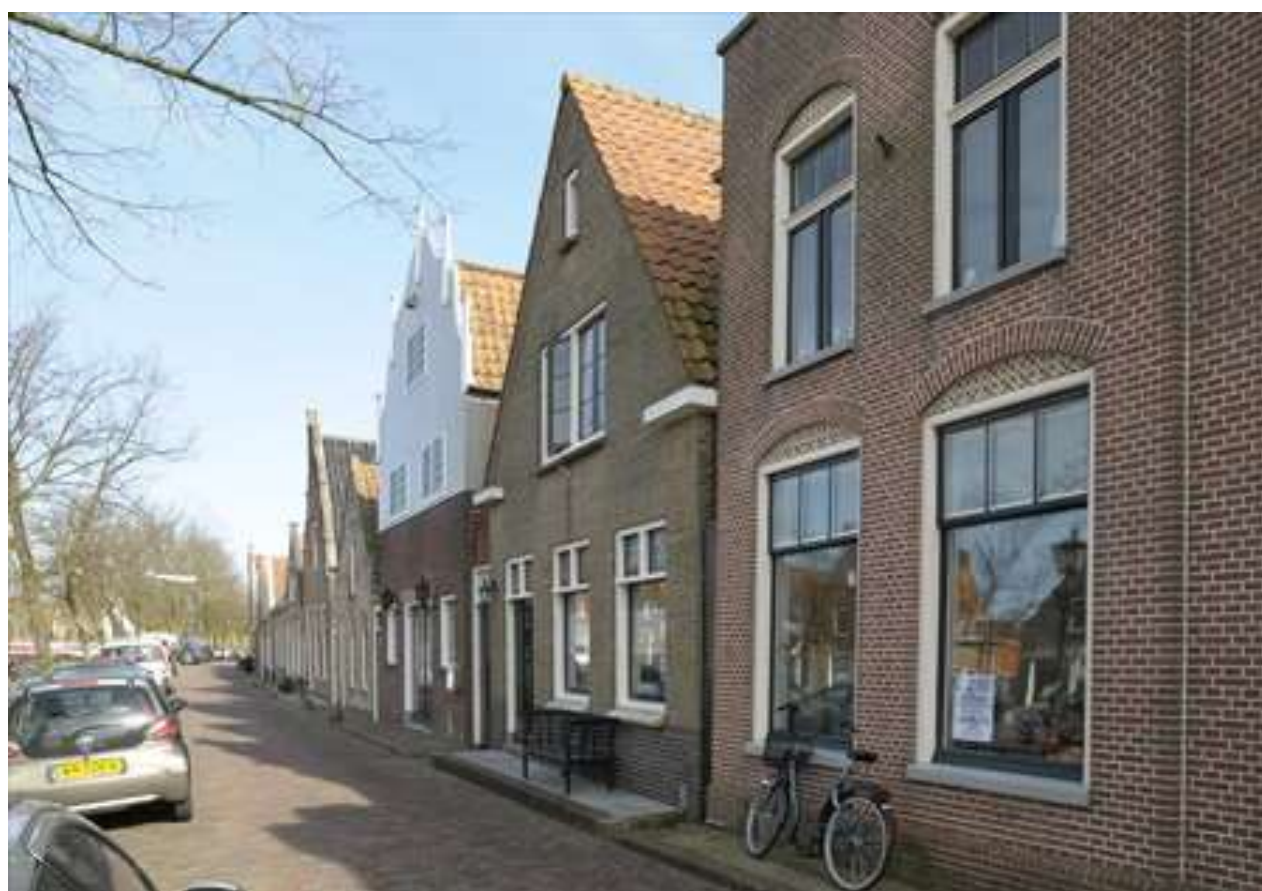
Situering van het pand in de zuidelijke gevelwand van de Voorhaven.