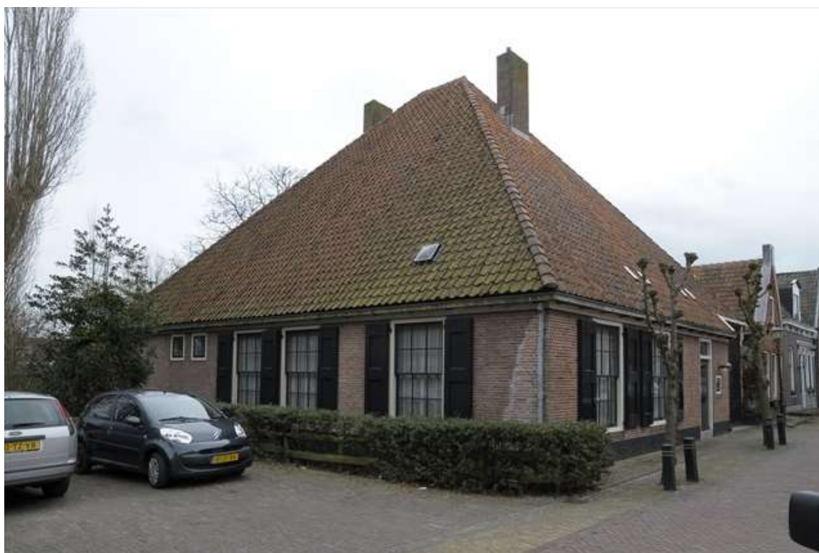
De voormalige stadsboerderij aan het einde van de Grote Kerkstraat.