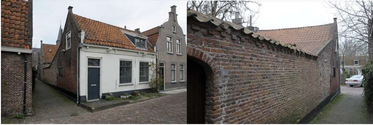
Voor-, zij- en achtergevel van Nieuwehaven 75.