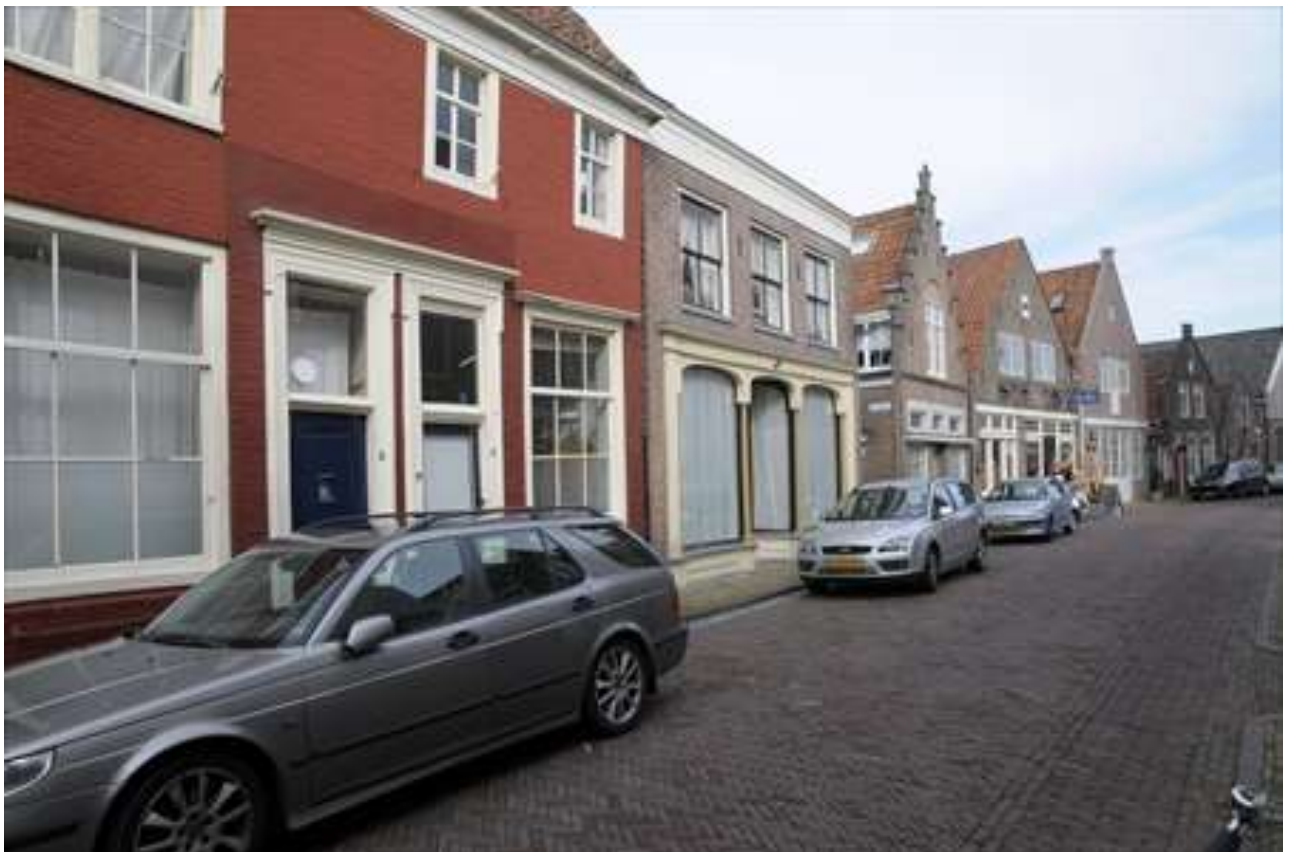
Overzicht van de noordelijke gevelwand van de Lingerzijde.