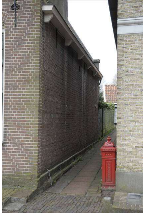
Zicht op de steeg die naar het achtererf voert.