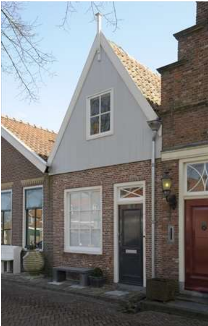
Vorgevel van Voorhaven 5.