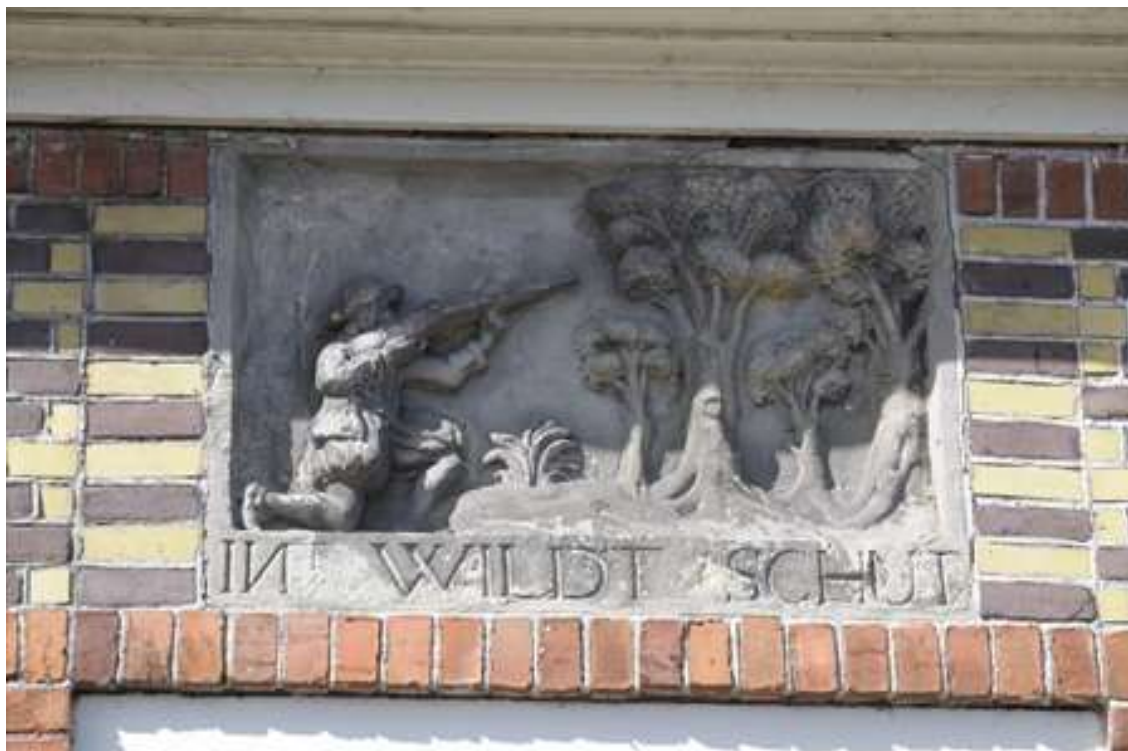
Detail van de gevelsteen in de gevel van de woning links met de tekst 'In't wildt schut' en de afbeelding van een jager.