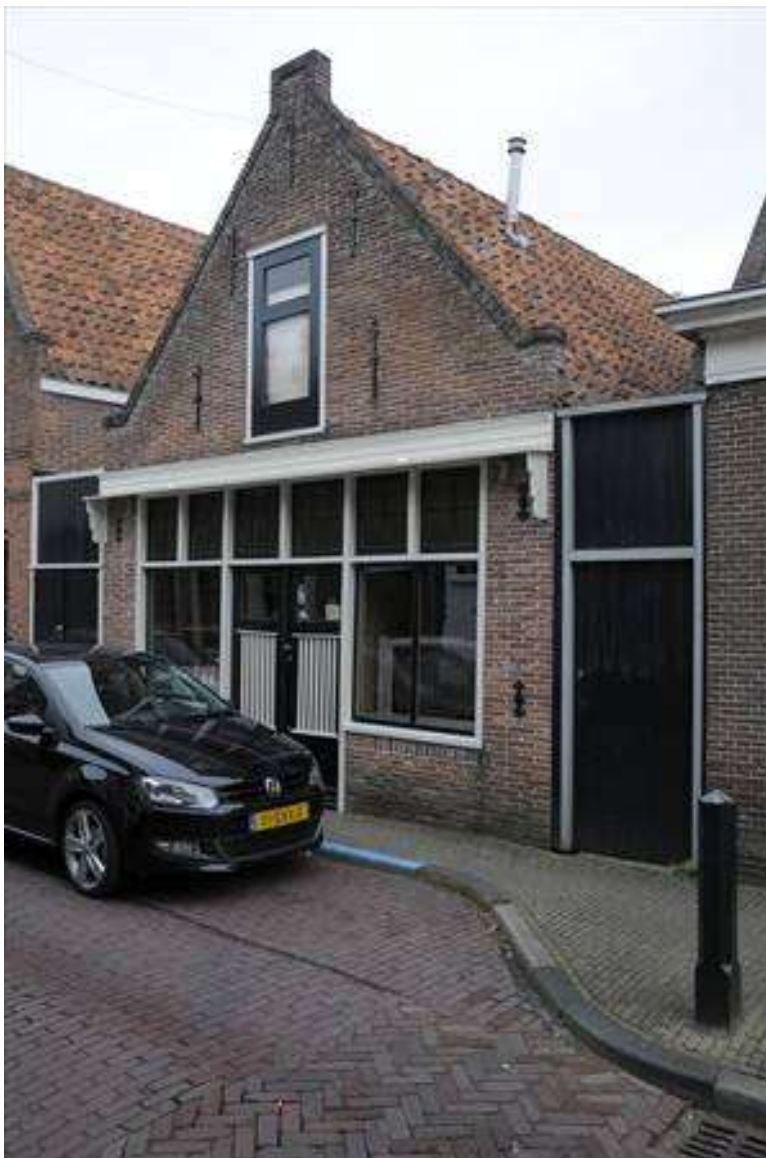
Voorgevel van Spuistraat 16.