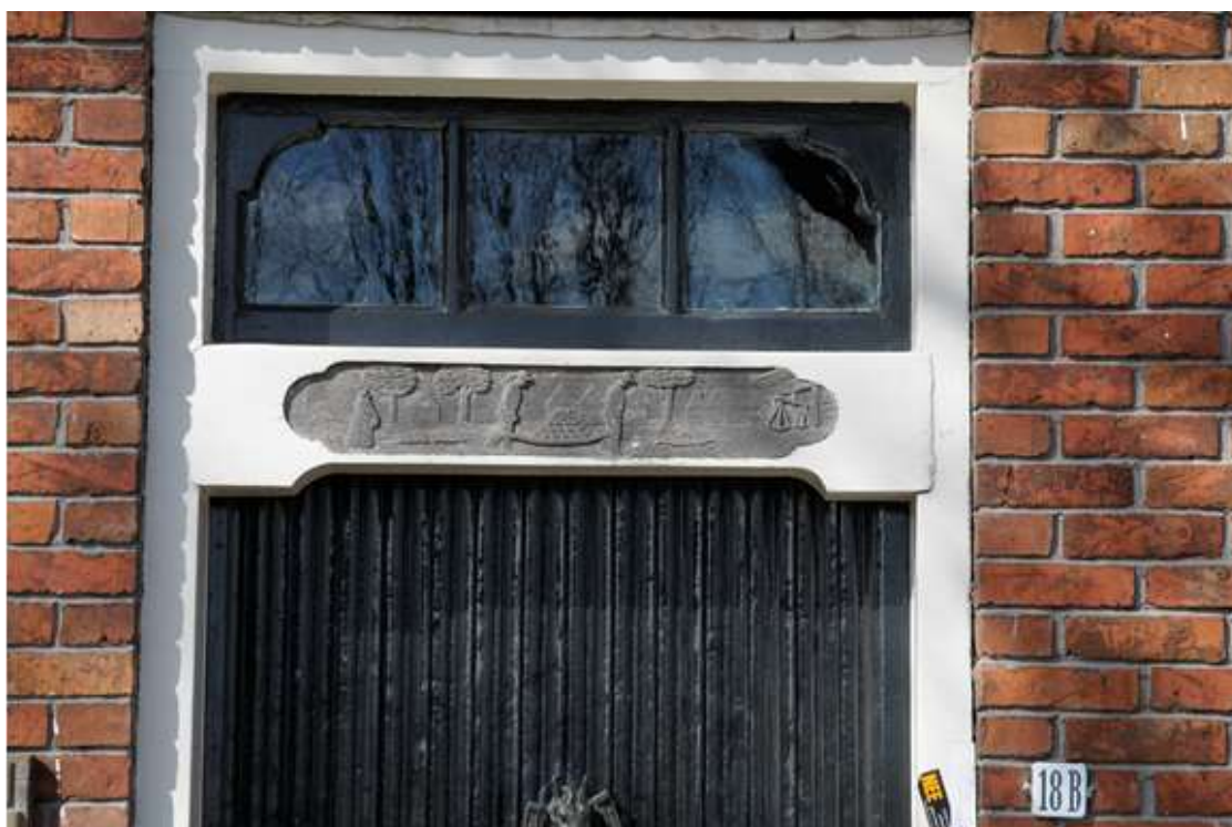
Voordeur links met een paneel met verwijzing naar de kaashandel.