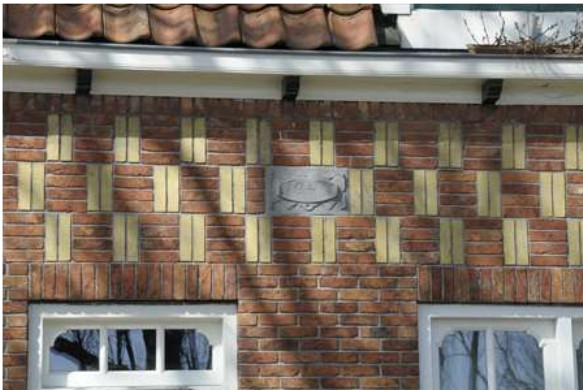
Detail van het baksteenfries met siermetselwerk en daarin een gevelsteen met jaartal 1941.