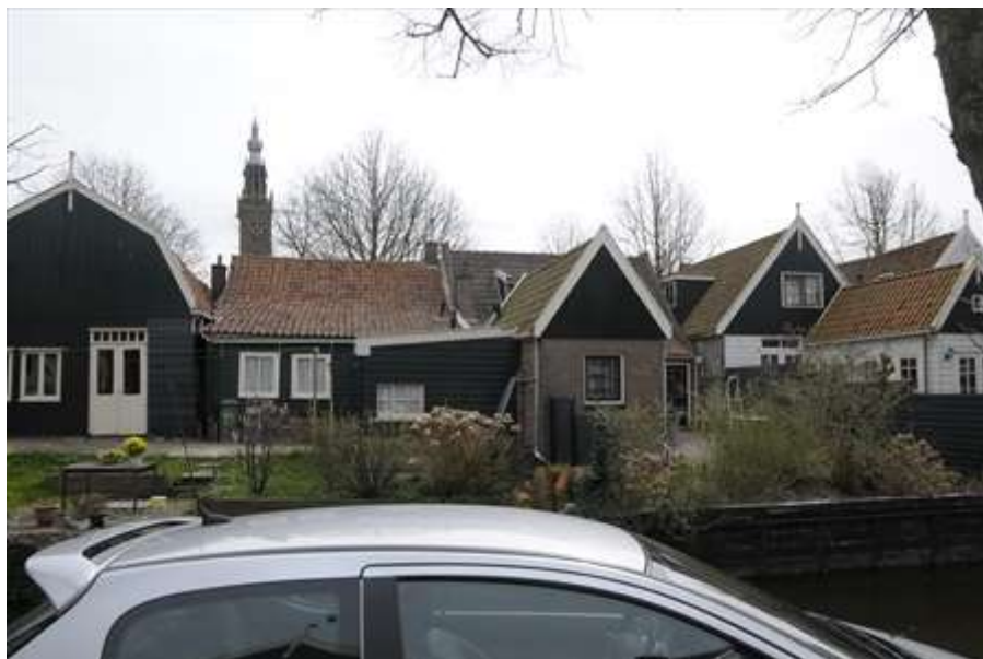
Achterzijde van het complex.