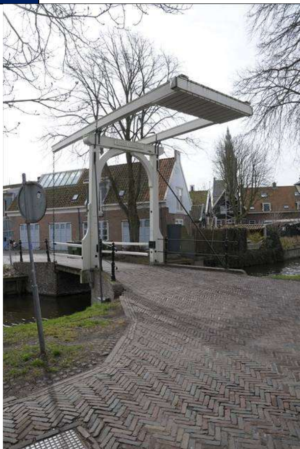
Hakkelaarsbrug vanaf het Bagijnenland.