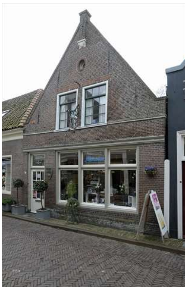
Voorgevel van Kleine Kerkstraat 3.