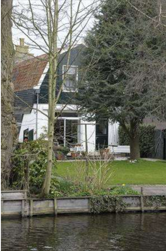
Zicht op de achtergevel van het pand, gezien vanaf de Schepenmakersdijk.