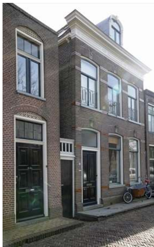
Zicht op de oostelijke zijgevel van het pand.