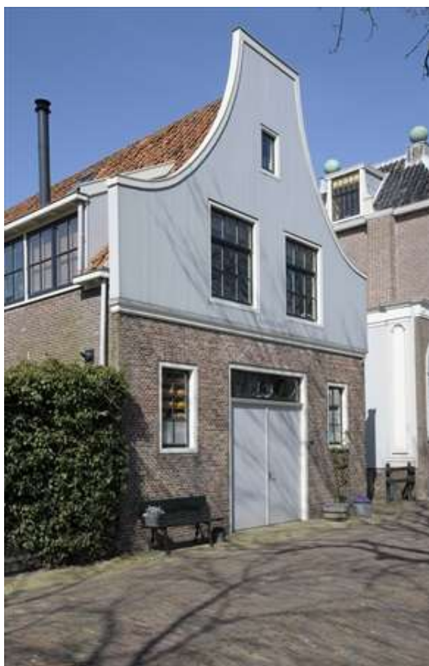
Voorgevel van het pand aan de Nieuwehaven.