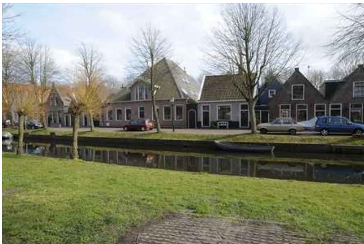
Situering van de stomp aan de Voorhaven.