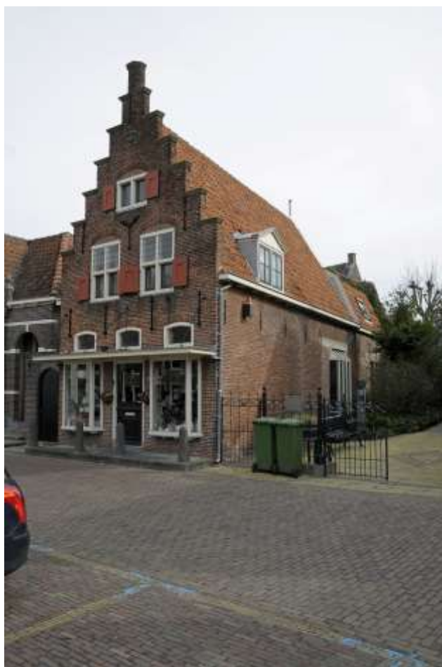
Voorgevel van Jan Nieuwenhuizenplein 8.