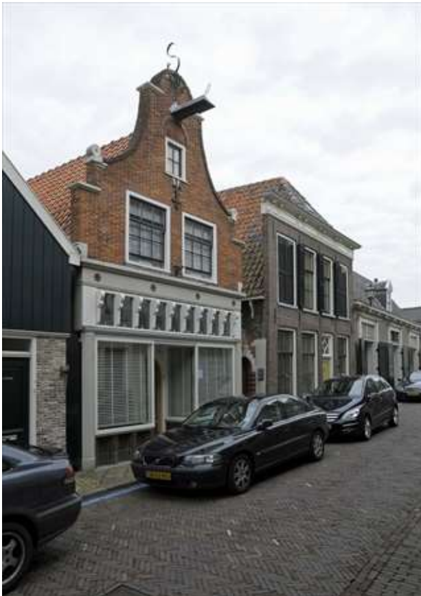
Overzicht van de ligging van het pand in de noordelijke gevelwand van de Lingerzijde.