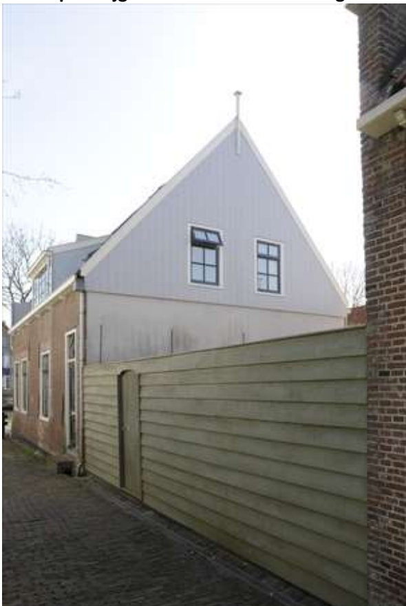
Achtergevel van het pand, gezien vanuit de Pereboomsteeg.