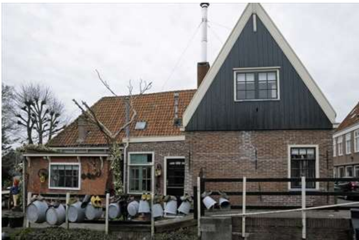
Oostelijke zijgevel van het pand aan de zijde van de Pompsluis.