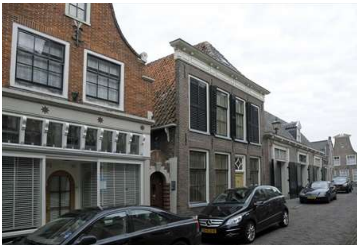
Overzicht van de noordelijke gevelwand van de Lingerzijde.