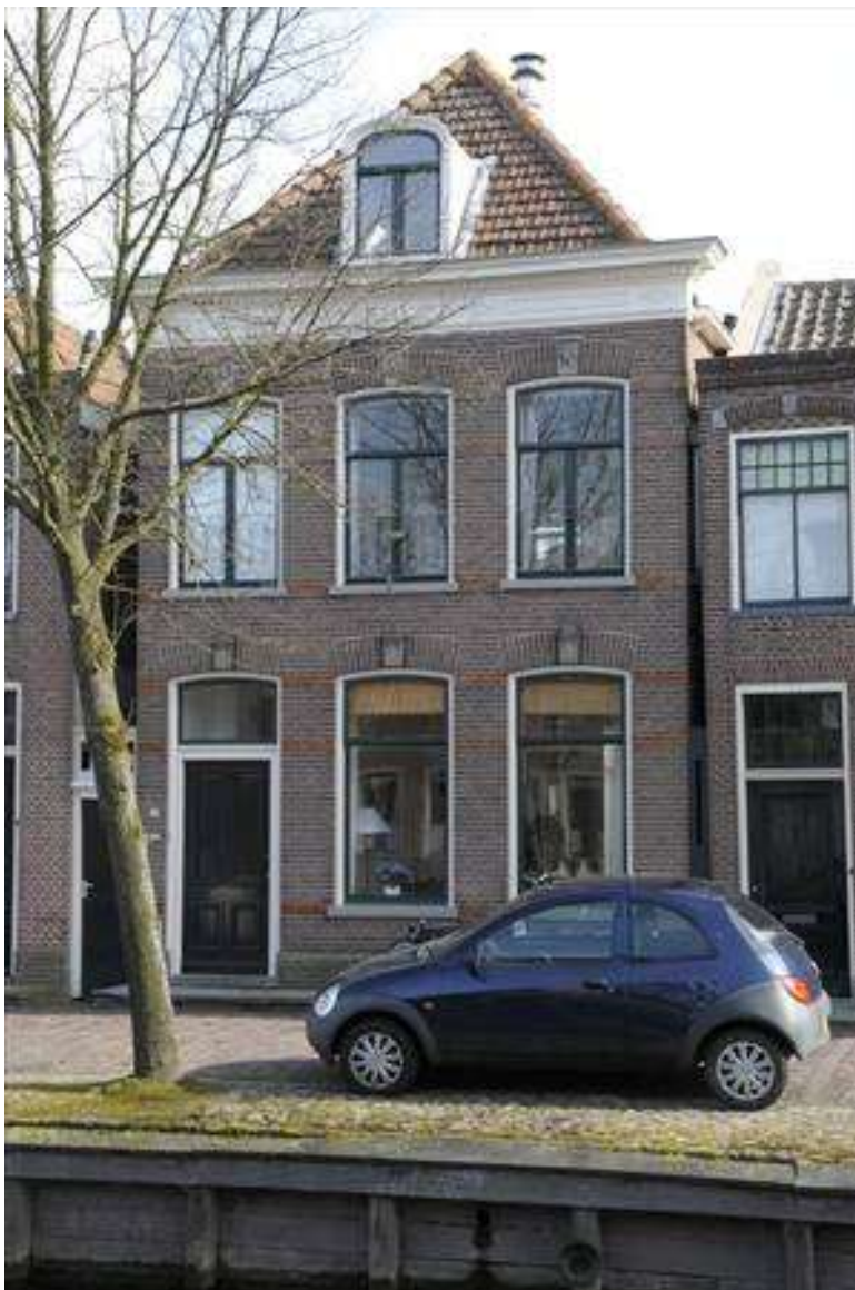
Voorgevel van Voorhaven 73.