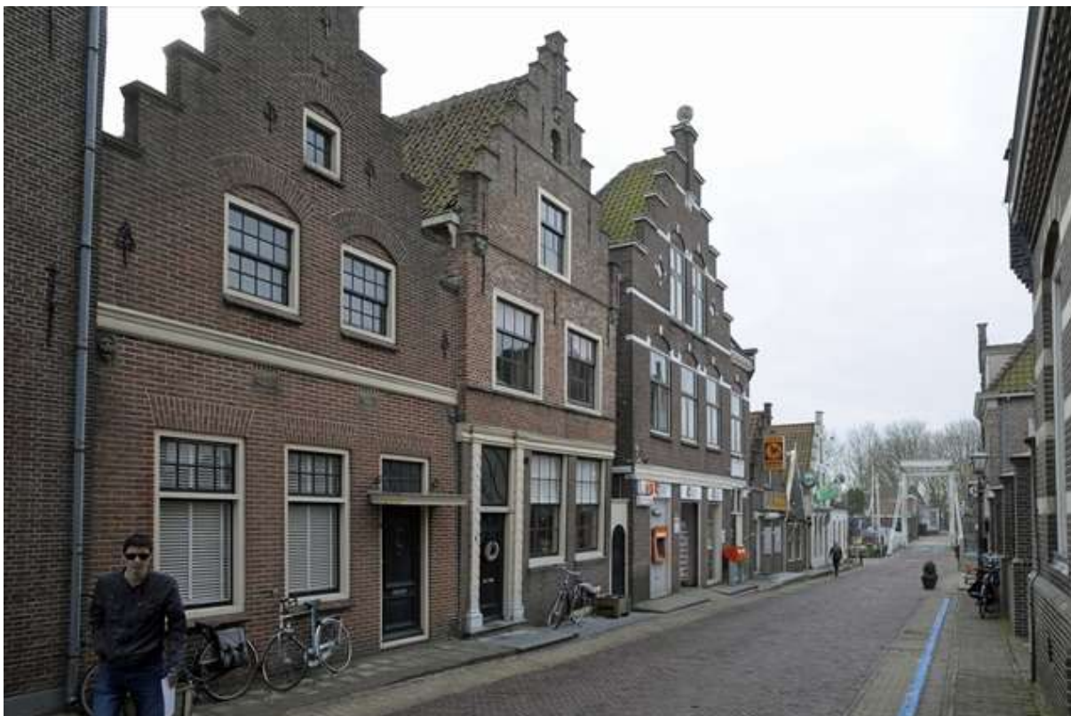
Overzicht van de situering van het pand in de Hoogstraat.