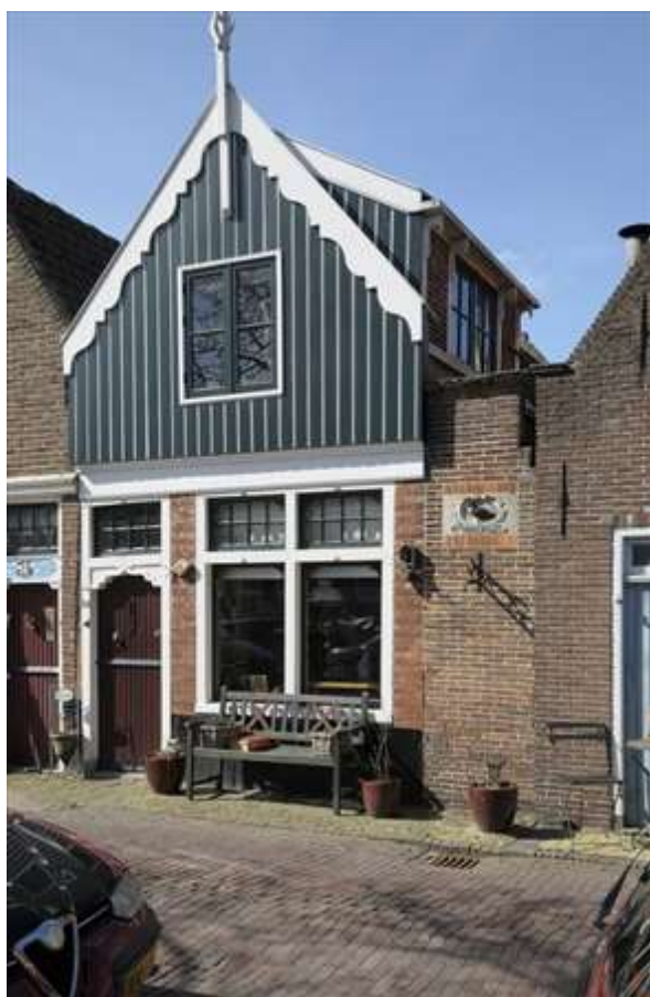
Voorgevel van Nieuwehaven 38.