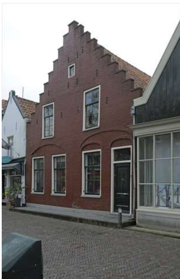
Voorgevel van Keizersgracht 3.