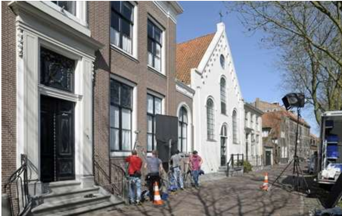
Overzicht van de ligging van de kerk aan de Nieuwehaven.