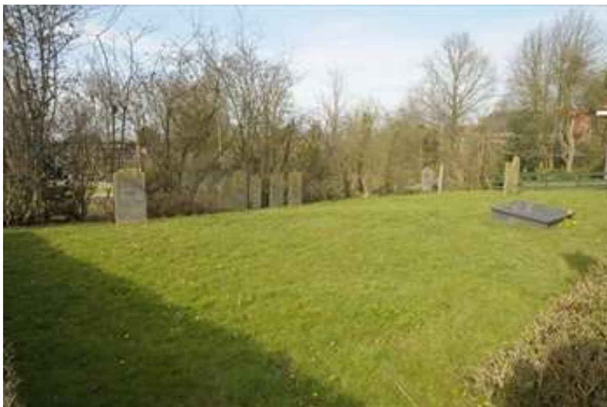
Joodse begraafplaats bij Oorgat 110.