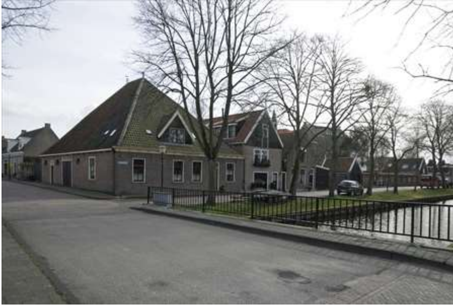
Overzicht van de ligging van het gebouw aan de Achterhaven.