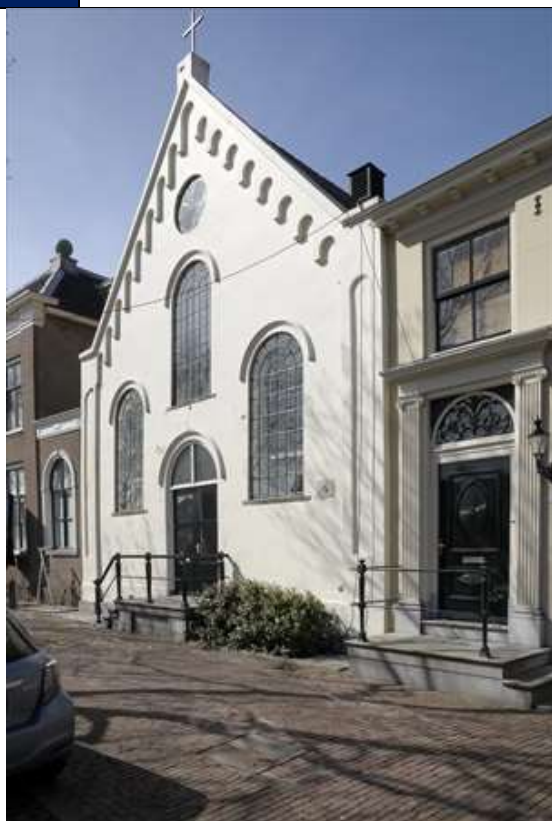
Voorgevel van het voormalige kerkgebouw aan de Nieuwehaven.