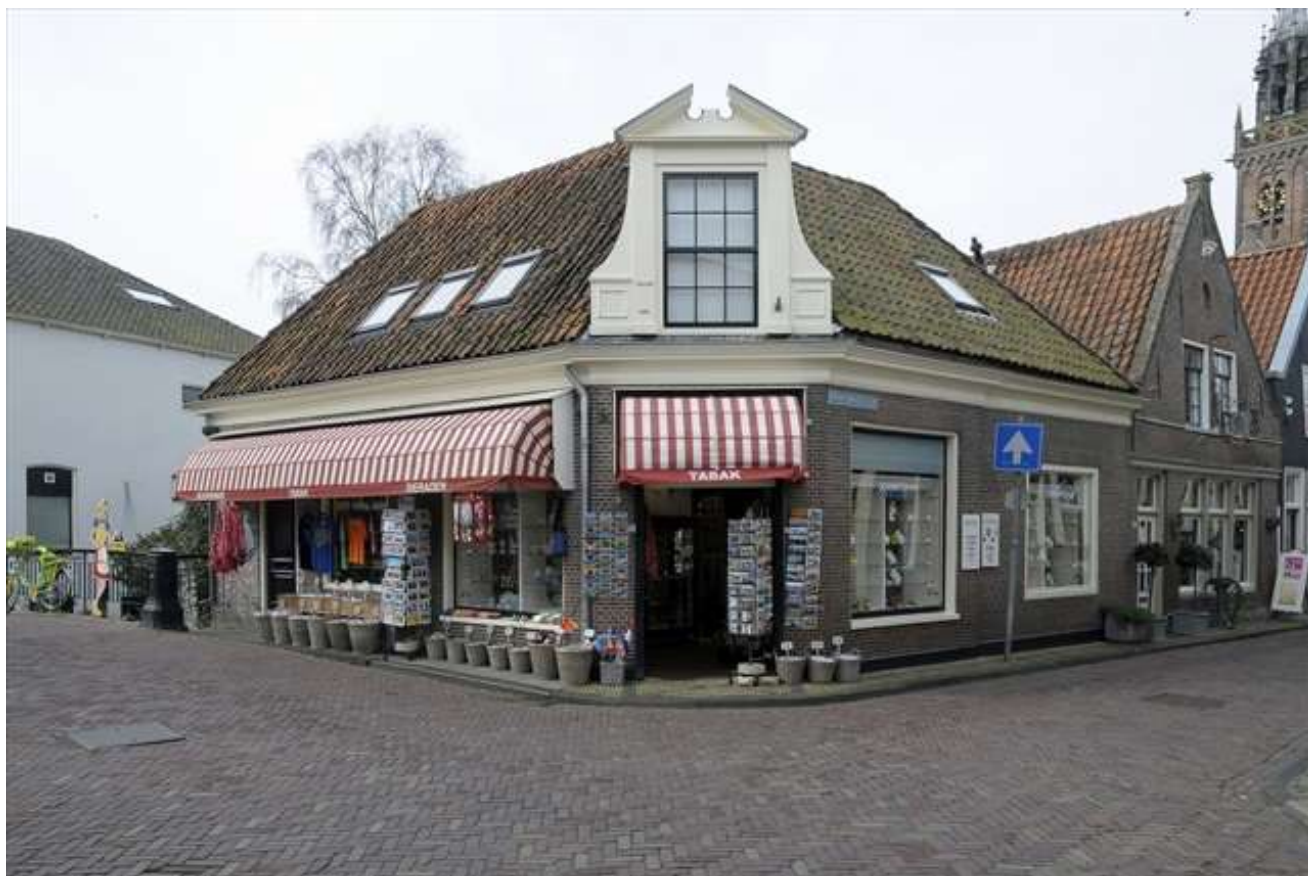
Kleine Kerkstraat 1 op de hoek van de Spuistraat.