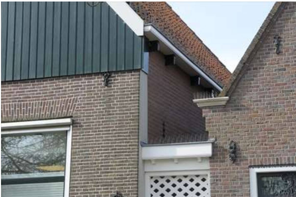
Zicht op de rechter zijgevel van het pand.