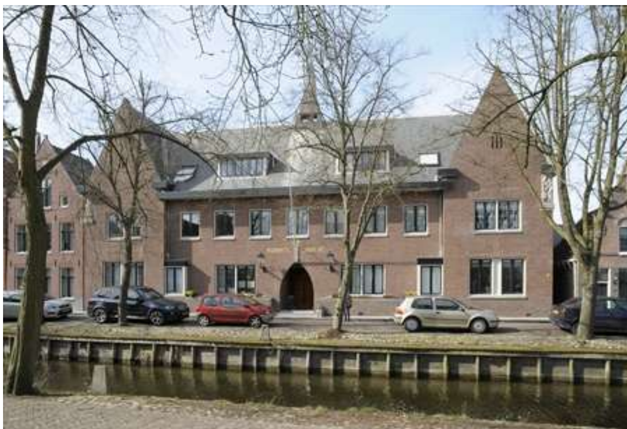
Voorgevel van Voorhaven 158.