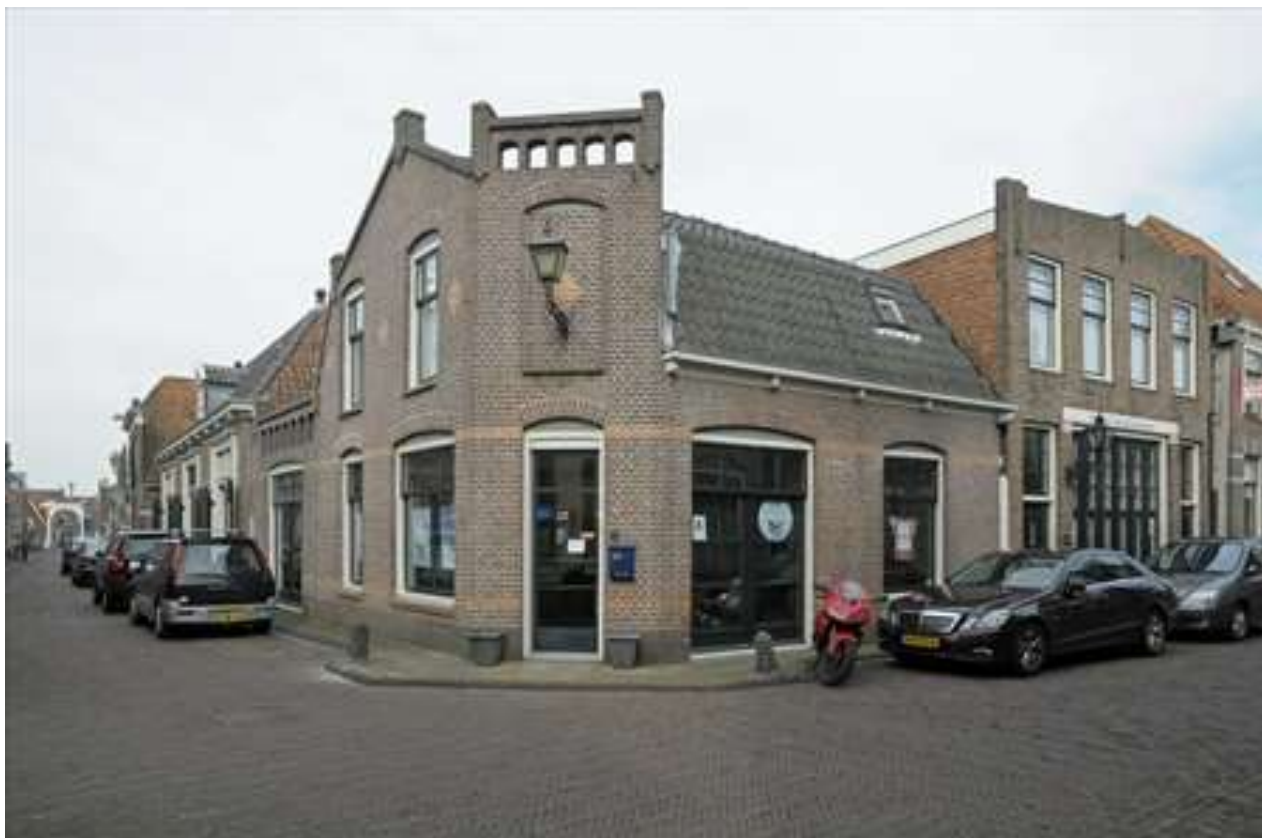
Overzicht van de bocht in de Lingerzijde.