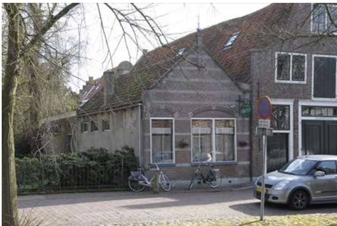
Voorgevel en zijgevel van Voorhaven 125.