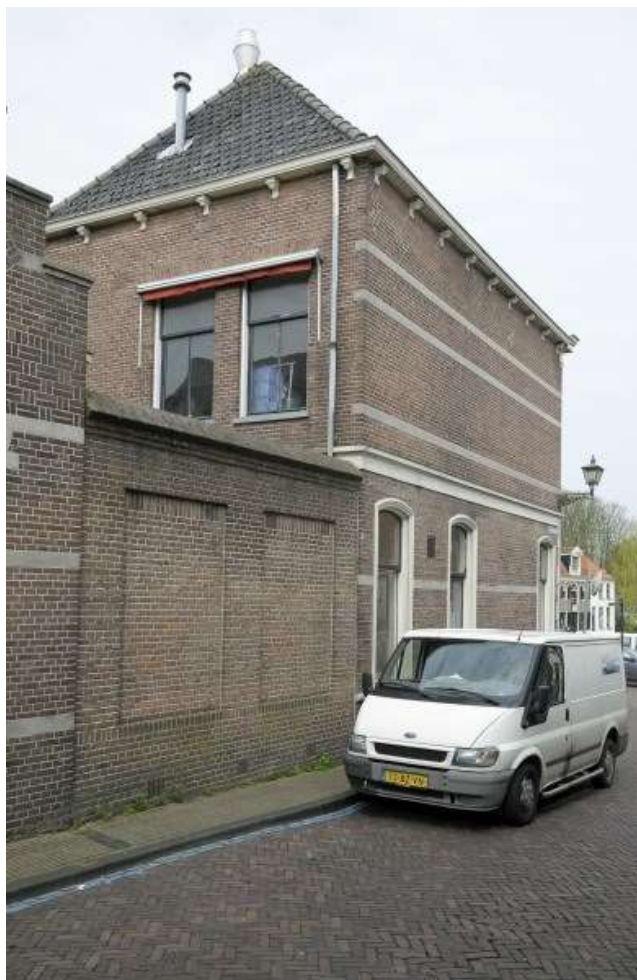
Achter- en zijgevel aan de Prinsenstraat.