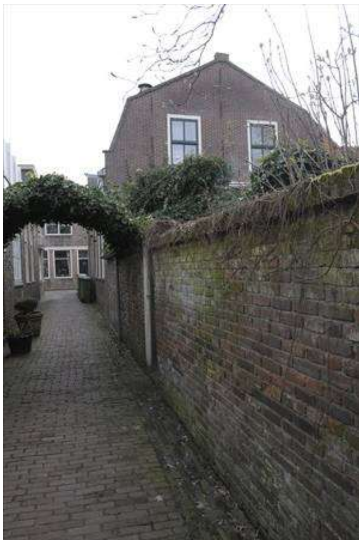
Achtergevel vanuit de Molensteeg.