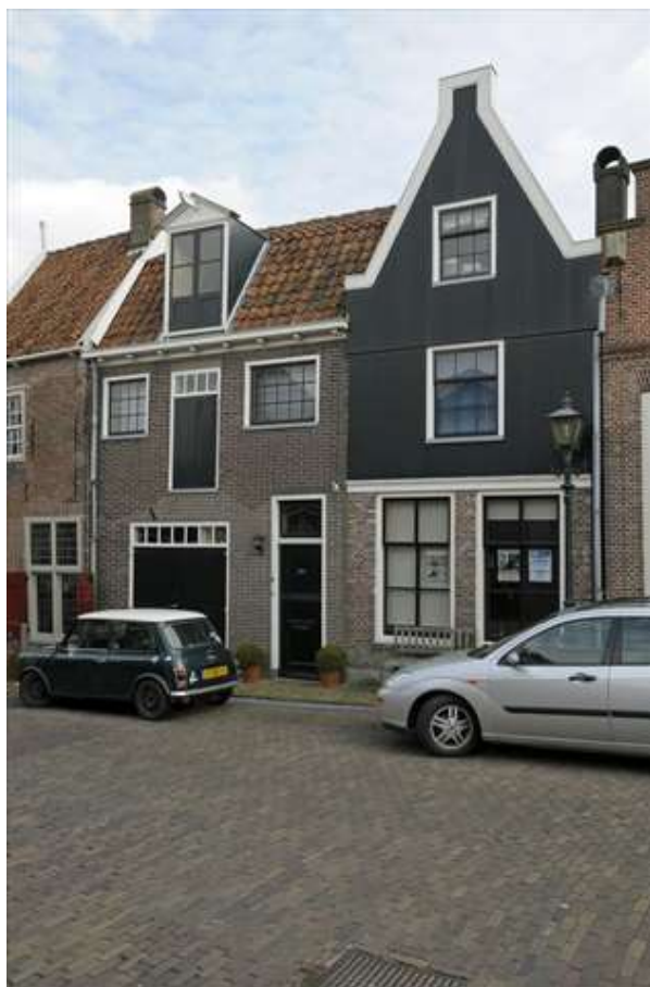
Voorgevel van Breestraat 10 rechts.