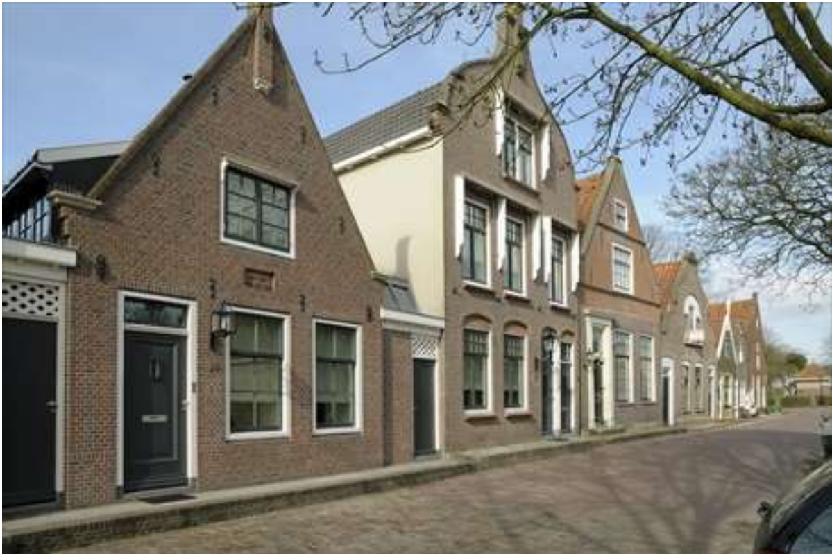
Situering van het pand in de noordelijke gevelwand van de Voorhaven.