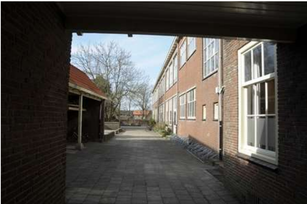
Zicht op het schoolplein aan de Voorhaven.