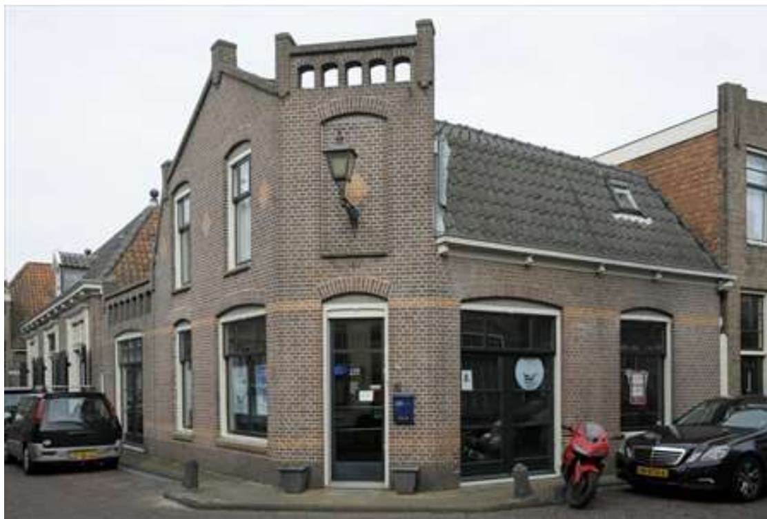
Voor- en zijgevel van Lingerzijde 34.