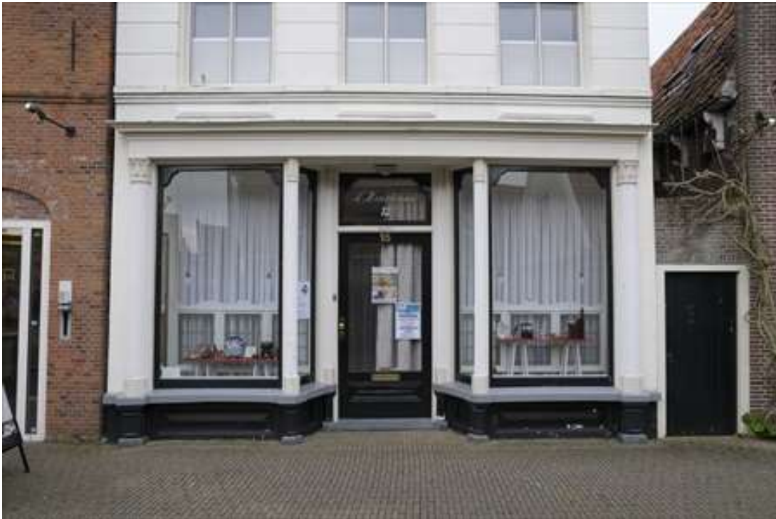
De winkelpui van Spuistraat 15.