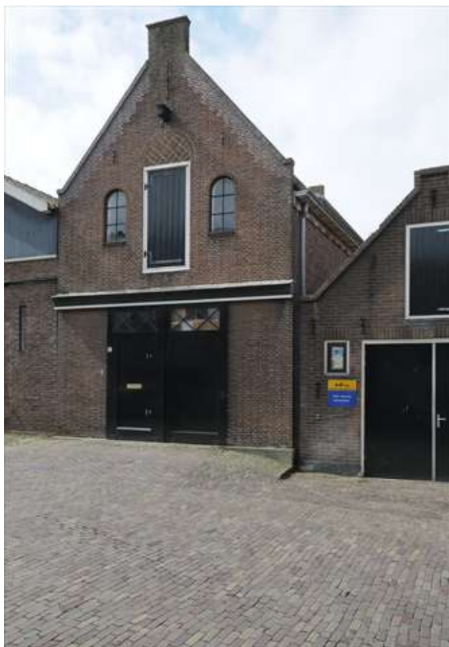
Voorgevel van het voormalige pakhuis aan de Breestraat.