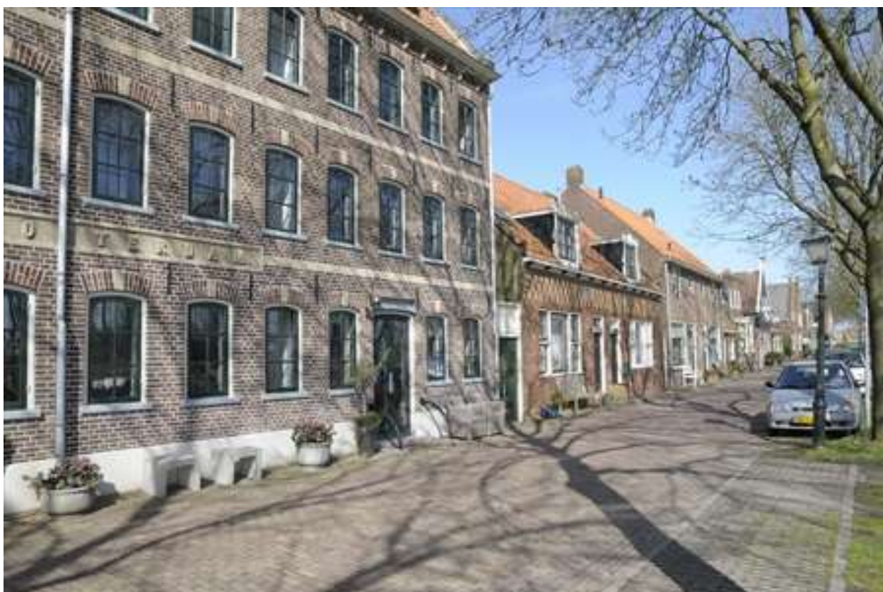
Overzicht van de ligging van het pand aan de Nieuwehaven.