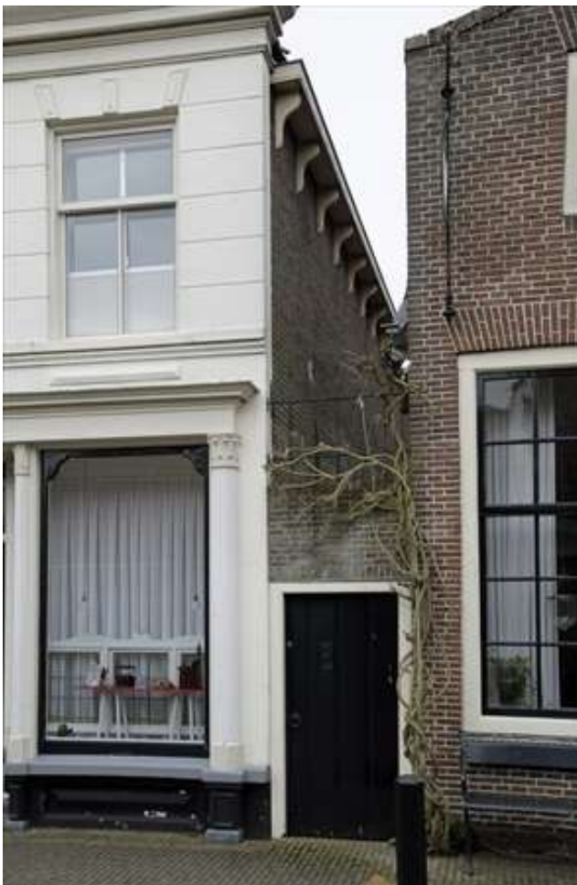
Zicht op het steegje en de rechter zijgevel van het pand.