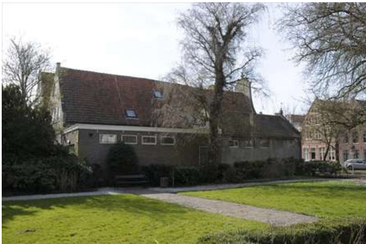
Zij- en achtergevel van Voorhaven 125.