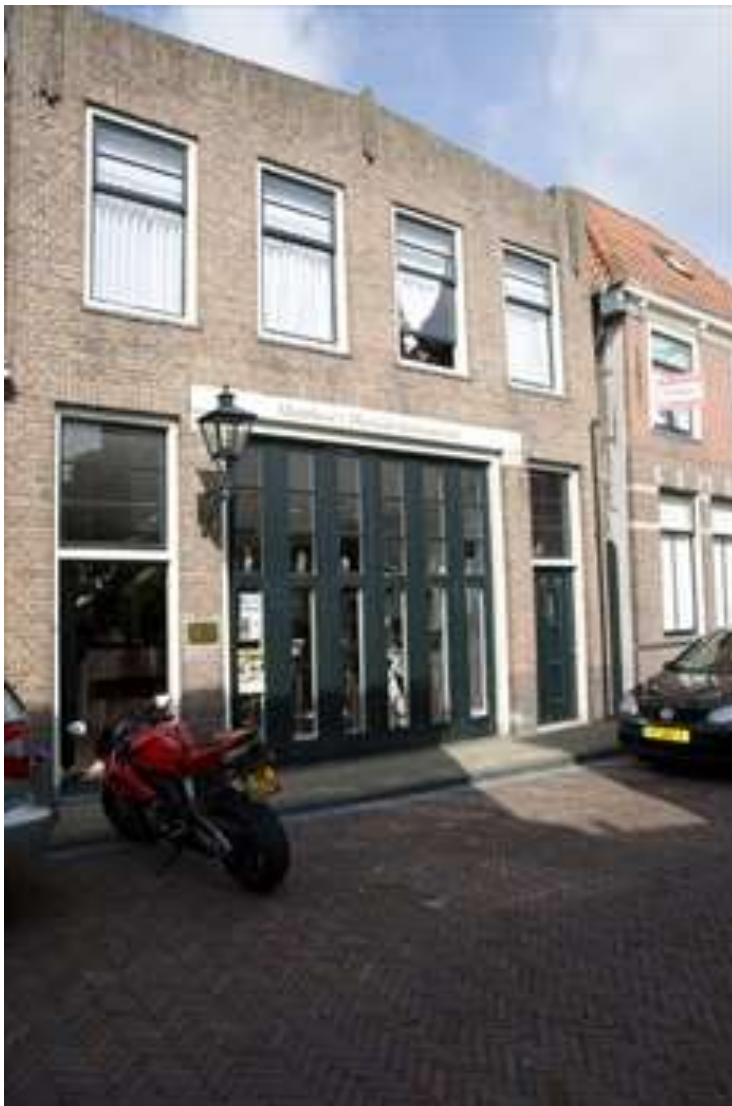
Voorgevel van de voormalige garage.