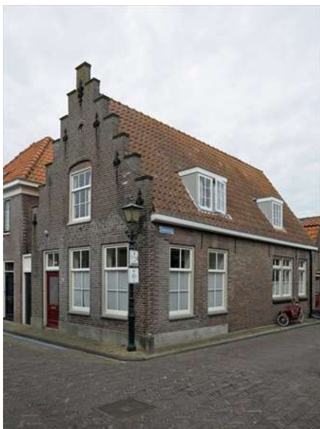
Vorgevel van het pand op de hoek van de Lingerzijde en Smeesteeg.