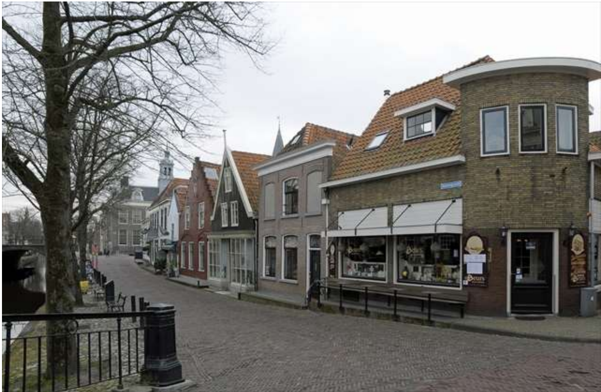
Overzicht van de ligging van het pand aan de Keizersgracht.