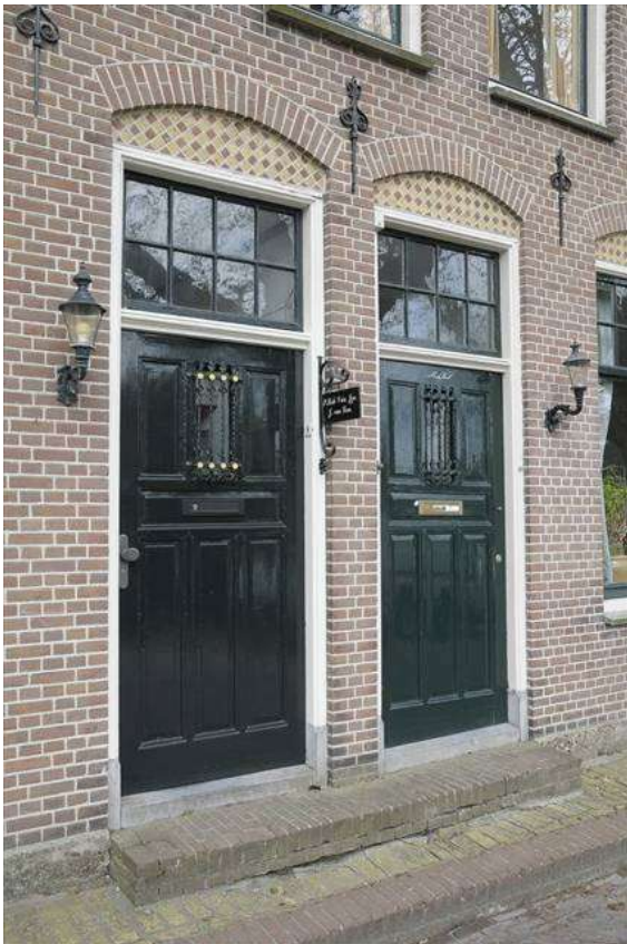
Detail van de twee deuren in de voorgevel.