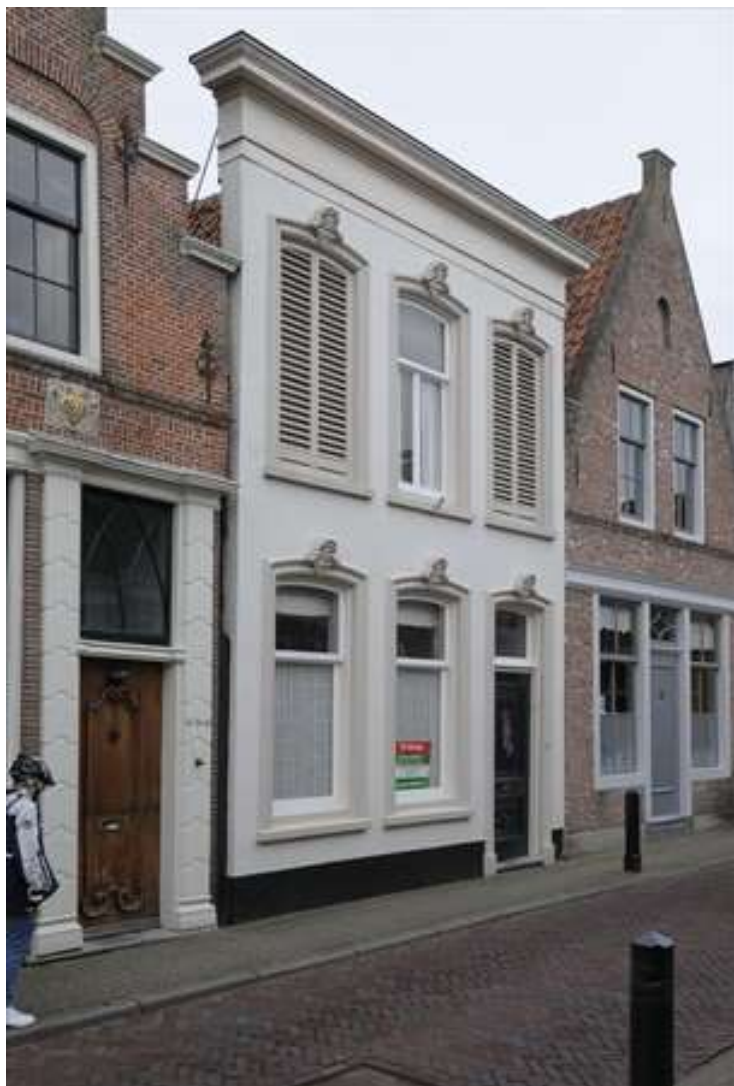
Voorgevel van Spuistraat 21.