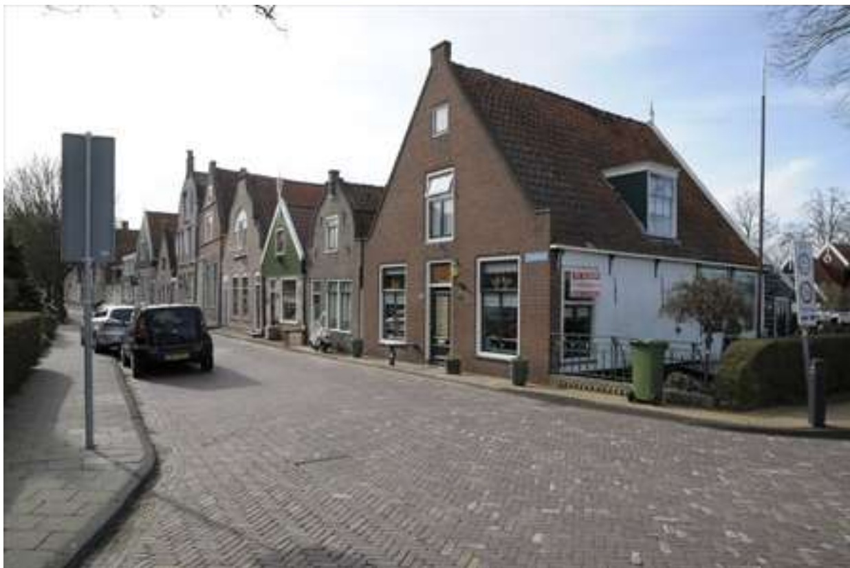
Ligging van Voorhaven 10 op de kop van de Voorhaven.