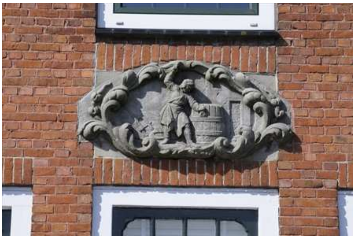
Detail van de gevelsteen in de gevel van het middelste woonhuis met een verwijzing naar het ambacht van de kuiper.