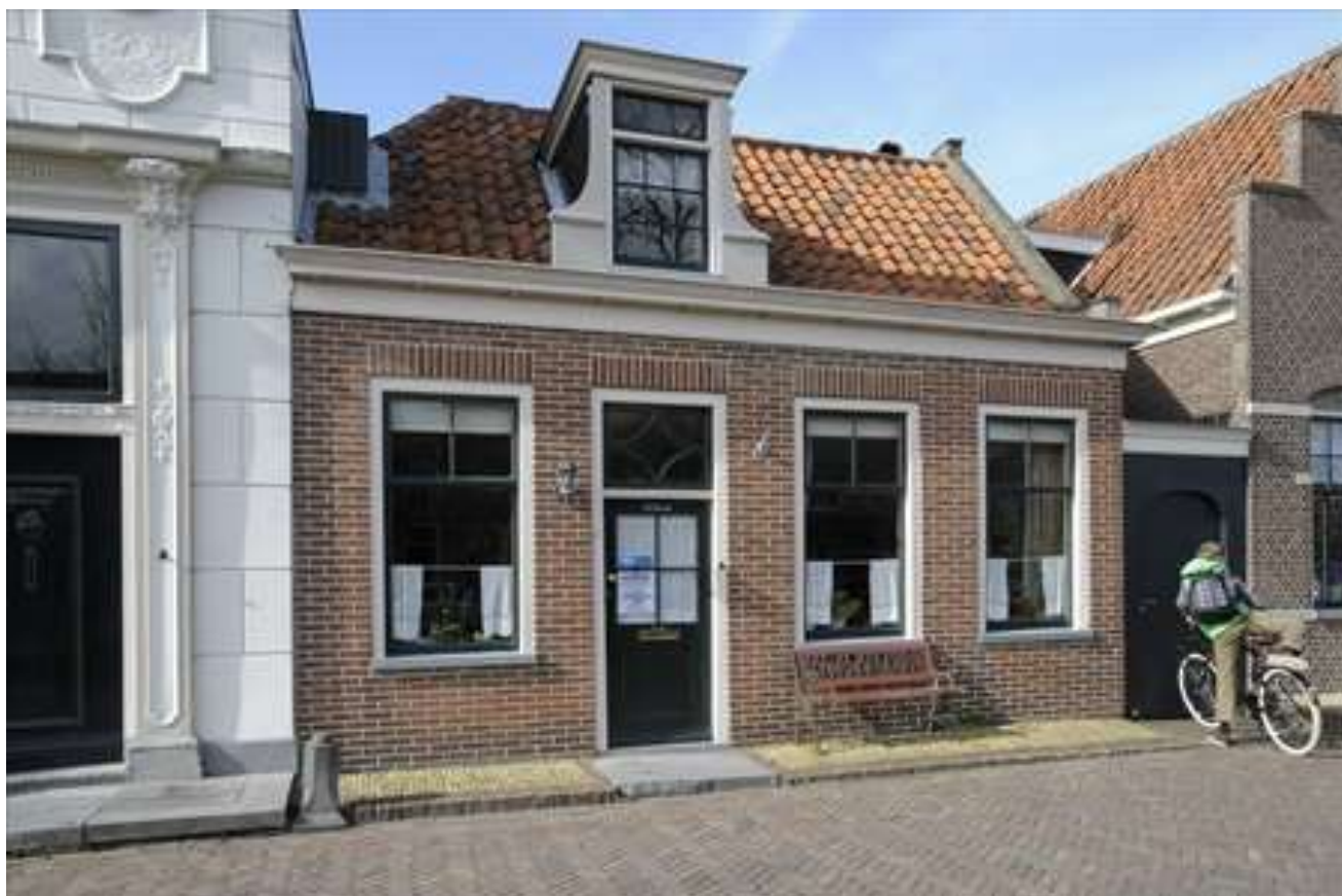
Voorgevel van Voorhaven 106.