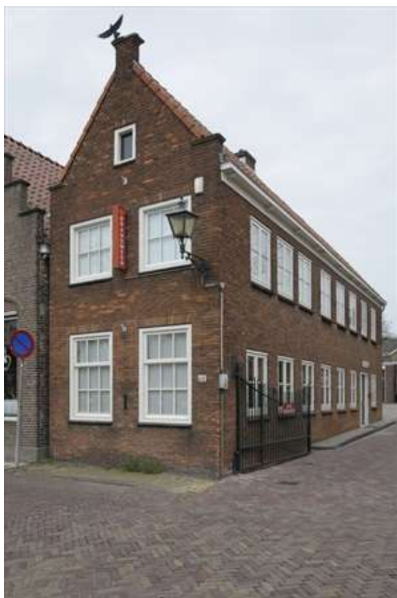
Voorgevel van Nieuwehaven 68a.