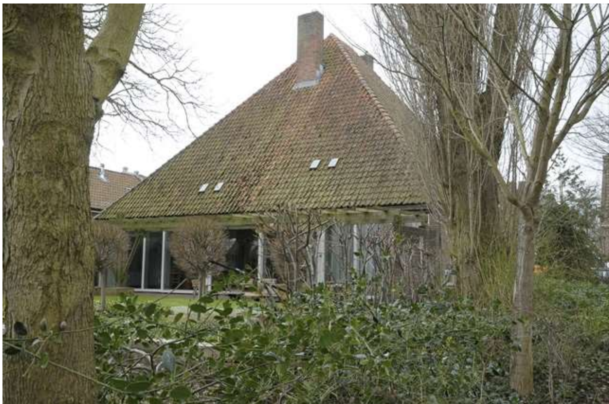
Overzicht van de achtergevel van de voormalige stadsboerderij.