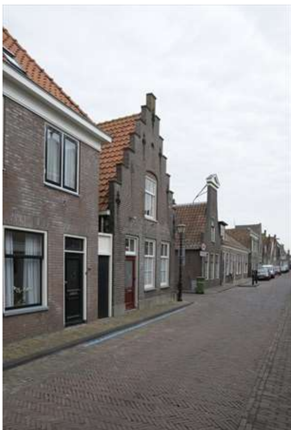
Overzicht van de Lingerzijde met de situering van het pand op de kruising met de Smeesteg.