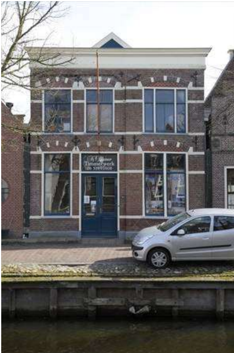
Zicht op de voorgevel vanaf de overzijde van de Voorhaven.