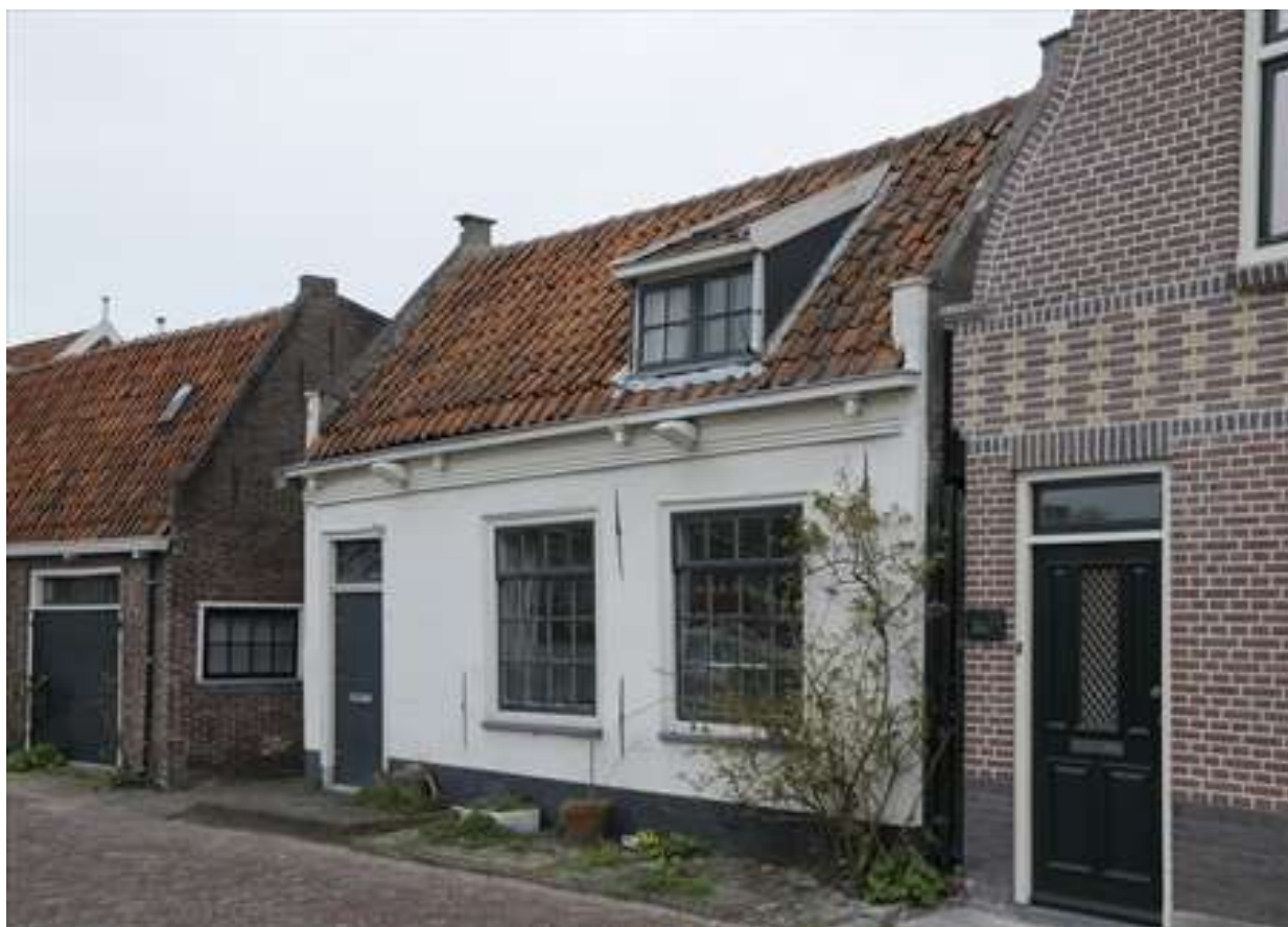
Voorgevel van Nieuwehaven 75.