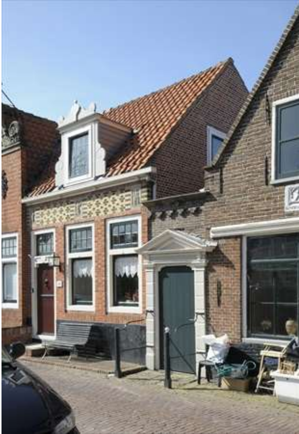
Rechterzijde van het object, met zicht op het poortje.