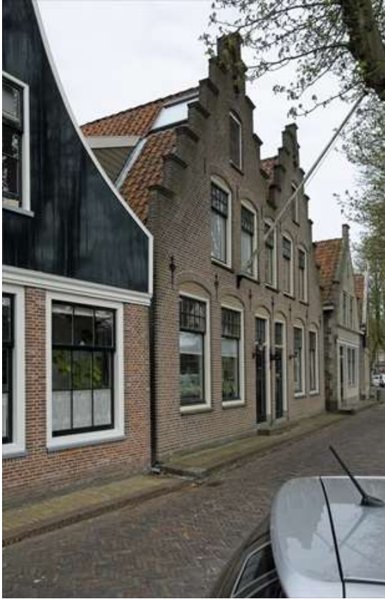
Overzicht van de ligging van het object aan de J.C. Brouwersgracht.