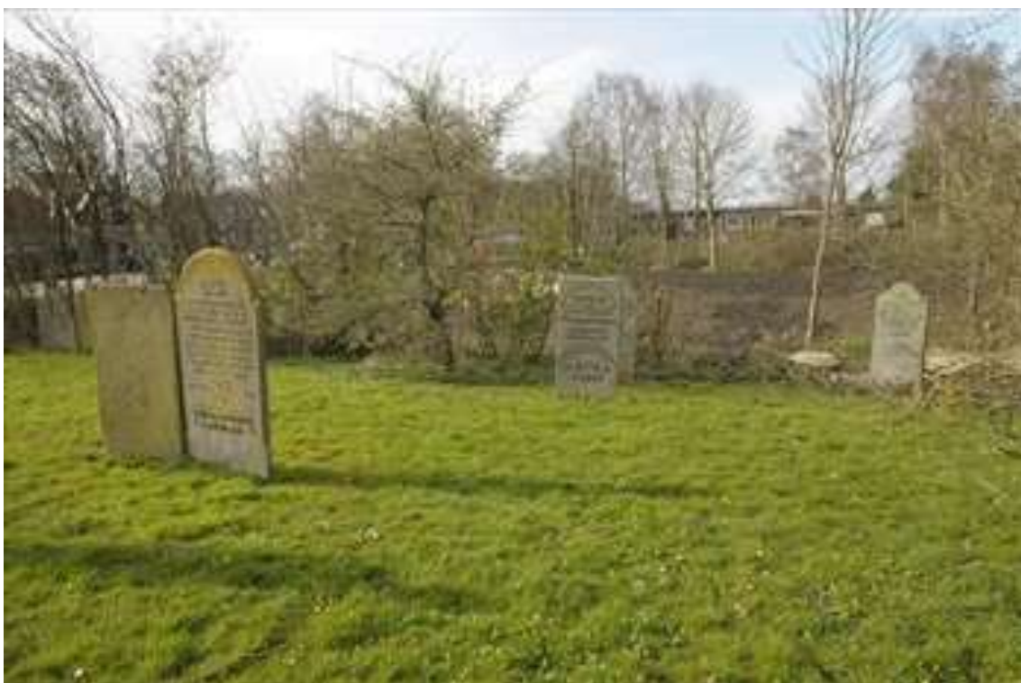
Oostelijk deel van de begraafplaats.