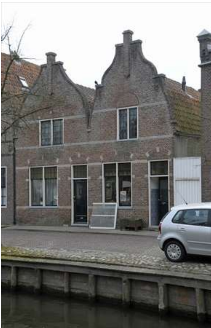
Voorgevel van Voorhaven 119 en 121.