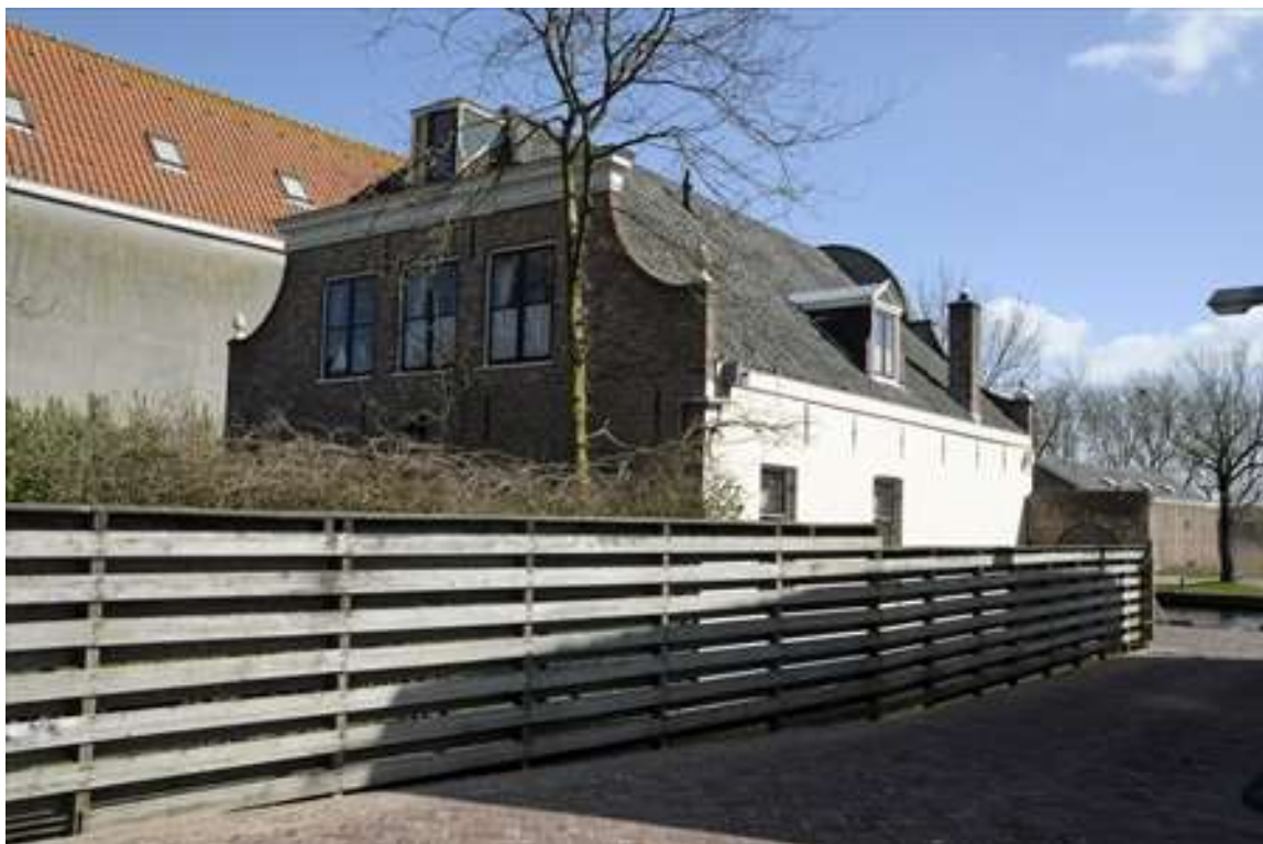
Achter- en zijgevel van Nieuwehaven 67.