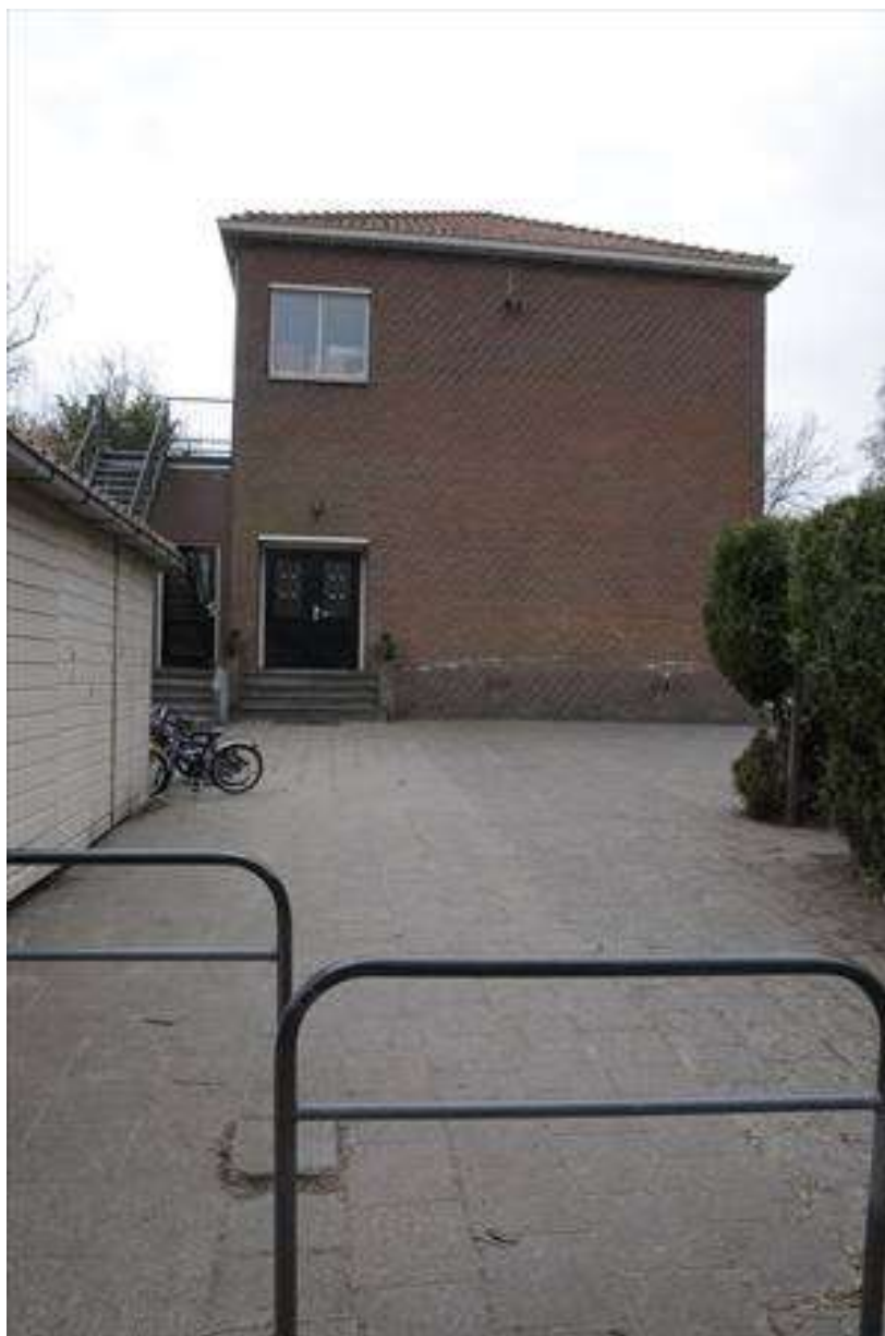
Noordelijke kopgevel, gezien vanuit de Achterhaven.