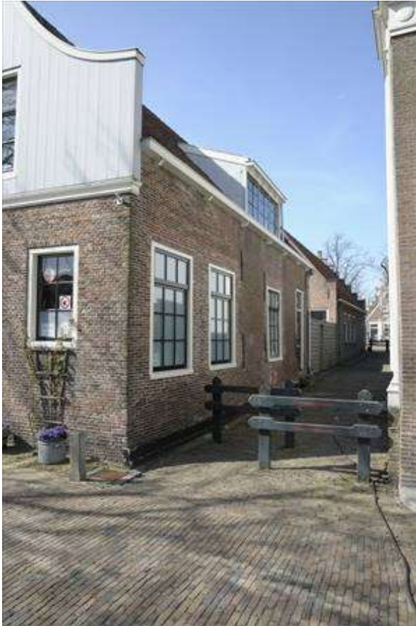
Zicht op de zijgevel in de Pereboomsteeg.