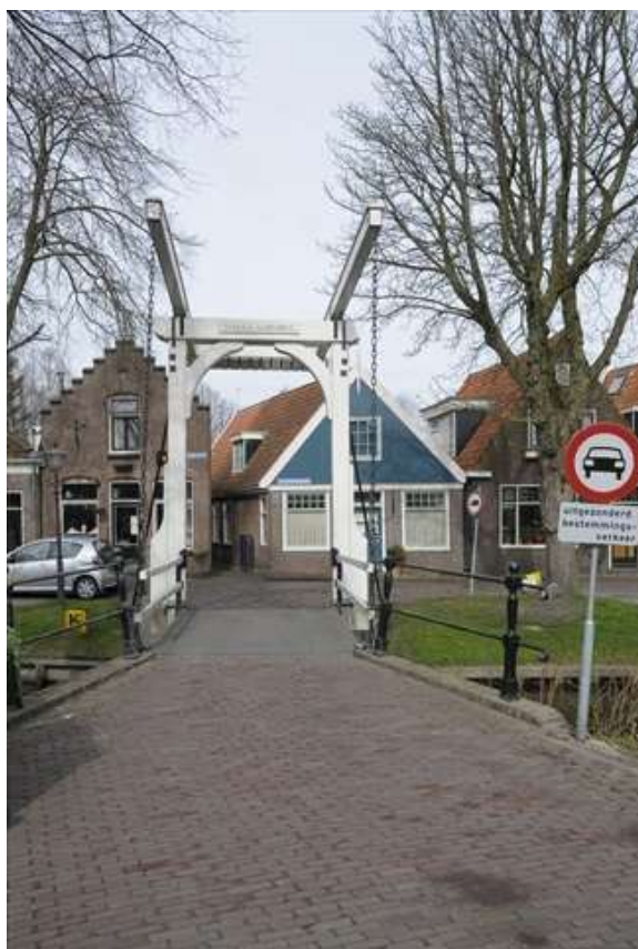
Links de brug vanuit het noorden, rechts de brug gezien vanaf de Bierkade.