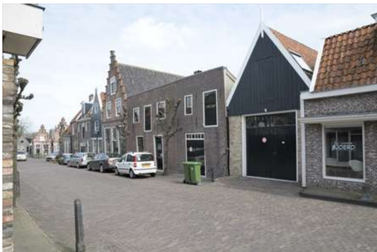
Overzicht van de situering van het voormalige pakhuisensemble in de Breestraat.