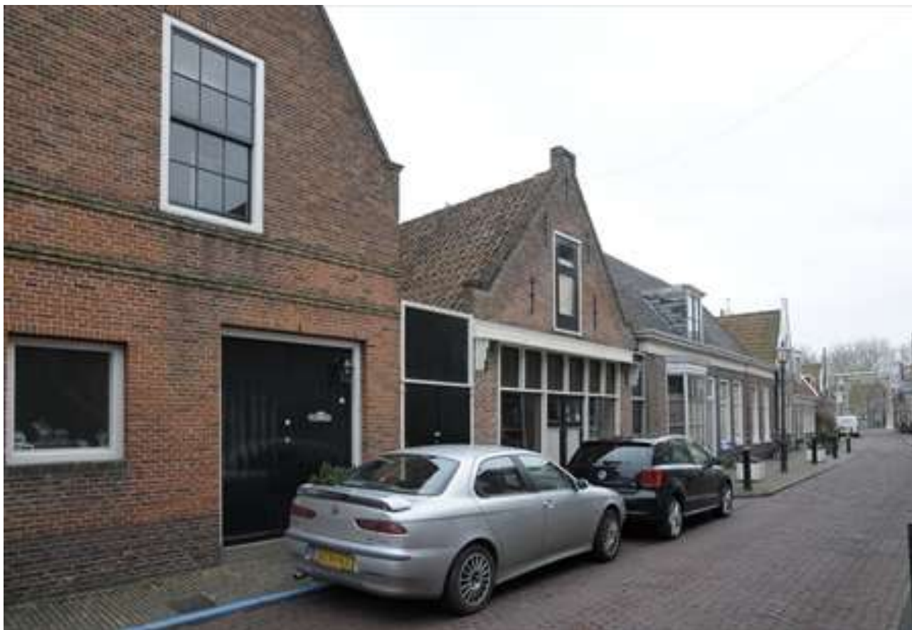
Situering van het pand in de oostelijke gevelwand van de Spuistraat.