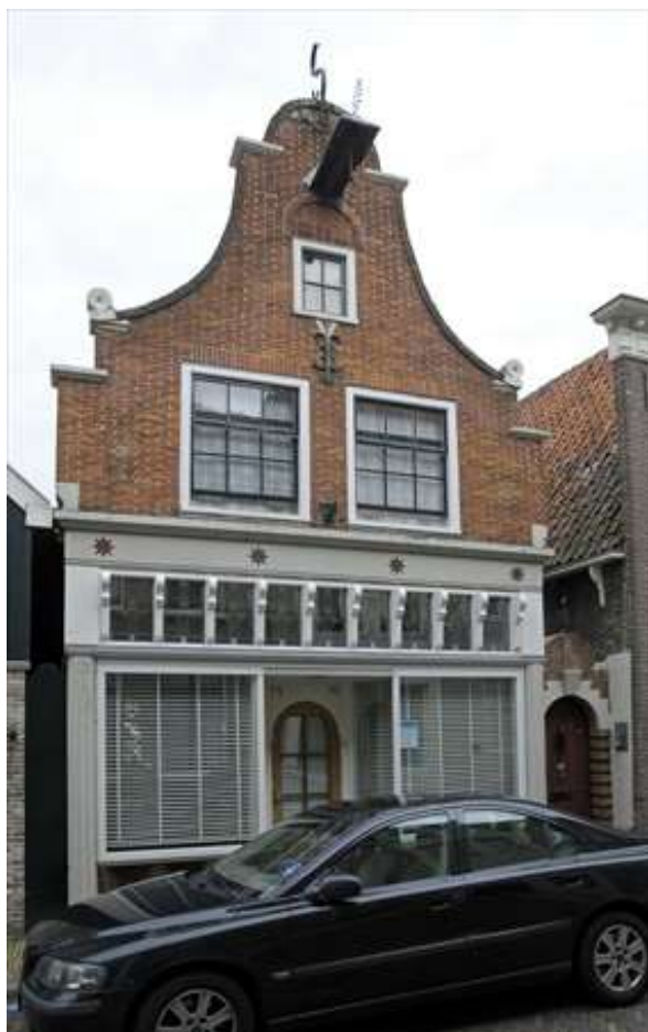
Voorgevel van Lingerzijde 40.