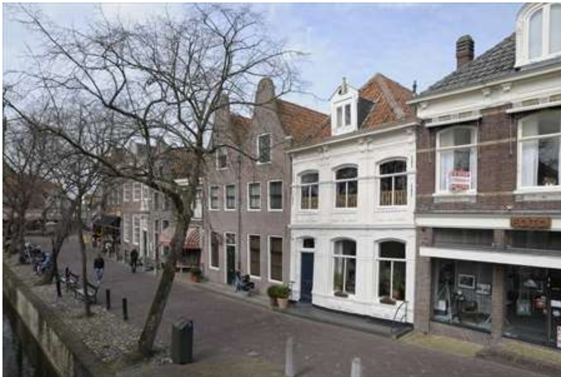
Overzicht van de gevelwand aan het Spui.