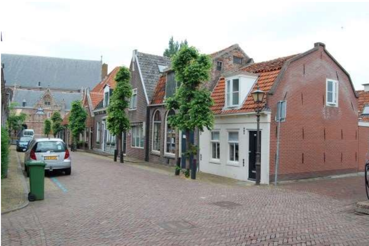
Overzicht van de oostelijke gevelwand van het eind van de Grote Kerkstraat.