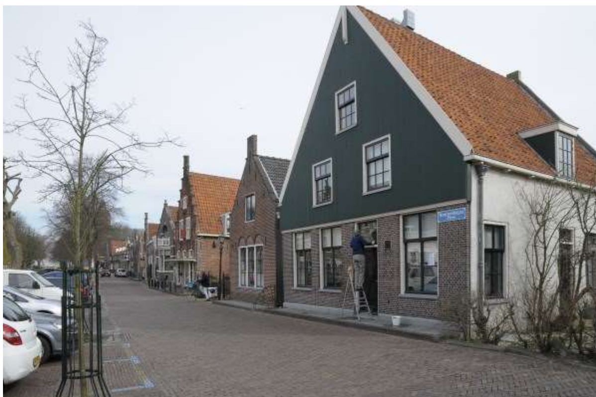
Overzicht van de oostelijke gevelwand van het Jan Nieuwenhuizenplein.