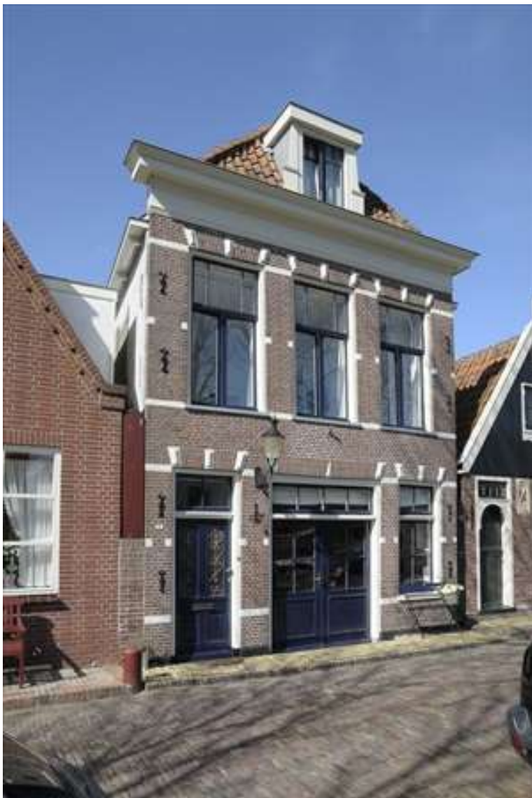
Voorgevel van Nieuwehaven 30.