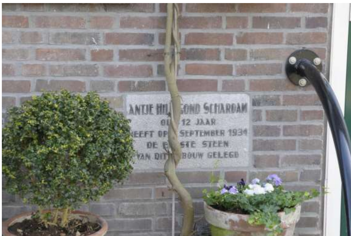
Gevelsteen met de tekst: 'Antje Hillegond Schardam oud 12 jaar heeft op 6 september 1934 de eerste steen van dit gebouw gelegd'.