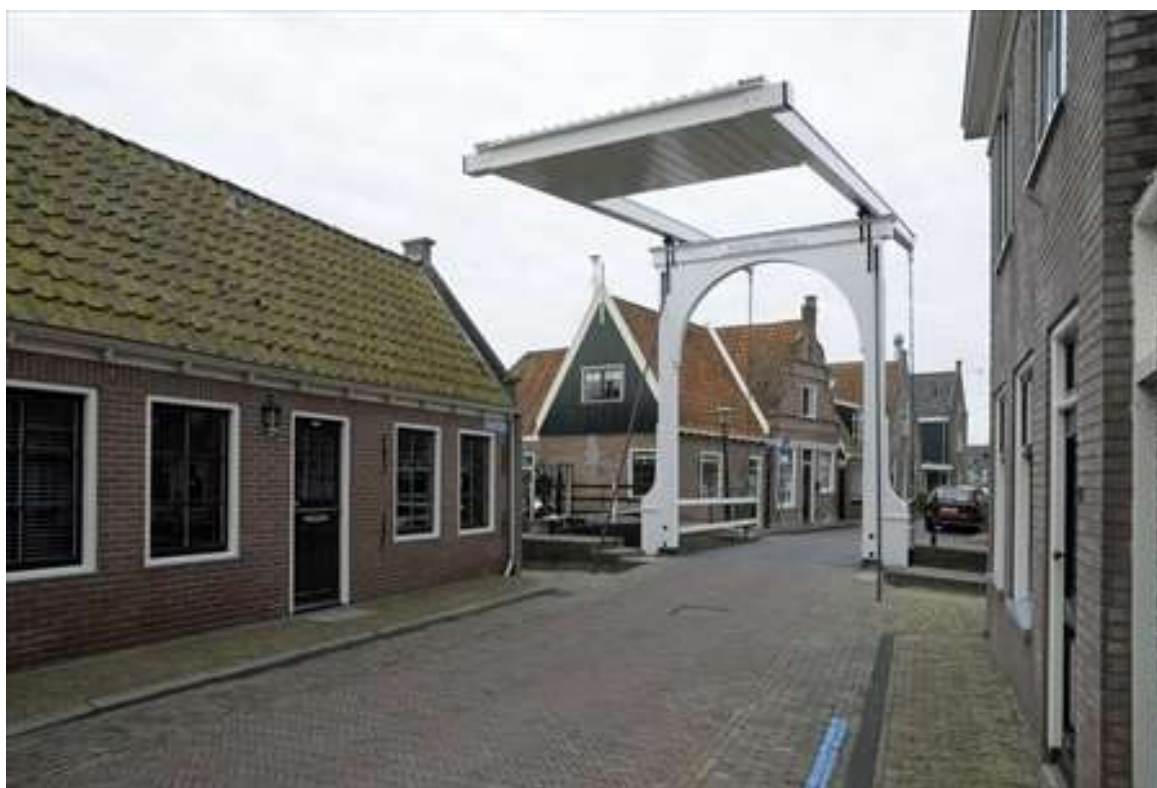
Overzicht van de ligging van het pand aan de overzijde van de Pompsluisbrug.