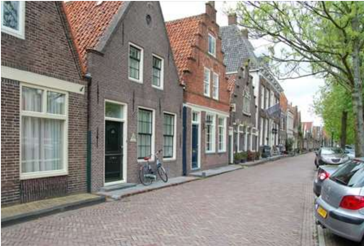
Situering van het pand in de noordelijke gevelwand van de Voorhaven.