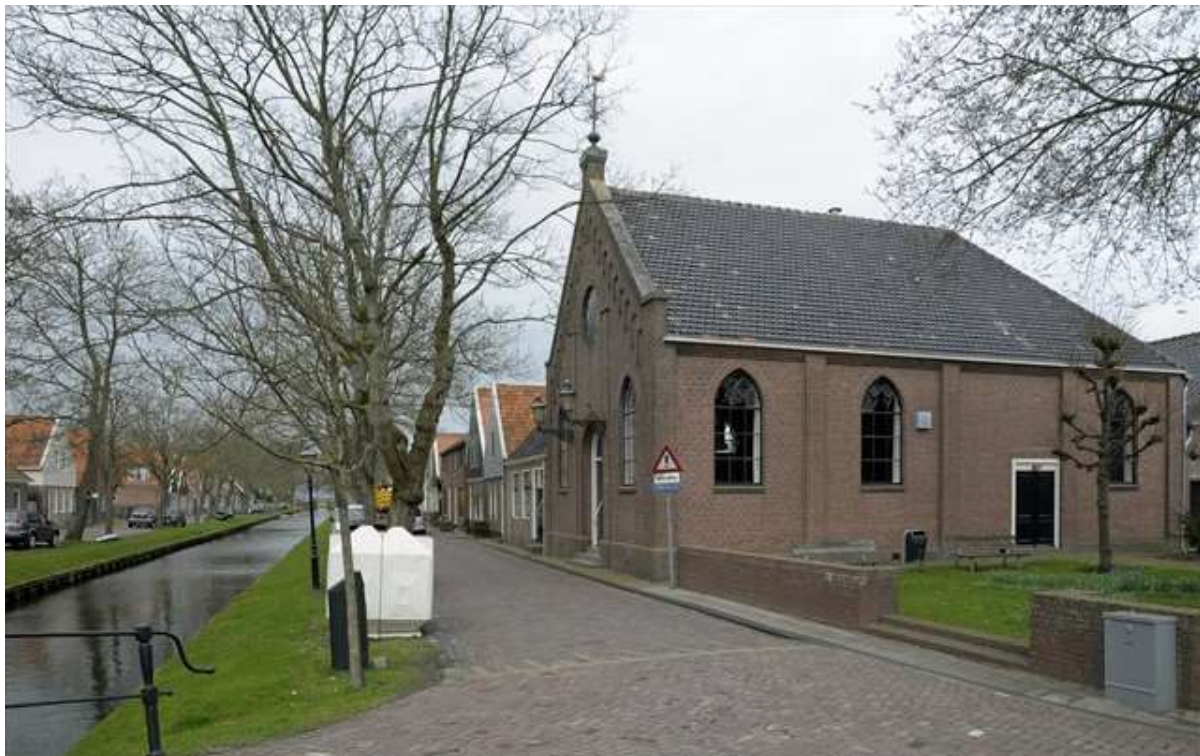
Ligging van de kerk op de hoek van het Groenland en de Achterhaven.