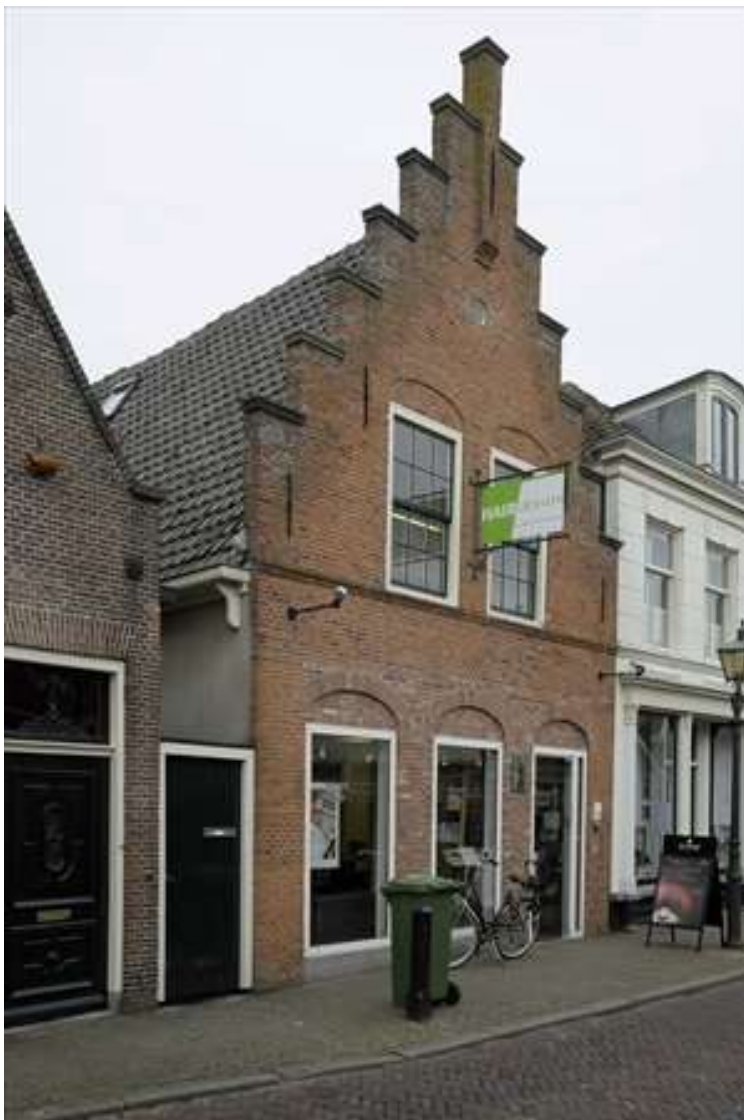
Voorgevel van Spuistraat 13.