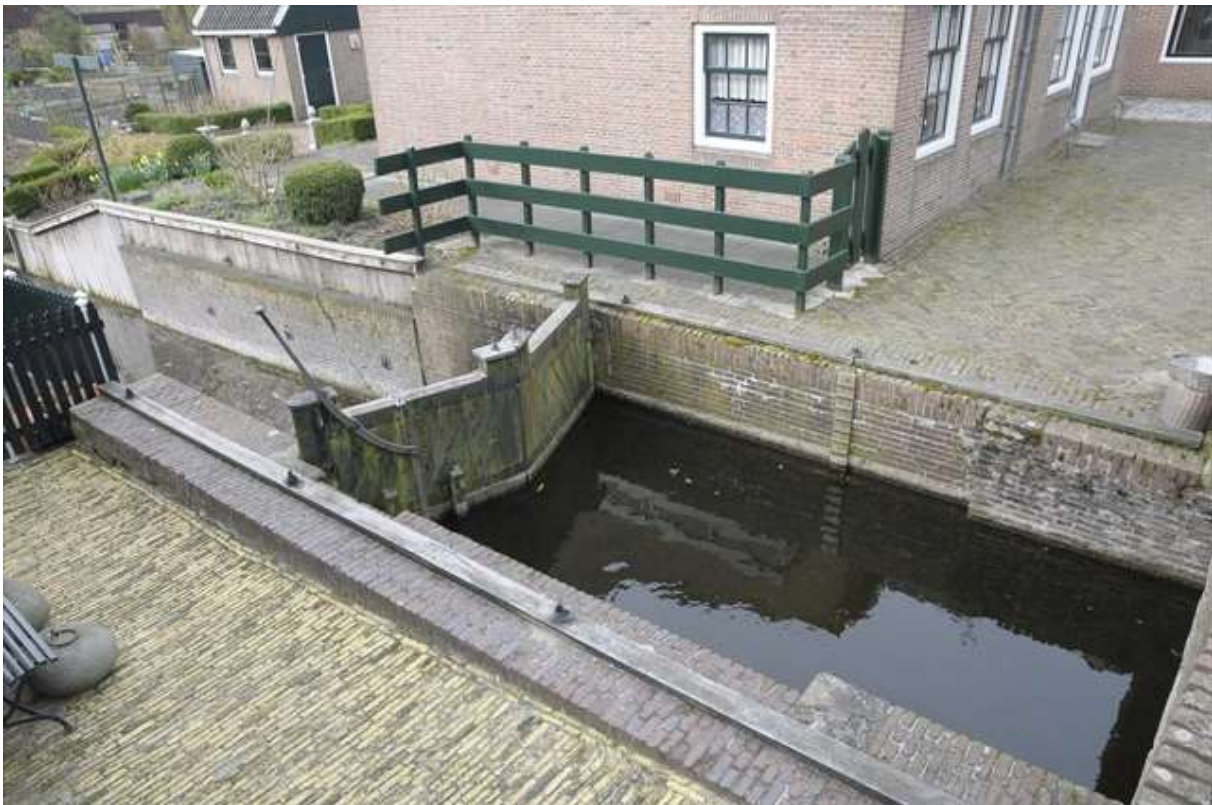
Het zuidelijke deel van de sluiskolk.