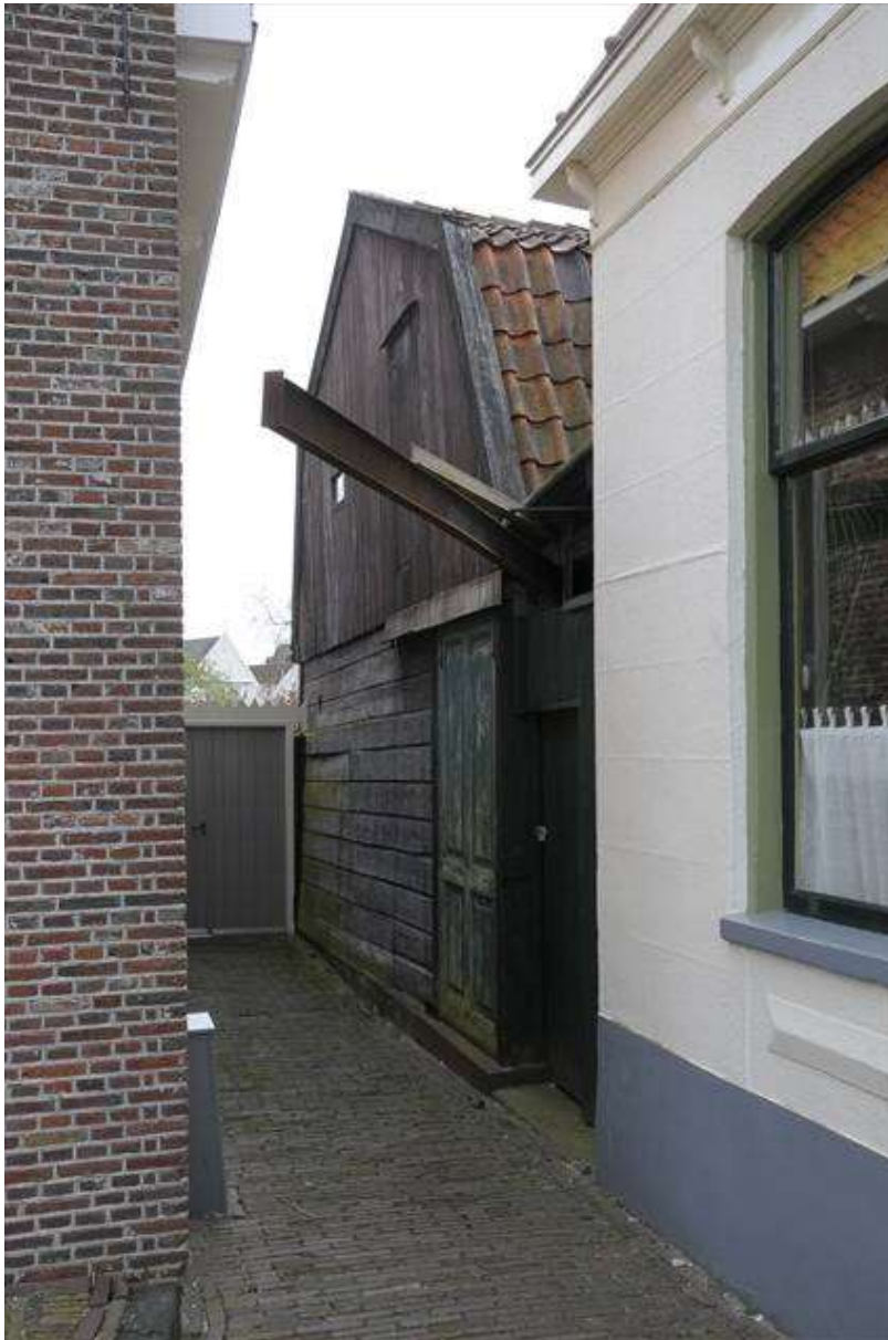
Eén van de loodsen, gezien vanuit de Lingerzijde.