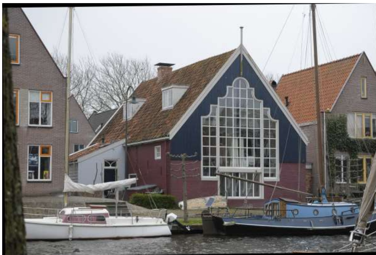
Voorgevel van het atelier aan de Baandervesting.