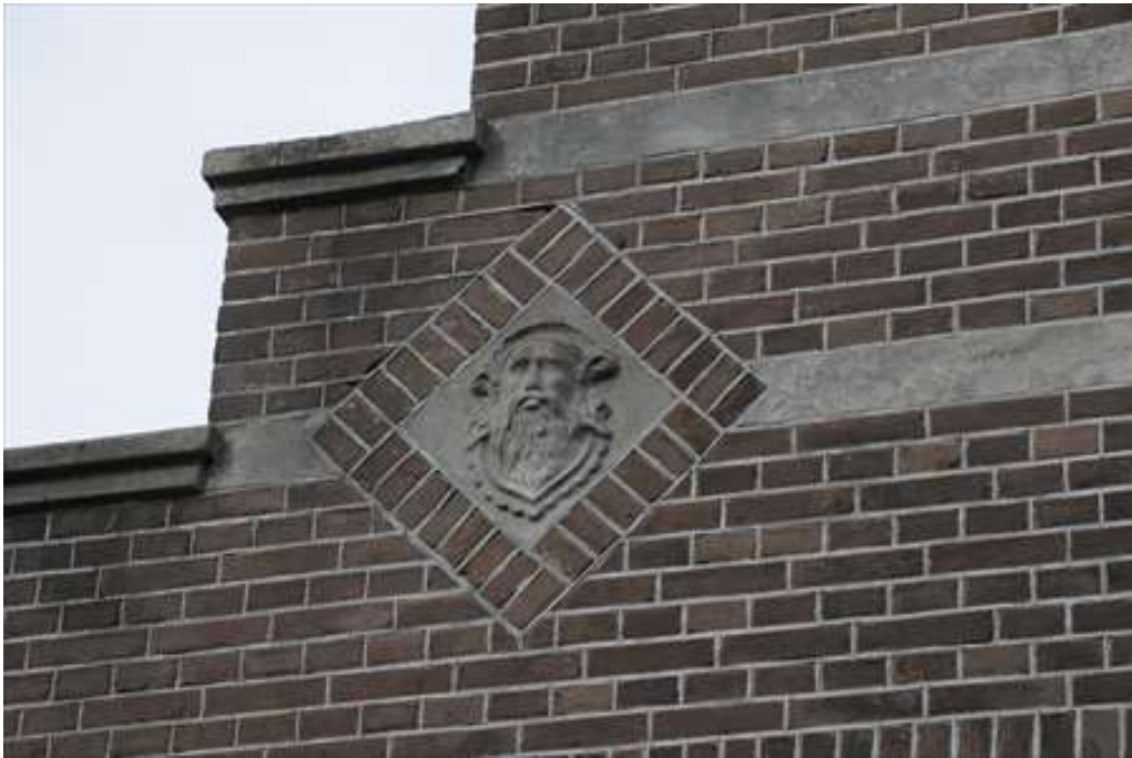
Detail van de decoratie in ruitvorm links in de voorgevel.