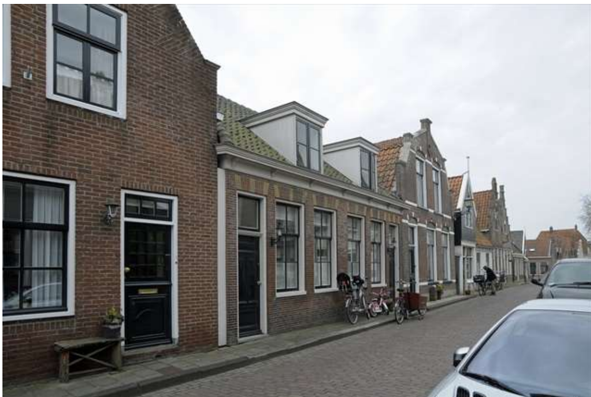
Overzicht van de zuidelijke gevelwand van de Bult.