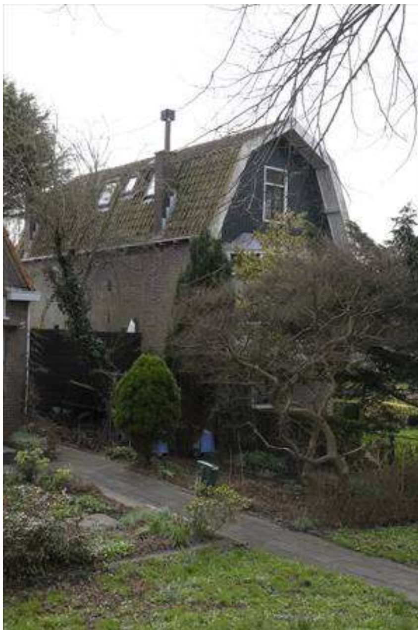
Zicht op de linker zijgevel van het pand.