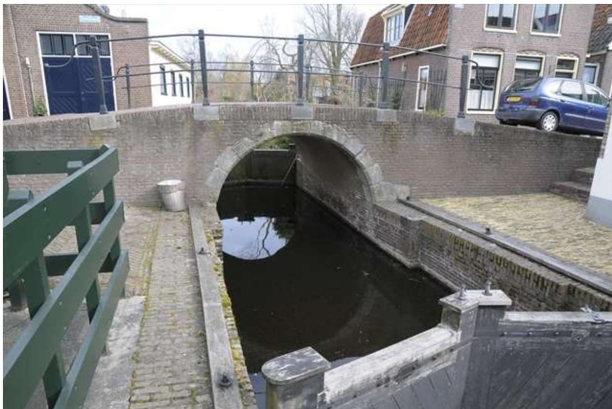
Overzicht van de sluis en de boogbrug.