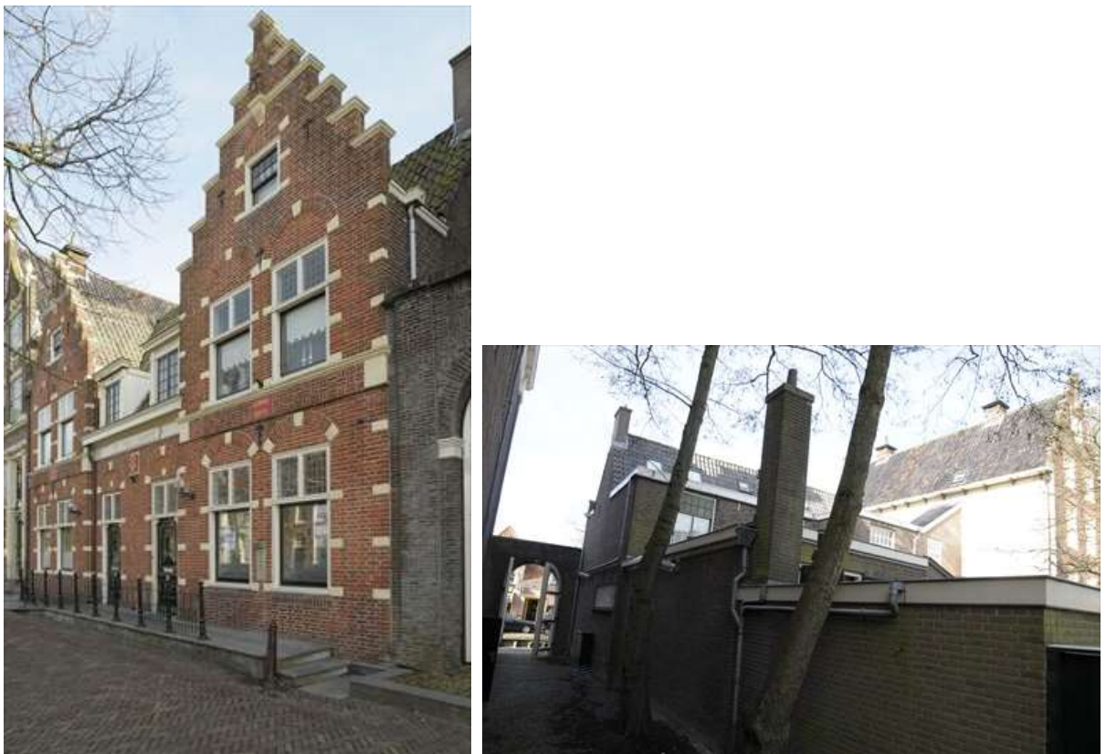
Voorgevel en rechts de zij- en achtergevel.