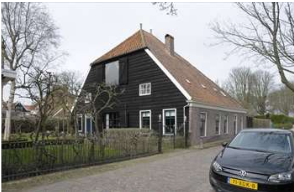
Voor- en zijgevel van Nieuwvaartje 16.