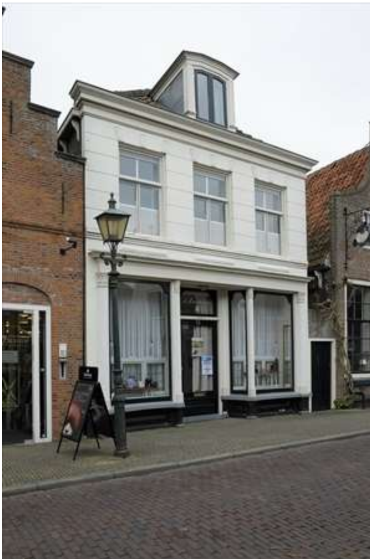
Voorgevel van Spuistraat 15.