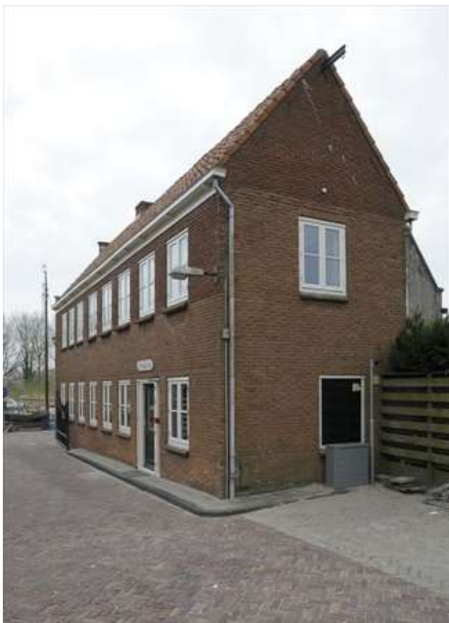
Zij- en achtergevel van Nieuwehaven 68a.