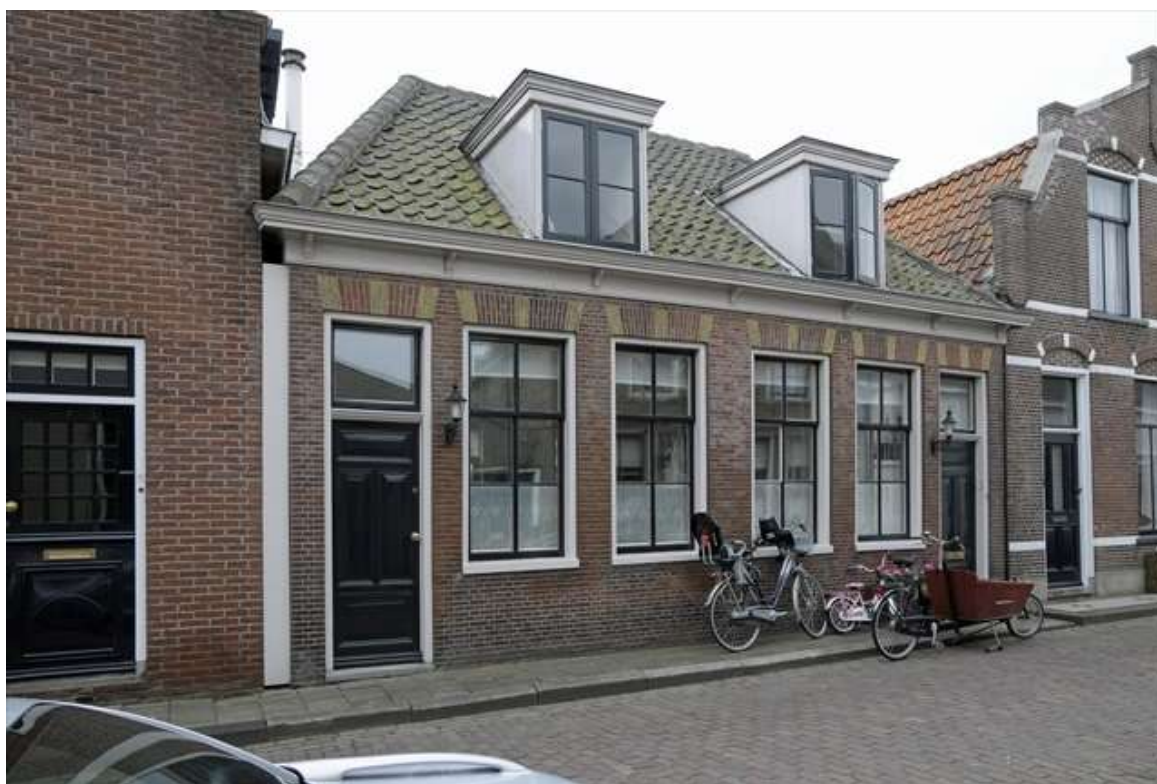
Voorgevel van Bult 17.