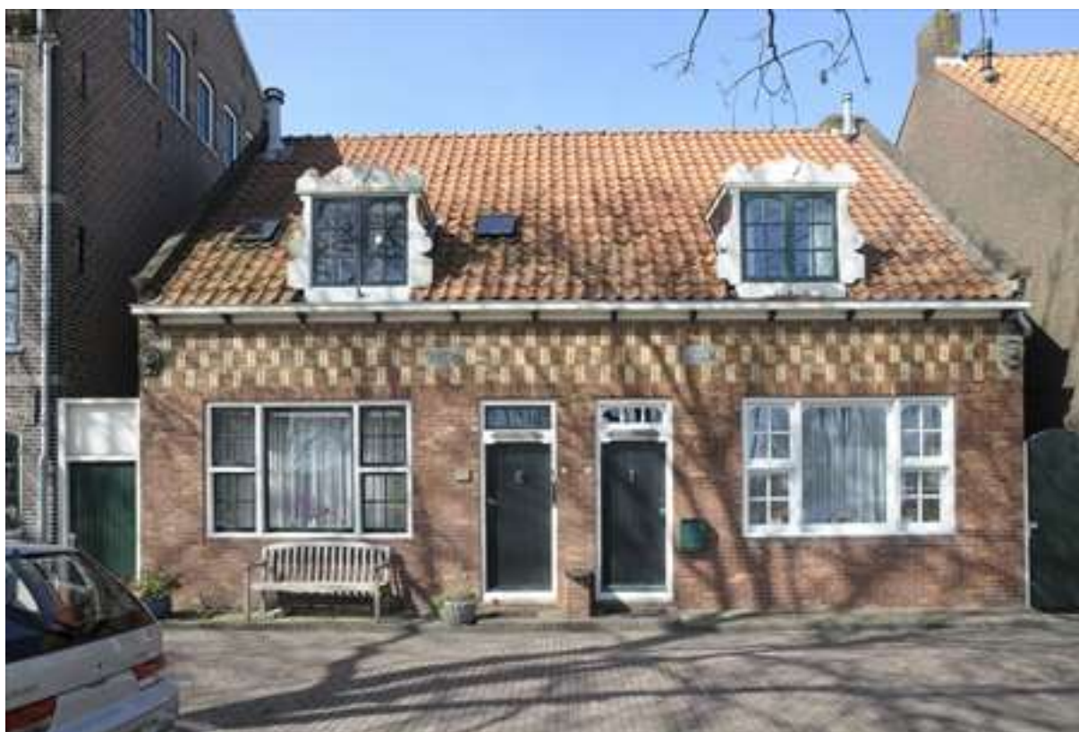
Voorgevel van het dubbel woonhuis aan de Nieuwehaven 18a en 18b.