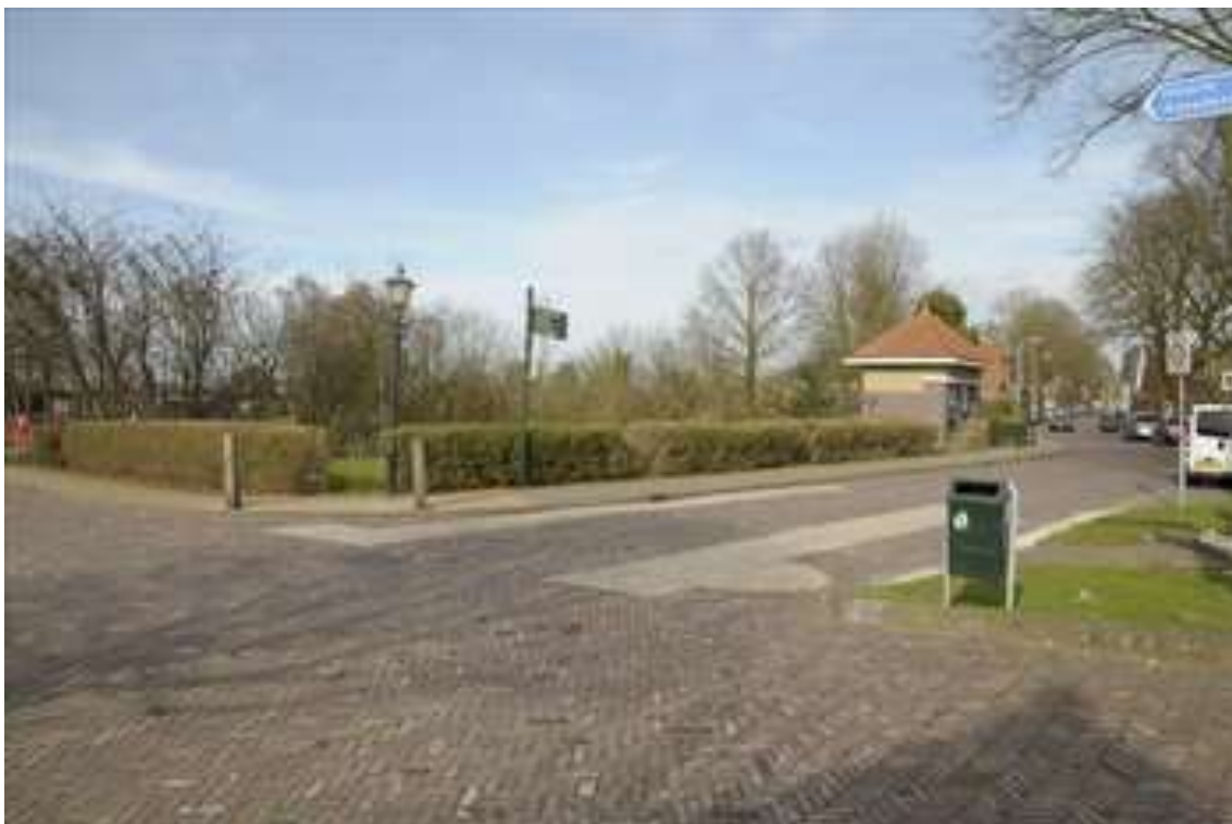
Situering van de Joodse begraafplaats op de hoek bij Oorgat 110.