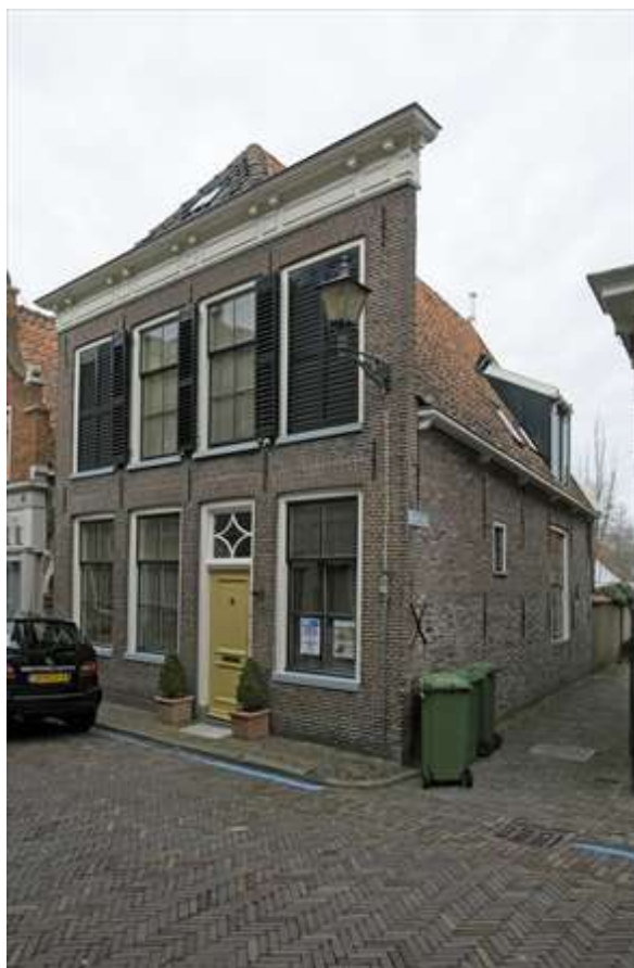
Voorgevel van het pand op de hoek van de Lingerzijde en de Pepersteeg.