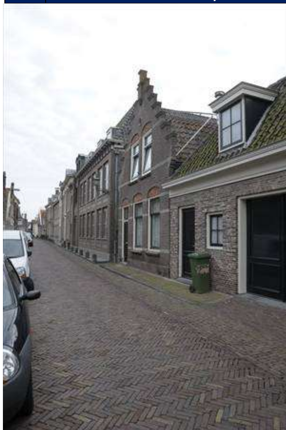
Overzicht van de ligging van het pand in de zuidelijke gevelwand van de Lingerzijde.