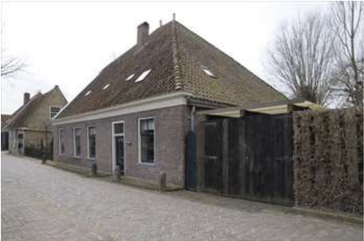
Voorgevel van Nieuwvaartje 16.