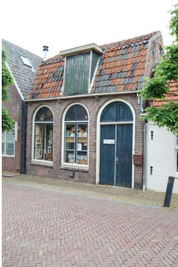
Voorgevel van Grote Kerkstraat 54.