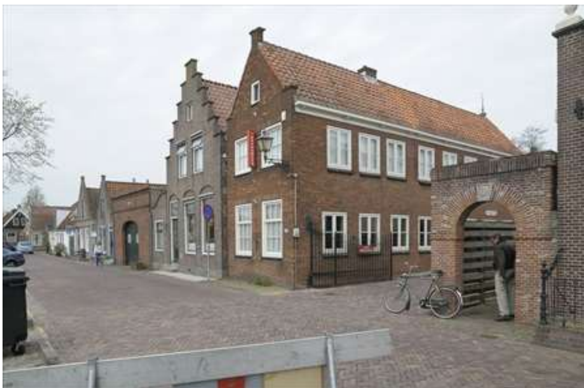
Overzicht van de gevelwand van de Nieuwehaven.