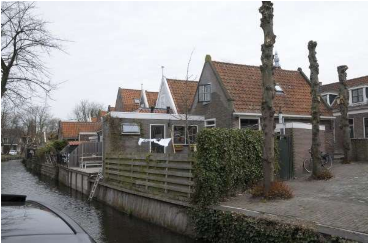
Achterzijde van de huisjes.