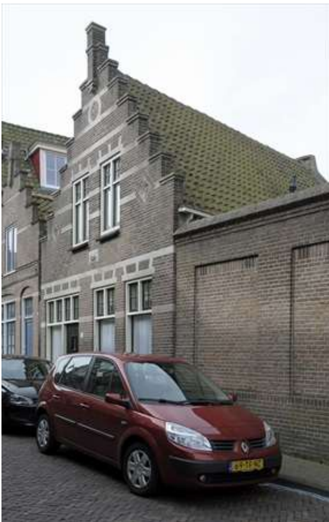
Zicht op het pand vanaf de rechterzijde.