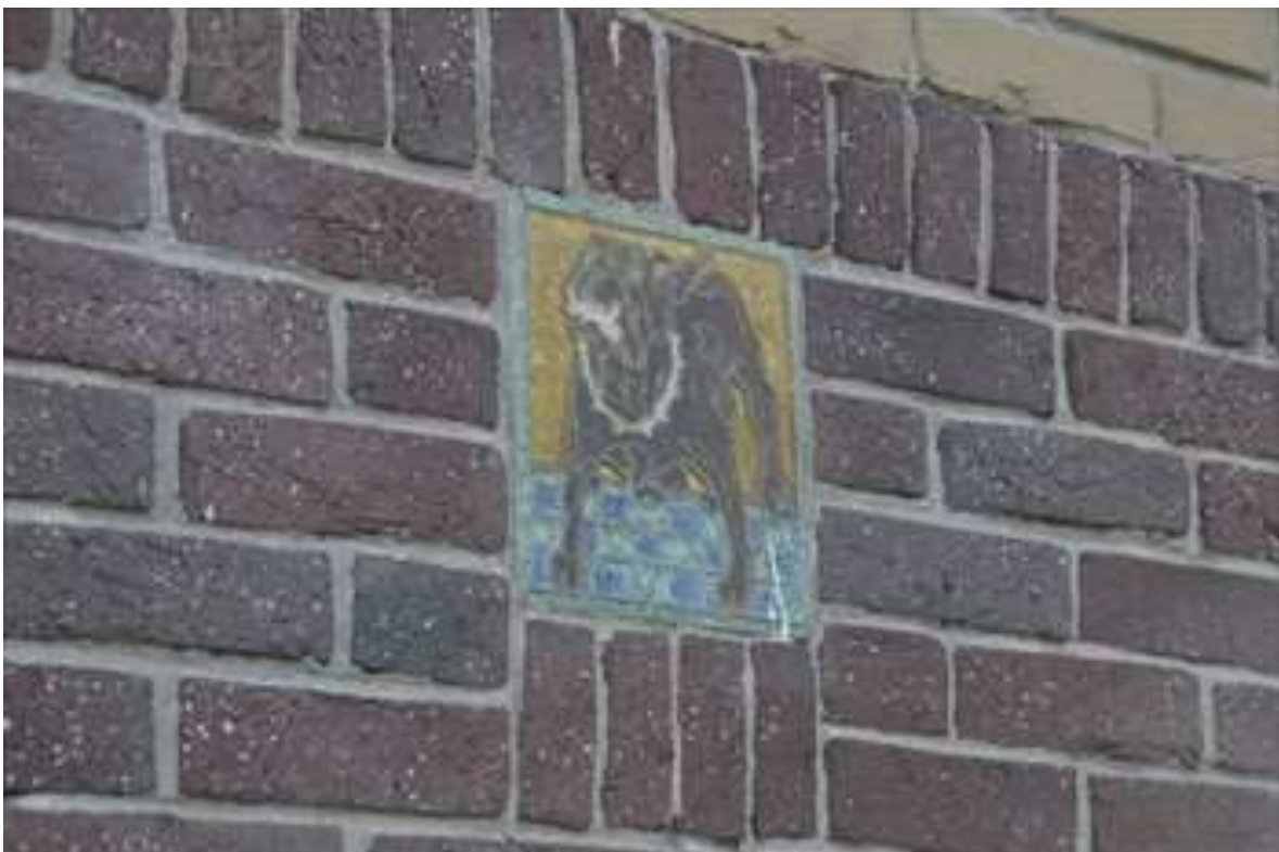
Detail van het tegeltableau in de oostgevel met daarop een waakhond afgebeeld.