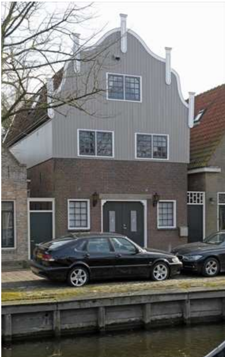
Voorgevel en oostelijke zijgevel van Voorhaven 67.