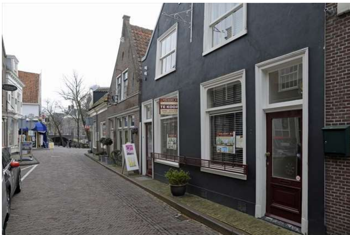
Overzicht van de situering van het pand in de Kleine Kerkstraat.