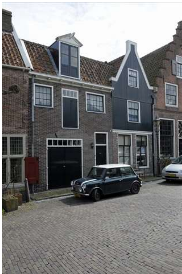
Voorgevel van Breestraat 10 links.