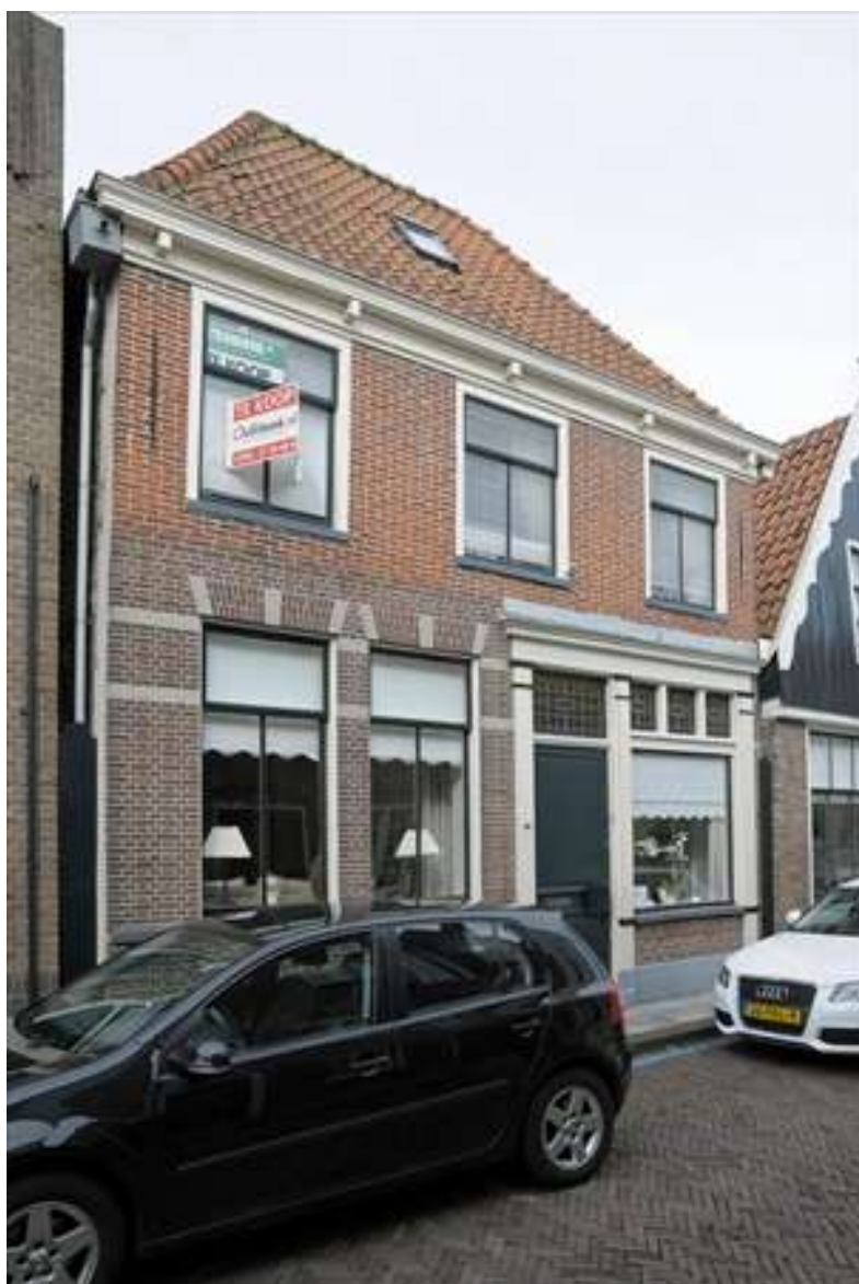
Voorgevel van Lingerzijde 28.