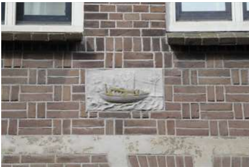
Detail van de gevelsteen in het baksteenfries.