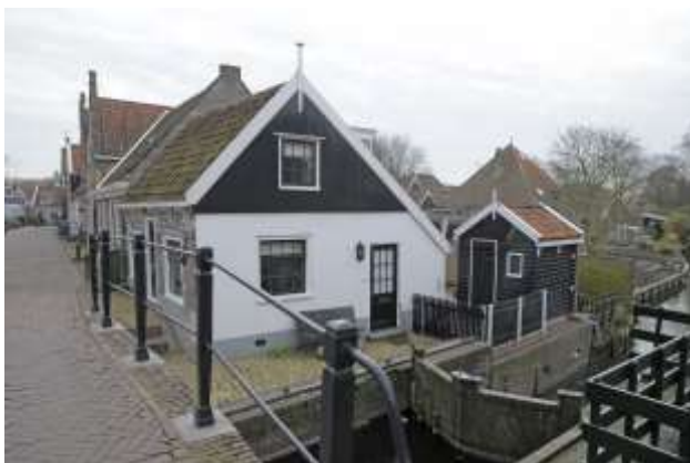
Sluiskolk met sluiswachterswoning aan de Bult.