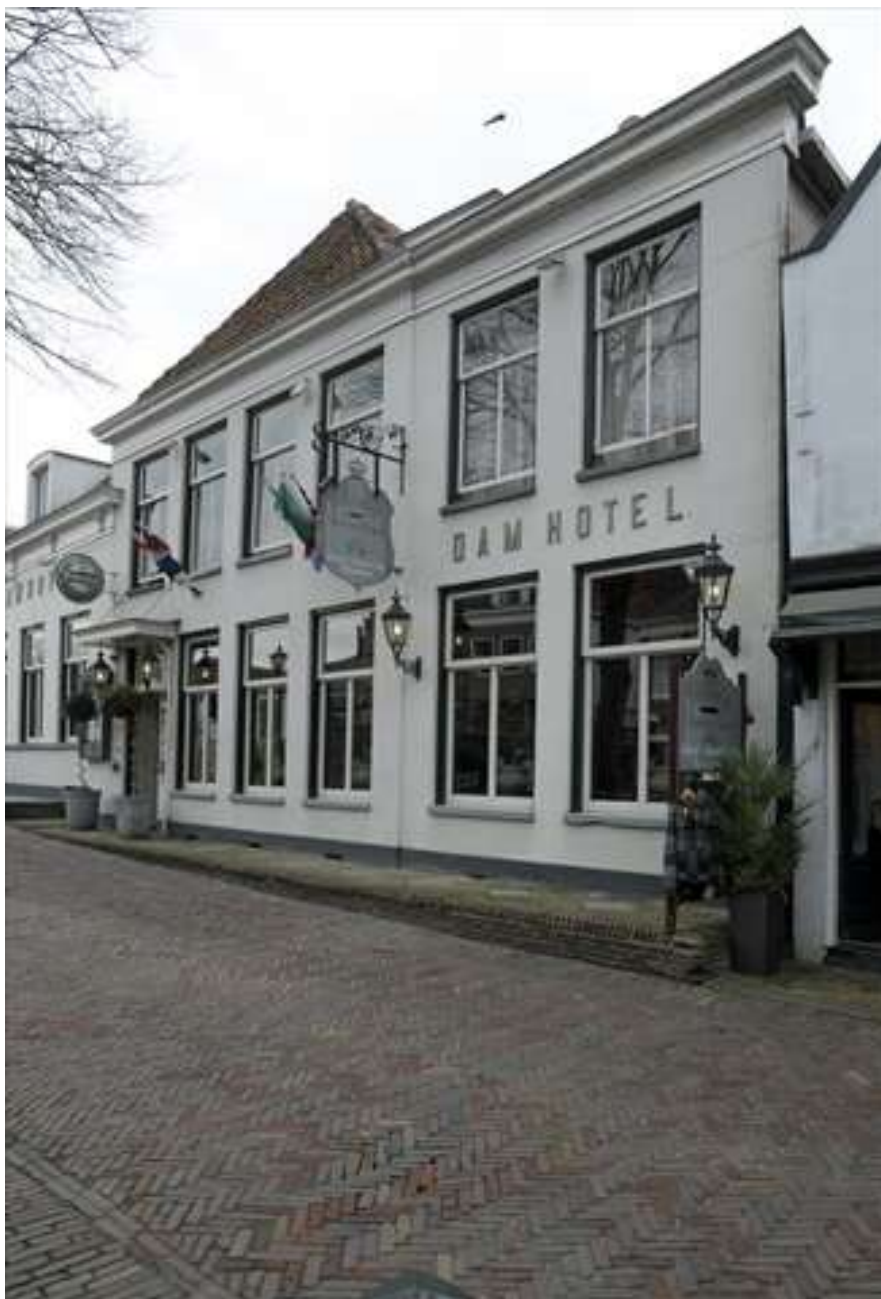
Vorgevels aan de Keizersgracht.