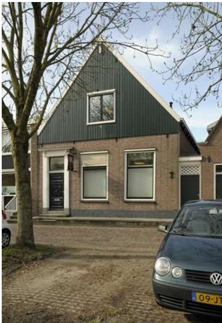
Voorgevel van Voorhaven 26.