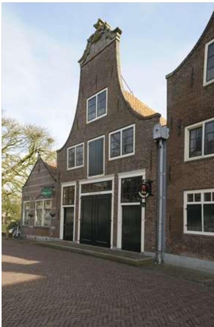
Kaaspakhuis Voorhaven 127 met links daarvan nummer 125.