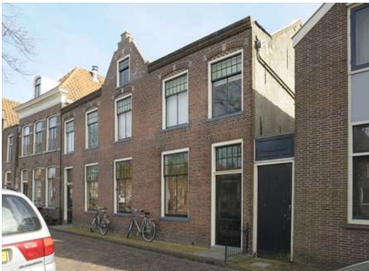
Voorgevel van Voorhaven 75.