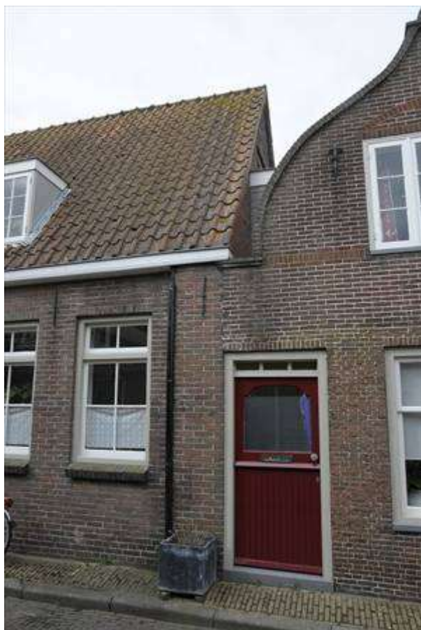
Zicht op het rechter deel van de oostelijke zijgevel en de achtergevel.