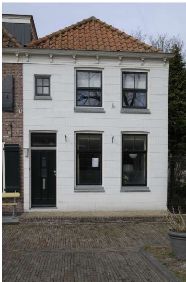
Voorgevel van Jan Nieuwenhuizenplein 17.