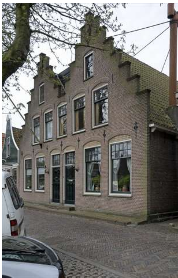
Het vooraanzicht van het object aan de J.C. Brouwersgracht.