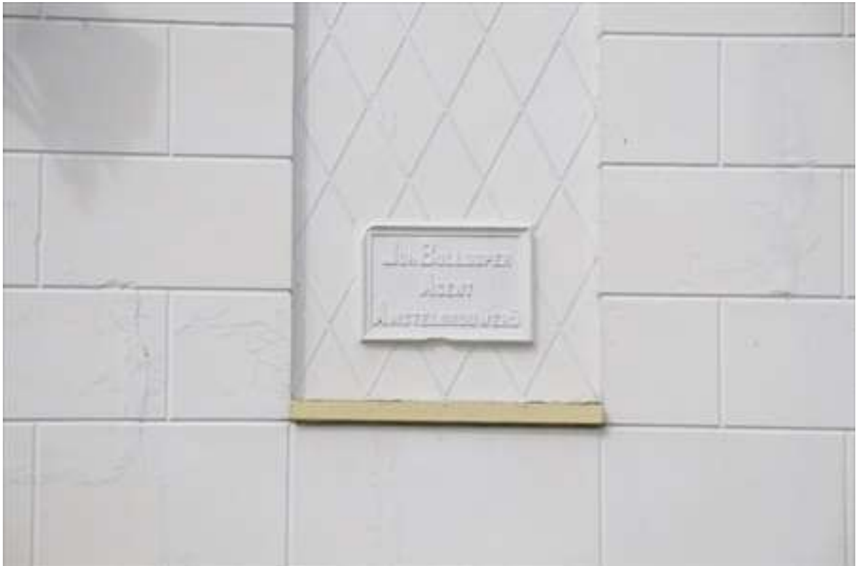
Opschrift in de linker vensternis.