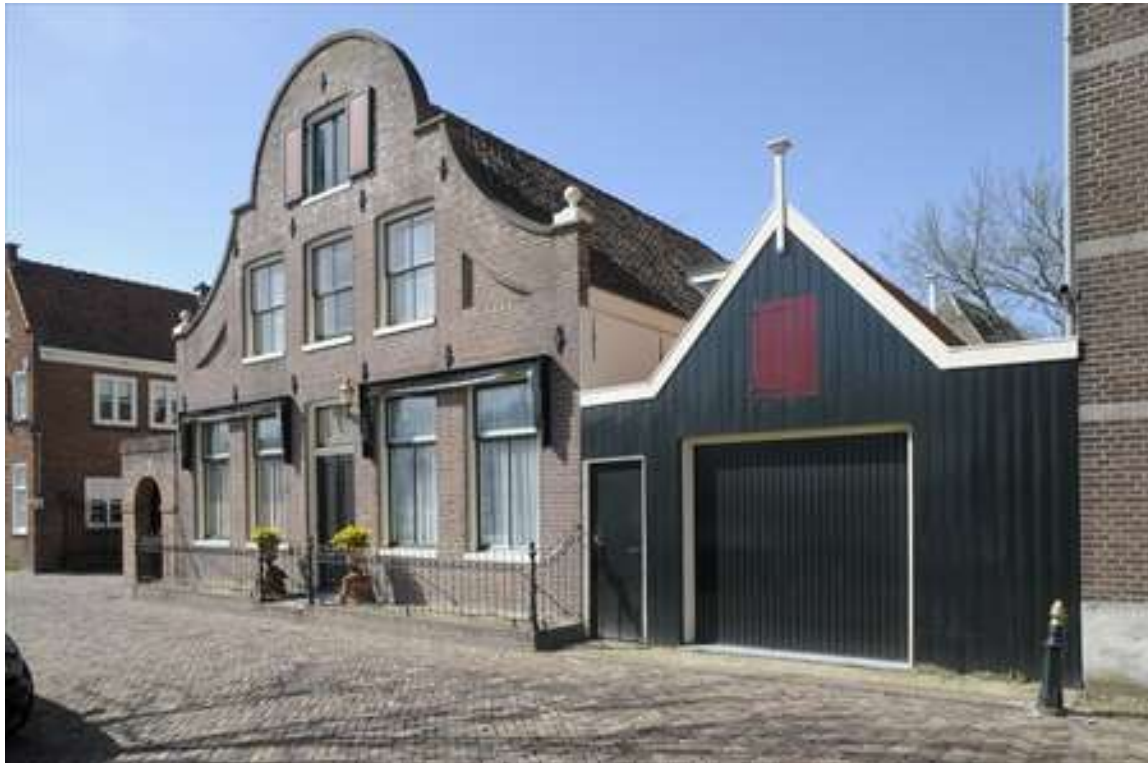
Overzicht van de situering van Nieuwehaven 67.