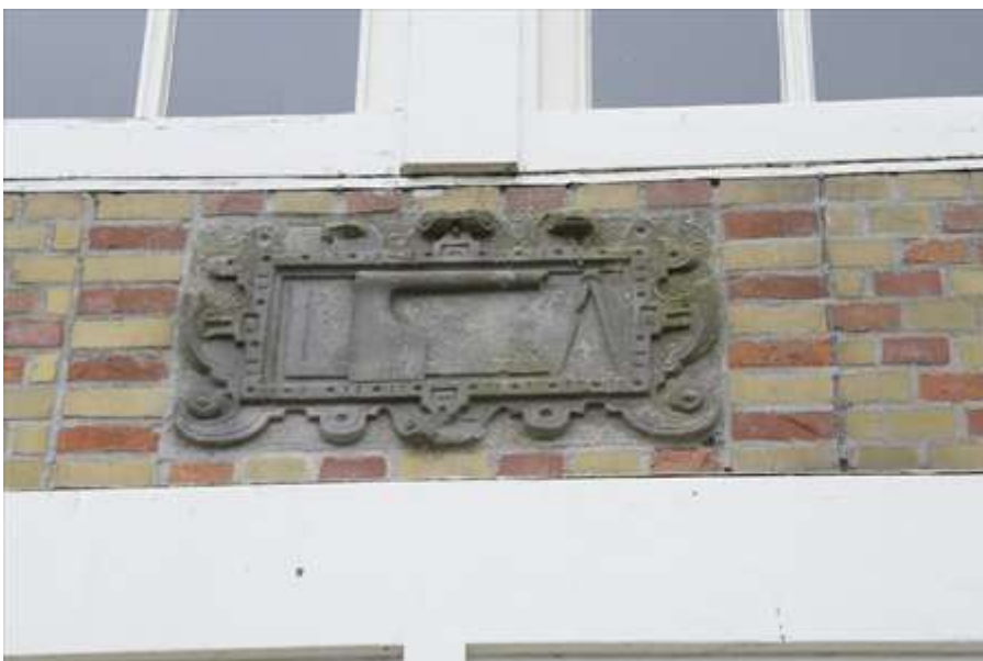
Detail van de gevelsteen in de voorgevel van het rechterwoonhuis.