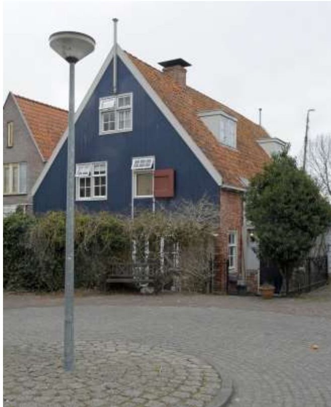
Het achteraanzicht van het atelier.