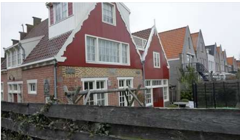
Het achteraanzicht van de twee woonhuizen.