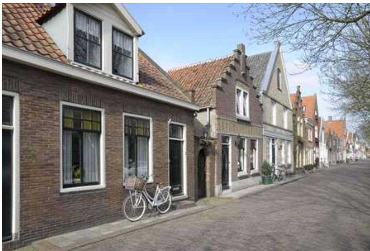
Situering van het pand in de noordelijke gevelwand van de Voorhaven.