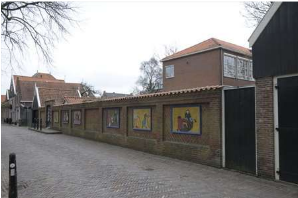
De muur die het schoolterrein afbakt aan de Achterhaven.