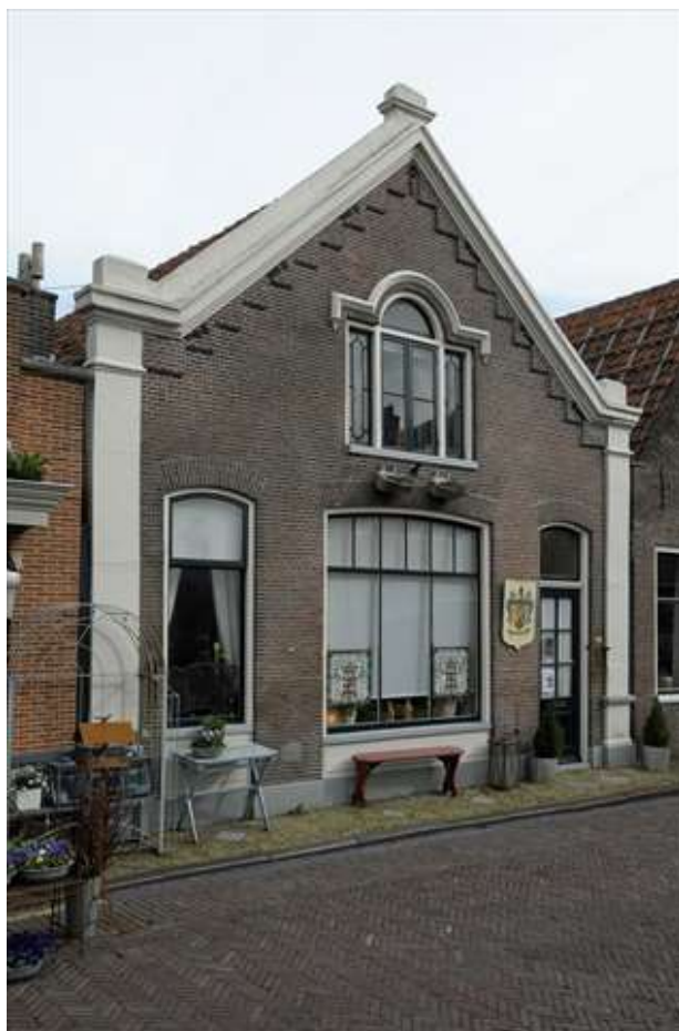
Voorgevel van Kleine Kerkstraat 20.