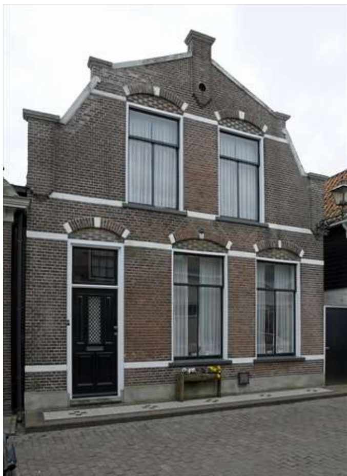
Voorgevel van Bult 21.