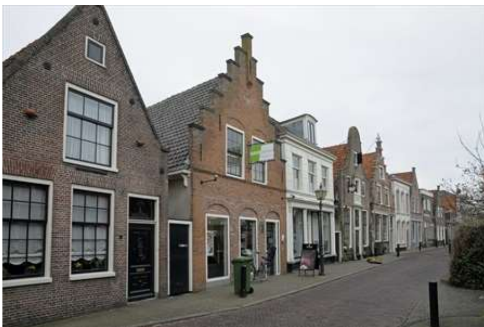
Situering van het pand in de westelijke gevelwand van de Spuistraat.