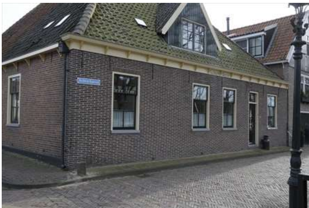
Voorgevel van de voormalige boerderij aan de Achterhaven.