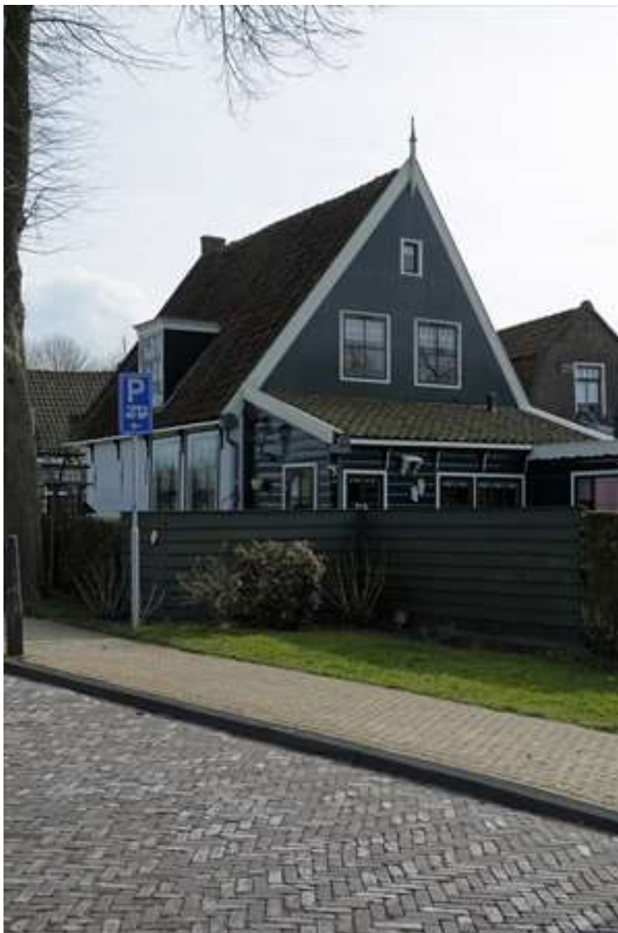
Achtergevel van Voorhaven 10.