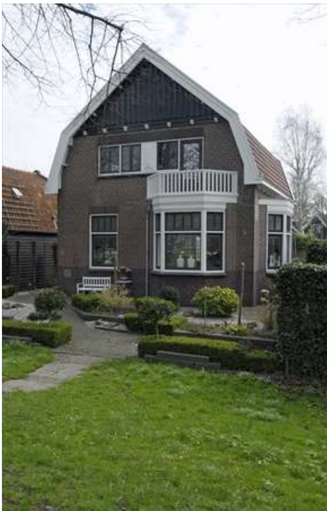
Voorgevel van Westervesting 10.