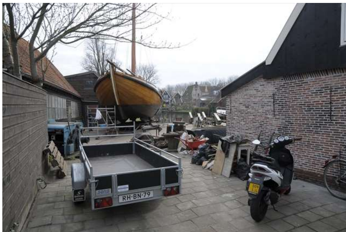
De werf gezien vanaf de Kwakelsteeg.