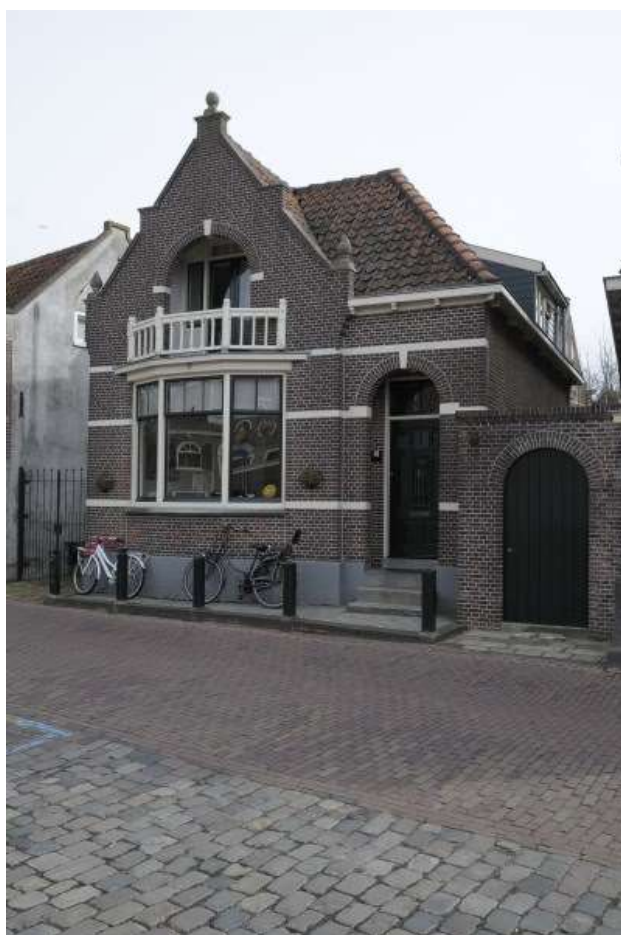
Voorgevel van Jan Nieuwenhuizenplein 10.