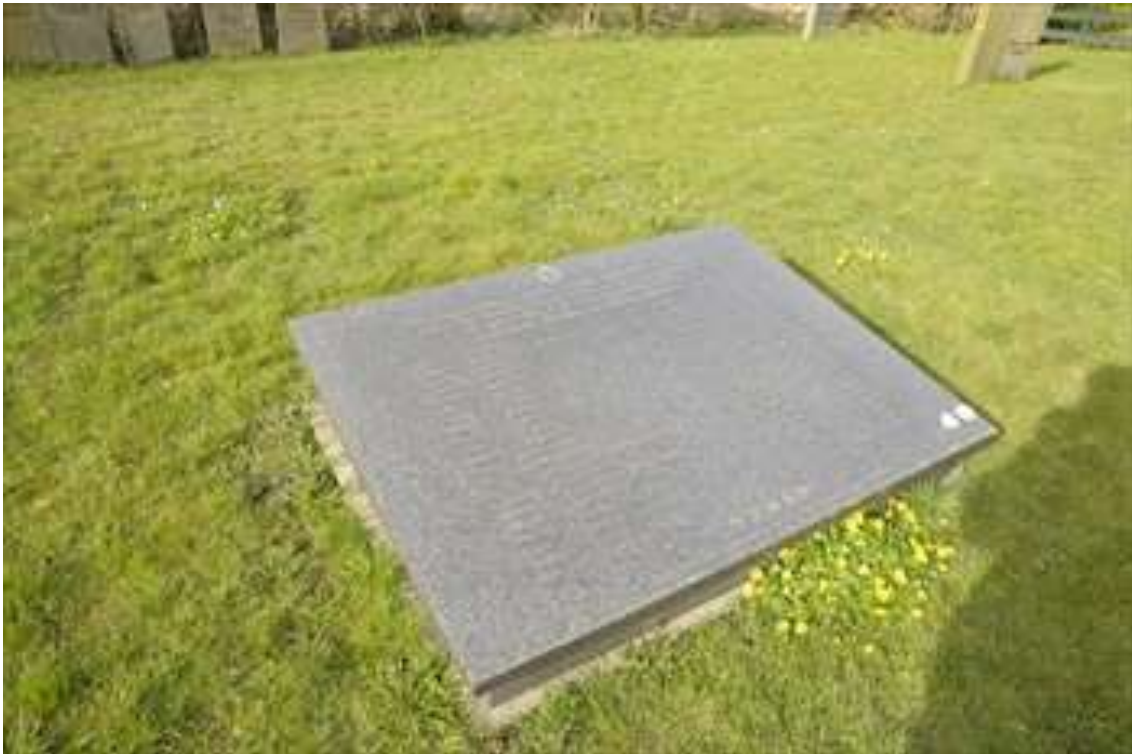
Plaquette ter nagedachtenis aan de Joodse inwoners van Edam die in de Tweede Wereldoorlog zijn omgekomen in de concentratiekampen Auschwitz, Sobibor en Bergen-Belsen.