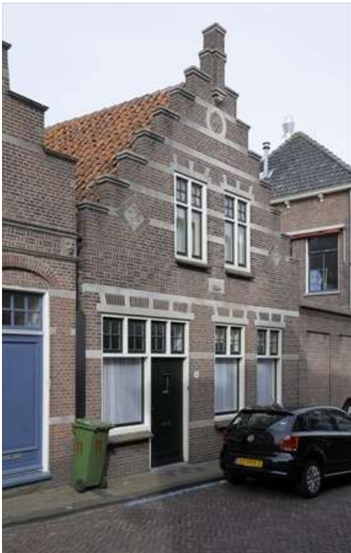
Vorgevel van Prinsenstraat 11.