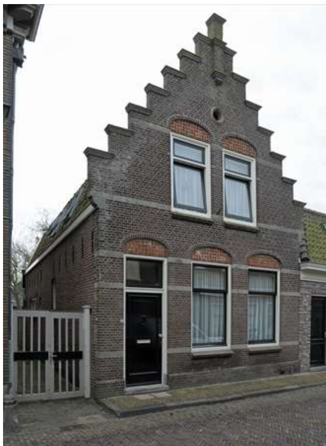
Voorgevel van Lingerzijde 47.