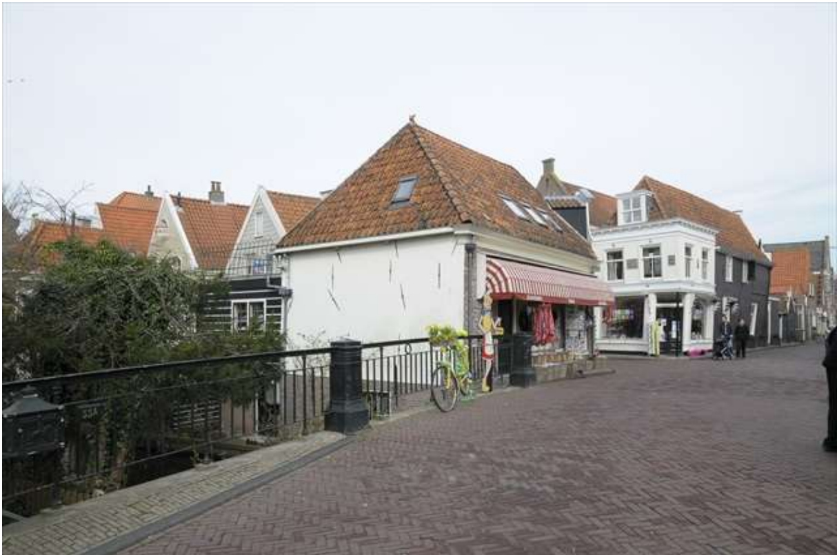
Ligging van Kleine Kerkstraat 1 op de hoek van de Spuistraat en de Kleine Kerkstraat met op de voorgrond de brug over het Spui.