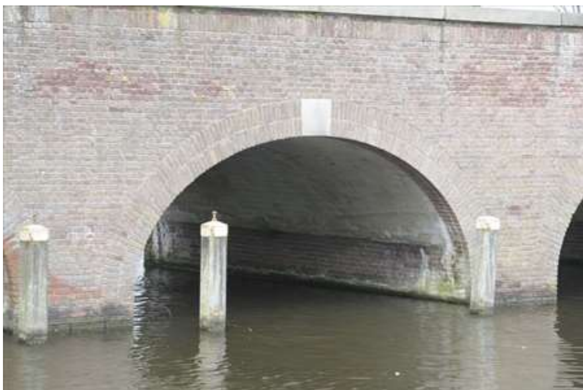
Detail van één van de bogen onder de brug.