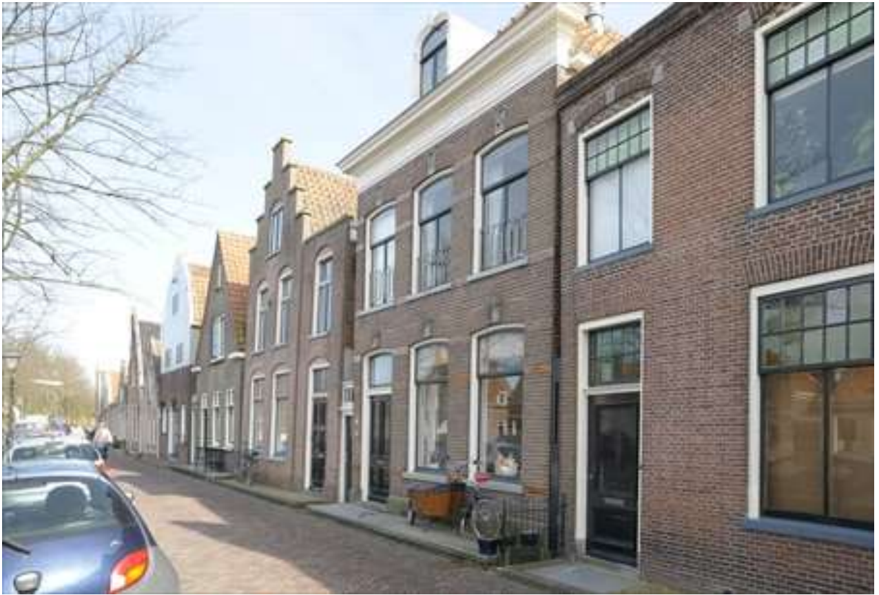
Situering van het pand in de zuidelijke gevelwand van de Voorhaven.