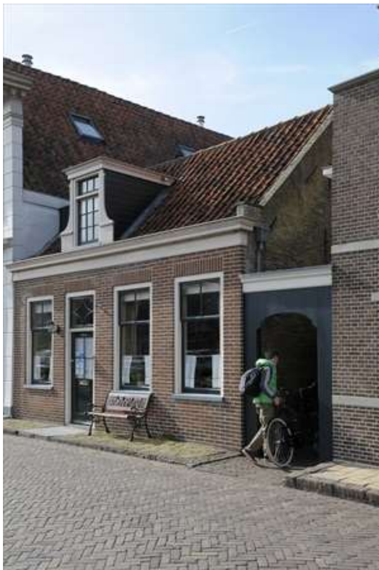
Zicht op de voorgevel en rechter zijgevel.