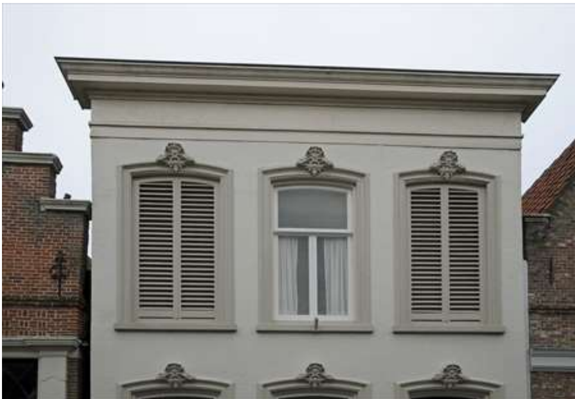
Bovenste deel van de voorgevel van het pand.