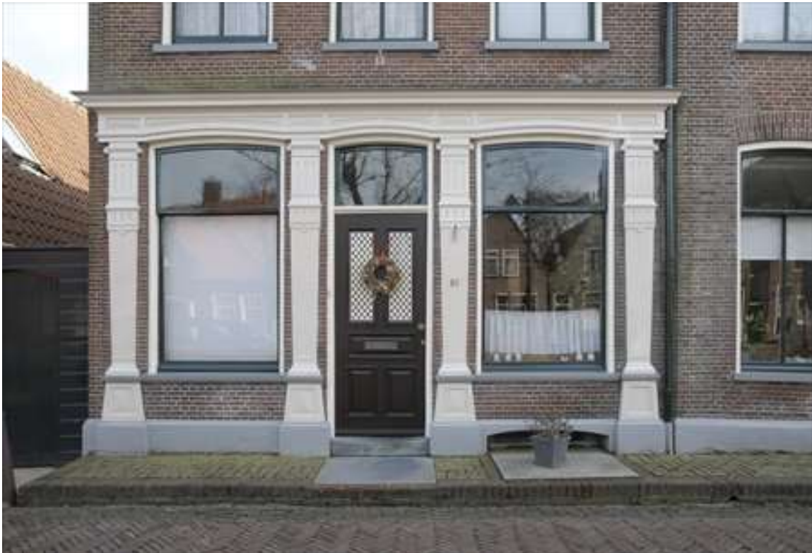
Winkelpui op de begane grond aan de linkerzijde van het pand.