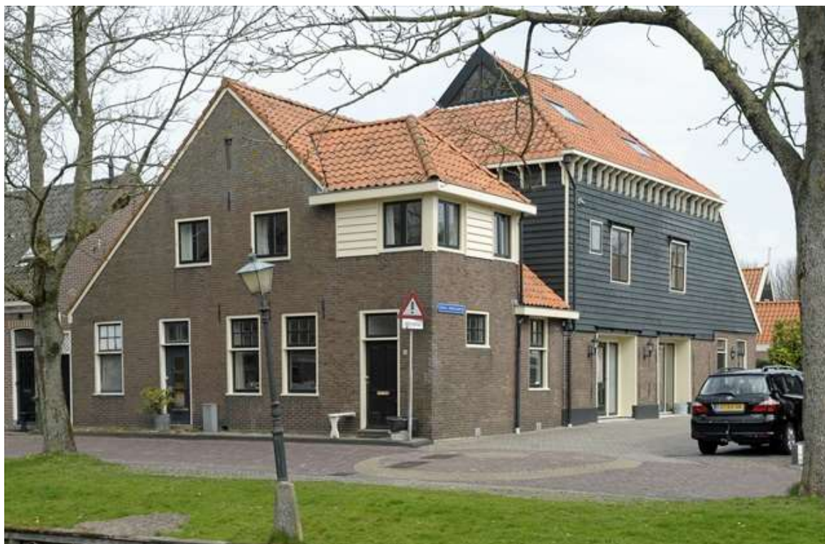
Voor- en zijgevel van Groenland 19.