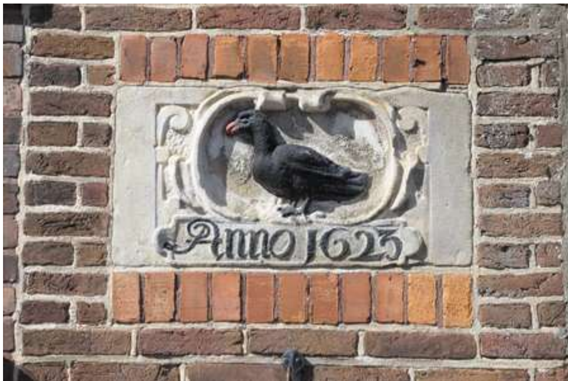
Detail van de secundair toegepaste gevelsteen in de muur rechts naast het pand.