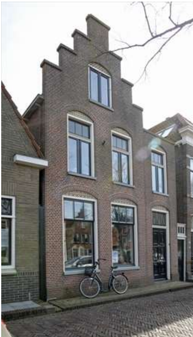
Voorgevel van Voorhaven 71.