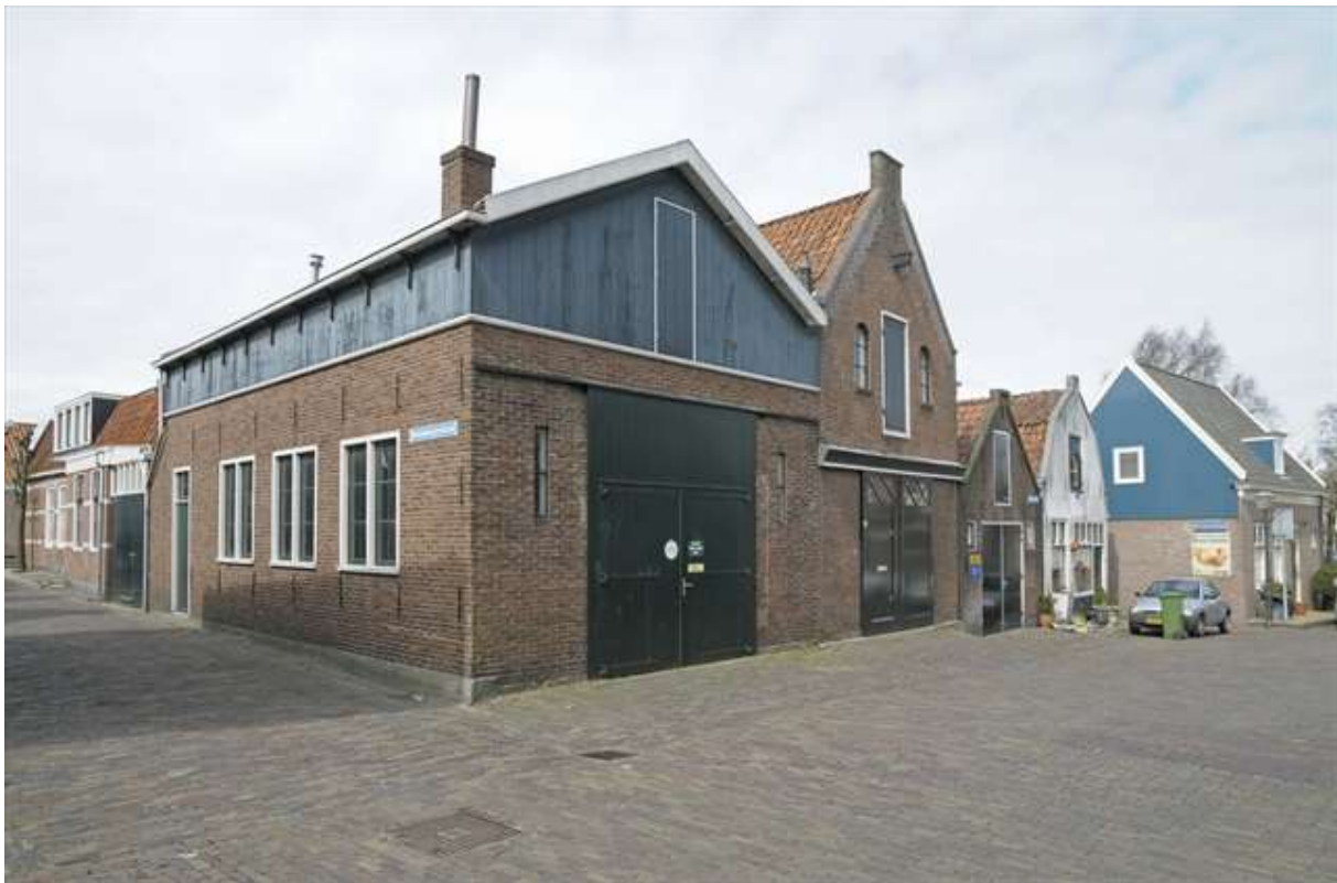
Breestraat 15 vormt een onderdeel van de westelijke gevel van de Breestraat.