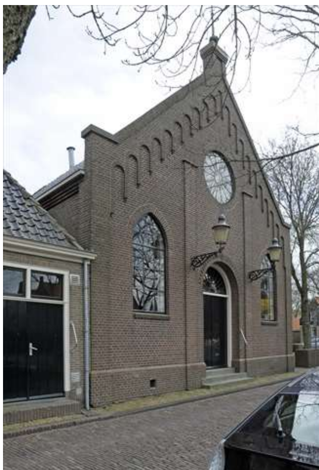
Voorgevel van Groenland 1.