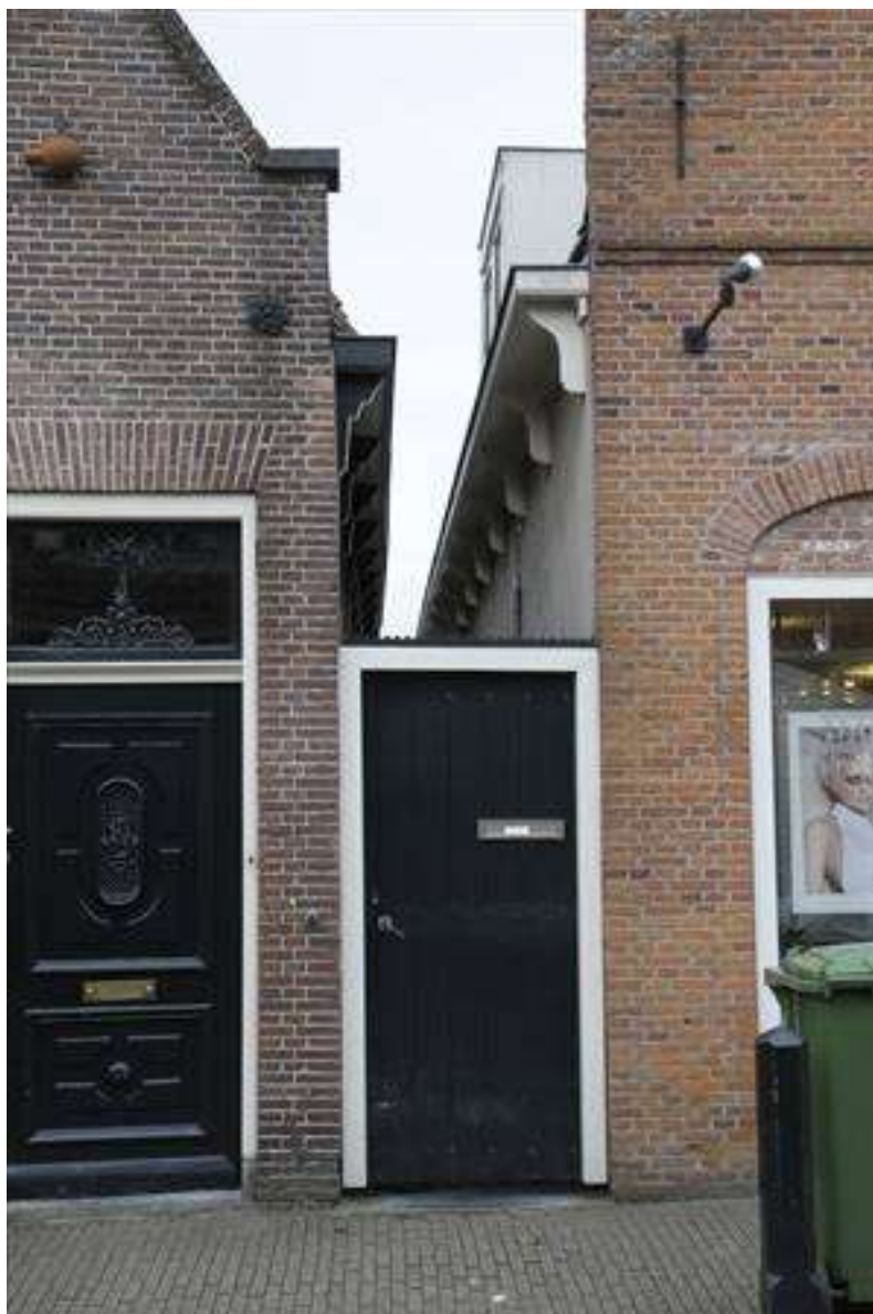
Zicht op het afgesloten steegje links van het pand.