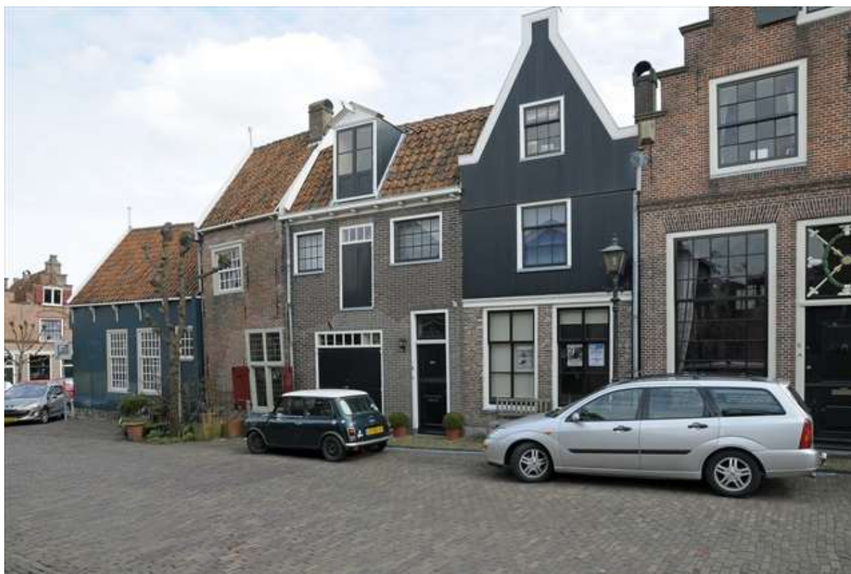
Overzicht van de oostelijke gevelwand van de Breestraat.