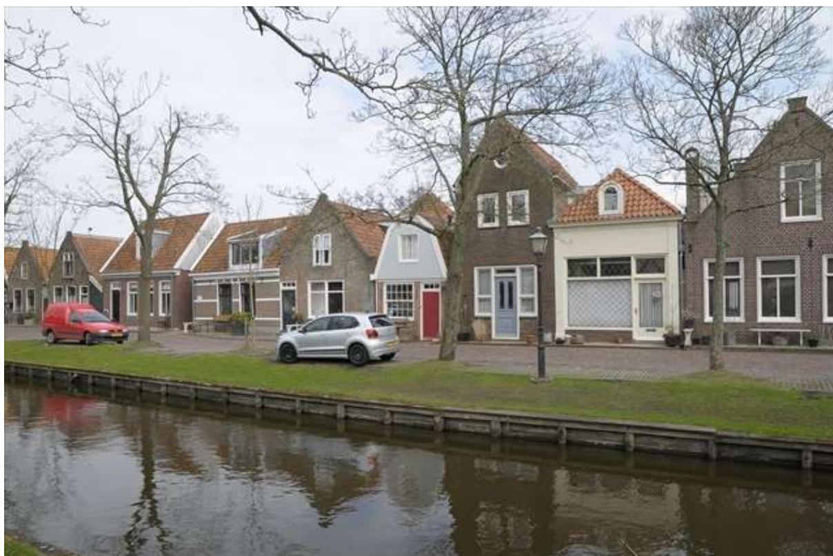
Overzicht van de gevelwand aan het Groenland.