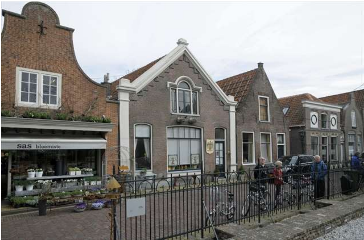
Overzicht van de noordelijke gevelwand van de Kleine Kerkstraat.