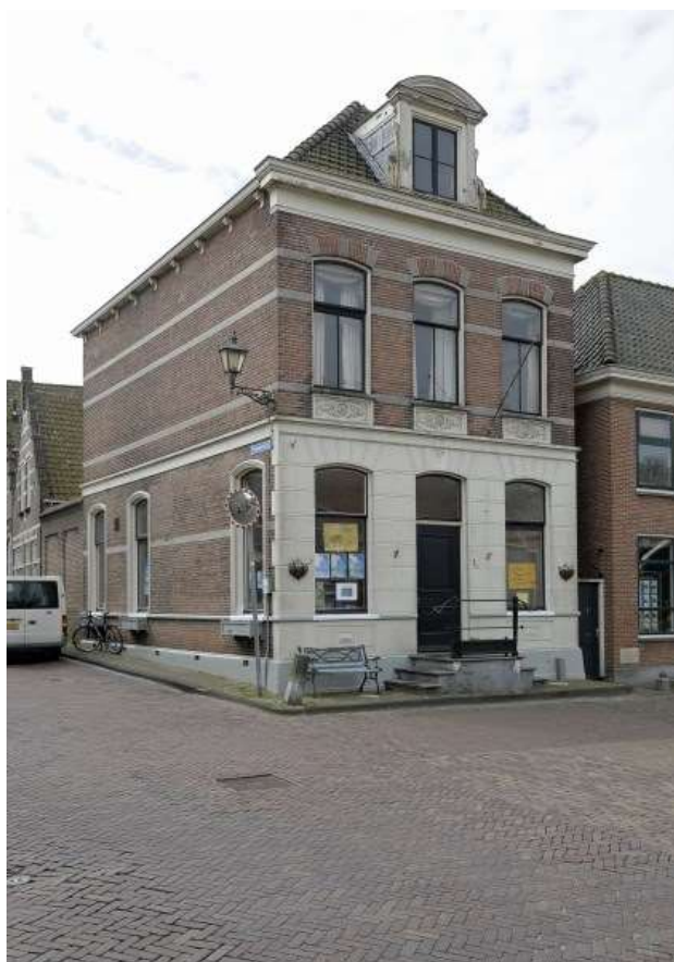
Voorgevel van Jan Nieuwenhuizenplein 1.