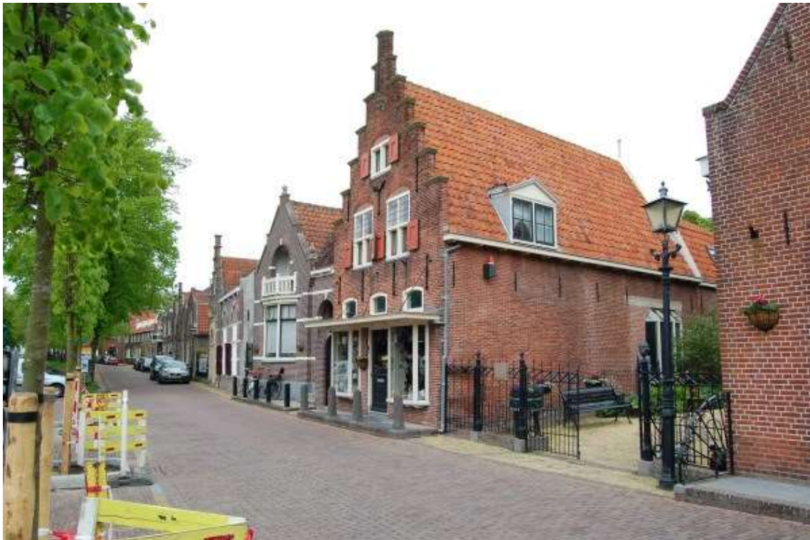
Overzicht van de oostelijke gevelwand van het Jan Nieuwenhuizenplein.