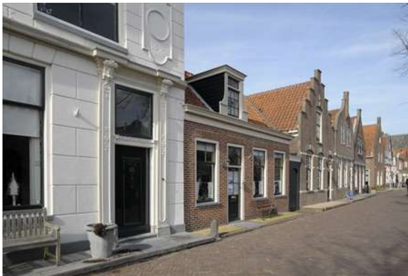
Situering van het pand in de noordelijke gevelwand van de Voorhaven.