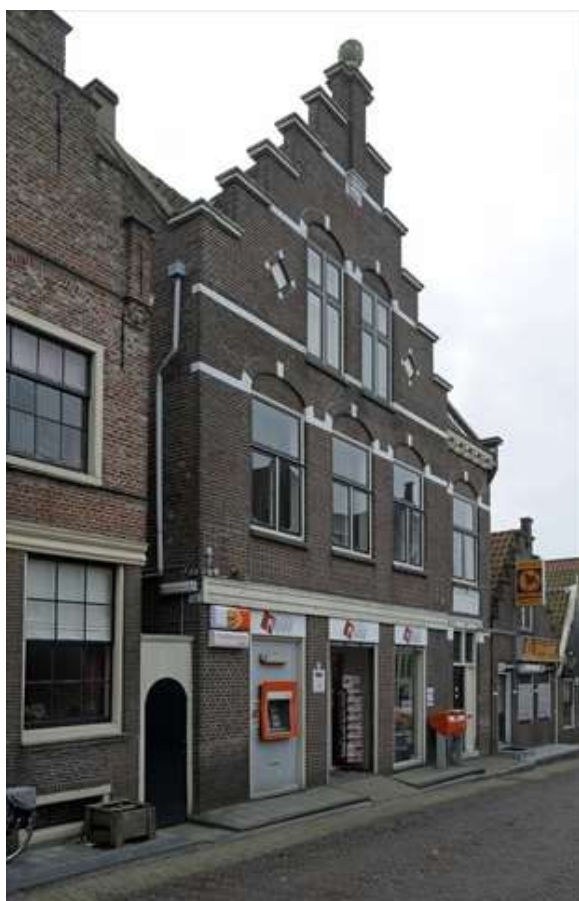
Voorgevel van Hoogstraat 8.