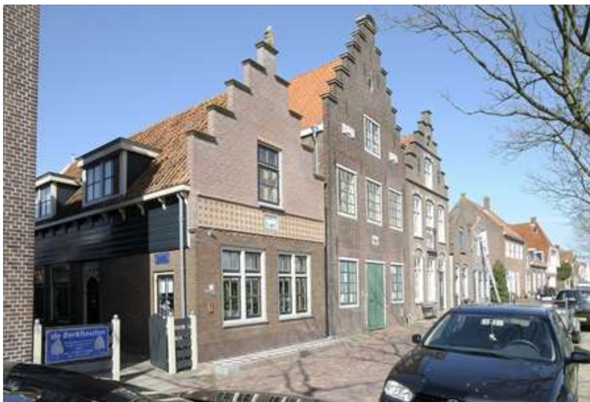
Overzicht van de gevelwand aan de Nieuwehaven.