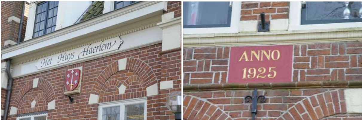
Details van de voorgevel.