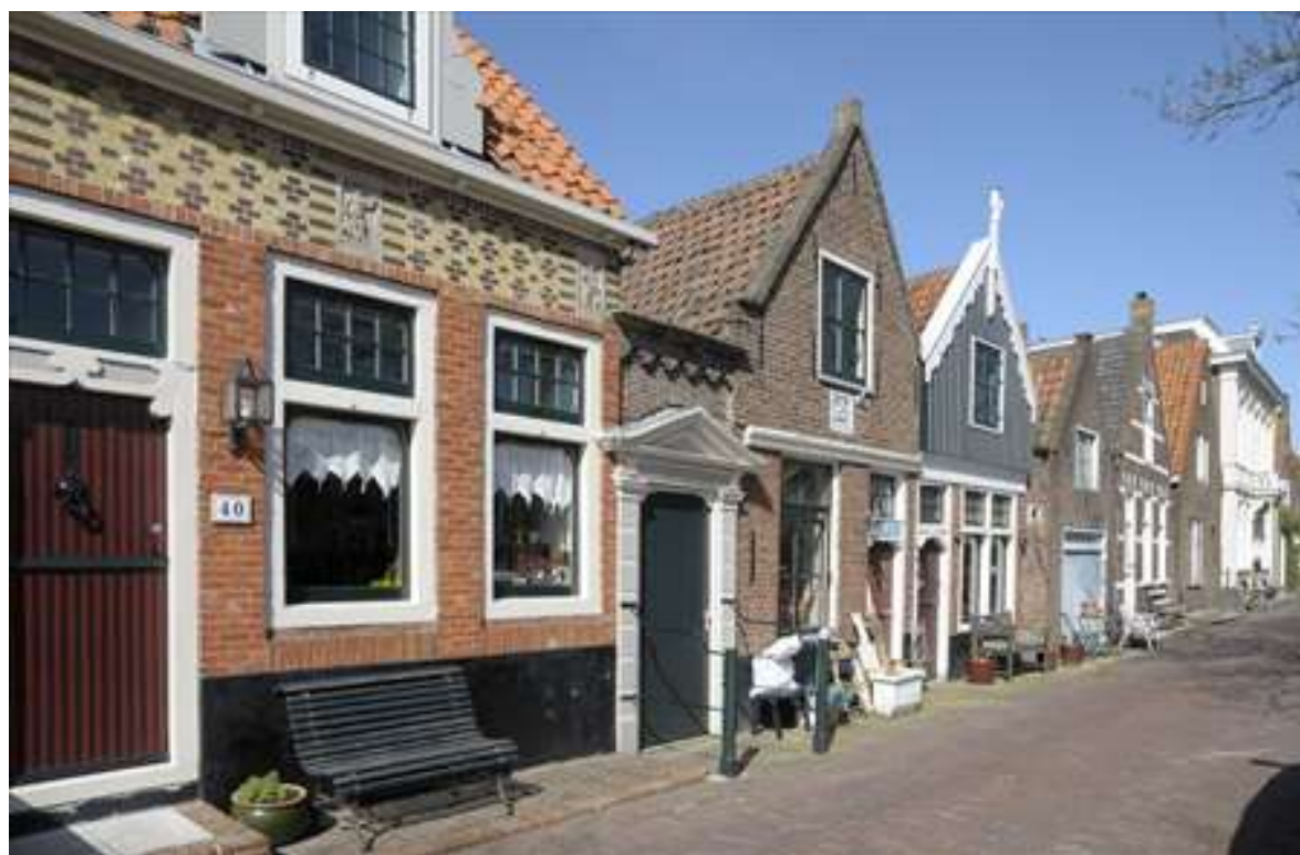
Overzicht van de ligging van het pand aan de Nieuwehaven.