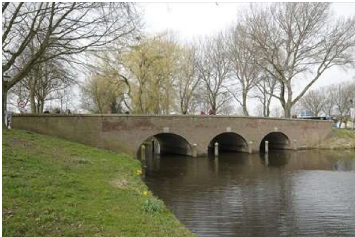
Zicht op de brug vanaf de overzijde van de buitengracht.