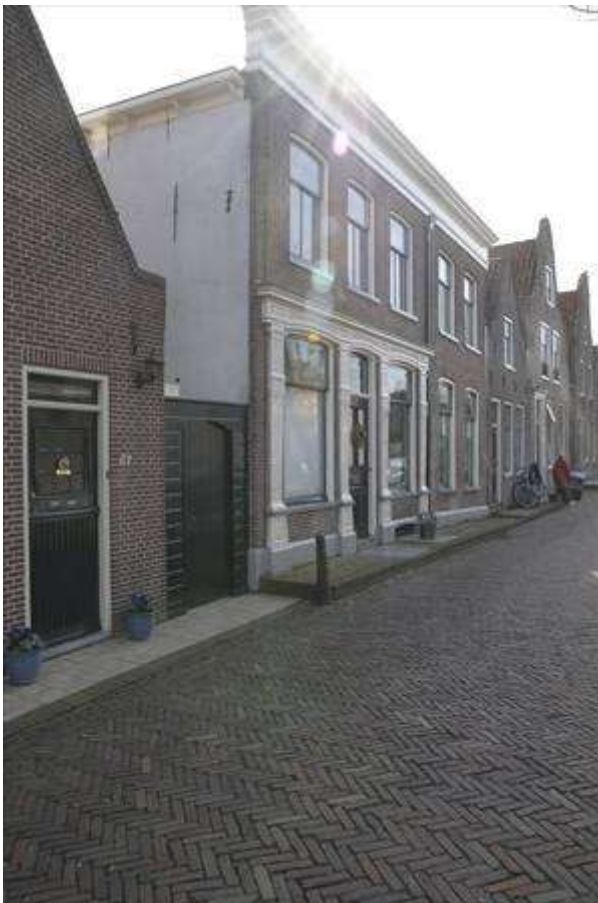
Zicht op de linker zijgevel van het pand.