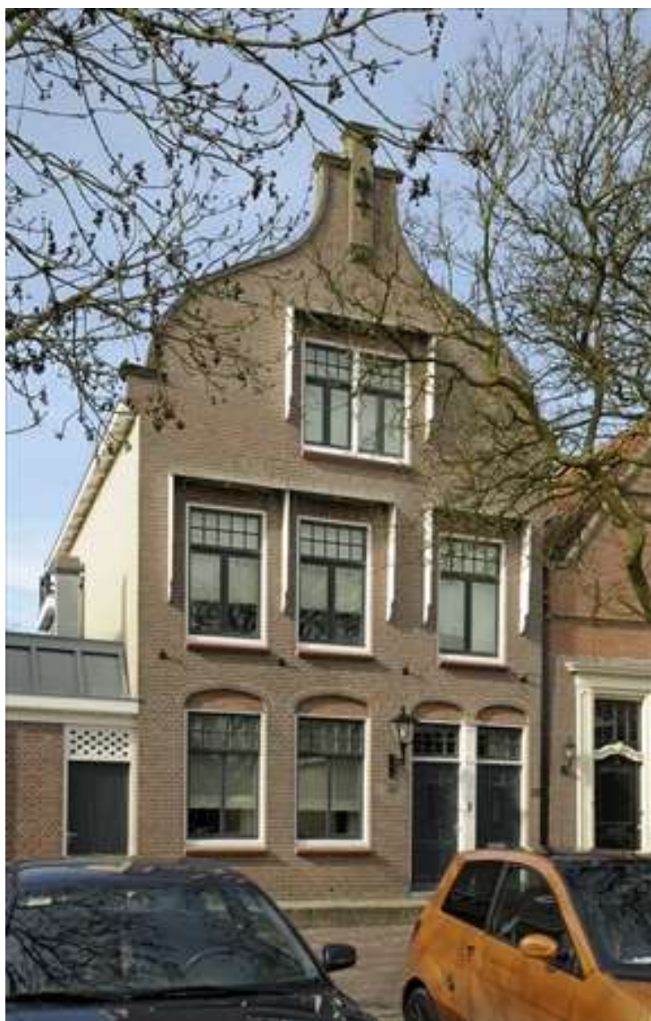
Vorgevel van Voorhaven 22.