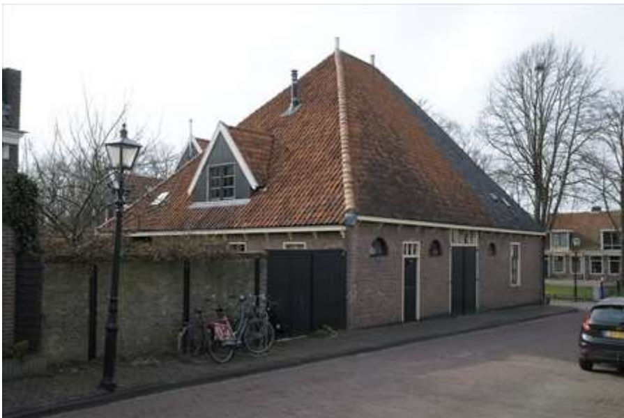
Zijgevel en achtergevel van het gebouw.