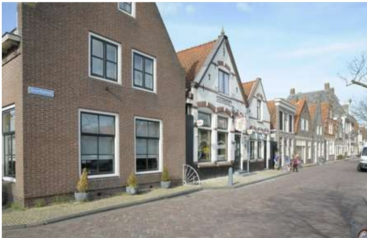
Overzicht van de noordelijke gevelwand van de Voorhaven.