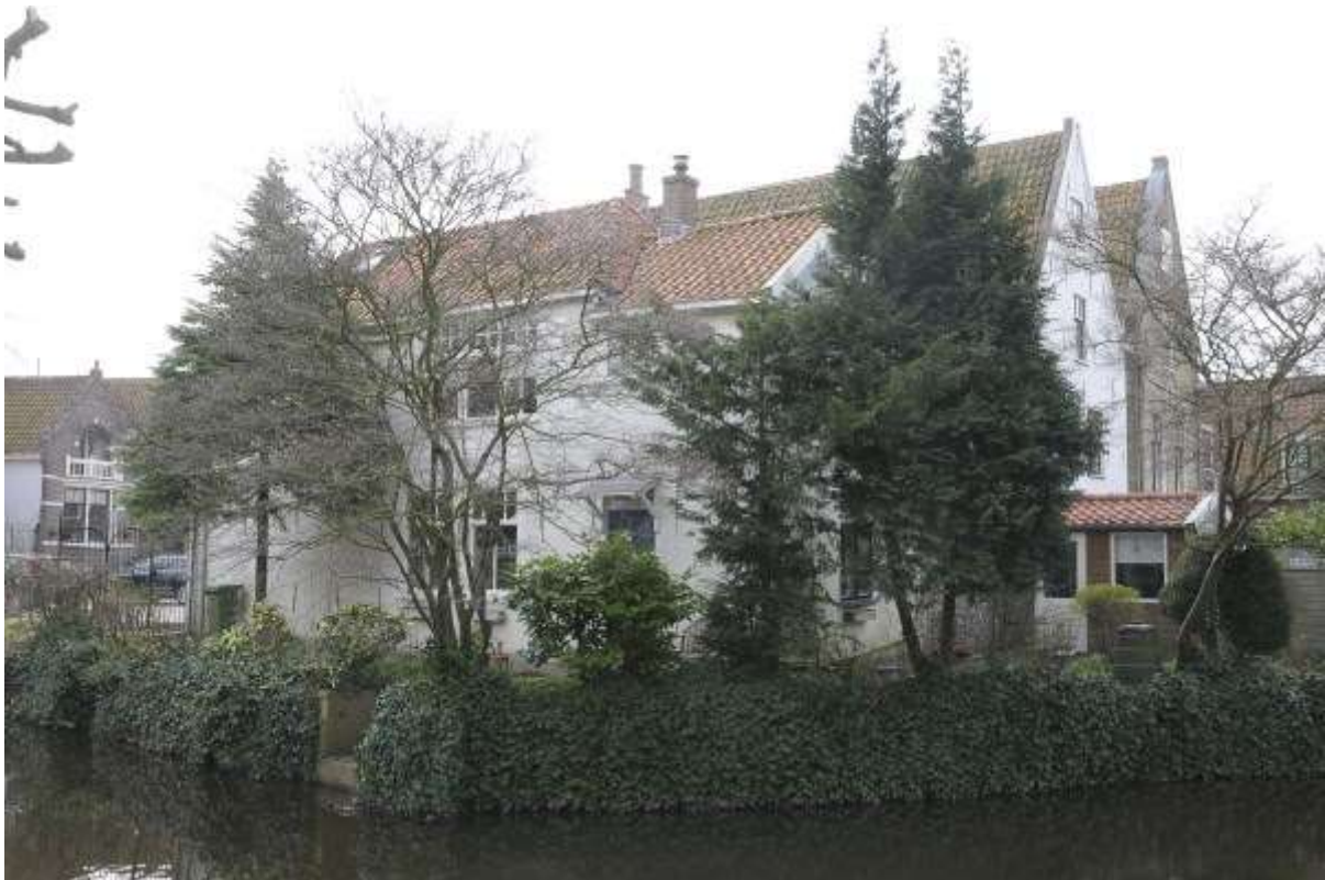
Overzicht van de noordelijke zijgevel van het pand.