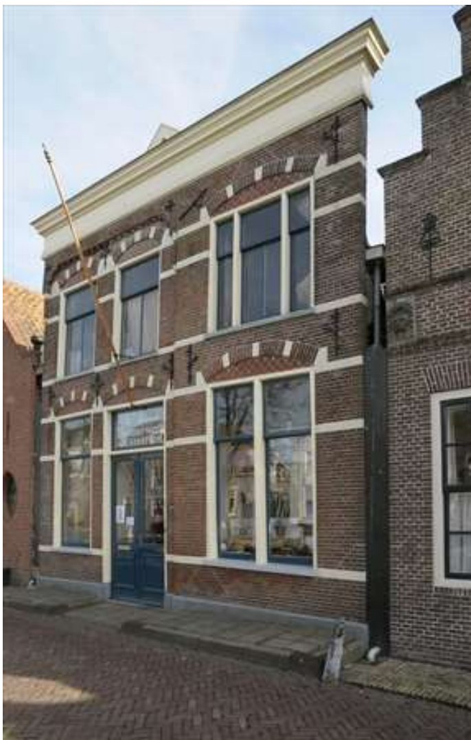
Vorgevel van Voorhaven 115.