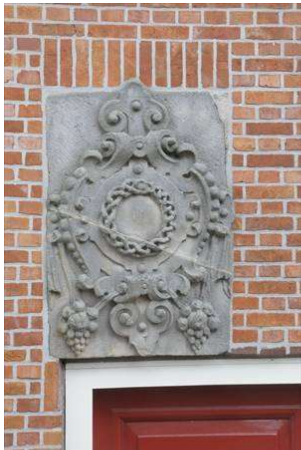
Detail van de gevelsteen in de zijgevel van het rechterwoonhuis.