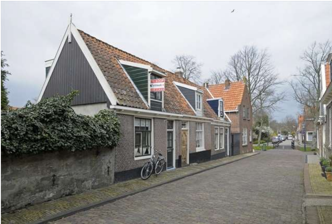
Overzicht van de westelijke gevelwand van de Gravenstraat.