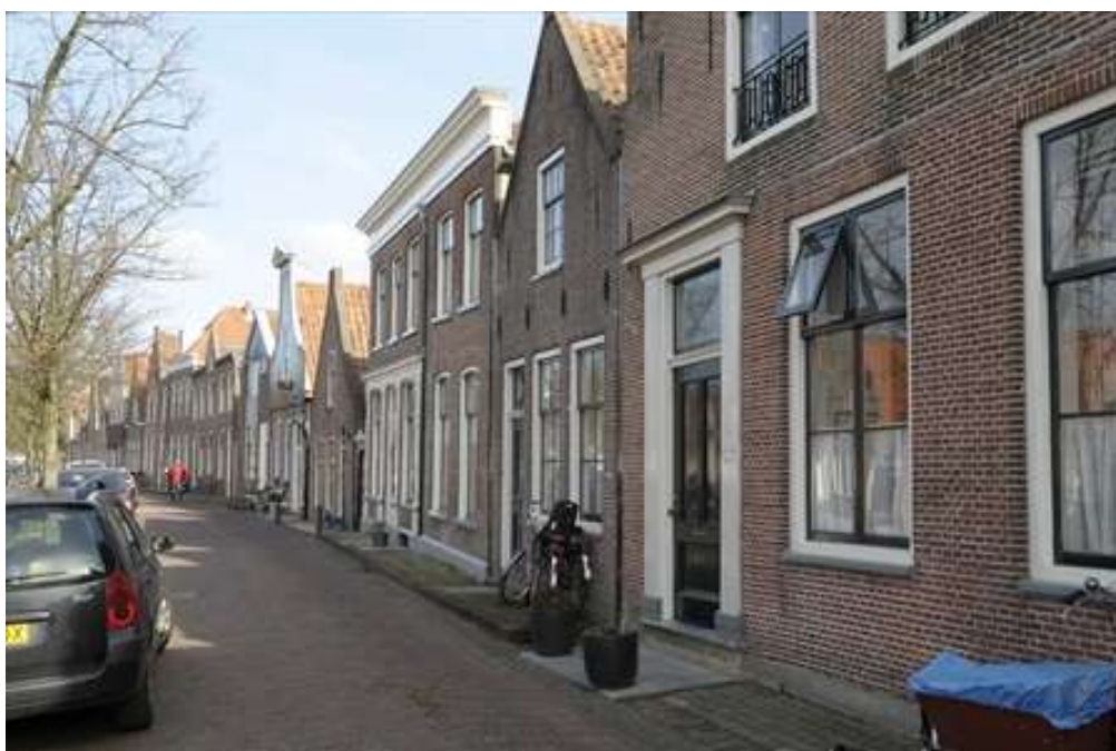
Situering van het pand in de zuidelijke gevelwand van de Voorhaven.