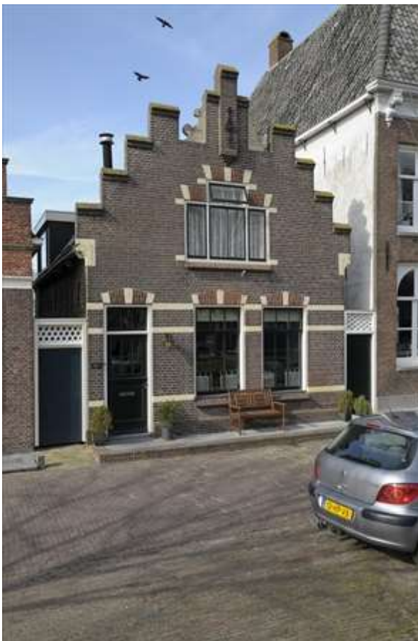
Zicht op de linker zijgevel en voorgevel van het pand.