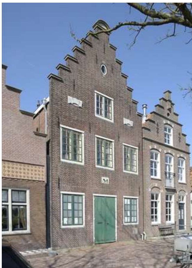
Voorgevel van Nieuwehaven 54.