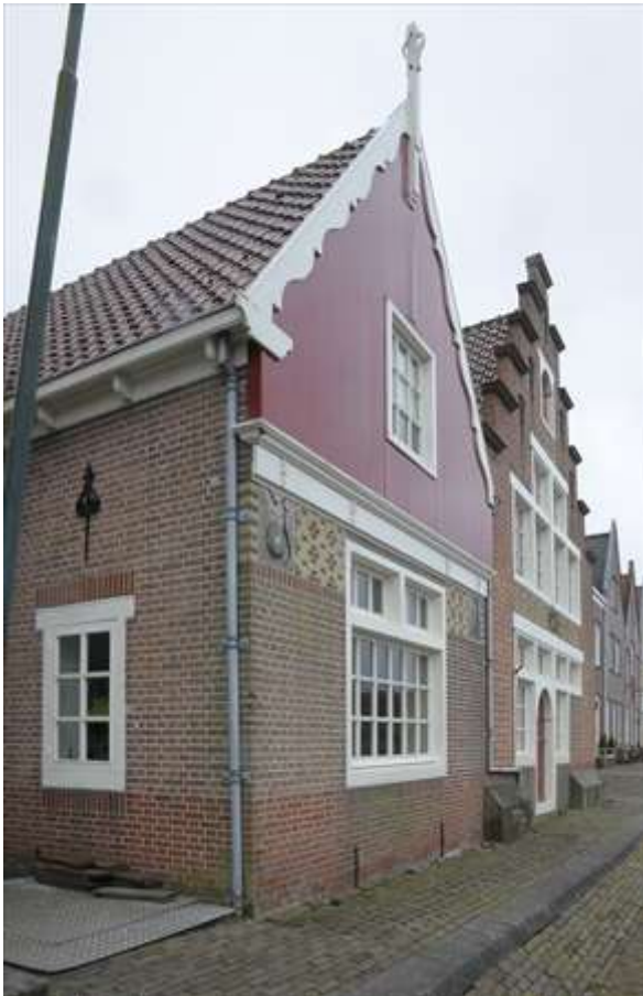
Het zijaanzicht van het linker pand.