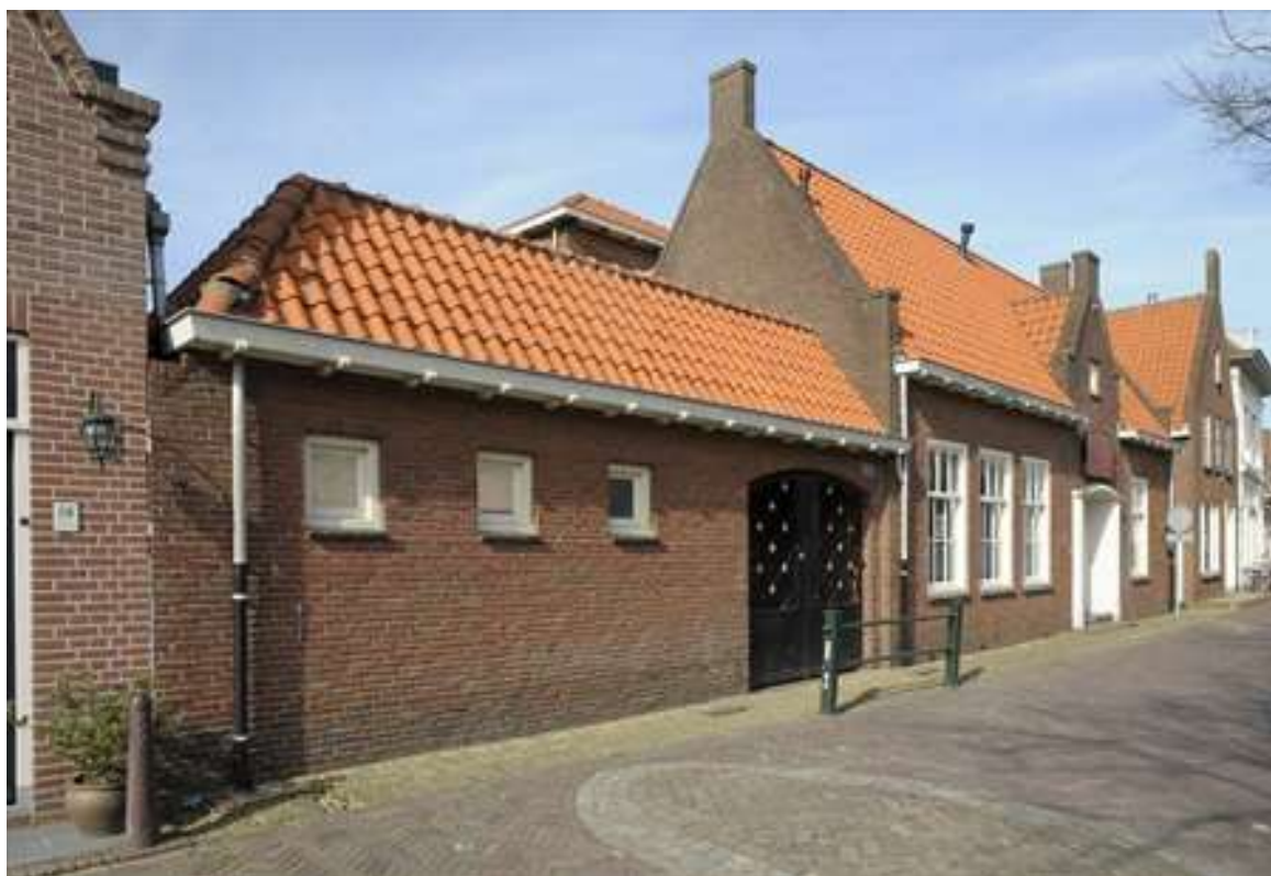
Voorgevel van Voorhaven 114.