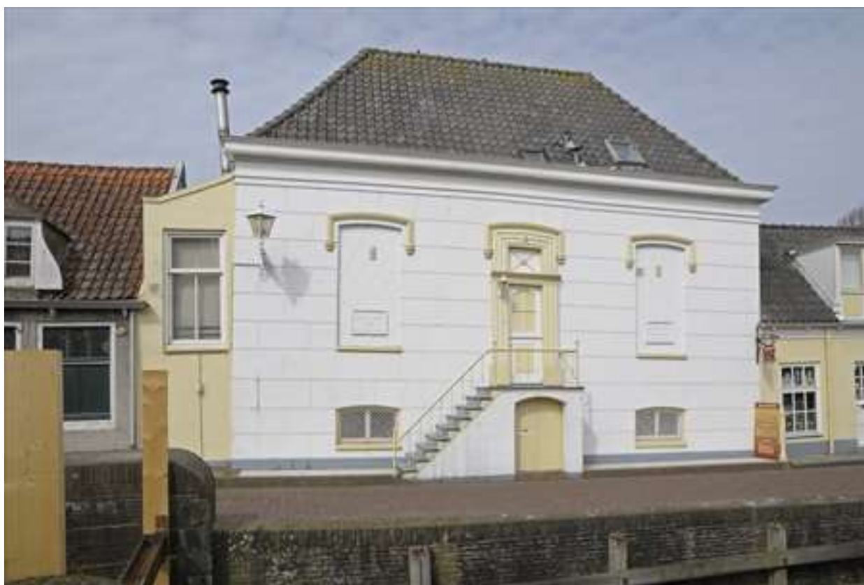
Voorgevel van Wijngaardsgracht 3.