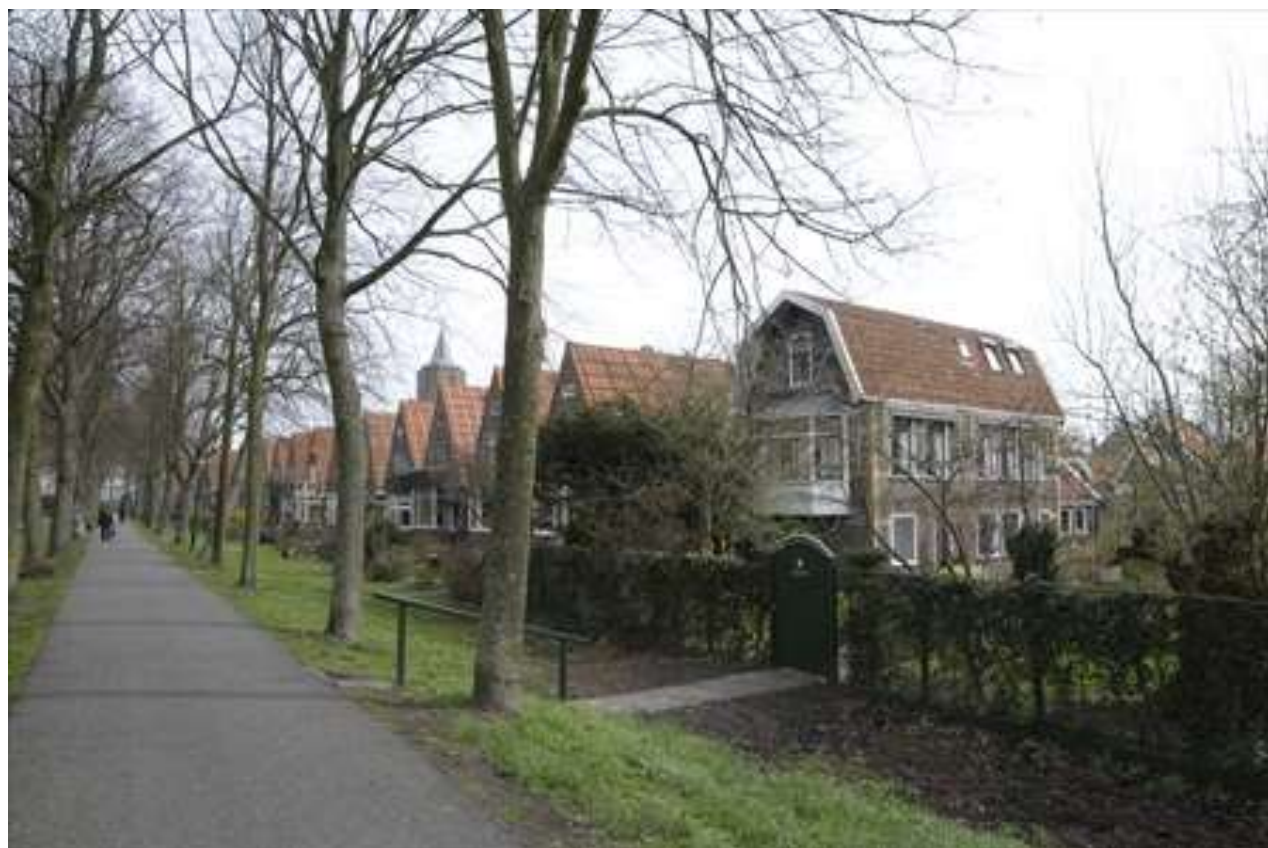
Situering van het pand aan de Westervesting.