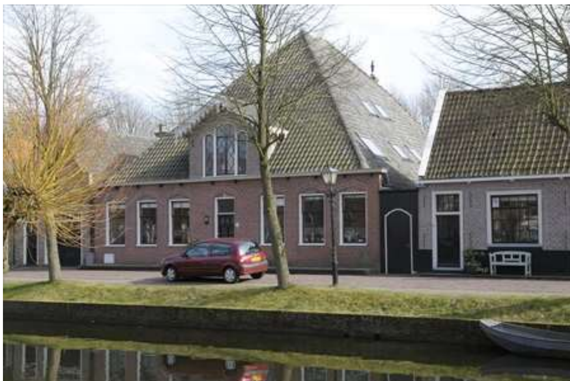
Voorgevel van Voorhaven 25.