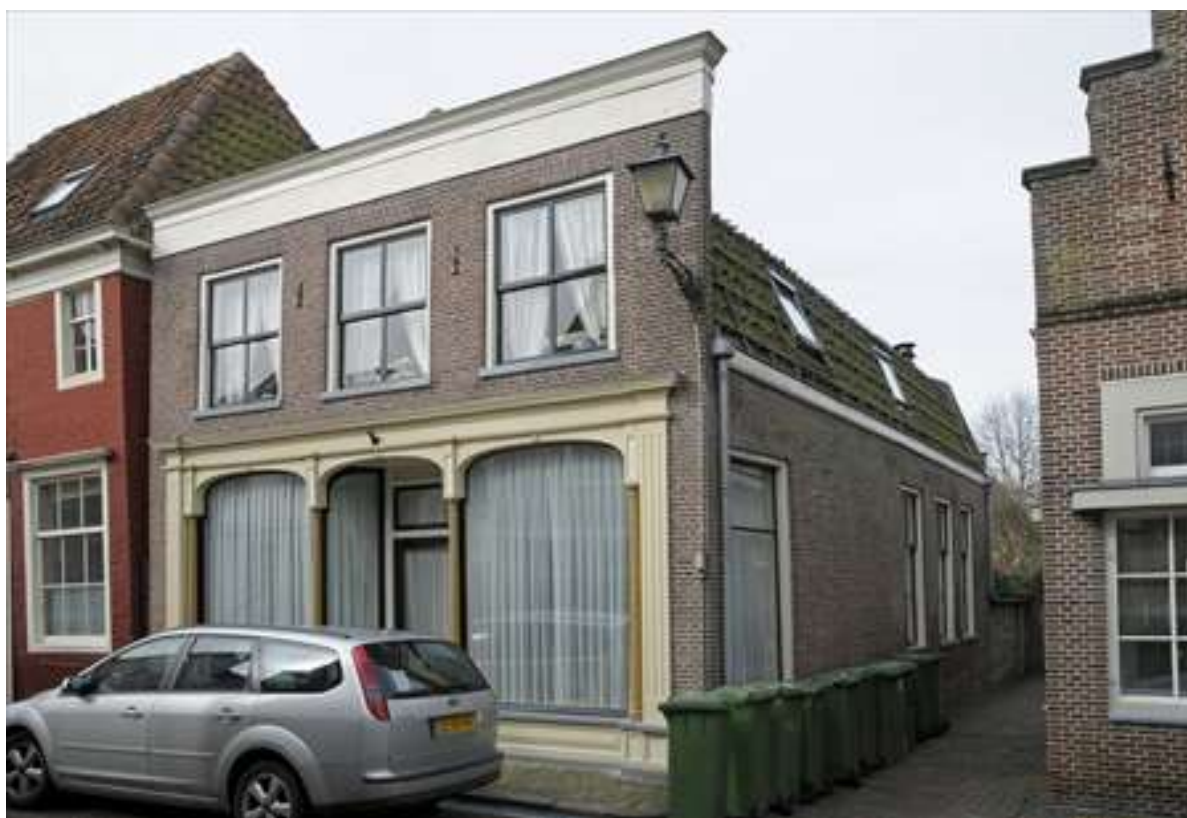
Voor- en zijgevel van Lingerzijde 14.