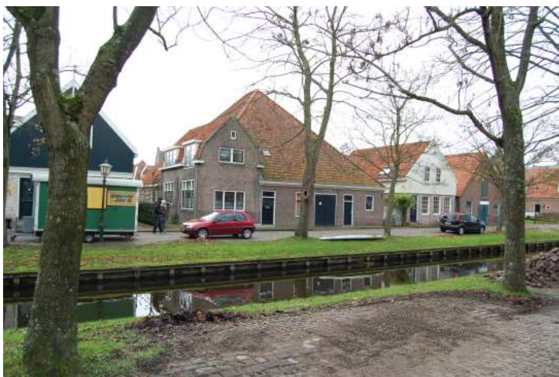
Ligging van de boerderij op de hoek van het Nieuwvaartje en de Grote Molensteeg.