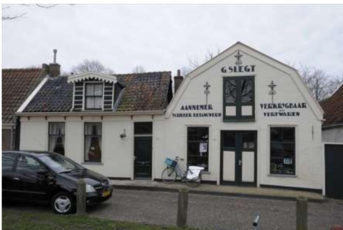
Voorgevel van Jan van Wallendalplein 21 en 23.