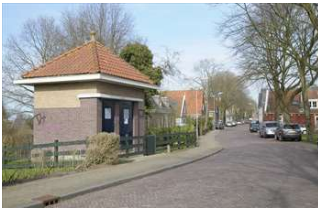
Transformatorhuisje Oorgat 112.