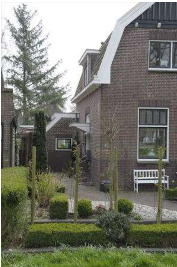
Zicht op de linker zijgevel van het pand.