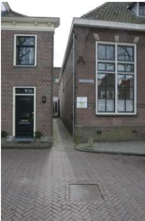
Voormalige Borstelsteeg aan de Linkerzijde van de school.