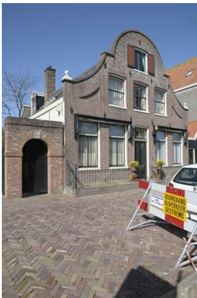
Voorgevel van Nieuwehaven 67.