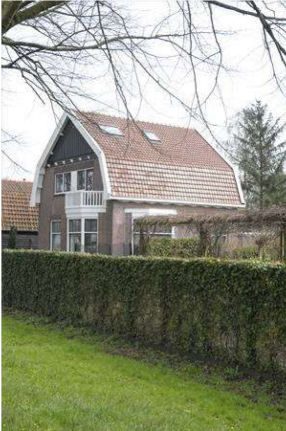
Zicht op de rechter zijgevel van het pand.