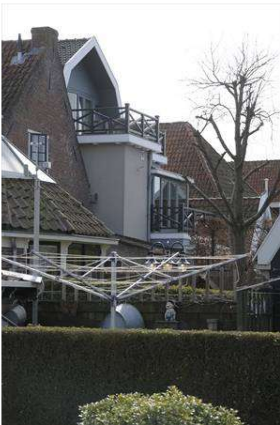
Zicht op de achterzijde van het pand.