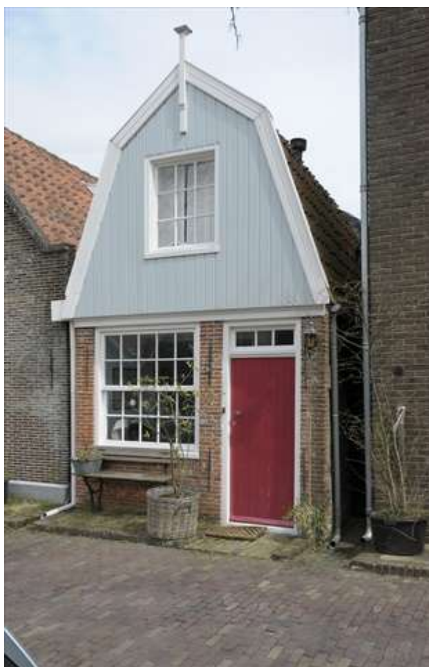
Vorgevel van Groenland 10.