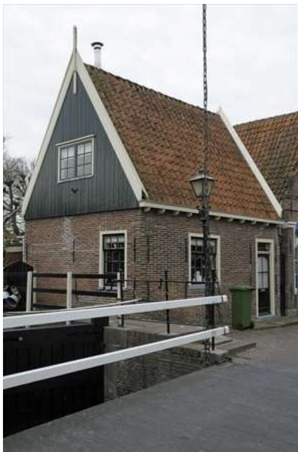
Voorgevel en oostelijke zijgevel van de sluiswachterswoning.