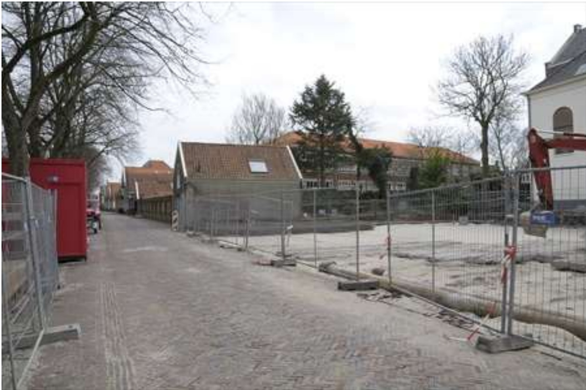
Zicht op de westelijke zijgevel, gezien vanuit de Achterhaven.