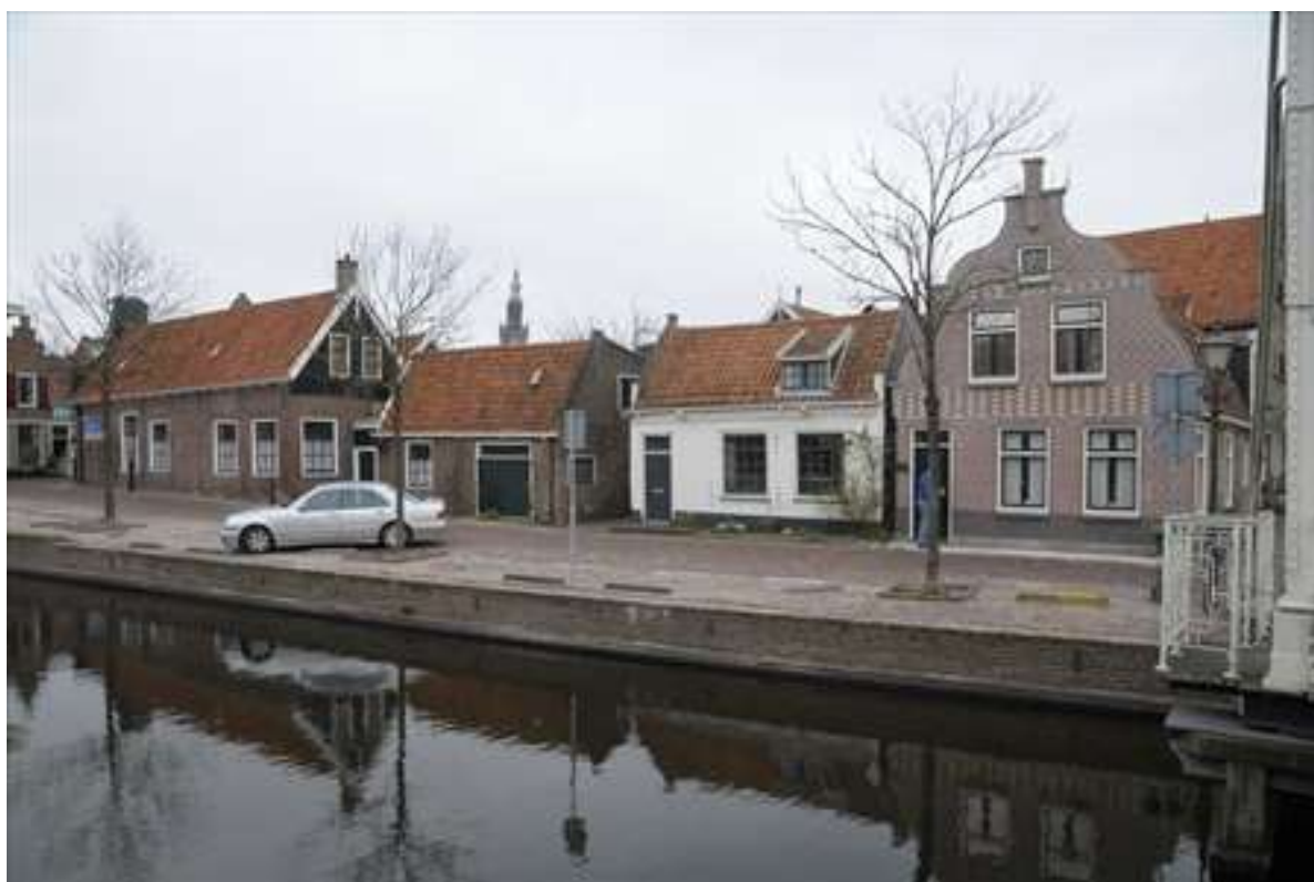
Overzicht van het westelijke deel van de Nieuwehaven.