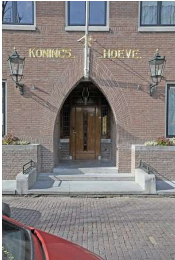
Voorgevel met ingangspartij.