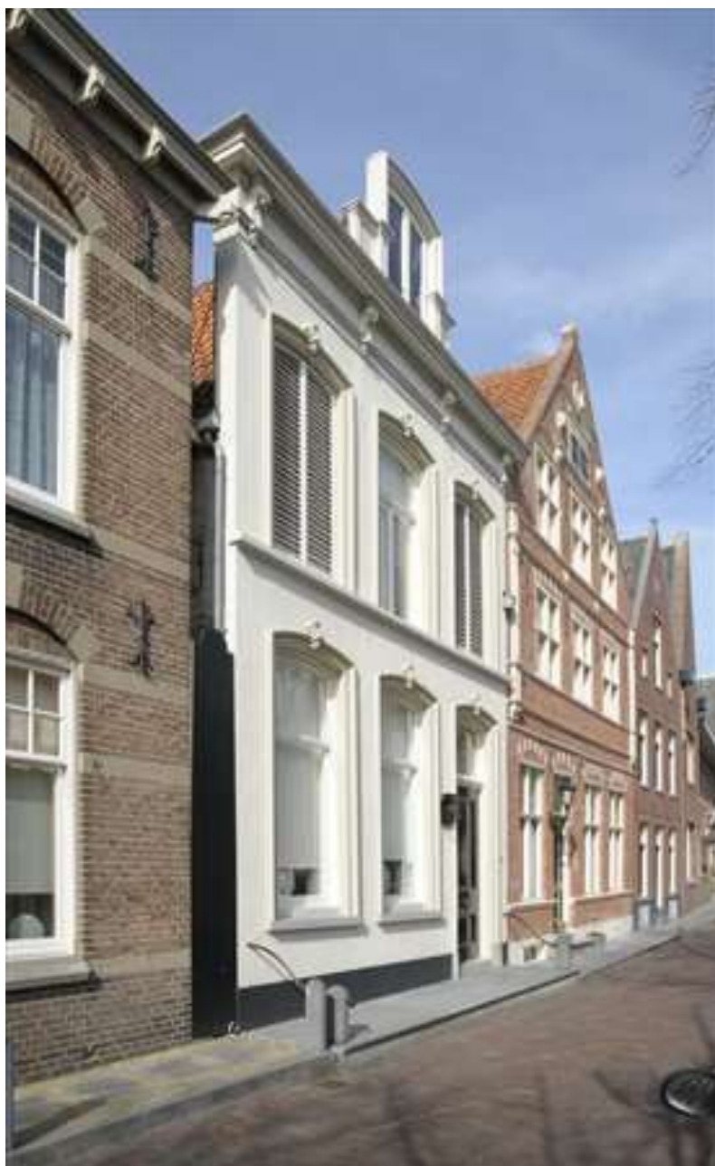
Situering van het pand in de noordelijke gevelwand van de Voorhaven.