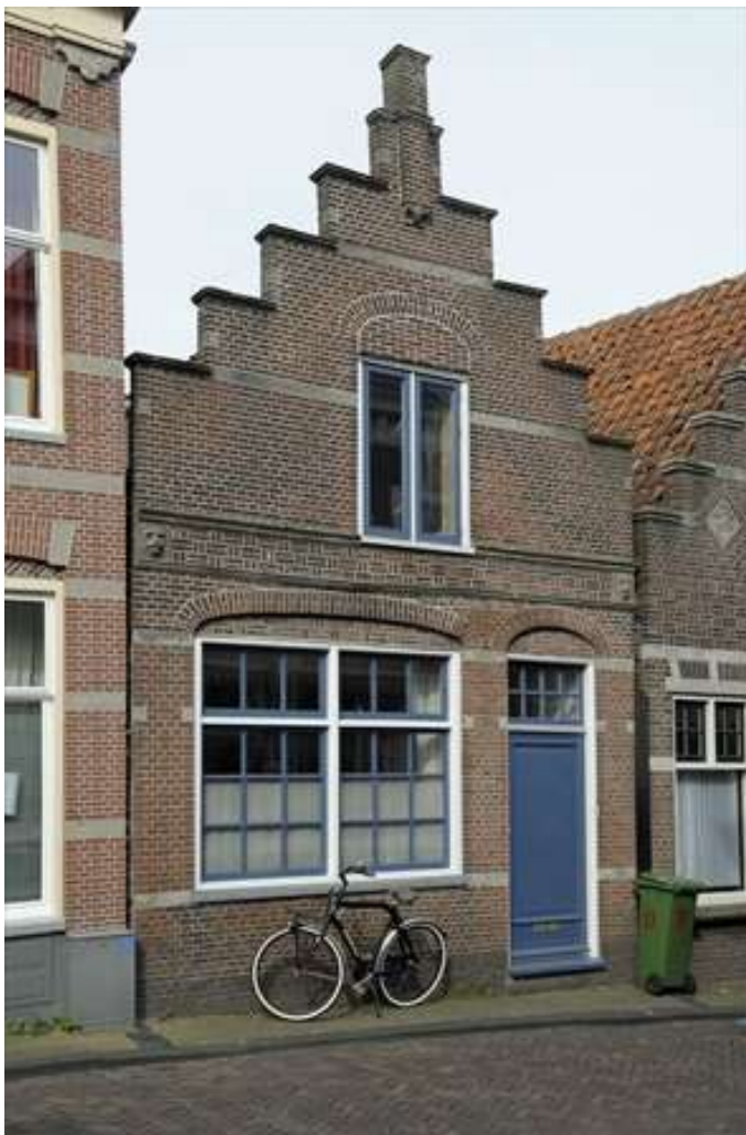
Voorgevel van Prinsenstraat 9.