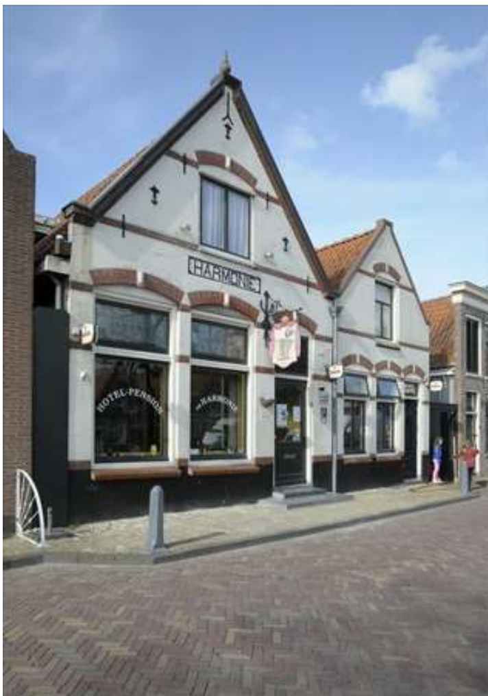
Voorgevel van Voorhaven 94.