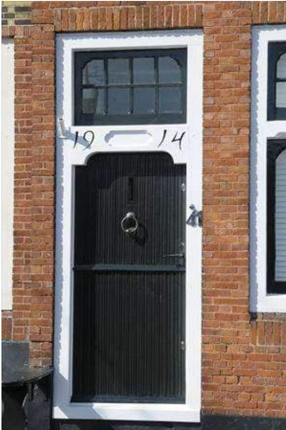
Detail van de deur van het middelste woonhuis met het jaartal 1914.