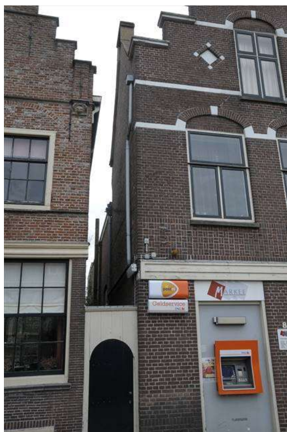
Zicht op de noordelijke (links) en zuidelijke (rechts) zijgevel van het pand.