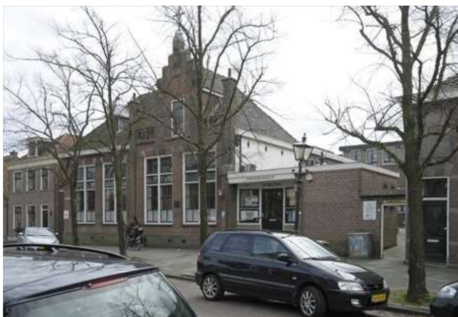
Voorgevel aan de Achterhaven.