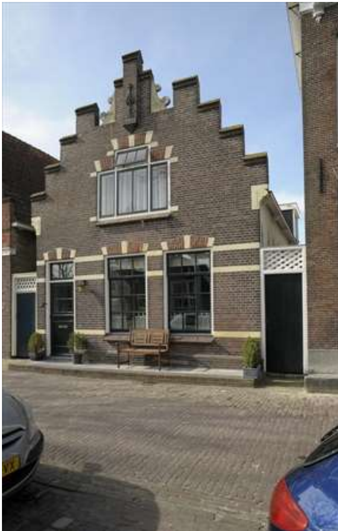
Vorgevel van Voorhaven 82.