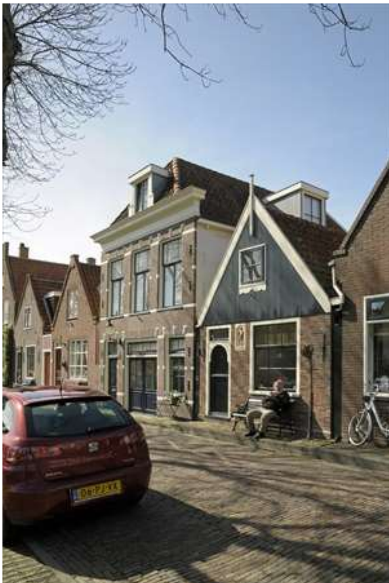
Overzicht van de ligging van het pand aan de Nieuwehaven.