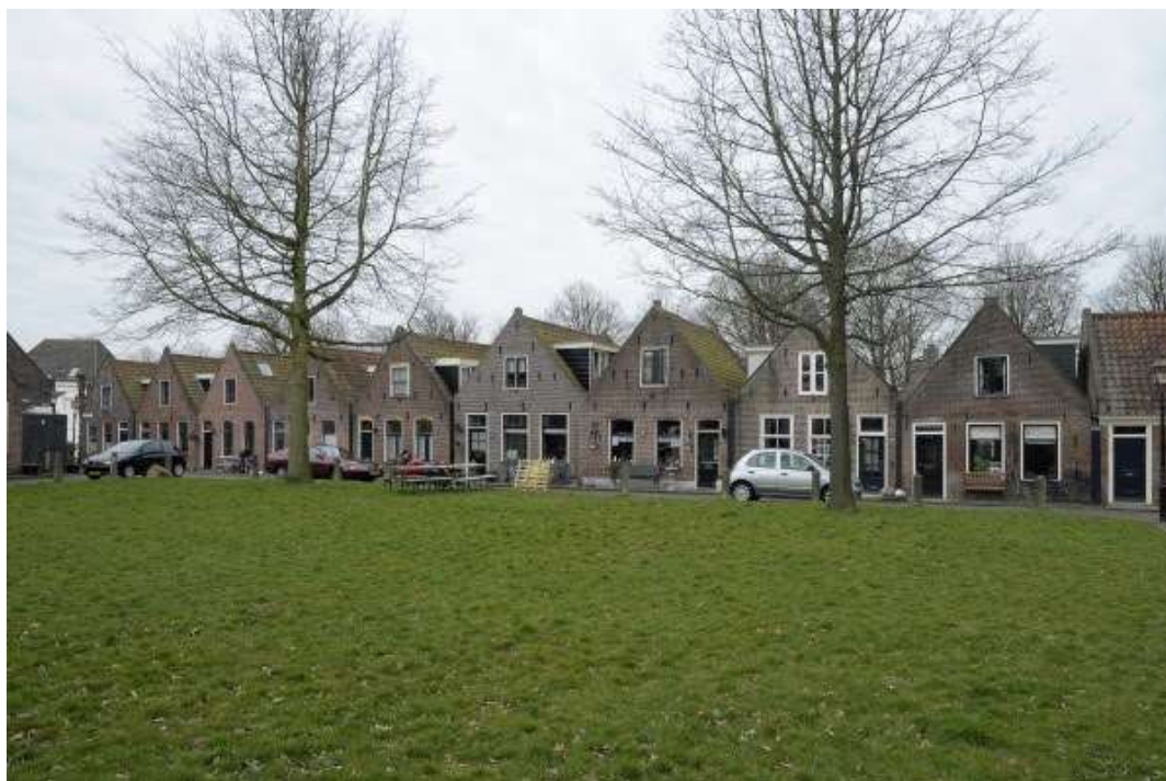
Overzicht van de westelijke gevelwand van het Jan van Wallendalplein.