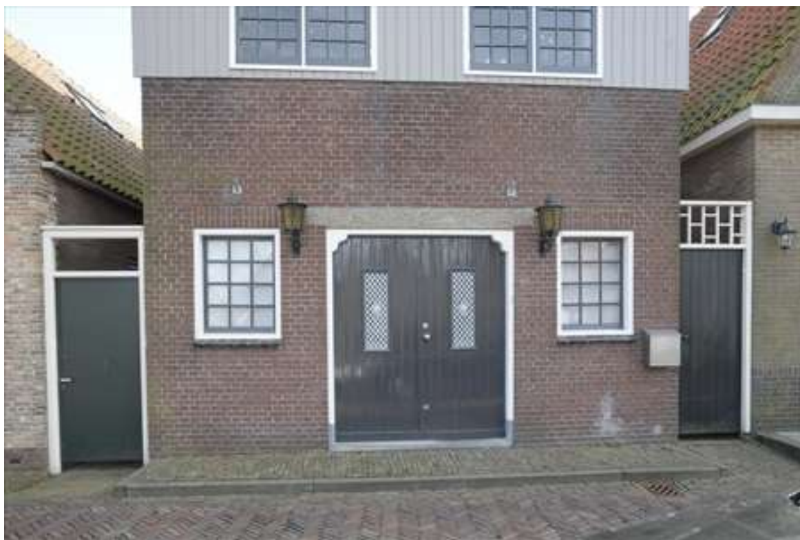
Onderzijde van de voorgevel van Voorhaven 67.