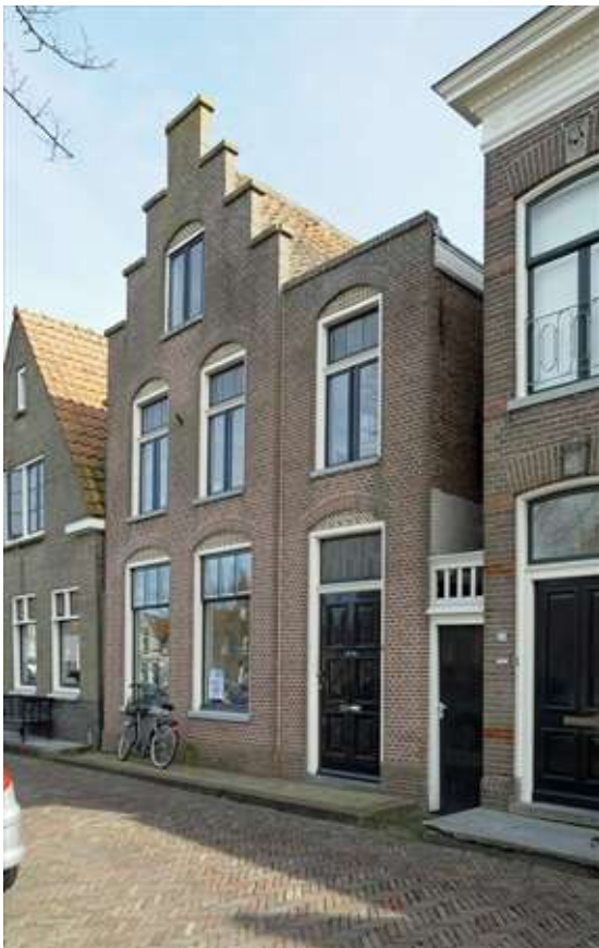
Zicht op de voor- en zijgevel van het pand.