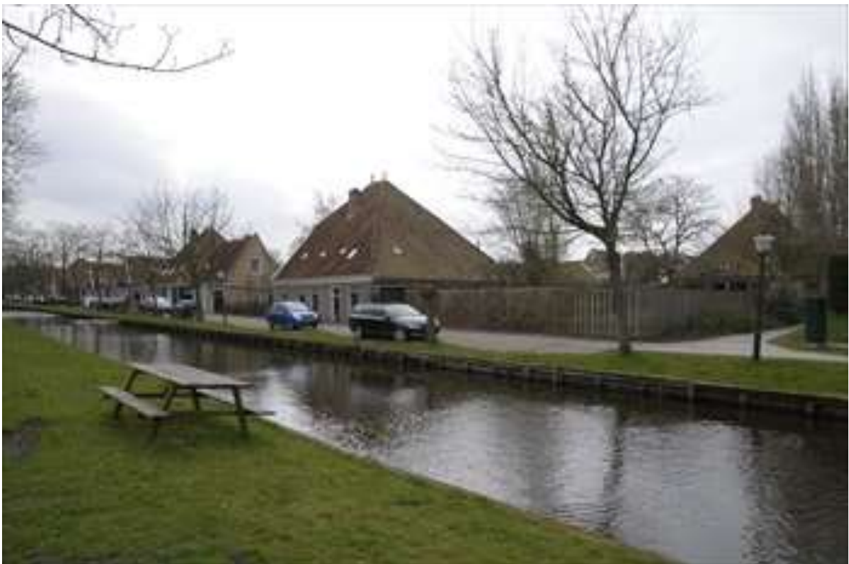
Overzicht van de ligging van de boerderij aan het Nieuwvaartje.