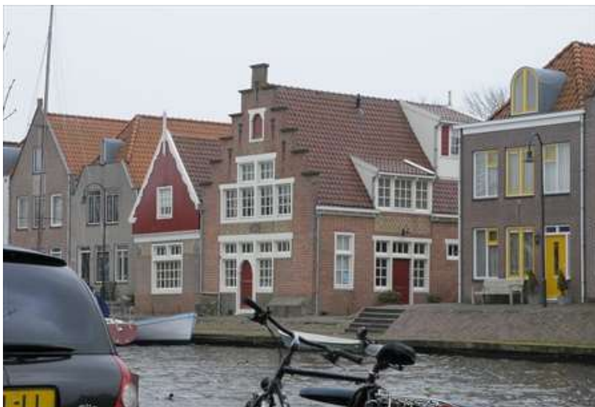
Overzicht van de ligging van de woonhuizen aan de Baandervesting.