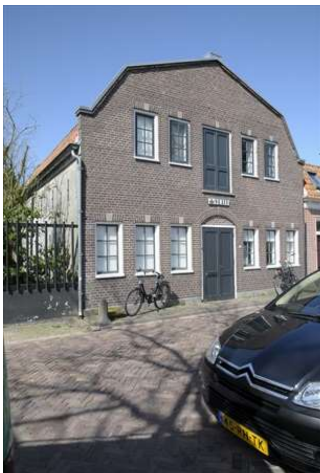
Voorgevel van Nieuwehaven 61.