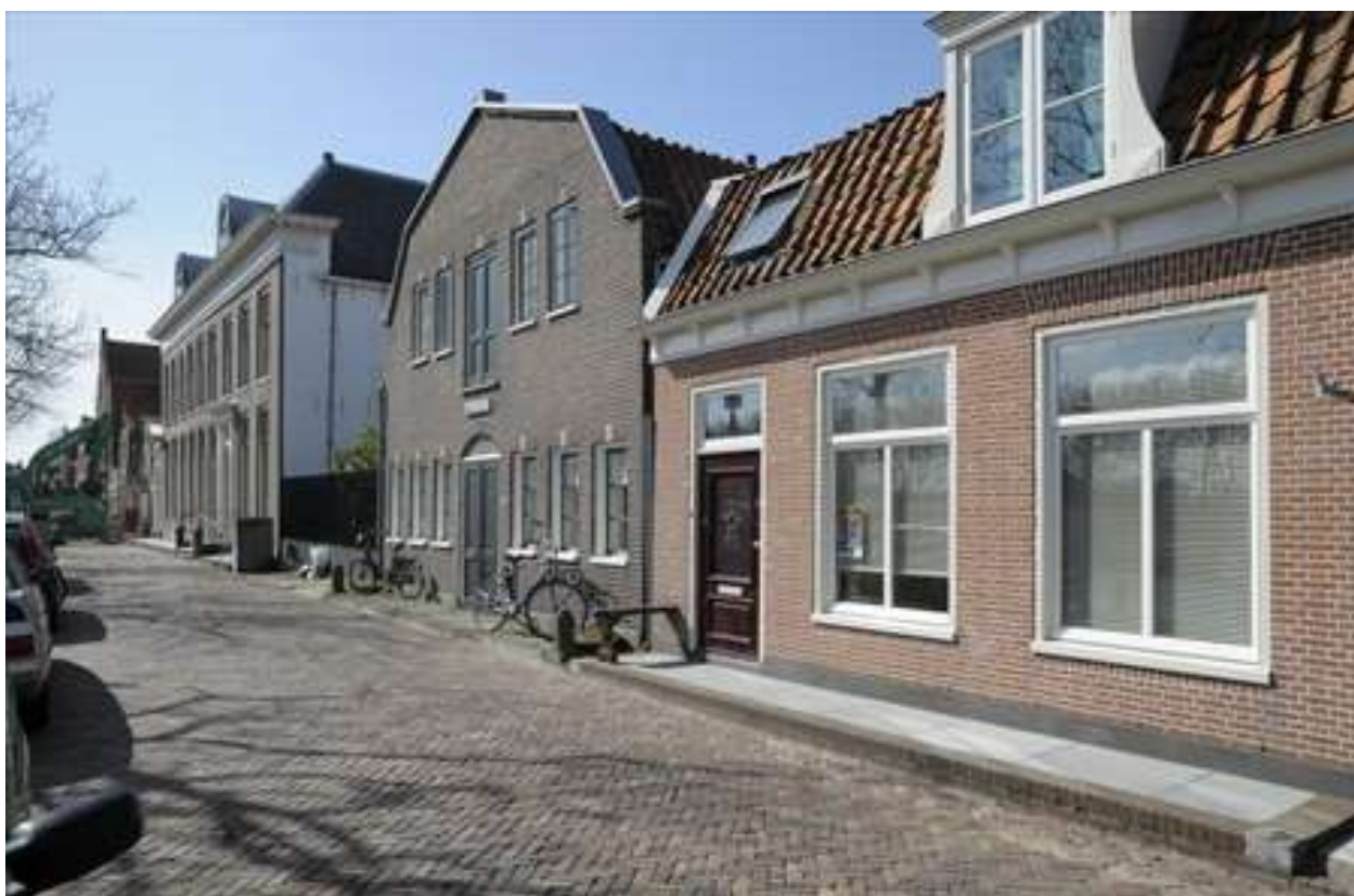
Overzicht van de gevelwand van de Nieuwehaven.