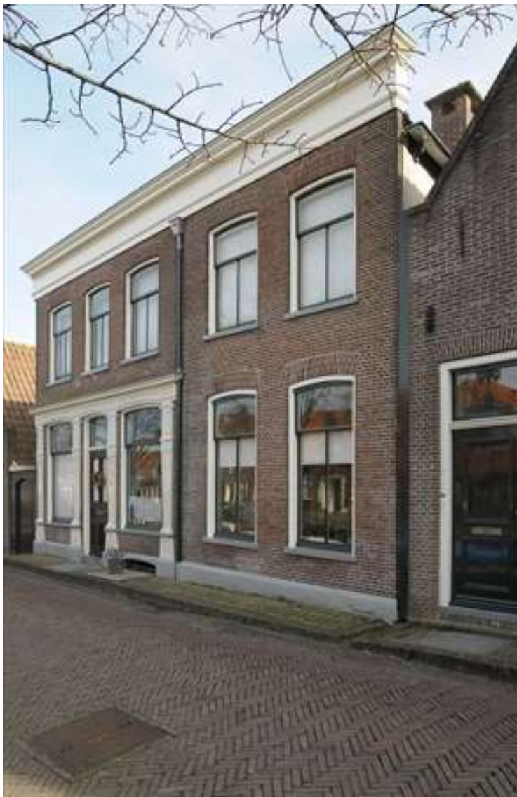
Voorgevel van Voorhaven 85.