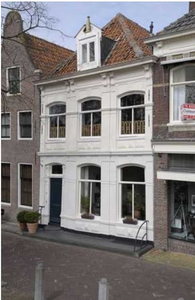
Voorgevel van Spui 2.