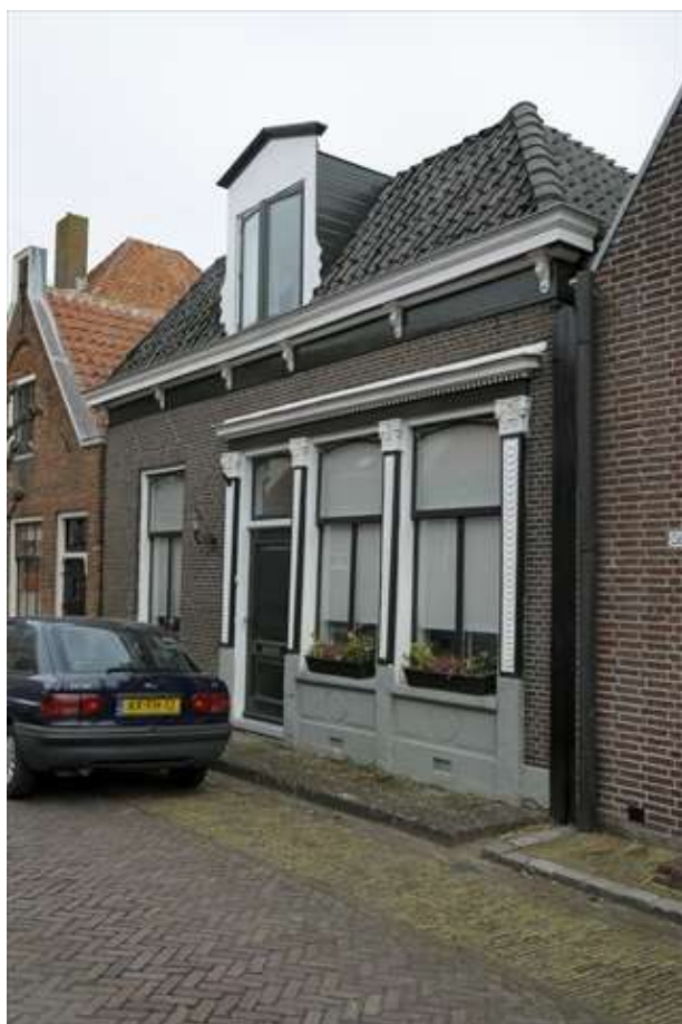
Voorgevel van Grote Kerkstraat 58.