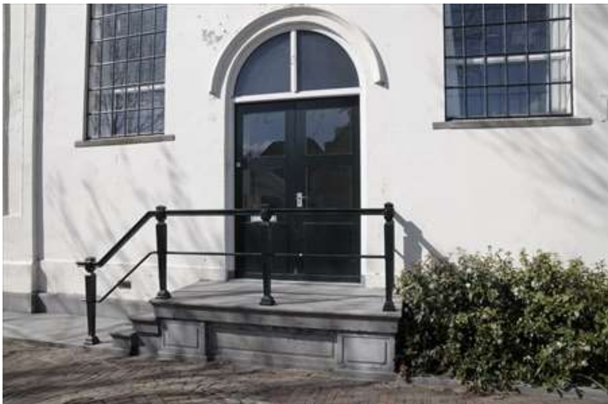
Detail van de entree van de kerk.