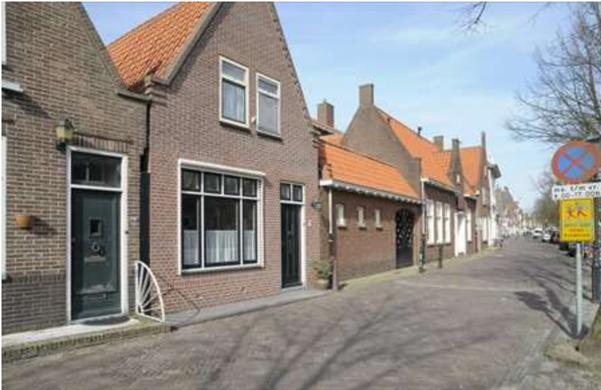
Situering van de school in de noordelijke gevelwand van de Voorhaven.