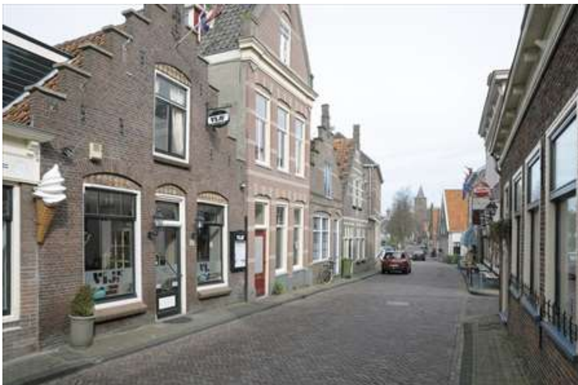
Situering van het pand in de westelijke gevelwand van de Prinsenstraat.