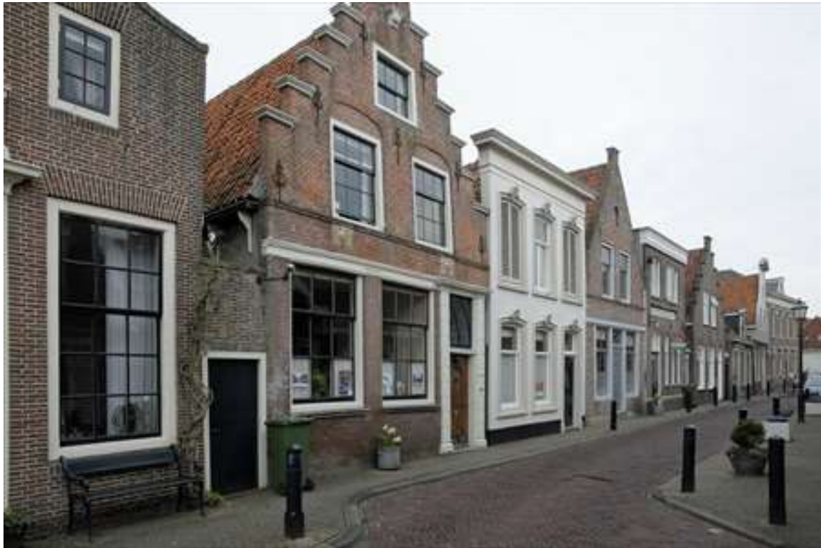
Situering van het pand in de westelijke gevelwand van de Spuistraat.