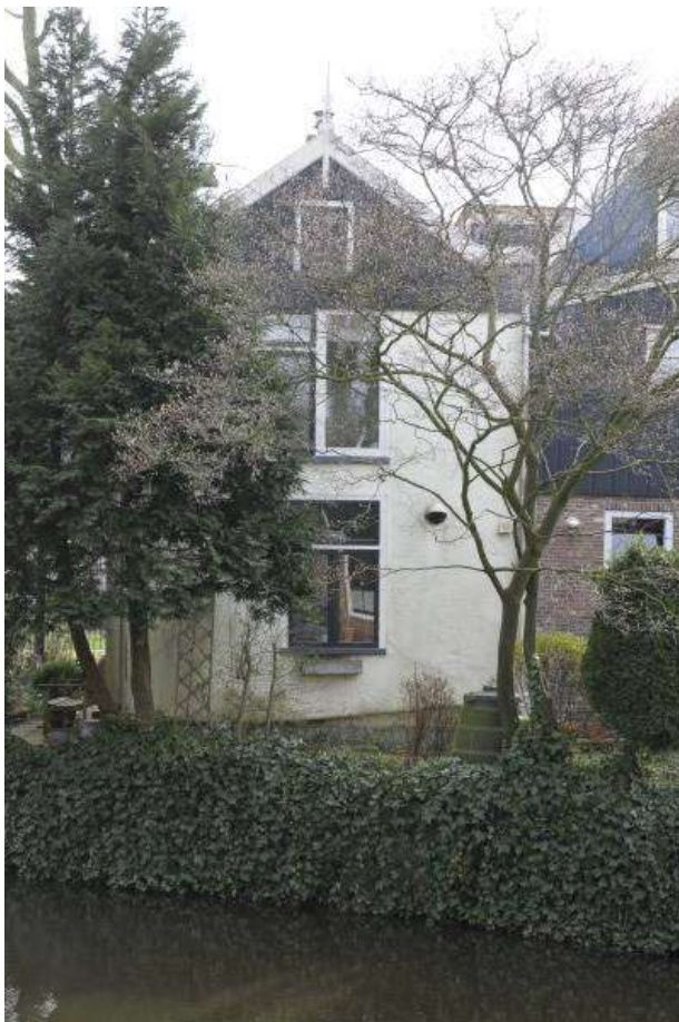
Zicht op de achtergevel van het pand.