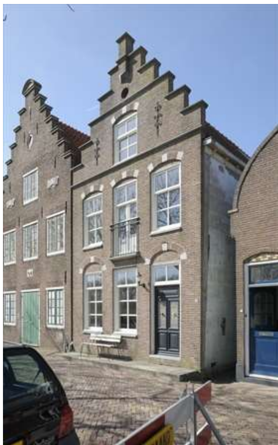
Voorgevel van Nieuwehaven 53.