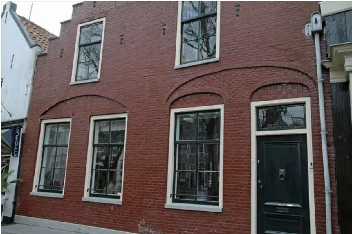
Zicht op de onderzijde van de voorgevel aan de Keizersgracht.