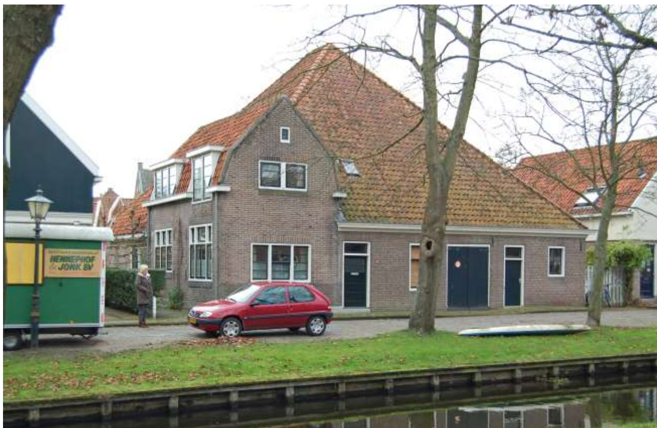
Voorgevel van de boerderij aan het Nieuwvaartje