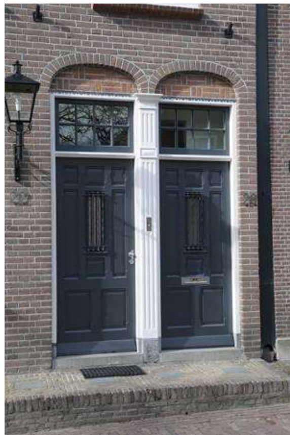
Detail van de dubbele deur in de voorgevel.