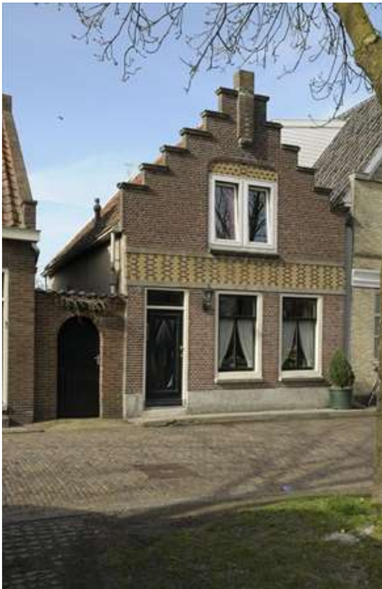
Voorgevel van Voorhaven 54.