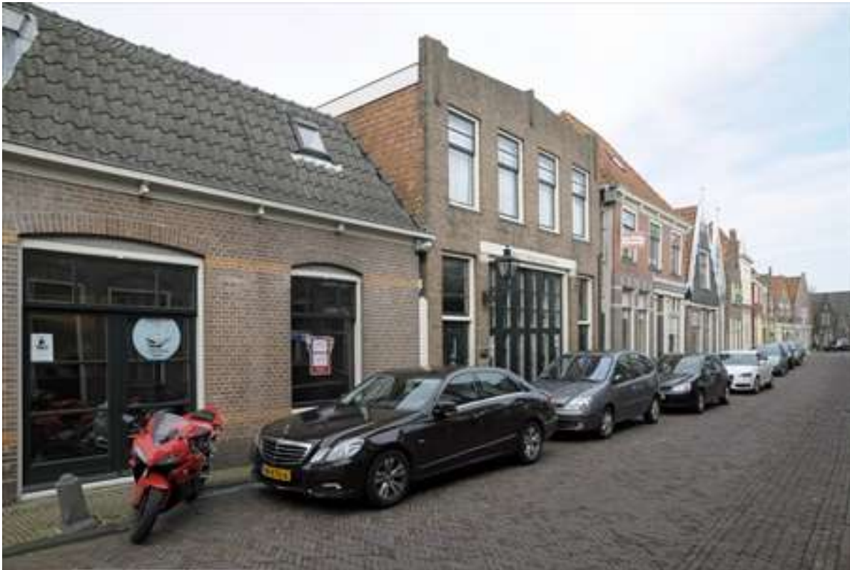
Overzicht van de ligging van het pand in de westelijke gevelwand van de Lingerzijde.