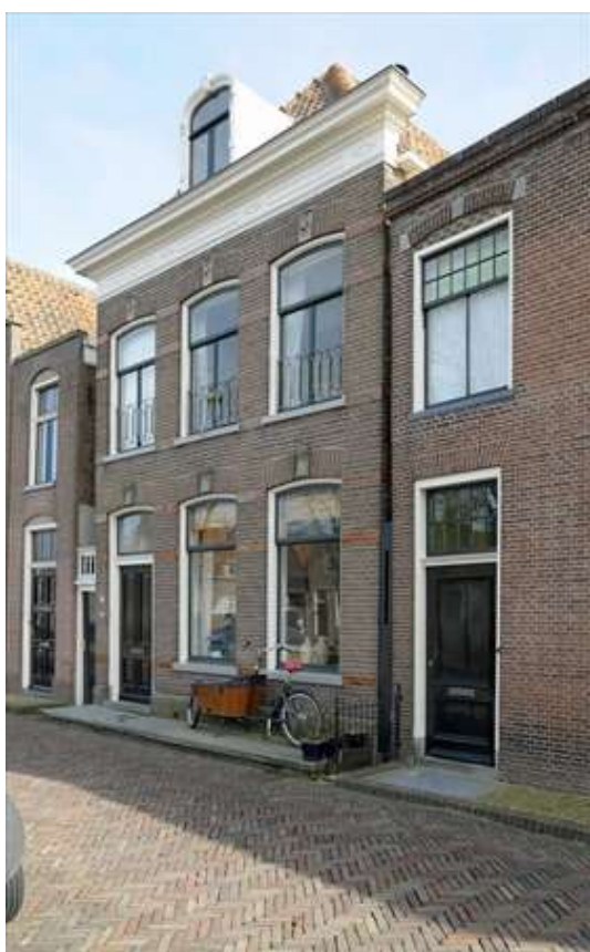
Situering van het pand in de zuidelijke gevelwand van de Voorhaven.