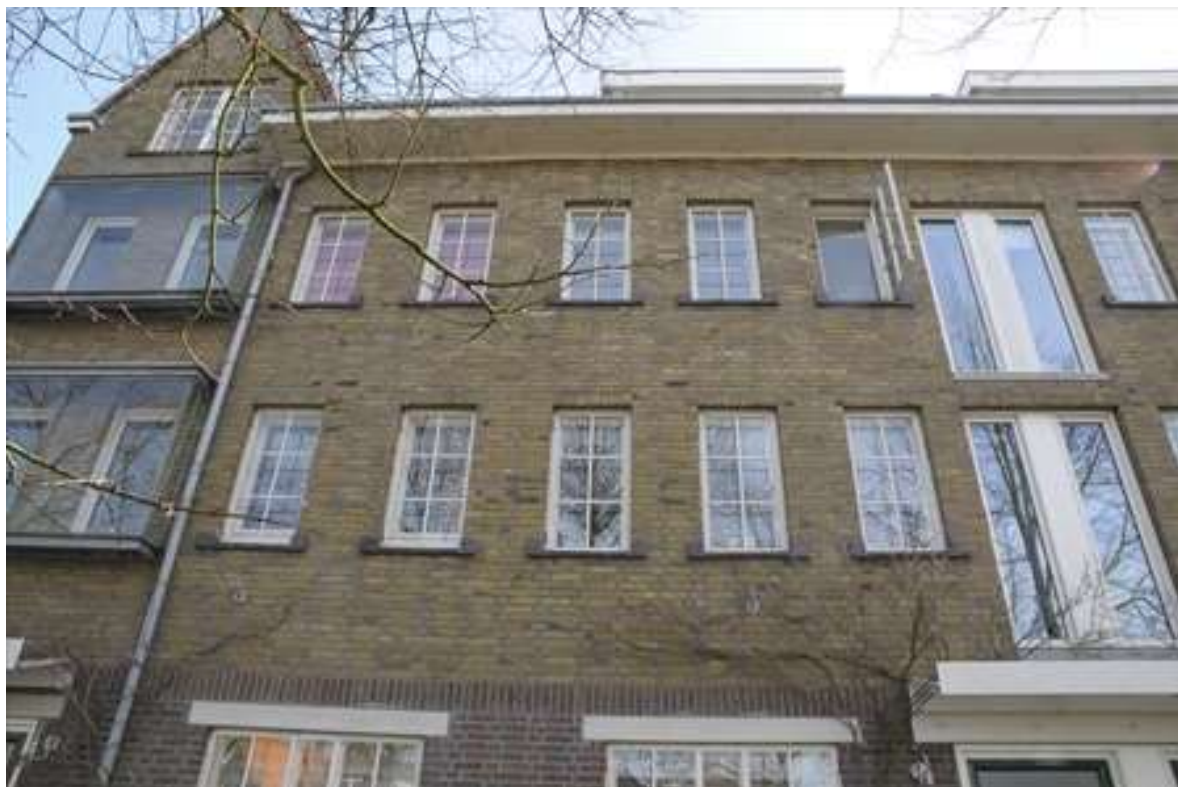
Detail van de voorgevel van Voorhaven 41.