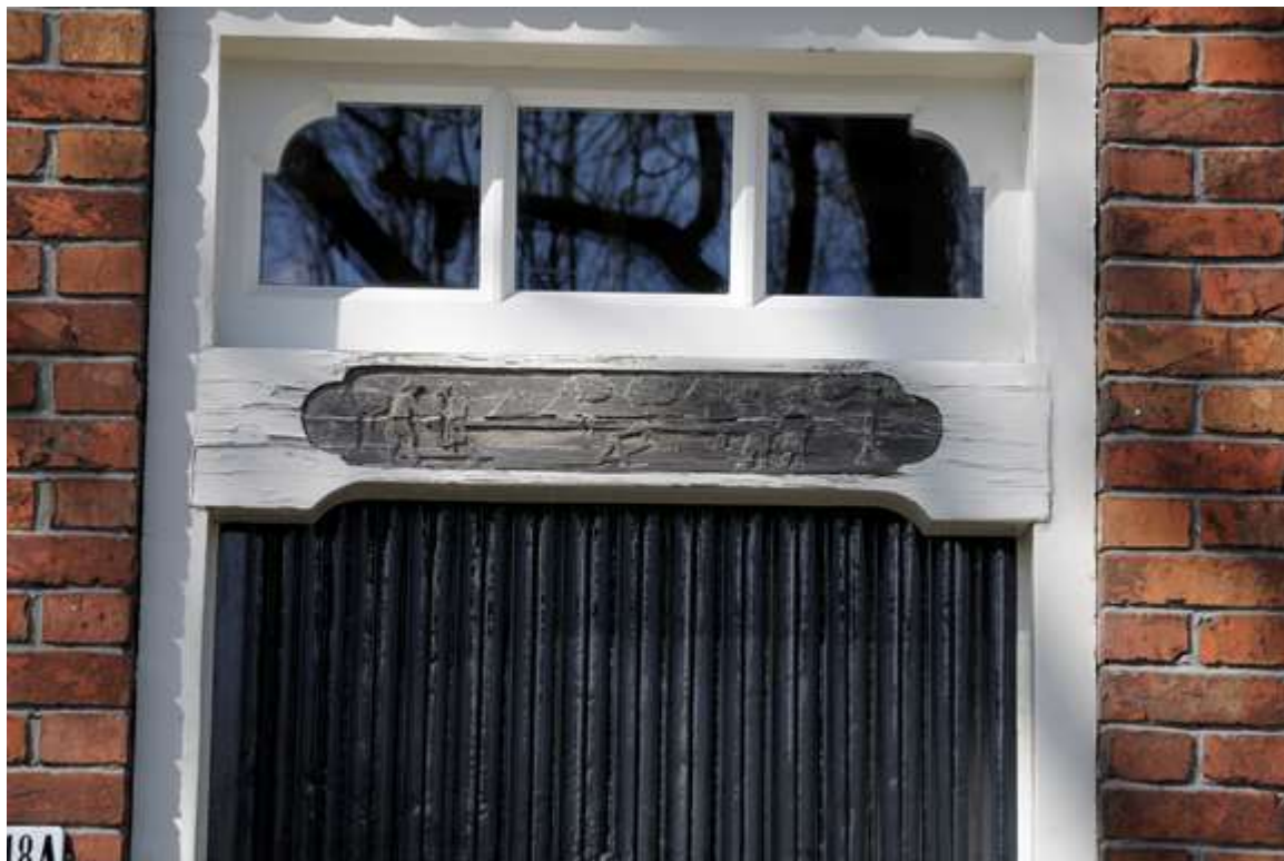
Voordeur rechts met een paneel met verwijzing naar de touwslagerij.