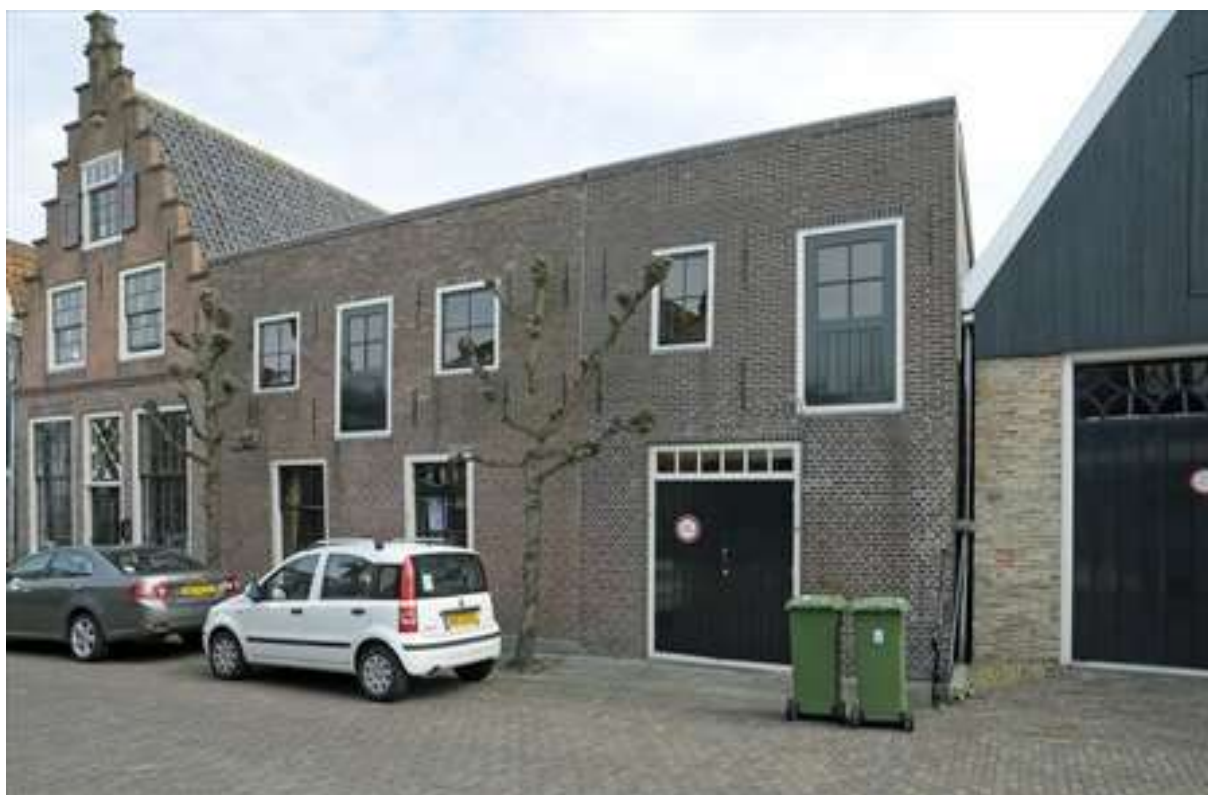
Voorgevel van het pand Breestraat 8.