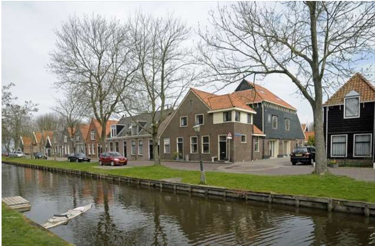
Overzicht van de oostelijke gevelwand van het Groenland.