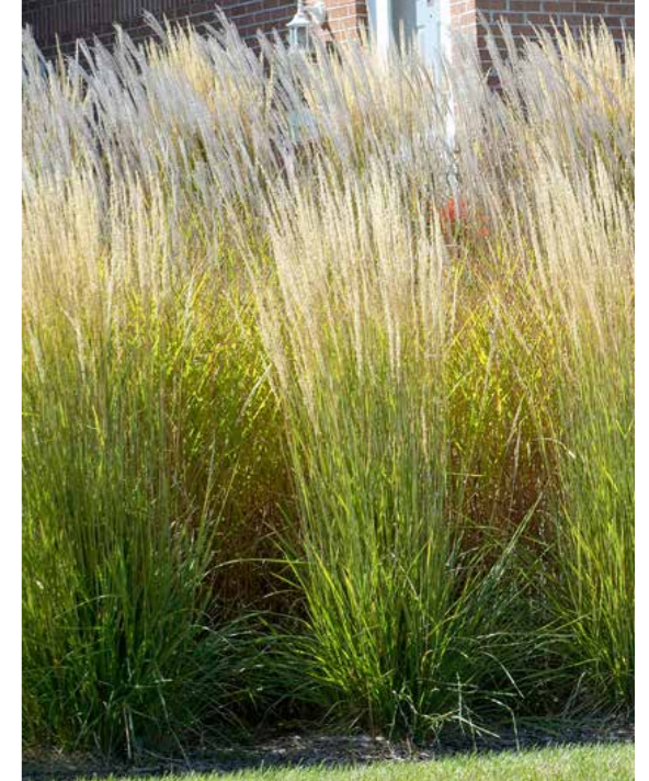
Calamagrostis acutiflora 'Karl Foerster'