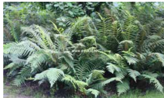
Polystichum setiferum 'Dahlem'