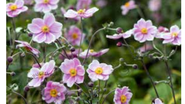
Anemone hupehensis 'September Charm'