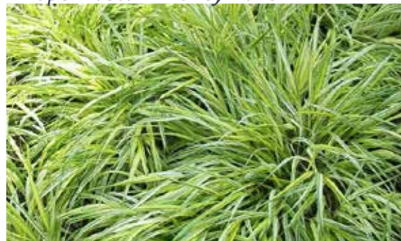
Carex morrowii 'Variegata'