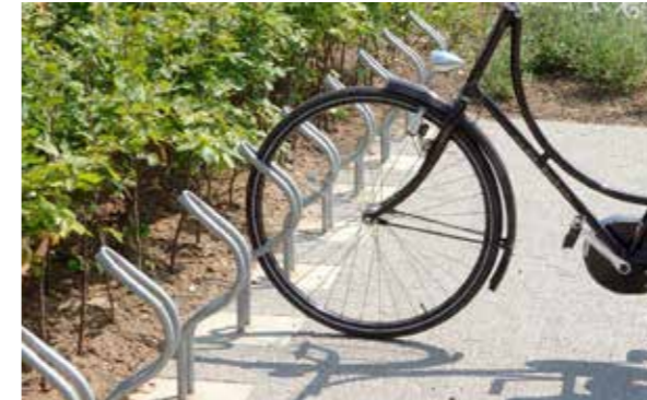
Fietsvriend fietsklem, Velopa h.o.h. 30 cm