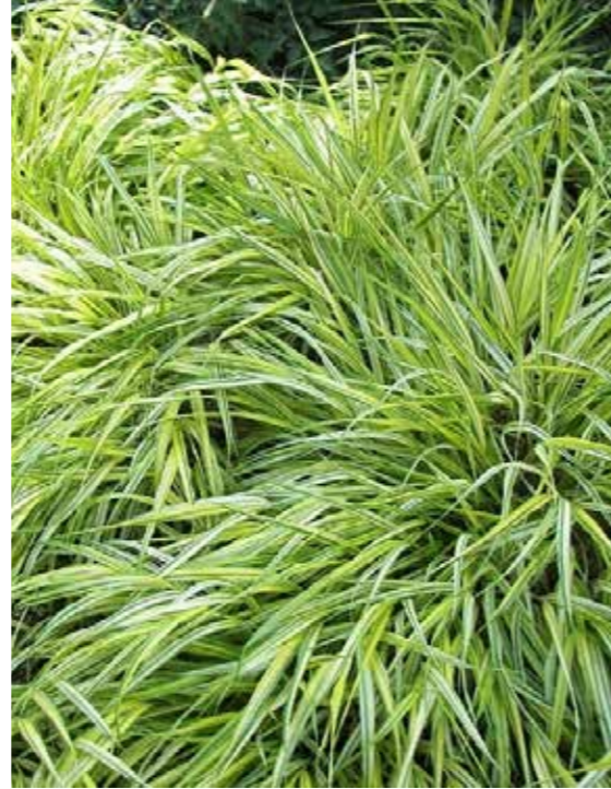
Carex morrowii 'Variegata'