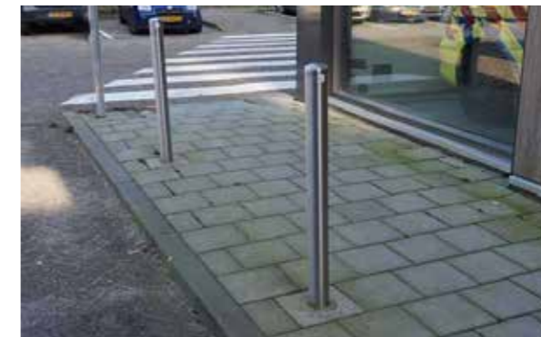
RVS afzetpaal Ø 89 mm, 7 stuks in 30x30 tegel