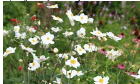
Anemone honorine 'Jobert'