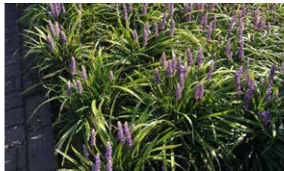
Liriope muscari 'Moneymaker'