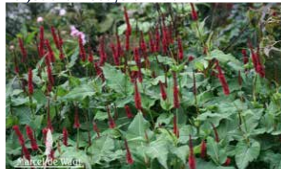
Persicaria amplexicaulis blackfield