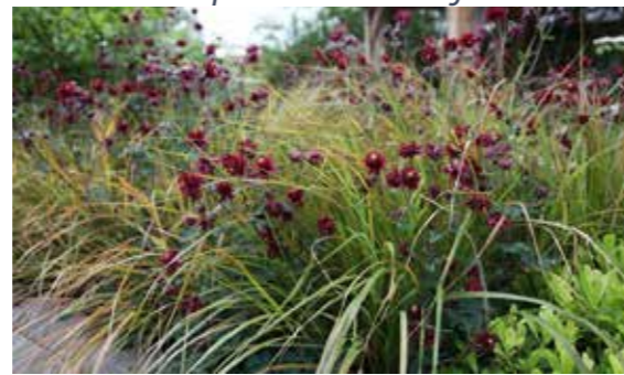
Aquilegia vulgaris 'Ruby Port'