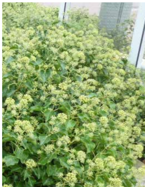
Hedera helix 'Arborescens'