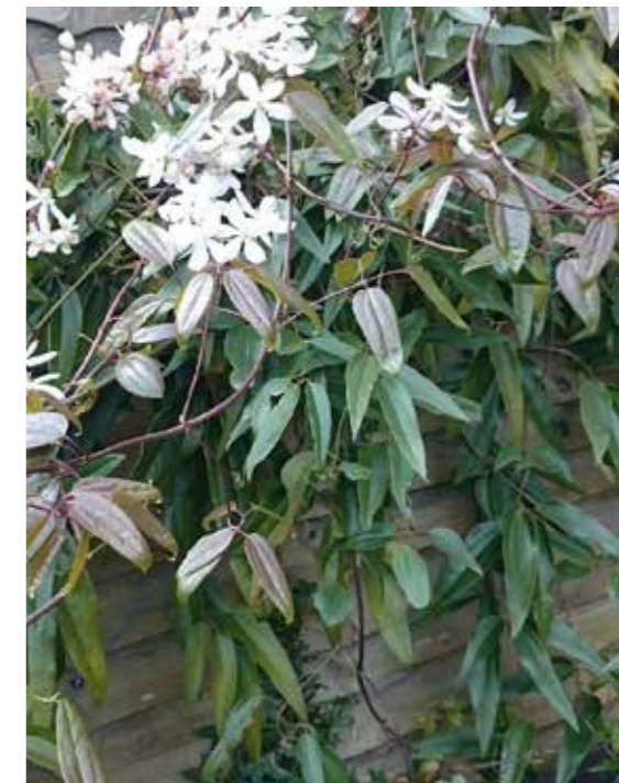
Clematis arandii (wintergroen)