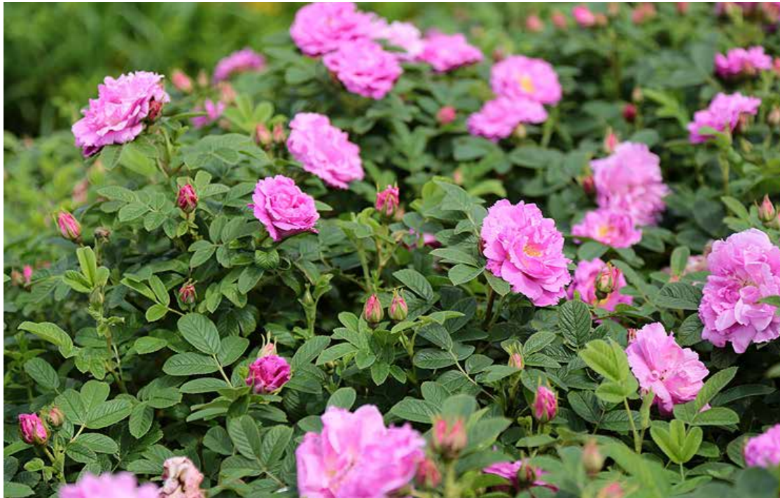
Rosa 'Street Dance'