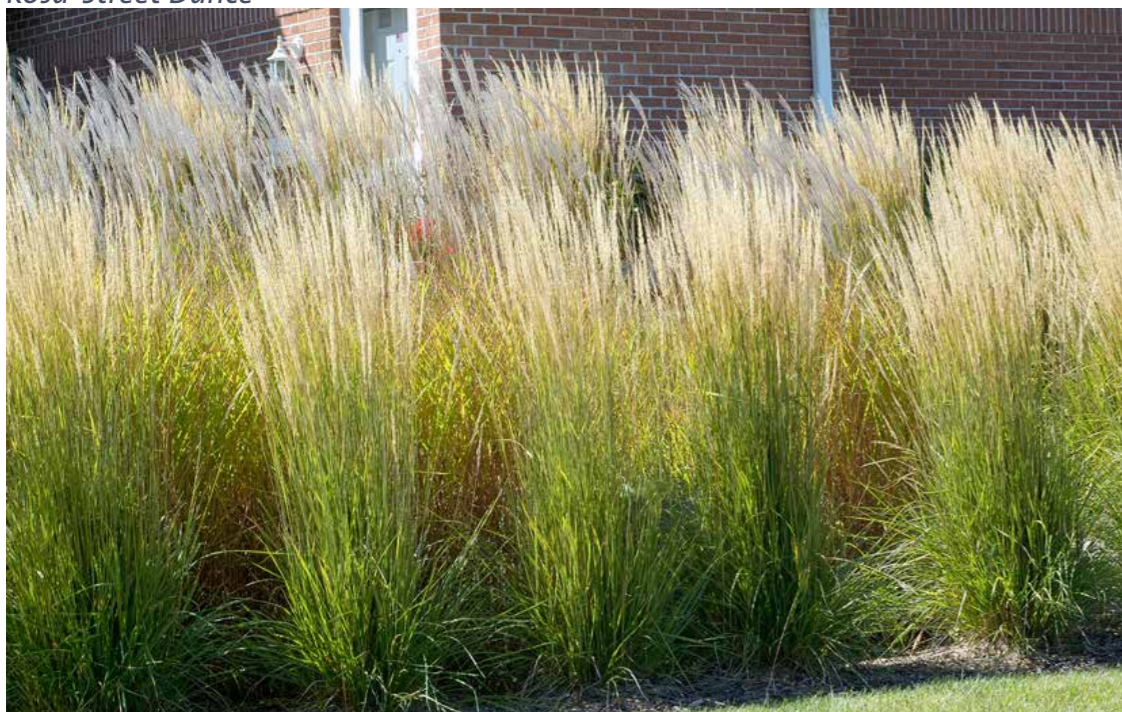
Calamagrostis acutiflora 'Karl Foerster'