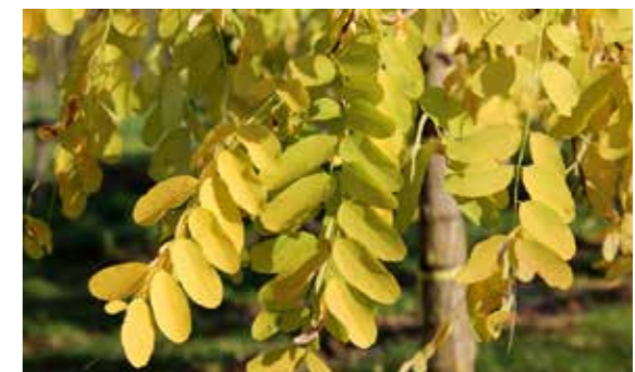
Robinia pseudoacacia 'Appalachia'