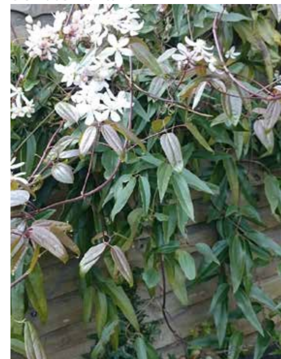
Clematis armandii (wintergroen)