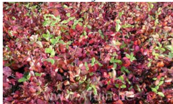
Euonymus fortunei 'Coloratus'