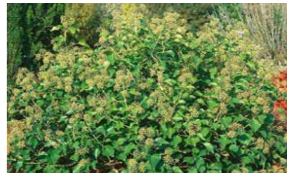
Hedera helix 'Arborescens'