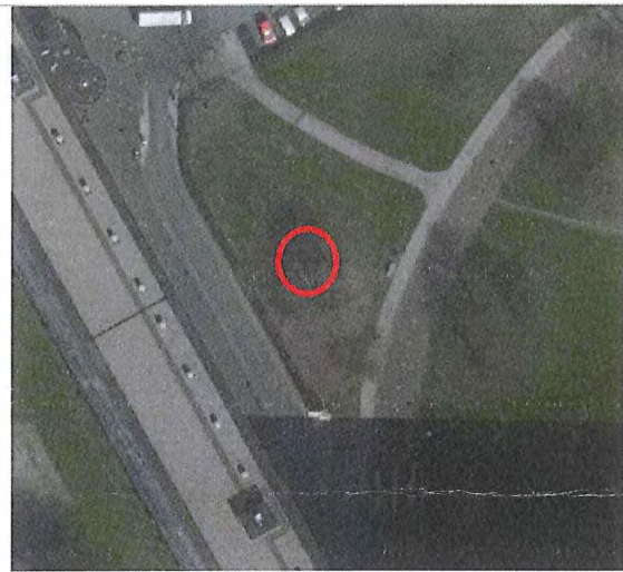
Afbeelding 1b: Ligging gasdrukmeet- en regelstation (rode cirkel).