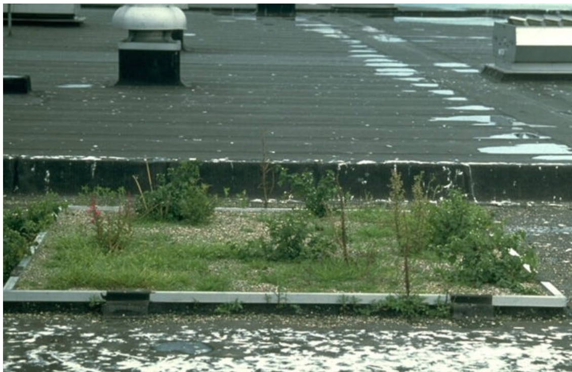
Voorbeeld van een grindbak op het dak van de bloemenveiling te Aalsmeer

Vanuit de Flora- en faunawet is compensatie niet noodzakelijk. Alternatieve broedgelegenheid voor visdiefjes kan op grinddaken en daken met groene dakbedekking van gebouwen in de omgeving worden aangeboden.