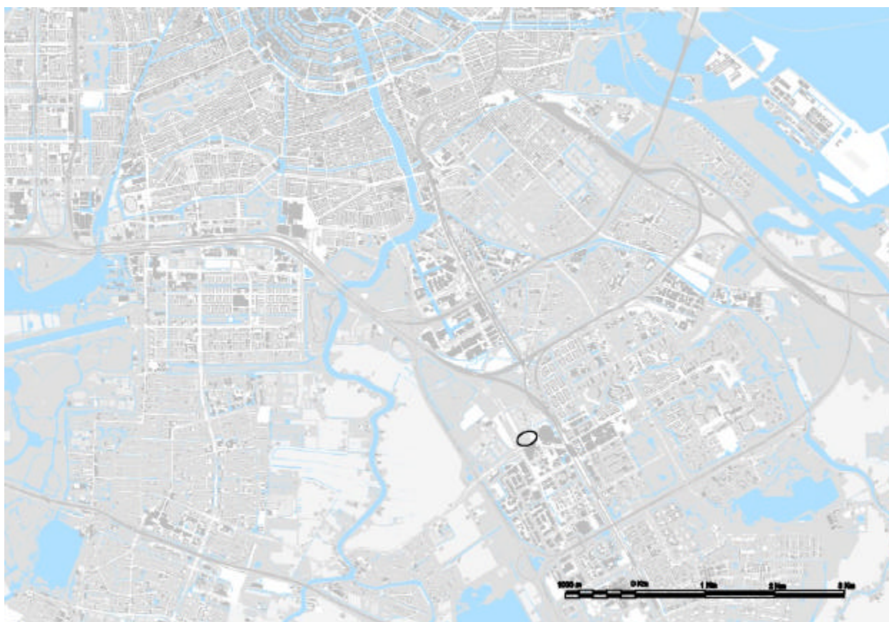
Ligging van het plangebied, Amersfoortcoördinaten 124300, 480700

In opdracht van het planteam REO is een natuurtoets uitgevoerd voor de bouw van een Music Dome in Amsterdam Zuidoost. Op de geplande locatie bevindt zich nu een parkeerterrein en een groengebied in een lus van de afslag van de Burgemeester Stramanweg. In deze lus broedt jaarlijks een kolonie kokmeeuwen, visdiefjes en enkele zwartkopmeeuwen. Voor deze soorten en de andere broedvogels is een ontheffingsaanvraag Flora- en faunawet niet nodig. De nesten van de vogels zijn gedurende de broedtijd beschermd, bij de planning en de uitvoering van de werkzaamheden moet hier rekening mee worden gehouden. Geadviseerd wordt om in de omgeving daken zo in te richten, dat visdiefjes er op kunnen broeden. Alhoewel de kans, dat de rugstreepdijk vanuit de Duivendrecht polder het plangebied kan bereiken klein wordt geacht, wordt toch geadviseerd om bij de werkzaamheden voorzorgsmaatregelen te treffen. Dit kan door er voor te zorgen dat er geen voortplantingswater beschikbaar is.