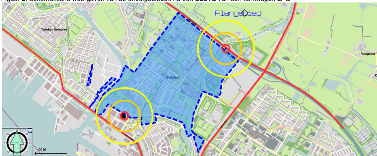
Figuur 2. Schematische weergaven van de effectgebieden na een BLEVE van een tankwagen LPG

↔ Een ongeval met een tankwagen LPG kan overal plaatsvinden waar LPG wordt vervoerd.