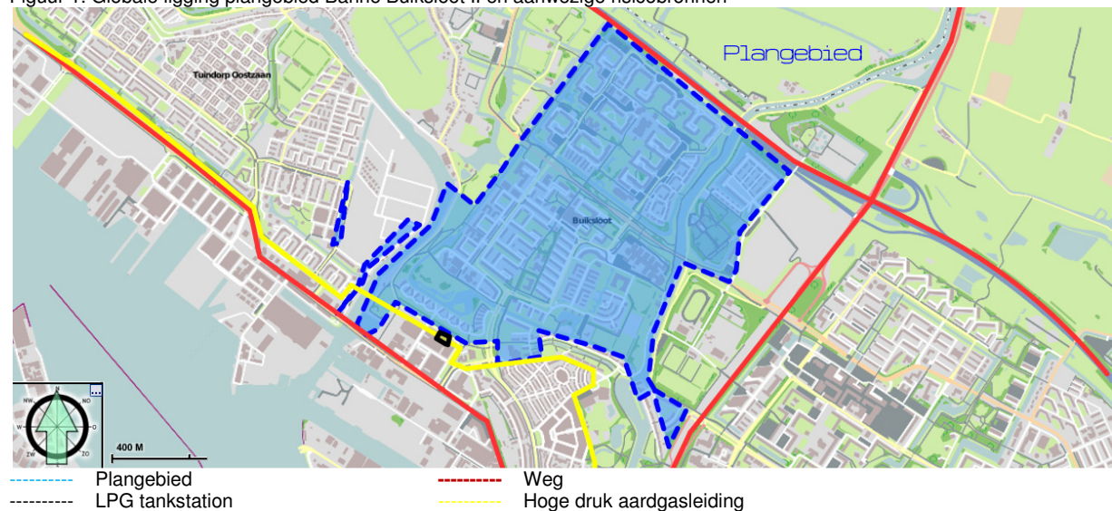
Figuur 1. Globale ligging plangebied Banne Buiksloot II en aanwezige risicobronnen

Het plan is in hoofdzaak een conserverend bestemmingsplan maar maakt verdichting en verdunning van woningen mogelijk. Verdichting zal vooral plaatsvinden aan de IJdoornlaan, het centrumgebied en de Noordzuidboulevard. Verdunning van het aantal woningen zal voornamelijk plaats vinden in het gebied ten zuiden van het centrumgebied [1].