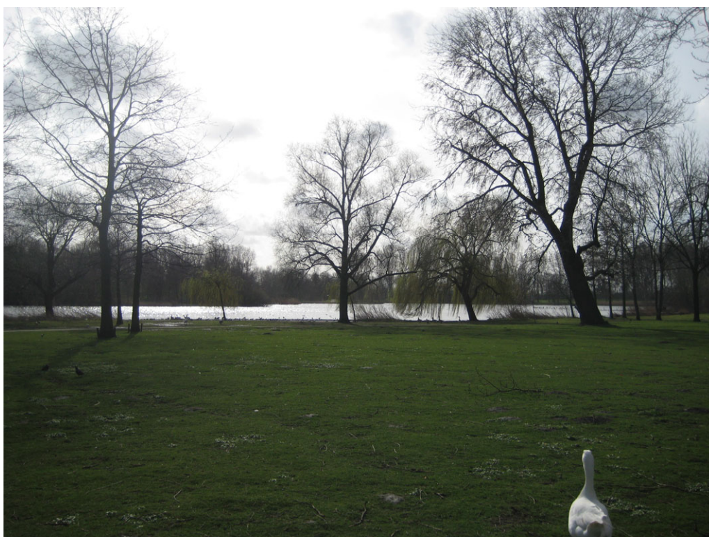
Uitzicht vanaf locatie C en C'

Locaties C en C' hebben een prachtig uitzicht dat de illusie wekt dat je in een groot natuurgebied thee aan het drinken bent. Locatie E is wat betreft zon zeer gunstig gelegen op het zuidwesten, en is in combinatie met het uitzicht de meest geschikte plek. De locaties C en C' zijn nu voerplaatsen voor ganzen, meeuwen en wilde eenden. De grasmat is hierdoor vernield. De oever op de deze plaats is op enkele plekken afgeslagen en slecht verdedigd. Wat betreft de natuurwaarden is het mogelijk dat een wilde eend of waterhoen in een klein ruig begroeid gebied tot broeden overgaat.