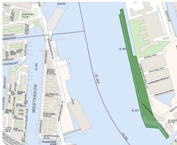
Overzichtskaat Ecologische structuur (Structuurvisie Amsterdam)

Voor eventuele wijzigingen in de Hoofdgroenstructuur is een adviesaanvraag bij de Technisch Advies Commissie (TAC) Hoofdgroenstructuur noodzakelijk.