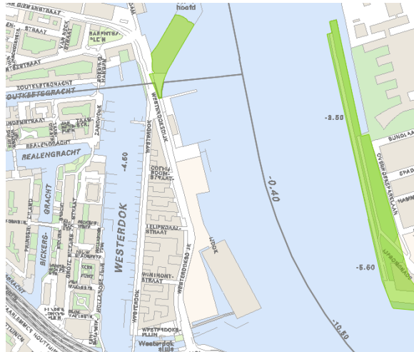
Overzichtskaat Hoofdgroenstructuur (Structuurvisie Amsterdam)

Het ligt niet in de Ecologische Structuur (ES). Zie de onderstaande afbeeldingen voor de exacte locaties van de HGS en de ES.