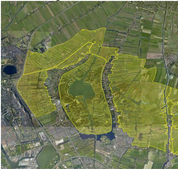
Dichtstbijzijnde Natura2000 gebied

Het onderzoeksgebied bevindt zich buiten de Speciale Beschermingszones. Het Ilperveld, Varkensland en Oostzanerveld is het dichtstbijzijnde gebied met de status van Natura2000 en bevindt zich op ongeveer acht kilometer afstand. Zie het onderstaande kaartje voor de locatie van dit Natura2000 gebied.