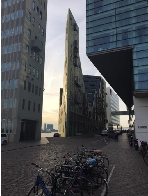
IJdok is stenig van karakter

Het plangebied is stenig van karakter waardoor de natuurwaarden laag zijn. Zie hiervoor de onderstaande afbeelding.