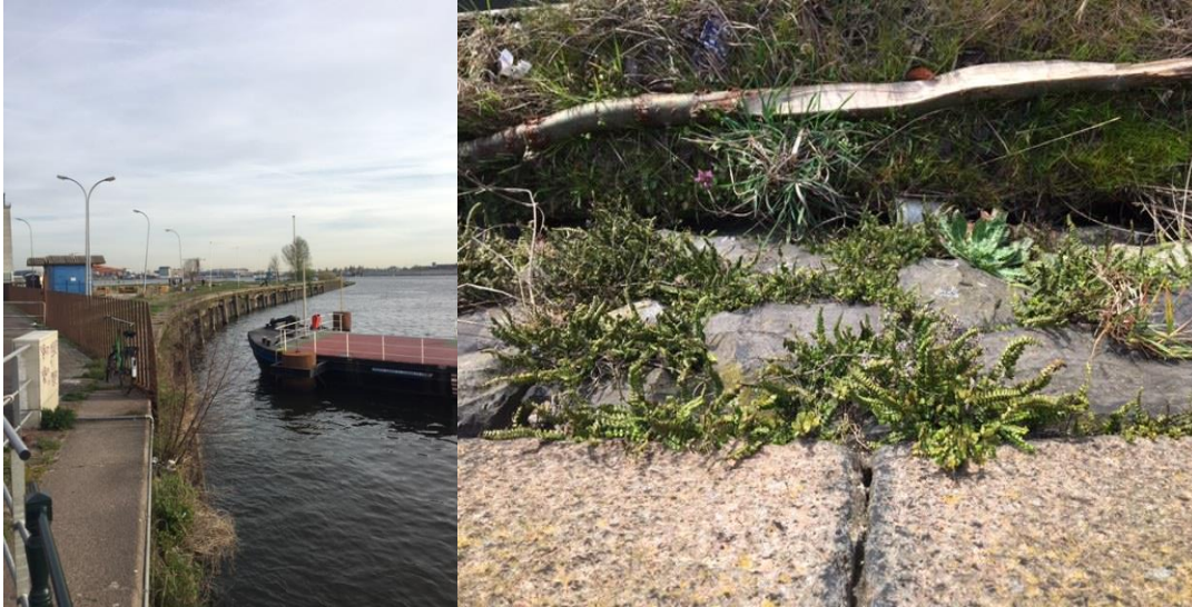
Op de kademuur van het Stenen hoofd groeien bijzondere plantensoorten (steenbreekvaren op bovenstaande foto)

Hoewel muurplanten niet meer zijn beschermd onder de Wnb, acht de gemeente Amsterdam haar verticale natuurreserveaat als zeer waardevol. De groeilocatie van de schubvaren, steenbreekvaren (zie hiervoor de onderstaande afbeelding) en de blaasvaren op het Stenen hoofd dient daarom in takt te blijven.