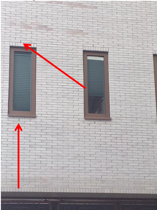
Geschikte verblijfplaats voor vleermuizen in bebouwing

Een deel van de bebouwing is geschikt als verblijfplaats voor vleermuizen. Zie de onderstaande afbeelding (als voorbeeld).