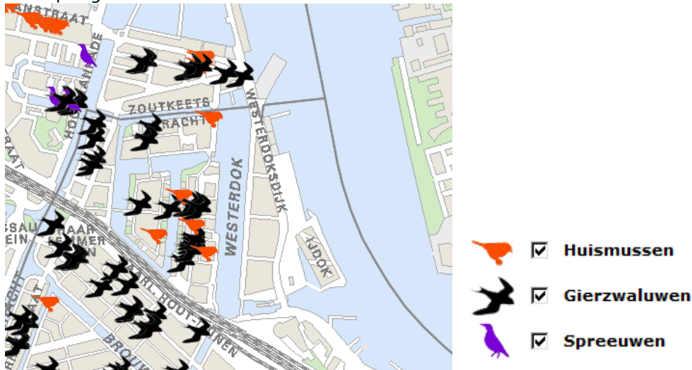
Gierzwaluw en huismussenonderzoek 2016

Uit doelgericht onderzoek naar gierzwaluwen en huismussen in 2016 bleek niet dat deze soorten in het plangebied voorkwamen: