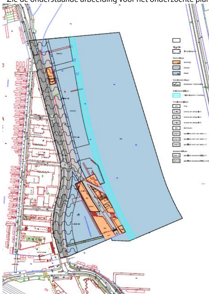
Het plangebied bevindt zich binnen de zwarte stippellijn

Het plangebied ligt in stadsdeel Centrum in de gemeente Amsterdam. Zie de onderstaande afbeelding voor het onderzochte plangebied.