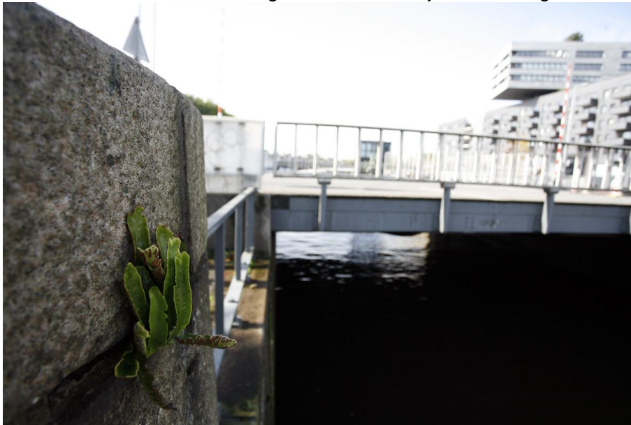
Tongvaren zoals aangetroffen in de bocht van de De Ruijterkade en de Westerdoksdijk

Zie de onderstaande afbeeldingen voor het uiterlijk van de tongvaren.