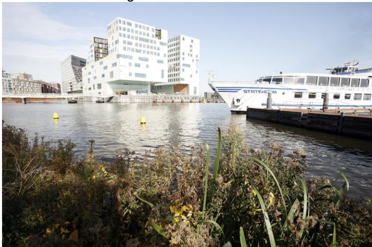
Nestplek voor watervogels

Verder zijn er geen andere beschermde Flora- of faunasoorten waargenomen in het plangebied. In bocht bij de Westerdoksluis staat echter wel een rietkraag. De rietkraag is een geschikte broedplaats voor watervogels zoals wilde eenden en meerkoeten. In de rietkraag zijn tijdens het veldbezoek echter geen nesten aangetroffen. Zie de onderstaande afbeelding voor de betreffende rietkraag.