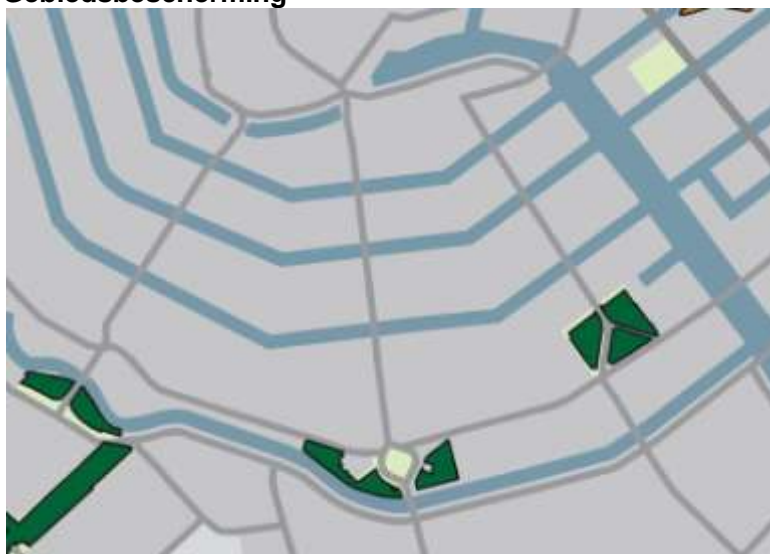
Hoofdgroenstructuur Structuurvisie 2011

Het plan bevindt zich buiten de Speciale Beschermingszones. Het IJmeer is het dichtstbijzijnde gebied met deze status. Externe werking van het plan op dit Vogelrichtlijngebied is niet aannemelijk. Er liggen ook geen gebieden van de EHS in de omgeving van het plangebied.