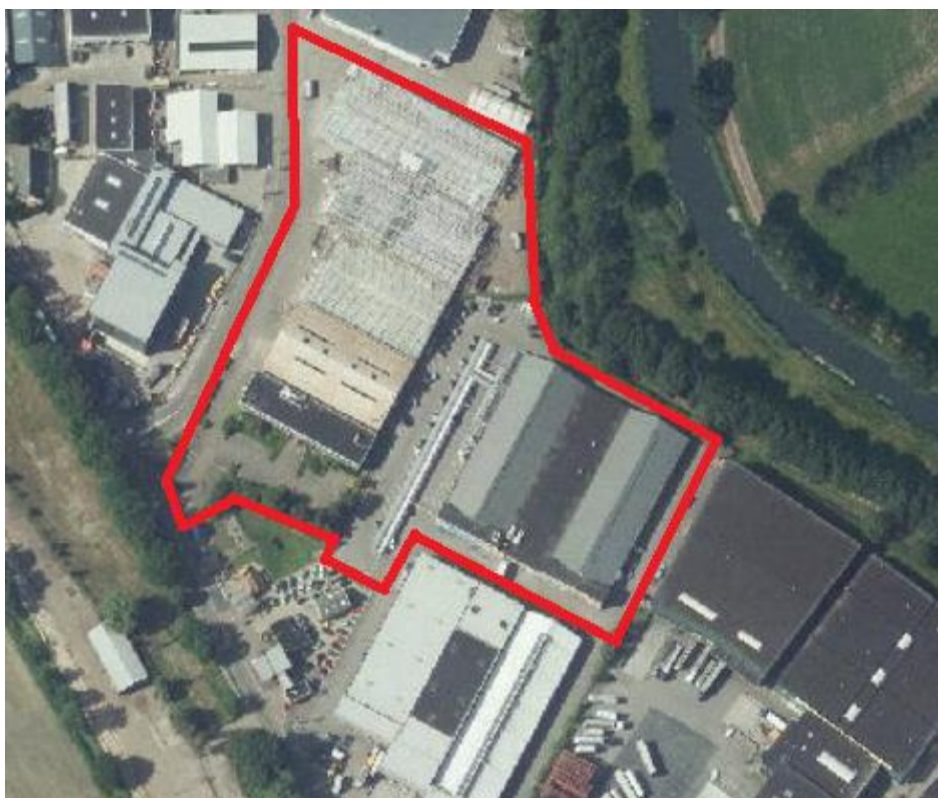
Luchtfoto plangebied met voormalige bebouwing