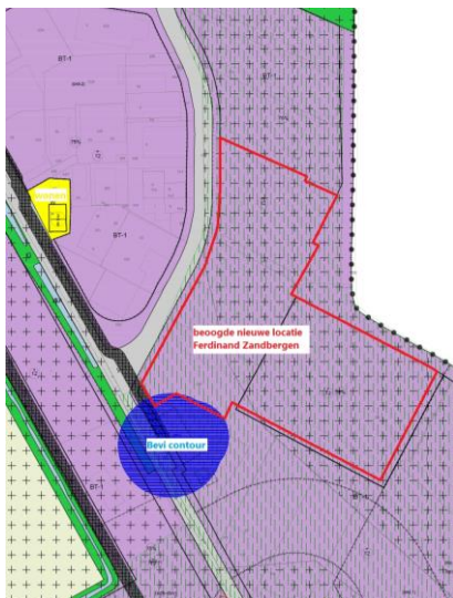
Afbeelding 1 Locatie nieuwbouw Ferdinand Zandbergen BV

Ferdinand Zandbergen B.V. is een bedrijf dat vlees ver- en bewerkt en tevens opslaat en heeft op dit moment een locatie aan De Nort 21 in Woudenberg. Het voornemen is om op de locatie, zoals beschreven in afbeelding 1.1, nieuwbouw te plegen voor uitbreiding van de activiteiten. Op de nieuwe locatie worden dezelfde werkzaamheden verricht als op de bestaande locatie.