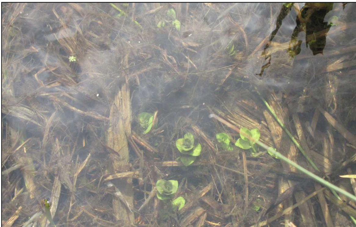
Helder water in poelen en sommige sloten kan geschikt zijn voor Heikikker, Platte schijfhoren en als jachtgebied van de Waterspitsmuis.

In de figuur hiernaast is (globaal) aangegeven welke natte delen potentie hebben voor beschermde soorten, het gaat hierbij om Heikikker, Rugstreeppad, Waterspitsmuis, Noorse woelmuis en Platte schijfhoorn.