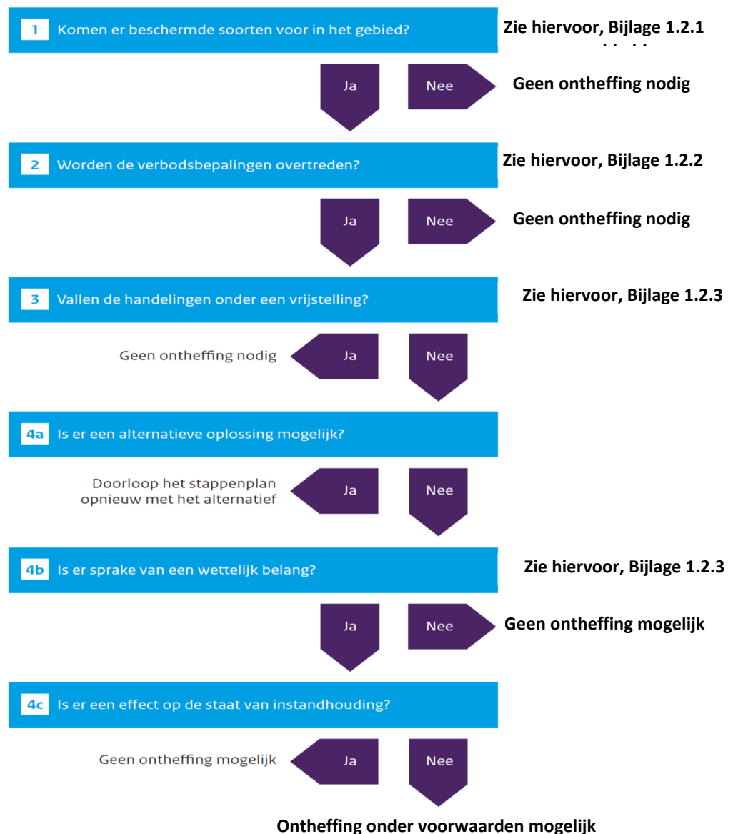
Figuur 4. Stappenplan procedure ecologisch onderzoek en ontheffing

van de Provincie Noord-Holland. Per plangebied zal op maat moeten worden nagegaan of dergelijke bepalingen aan de orde zijn.