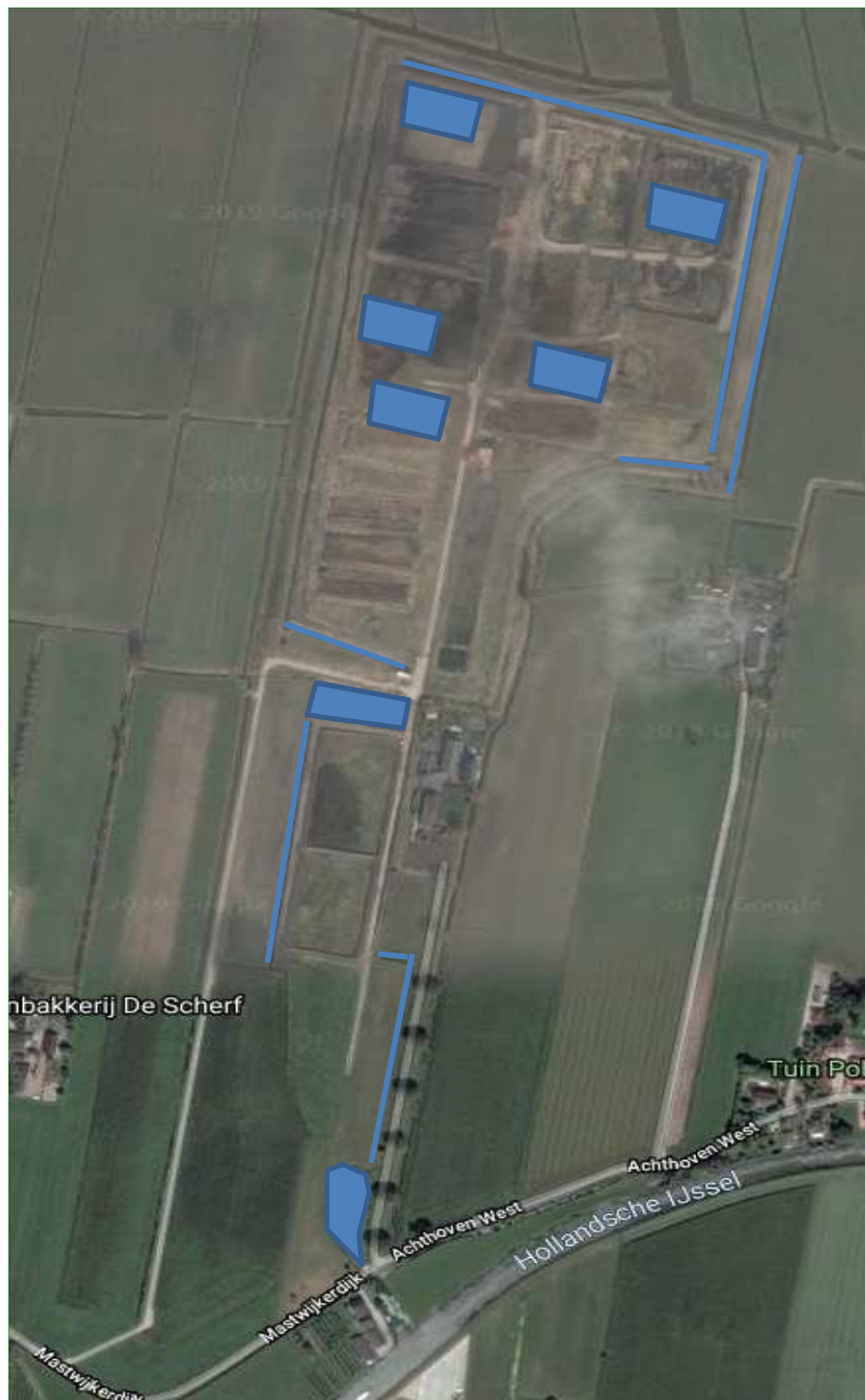
Figuur 2. Natte of vochtige terreindelen met potentie voor beschermde soorten.

De bosschages zijn tevens het meest interessant voor broedvogels en in holtes kunnen vogels broeden en mogelijk vleermuizen (tijdelijk)