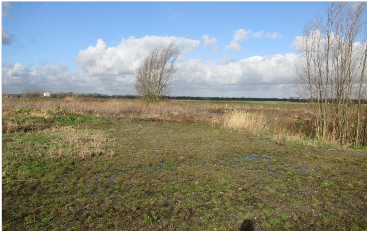
Vochtige vegetatie met her en der Schietwilgen.

Wat betreft bebouwing is in het plangebied een afgesloten container aanwezig en een afgesloten werkschuur met plat dak.