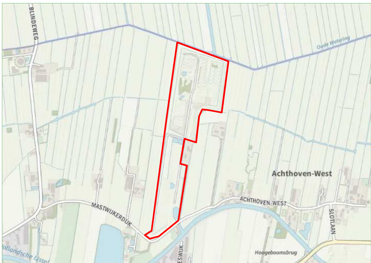
Figuur 1. Ligging van de afvalzorg locatie Mastwijk.

Deze quickscan is een momentopname en kan slechts in beperkte mate uitsluitel geven over de afwezigheid van soorten. Dit onderzoek betreft geen volledige veldinventarisatie. Mochten er door de plannen effecten te verwachten zijn op beschermde soorten die mogelijk aanwezig zijn, dan wordt een nader onderzoek geadviseerd.