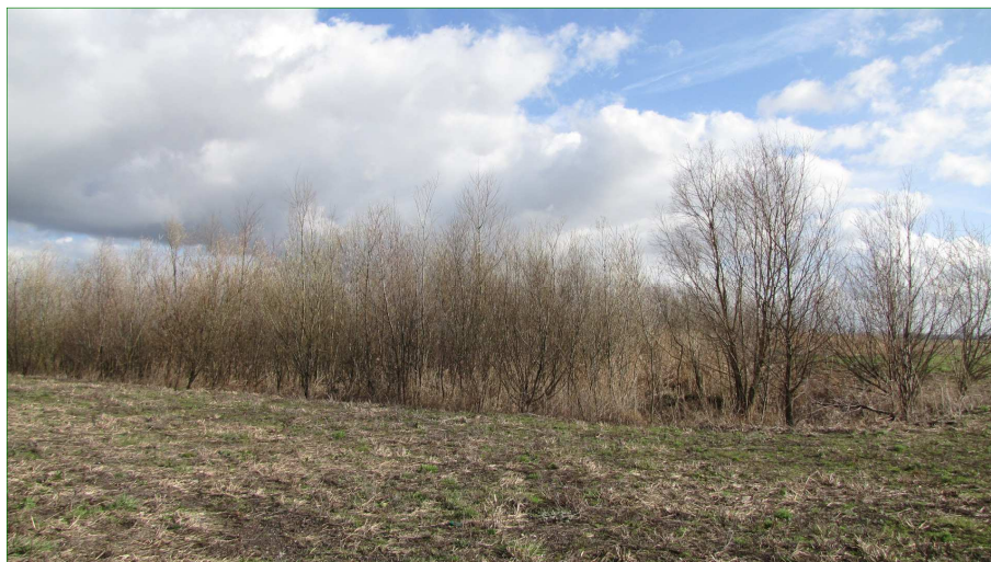
Nat wilgenbos met riet.

In de noordwest hoek is tevens een zilte soort waargenomen, namelijk Zulte. Andere vakken zijn begroeid met Riet en ruigtekruiden als Grote brandnetel en Harig wilgenroosje. In weer andere vakken is de successie verder ontwikkeld en zijn opgeslagen Schietwilgen aanwezig. In het noordwesten is tegen een wilgenbosje een grote pol Pluimzegge waargenomen.