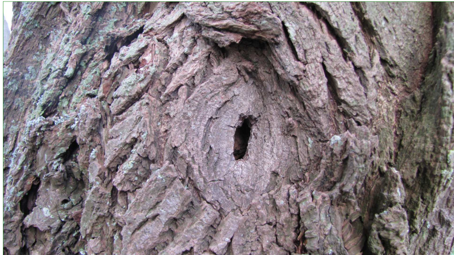
Holte in één van de wilgen binnen het plangebied.