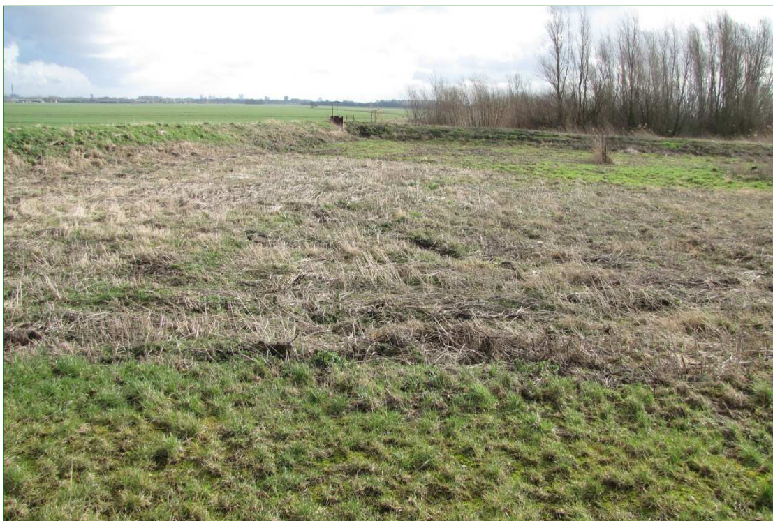
Ruig vochtig grasland en moerasbos op de ontwikkellocatie.

Ten slotte bevat hoofdstuk 6 de conclusies. Indien van toepassing worden aanbevelingen gedaan. Hoofdstuk 7 geeft een overzicht van de gebruikte en aanbevolen literatuur. In de bijlage is aanvullende informatie opgenomen over de geldende wetgeving en de gebruikelijke procedures bij een vergunnings- en/of ontheffingsaanvraag.