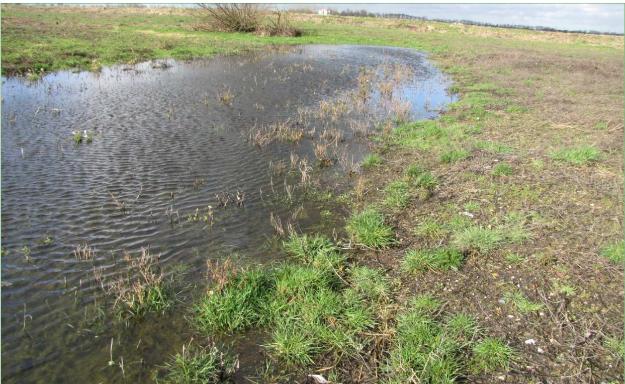
Natte noordwesthoek van het terrein.

Door het terrein loopt een betonnen pad. Aan beide zijden van het pad zijn afgescheiden 'vakken' aanwezig. Het pad ligt relatief hoger dan de vakken. Langs het pad groeien kruiden als Schijnkamille, Klein hoefblad en veel Smalle weegbree en klavers. De buitenranden van het terrein liggen ook verhoogd, het betreft een soort dijken met ruigere vegetatie. Sommige vakken zijn begroeid met open kort grasland met vochtindicerende soorten als Fioringgras en Blaartrekkende boterbloem. Ook zijn soorten als Oeverzegge en Zeegroene rus aanwezig.