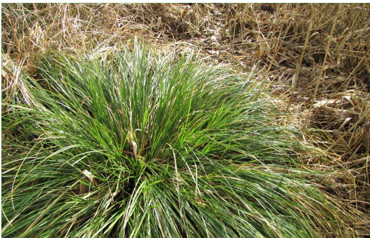
Pluimzegge is waargenomen.

Omdat geen sprake is van geïsoleerde, zuurstofloze en verlandende wateren in combinatie met een dikke sliblaag in het plangebied en vanwege het volledig ontbreken van waarnemingen in de omgeving, wordt het voorkomen van Grote modderkruiper uitgesloten.