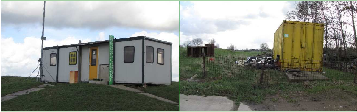
De aanwezige werkschuur en container binnen het plangebied.

De plas in het zuiden heeft een oostoever met een rietkraag en de westoever heeft veel trapgaten, begroeid met soorten als Watermunt, Gele lis en Gewone engelwortel. De meeste aangrenzende bredere wateren hebben een flauwe oever waarbij en in de oevers veel Grote lisdodde is waargenomen. Daarnaast zijn enkele smallere, ondiepe watergangen aanwezig, met veel Liesgras, Riet en draadalgen.