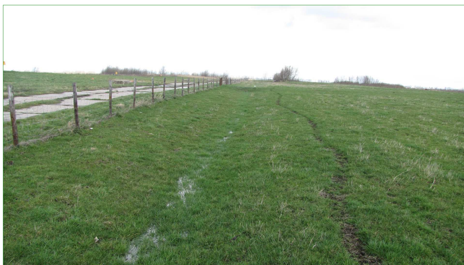
Afgerasterd deel van het gebied.

Op het terrein is water aanwezig, naast de tijdelijke, oppervlakkige plassen in de vakken, zijn twee 'grotere' wateren aanwezig, één in het midden van het plangebied en één in het zuiden. De plas in het midden van het gebied heeft veel Grote lisdodde en Riet in de oever.