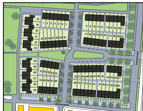
Globale ligging en begrenzing plangebied (links) en nieuw bouwplan (rechts)