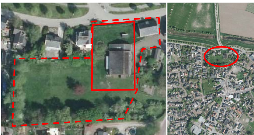
Afbeelding 1 en 2: Situering onderzocht gebied.

Het plangebied is gelegen binnen de bebouwde kom van Brakel en betreft enkele opstallen en een weide.