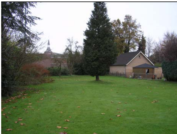
Figuur 3.4 Een tuin met enkele struiken en grote bomen is een geschikte locatie voor grondgebonden zoogdieren en kleine broedvogels