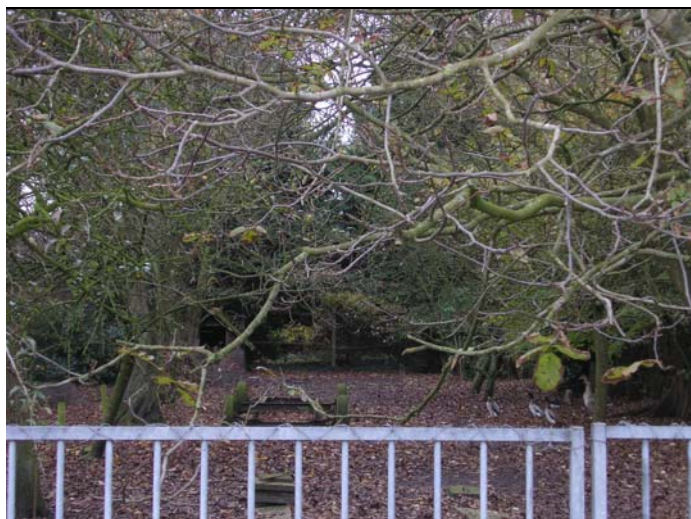
Figuur 3.2 Het afgezette terrein in het centrum van het plangebied kenmerkt zich door vrij dichte struikbegroeiing en de aanwezigheid van enkele eenden en ganzen