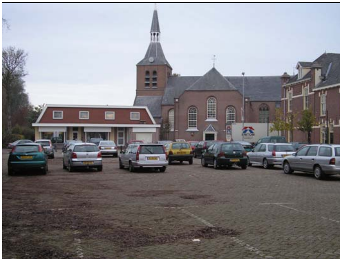
Figuur 3.1 Parkeerplaats in het plangebied. De kerk valt buiten het te beschouwen gebied, deze ligt namelijk aan de overkant van de Zuiderzeestraatweg

Het plangebied is gelegen in de kern van de gemeente Oldebroek. De gemeente Oldebroek ligt ten noorden van de Veluwe, tussen het zandgebied en de randmeren rond Flevoland. Het plangebied wordt omsloten door vier wegen: de Zuiderzeestraatweg, de Spronksweg, de Van Sytzamalaan en de Van Asseltsweg. Omdat het plangebied midden in de bebouwde kom ligt, nabij het winkelgedeelte van Oldebroek, is een groot deel van het plangebied bebouwd met huizen. Het grootste deel van deze woningen is voorzien van een tuin. Tevens is in het plangebied een brandweerkazerne gevestigd en ligt er een parkeerterrein (zie figuur 3.1), dat vanaf de Zuiderzeestraatweg te bereiken is. Opmerkelijk is het onbebouwde gedeelte in het midden van het plangebied, de aanwezigheid van enkele grote bomen en een dichte struikbegroeiing. Een deel van het onbebouwde gedeelte is afgezet met een hek, waarbinnen enkele eenden en ganzen lopen (zie figuur 3.2). Tevens staat hier een karakteristieke bomenrij, die vanaf vrijwel alle omsluitende straten zichtbaar is (zie figuur 3.3).