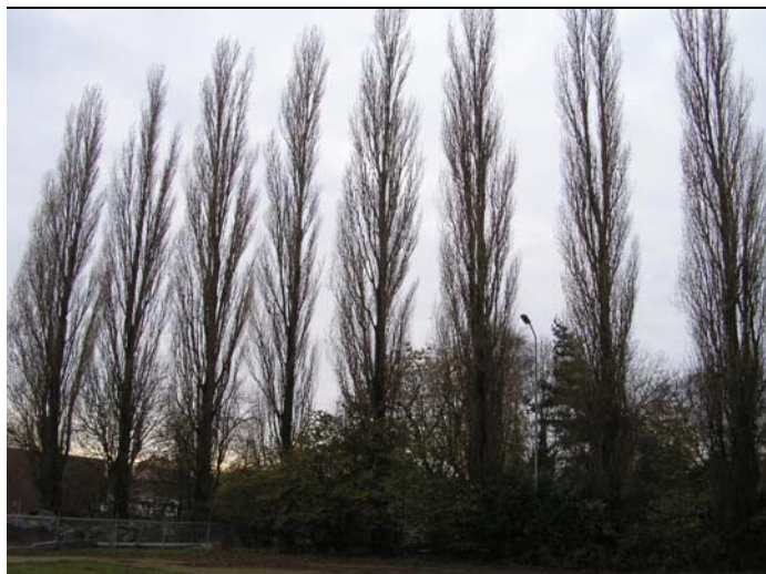
Figuur 3.3 Karaktersitieke bomenrij in het midden van het plangebied