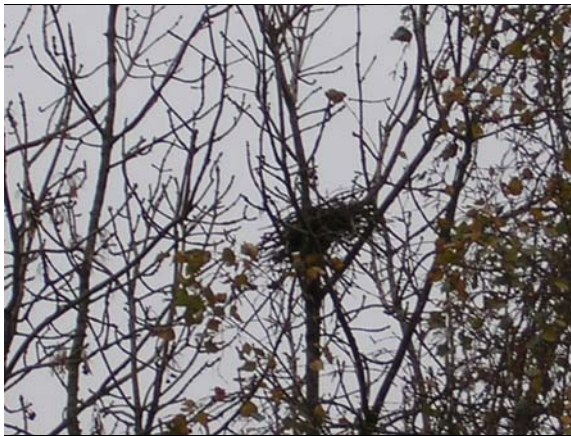
Figuur 3.5 Een nest in één van de bomen in het plangebied

Voor overige tabel 2- en 3-soorten (amfibieën, reptielen, vlinders, vissen en andere diergroepen) biedt het plangebied geen geschikte biotopen.