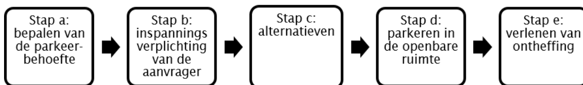
Figuur 1: Stroomschema bepalen van de parkeereis