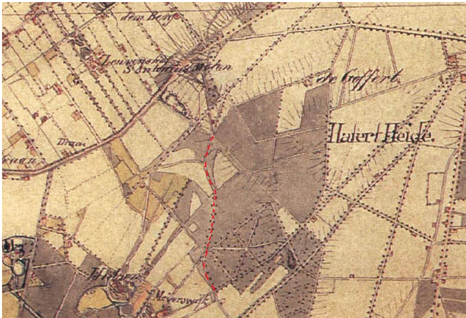
Topografische kaart uit 1850 met in rood de Weg door Jonkerbosch die de overgang markeert tussen de nog onontgonnen Hatertse Heide in het oosten en het oudere cultuurgebied in het westen.