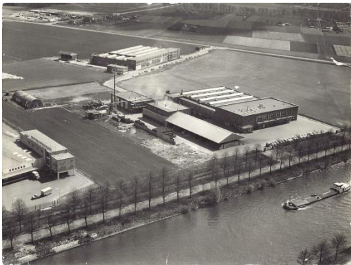
Electrodenfabriek Willem Smit (West) aan het Maas-Waalkanaal rond 1965

Ook na WOII, terwijl elders buiten de bestaande stad uitgestrekte wederopbouw wijken werden aangelegd, werden in het plangebied nauwelijks woningen gebouwd. Vanwege het streven naar een scheiding van functies in het Uitbreidingsplan moest het plangebied juist plaats bieden aan industriële bedrijven. Er kwam er in Nijmegen een enorme industrialisatiegolf op gang. De gemeente gaf goedkope gronden aan het Maas-Waalkanaal uit aan bedrijven en vanaf de vijftiger jaren vestigde het ene bedrijf na het andere zich in het gebied, waaronder Philips. Vanaf het einde van de vijftiger jaren werd tussen de spoorlijn Nijmegen- 's-Hertogenbosch en de Nieuwe Dukenburgseweg nog een industriegebied ingericht, Industrierrein Winkelsteeg, en zo ontstond een groot aaneengesloten bedrijventerrein. Tot de vroegste bedrijfsgebouwen behoren het huidige A-gebouw en M-gebouw van Philips (tegenwoordig) aan de Transistorweg en de Electrodenfabriek van Willem Smit aan de Nieuwe Dukenburgseweg/ Oostkanaaldijk.