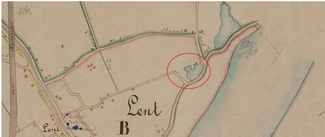
Kadastrale kaart Lent 1881-1887