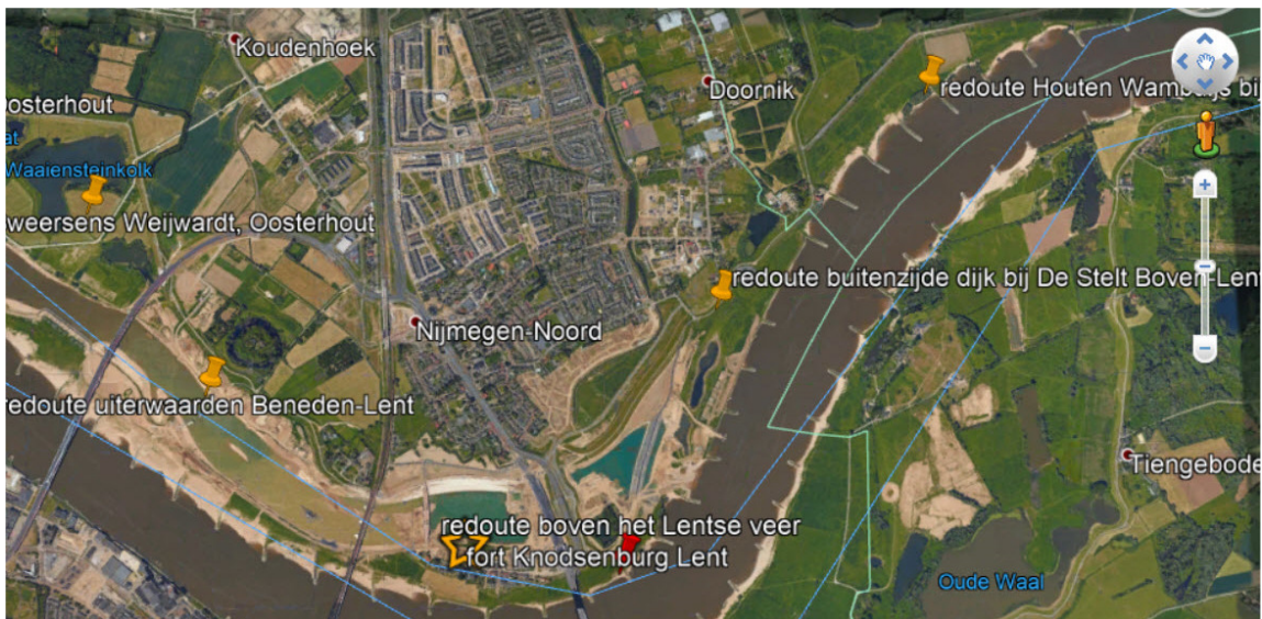
Overzichtskaart redoutes linie Prins Maurits Tachtigjarige Oorlog