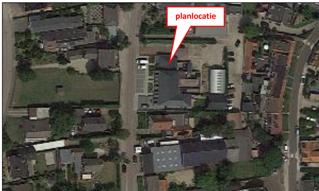
Figuur 1: Luchtfoto met aanduiding planlocatie

Figuur 1 (luchtfoto) geeft de ligging van de te onderzoeken planlocatie weer.