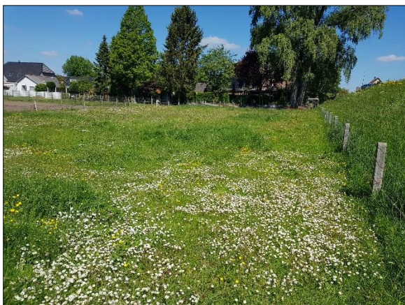
Figuur 8. Oostelijk deel plangebied