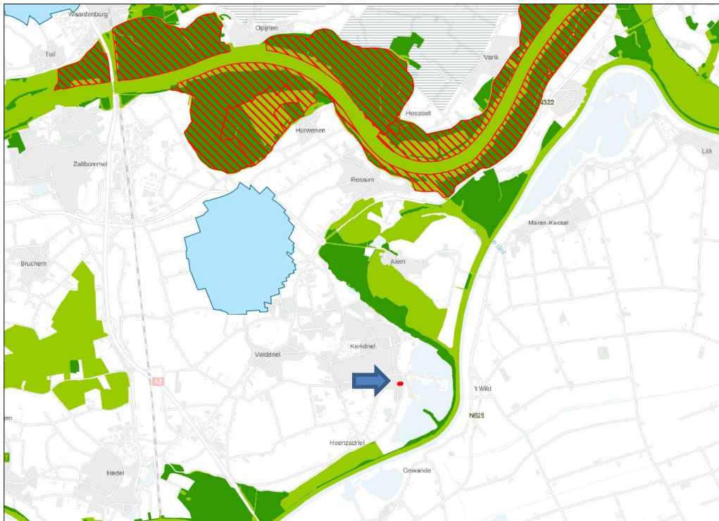
Figuur 10. Ligging GNN (groen) en Natura 2000-gebieden (rood gearceerd) ten opzichte van perceel plangebied (rood omlijnd)