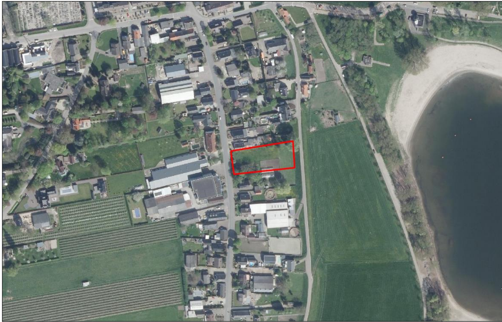
Figuur 2. Luchtfoto van het plangebied en de directe omgeving