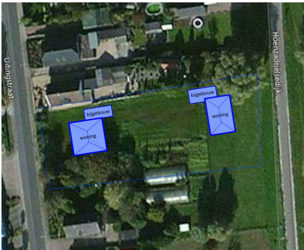
Figuur 3. Concept toekomstige situatie plangebied