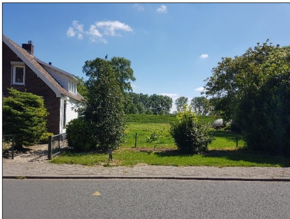
Figuur 6. Noordwestelijke hoek plangebied