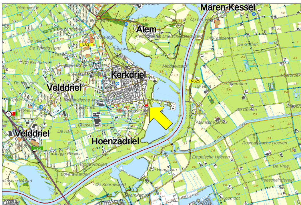
Figuur 1. Topografische kaart ligging van het plangebied (1:25.000)

Het plangebied is gelegen ten zuidoosten van Kerkdriel tussen de Uitingstraat en de Hoenzadrielsedijk. In figuur 1 is de topografische ligging van het plangebied weergegeven.