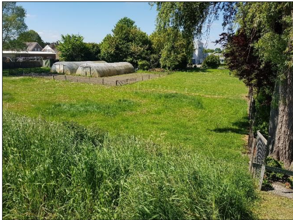
Figuur 4. Plangebied vanaf dijk, vanuit oosten