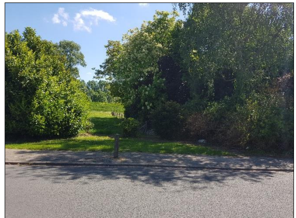
Figuur 7. Zuidwestelijke hoek plangebied met struiken