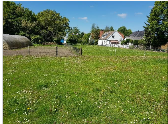
Figuur 5. Plangebied vanuit zuidoosten