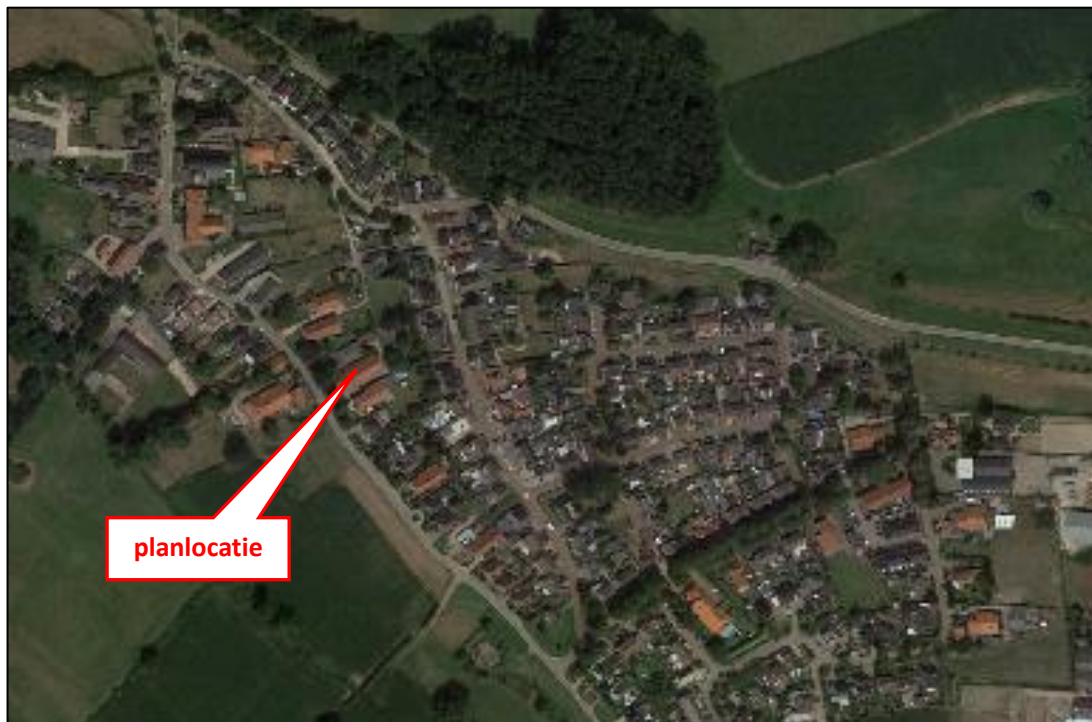
Figuur 1: Luchtfoto met aanduiding planlocatie

Figuur 1 (luchtfoto) geeft de ligging van de te onderzoeken planlocatie weer.